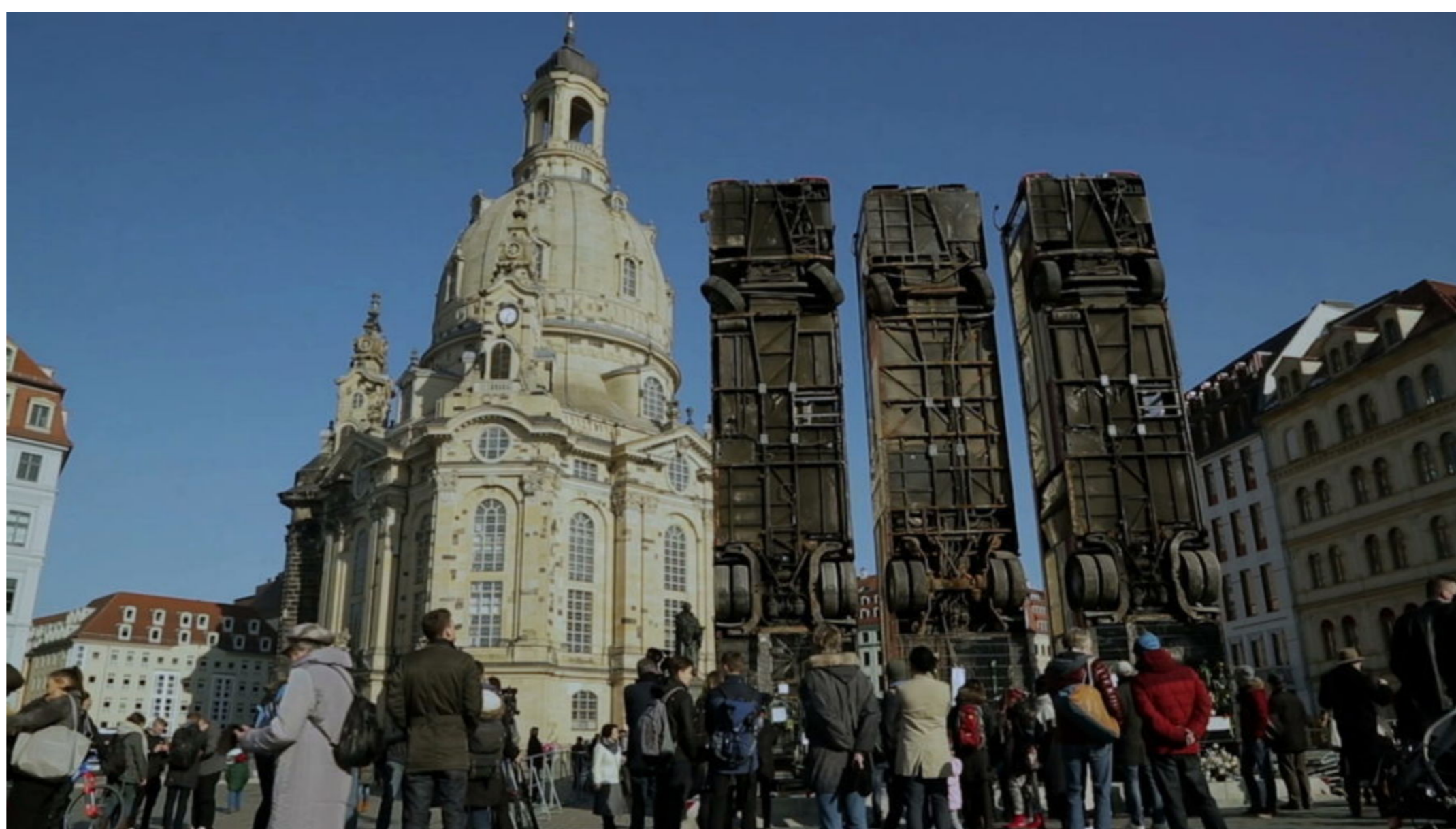
Filmen «Where to with History» (2020) handler om hvordan arkitektonisk rekonstruksjon i Dresden har banet vei for høyreekstremisme.