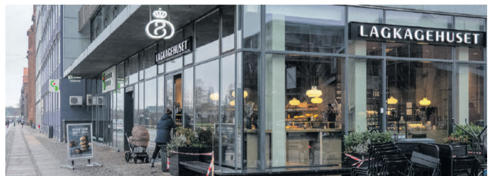
Lagkagehuset har ekspanderet kraftigt – og så koster coronaen.

Masser af nye stærkt nedsatte styles på www.sportswearshop.dk outletten