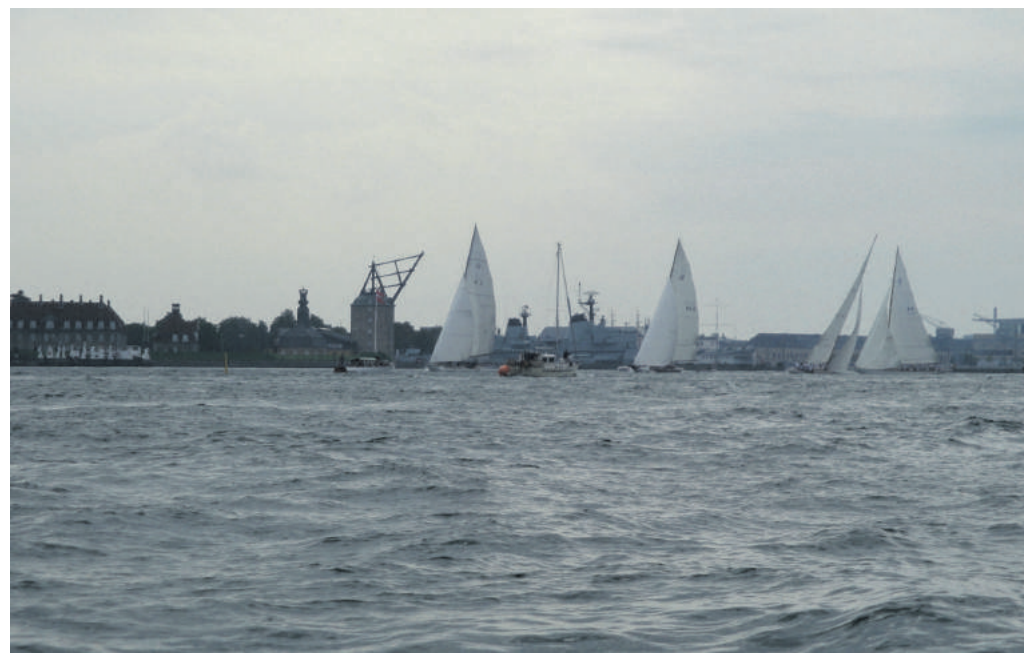
Spildevand lukket ud i Øresund kan glide ind i Københavns havn og ødelægge vandkvaliteten.

Så der er 0 kommunale løsninger. Eneste mulighed er, at Folketinget handler. Kommunalpolitikere har udtømt mulighederne. Og folketinget handler næppe. Derfor bliver der nu bygget på ca. 5% af Amager Fælled.