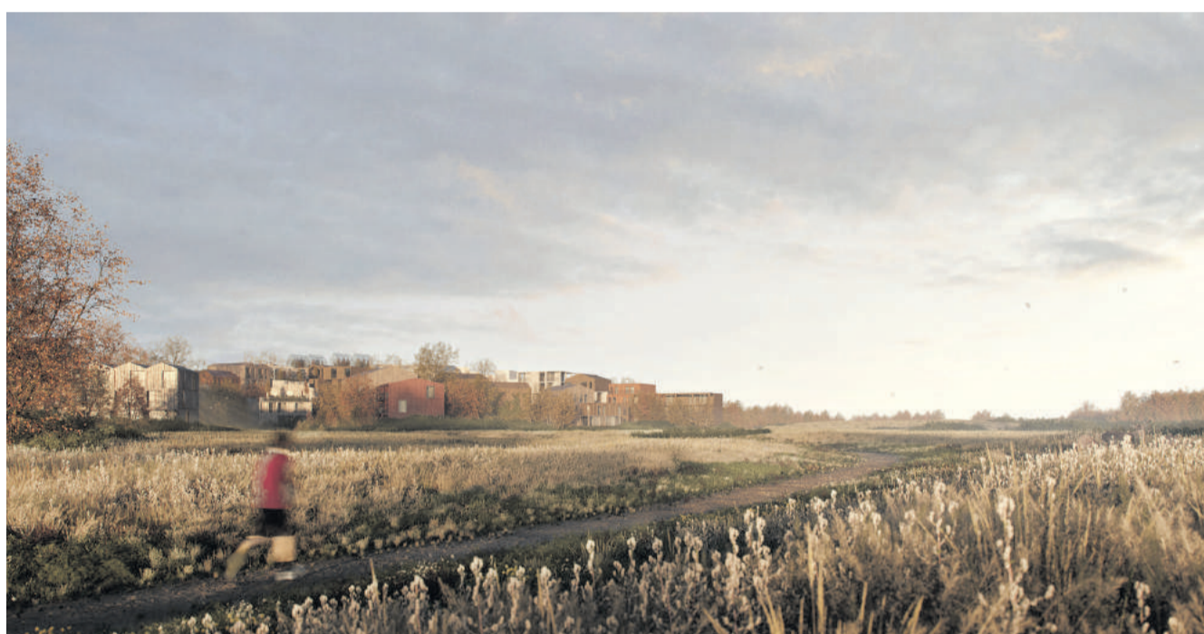
Lokalplanen er vedtaget. Men Amager Fælled Venner står klar med en klagesag. Illustration By & Havn.

Som det har været tilfældet med resten af byggeriet af Ørestaden i øvrigt, så var politikerne så absolut ikke enige, men et stort flertal på 38 ud af 55 medlemmer – fra SF til DF – endte med at vedtage projektet – noget de også aftalte tilbage i 2017.