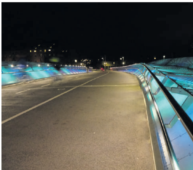
Lille Langebro har fået ny alternativ belysning.

I år løber festivalens var-tegn, Green Beam, endnu engang gennem byen. Når du ser den grønne laserstråle over himlen, ved du, at værkerne står tændt – værker som 10 store fugle over