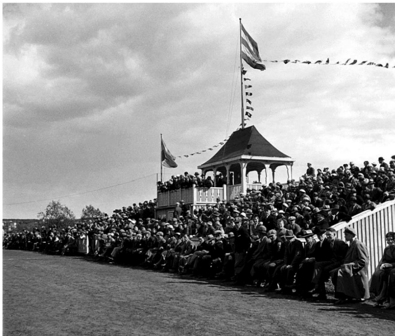
MATCH mot BE QUICK – över 6 000 åskådare

Det tävlades i totalt 14 olika friidrottsgrenar under invigningen och IFK Gävle segrade i tidningen Västernorrlands Allehandas vandringspris.