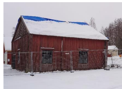
8 mars 2020

Jag hoppas kunna ta inomhusbilder så snart hela renoveringen är klar!