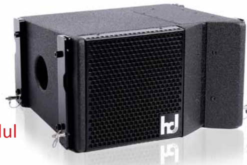
hd No3 Compact LineArray Modul

Durch kompakte Abmessungen, fügt sich das No3 Array in jedes Bühnenbild nahtlos ein. Deshalb sind hd No3-Arrays für Anwendungen von kleinen bis mittleren Beschallungsaufgaben jedes Genres als Main-PA, Front- und Nearfill bei Großveranstaltungen, Festinstallationen und Messe-/Industrieanwendungen die erste Wahl.