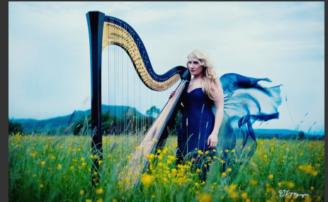
Harfe & Gesang - irisch