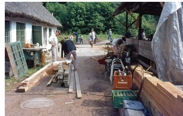
Arbejdsdag på Hammermøllen. Foto: Svend Engelbrechtsen, 1981

Der blev fundet rester af malekarm og hammerværk, og således var det muligt at foretage en rekonstruktion.