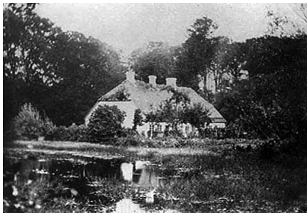
Hammermøllen.