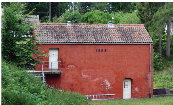
Turbinehuset. Foto: Peter Uldum, 2015

Proberhuset, opført i 1847, er verdens ældste hus specielt indrettet til afprøvning af geværløb.