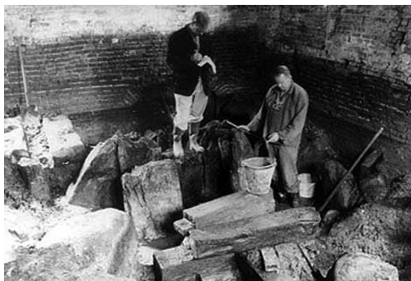
Udgravning i Hammermøllens smedje. Foto: Svend Engelbrechtsen, 1964

Bygningen forfaldt mere og mere og var i slutningen af 1950'erne knapt egnet til beboelse. Der var planer om at rive den ned. En kreds af lokalhistorisk interesserede personer foretog arkæologiske udgravninger udenfor og inde i bygningen.