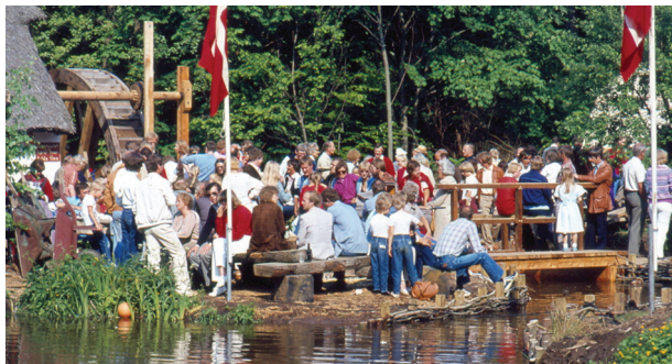
Pinsefest. Foto: Svend Engelbrechtsen, 1983

I dag er Hammermøllen åben for offentligheden for at formidle historien om Hellebæk og Ålsgårde og ikke mindst Kronborg Geværfabrik. Ud over en velbesøgt cafe er her også museum og arkiv.