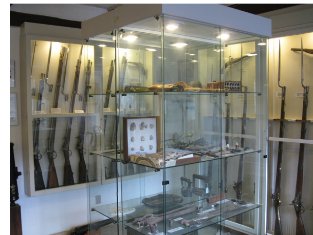
Hammermøllens museum. Foto : Peter Uldum, 2015

Efter mange års arbejde med frivillig og professionel arbejdskraft og med økonomisk støtte fra offentlige kasser og private fonde, kunne det færdige arbejde fejres med genindvielse af Hammermøllen i 1982.