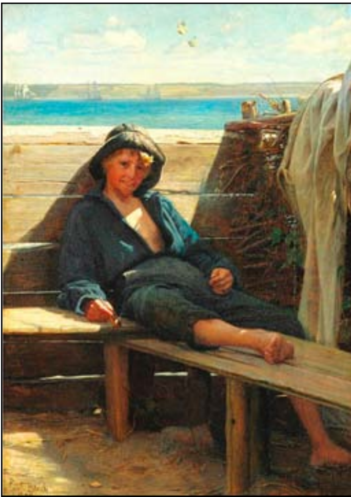
Carl Heinrich Bloch (1834-1890): En fiskerdreng, 1872.