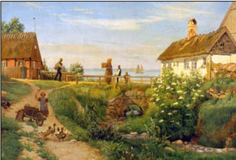
Frederik Christian Lund (1826-1901): Parti fra et fiskerleje. Ved Riffs Rende, 1867