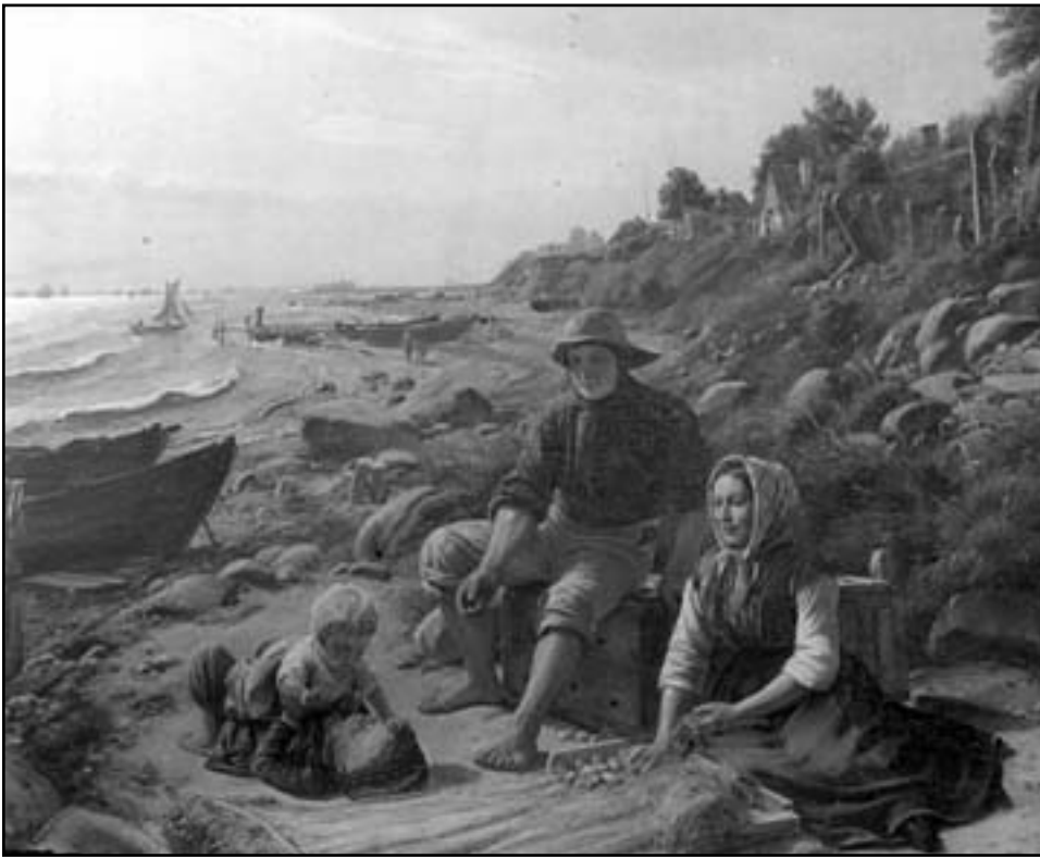
Jørgen Roed (1808-1888): Familieliv i et lille fiskerleje nord for Helsingør. 1855.