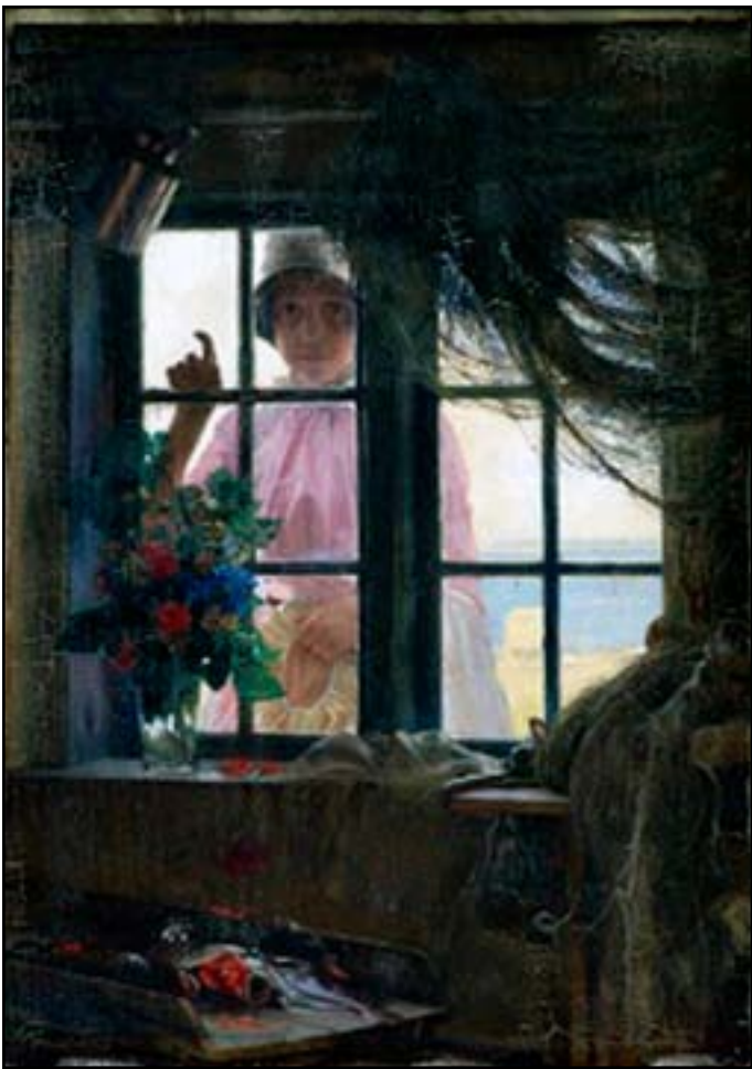
Carl Heinrich Bloch (1834-1890): I badetimen. En ung pige banker på vinduet i et fiskerhus, 1884