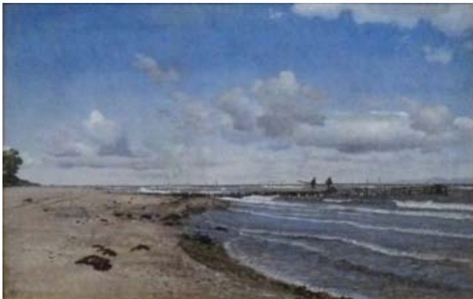
Peter Christian Thamsen Skovgaard (1817-1875): Stranden ved Hellebæk, frisk vejr, 1858

De nærmeste omgivelser ved Riffs huse, stranden, bådene, nedgangen langs renden, vestre- og østre landing var et yndet motiv for mange malere.