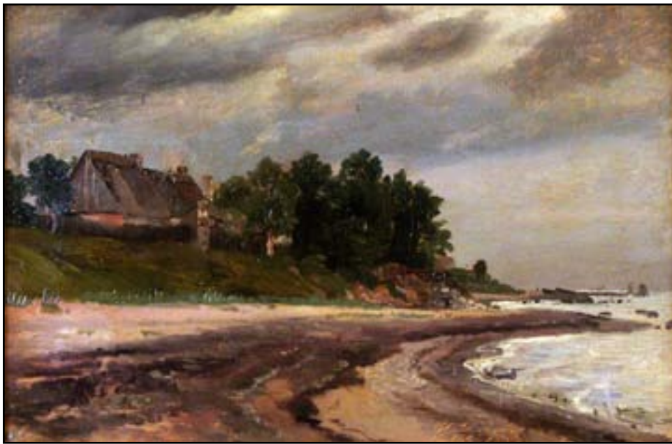
Jørgen Roed (1808-1888): Hellebæk, kysten ved Aalsgaard, 1853