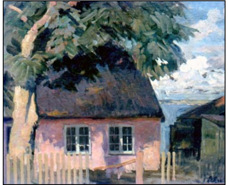
Georg Saligman: Et hus i Aalsgaard, udateret