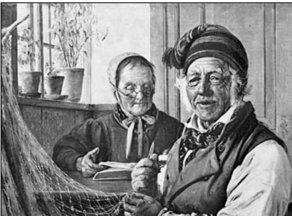
Jørgen Roed (1808-1888): Gammelt ægtepar i arbejdet (Riffs), 1854.