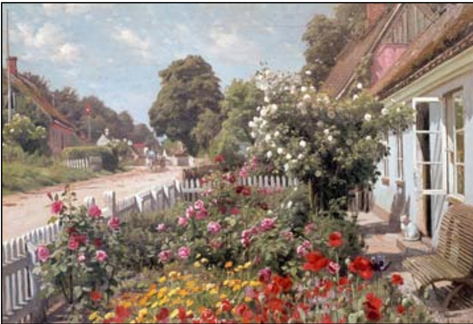
Peder Mørk Mønsted (1859-1941): En blomstrende have i Aalsgaard, udateret