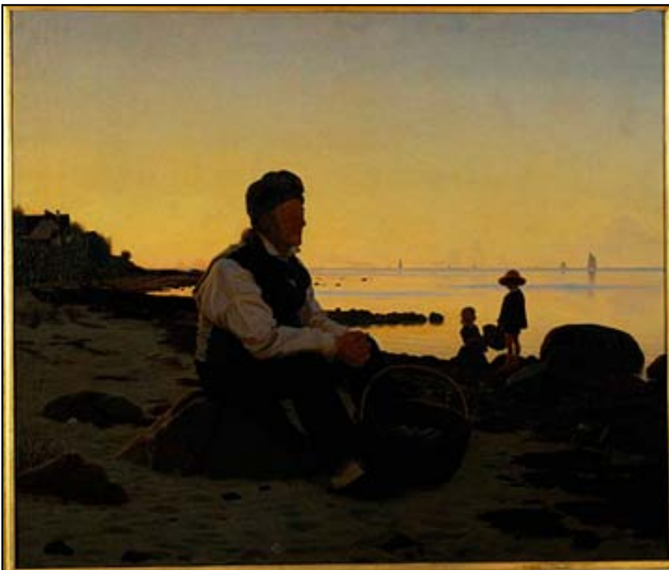
Johan Frederik Nicolai Vermehren (1823 - 1910): En gammel fisker der hviler sig på stranden efter at have samlet sten til garnet. 1858