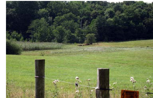
Hellebæk Kohave, set fra Pernille Låge

Landbrug og teglværker er andre elementer, der præger landskabet. De tidligere landbrugsarealer under Hellebæk Gods, som i dag kaldes Hellebæk Kohave, bliver plejet ved afgræsning, hvorved der skabes et overdrevslandskab med et rigt fugle- og insektliv.