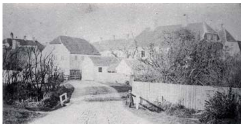
Stephan Hansens Boremølle

For at forsyne det stadigt voksende antal møller med vand, kom der i 1700'tallet flere og højere dæmninger til. Produktionen bestod udelukkende af våben, og fabrikken hed nu "Kronborg Geværfabrik". Møllerne havde hver deres funktion i våbenfremstillingen f.eks. hammermølle, slibemølle, boremølle.