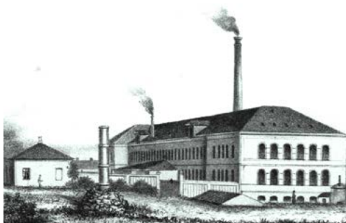
Hellebæk Tæppe- og Klædefabrik

Geværfabrikationen ophørte i 1870, hvorefter vandrettighederne blev købt af Hellebæk Tæppe- og Klædefabrik i 1873. Vandet til at drive en turbine blev i rørført frem til fabrikken.