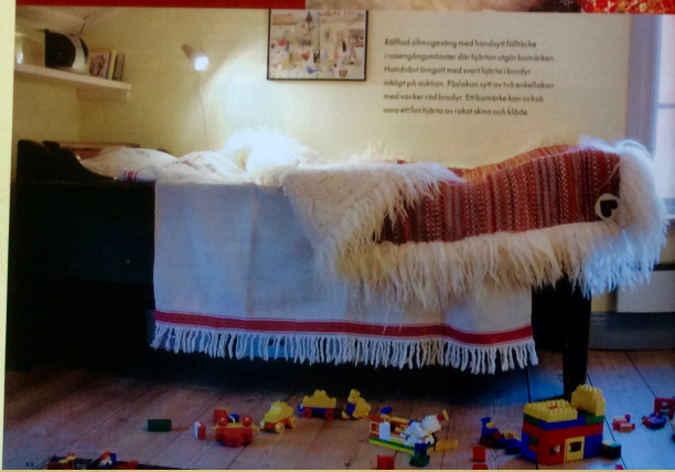
Kärlad ullsagging med handdytt fälltäck i sömningssmyster där hjörten utgör barmärket. Huvudet ringt med smyghänsa i linne och på sidan. Påskan sytt av två enkla med varken röd broderi. Ett barmärke kan också vara en färdig sytt av roset ska och klädd.