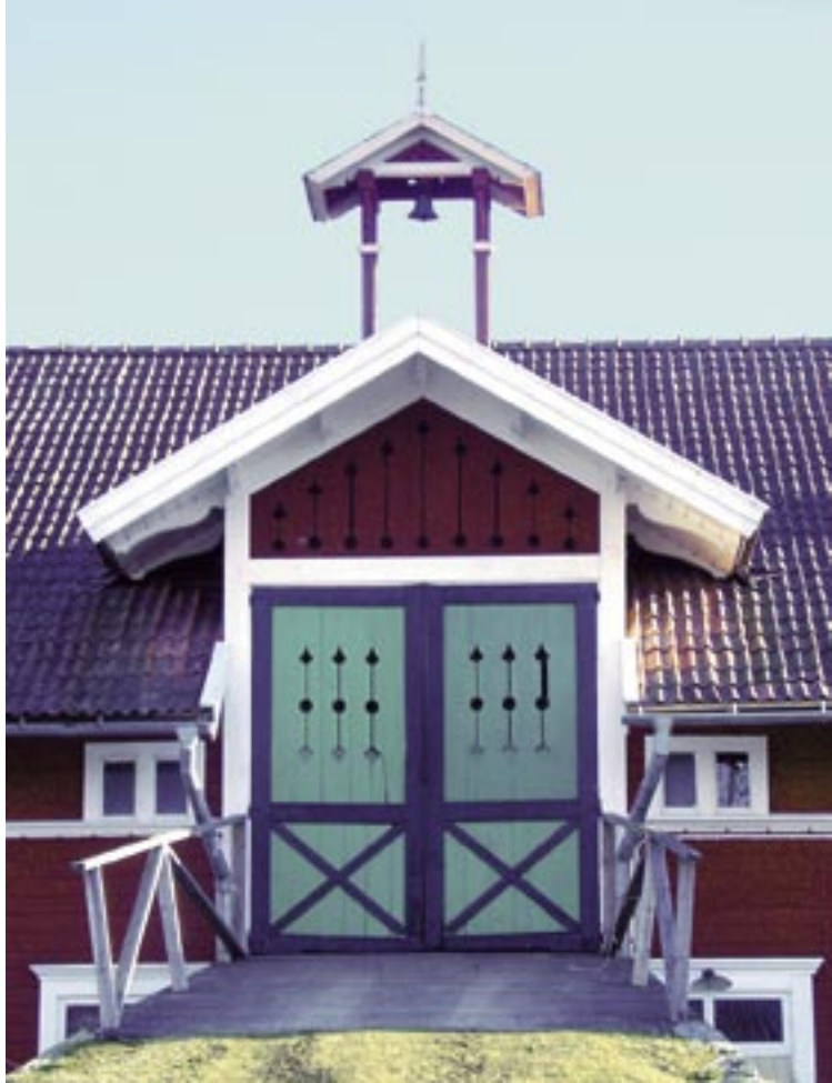
Detalj av större lantbruk med vällingklocka och snickarglädje. Ladugården är byggd i hästskoform, med tre längor och flera tillhörande byggnader.