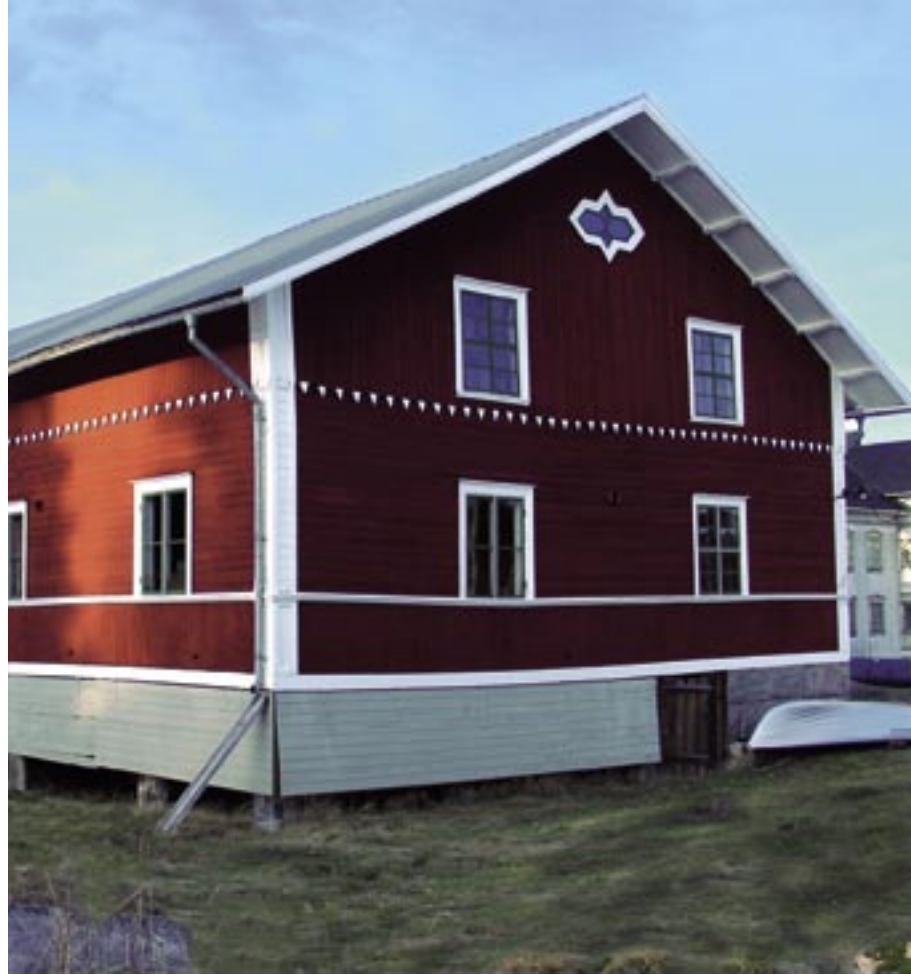
Utsirad, välskött och nyrestaurerad timrad ladugård med mycket fina snickeridetaljer från mitten av 1800-talet, den tid då Löfvenskjölds ritningar inspirerade många byggmästare.

rade villor. Man kunde välja och vraka mellan olika husformer, fönster, dörrar och en stor mängd snickeridetaljer.