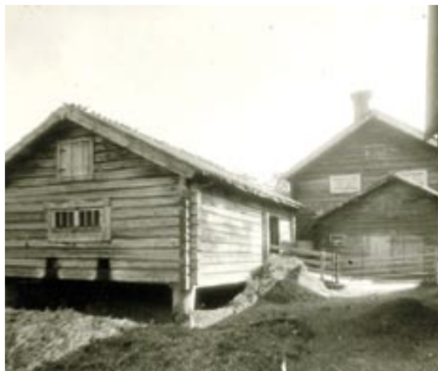
Fotografi från 1950-talet på en numera riven ladugårdsbyggnad i Rengsjö, Hälsingland. Timrade och omålade byggnader med tak av spån och väggar tätade med mossor eller lin var platsen för det tungrodda och dagliga arbetet med djuren.

tretti år. Skiftena och de allt bättre omständigheterna kring själva mjölkningen bidrog därefter till ett nybyggande. Huskropparna flyttades då ut från den från början ofta fyrbyggda gården och så småningom slog mönsterritningarna igenom stort. Från 1850 och en bra bit in på 1900-talet var de allenarådande. Framförallt var det Löfvenskjolds mönsterhandböcker som gjorde succé, de var som vår tids prefabricer-