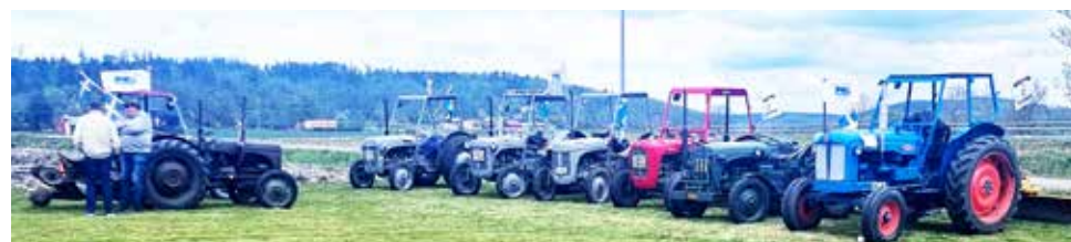
Grålleklubben var där tillsammans med några traktorkamrater.

Vi blev bara tre bilar som samlades vid Shellmacken i Fjärås för att köra gemensamt till Rolfsbron. Bilden visar vilken bredd vi har på fordonen i klubben. Jaguaren från 1998, Ford T från 1923 och en Porsche Carera från 1989