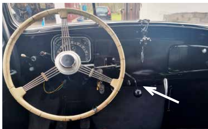
Stor ratt (muskelservo), som synes ganska magert med instrument. Växelspaken i instrumentbrädan, till höger om ratten

pekade ut vägen för många andra tillverkare. Men nog är det märkligt att så många, Renault till exempel, sedan B 11-produktionen upphört, lanserade allt fler modeller