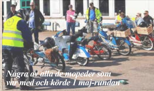
Några av alla de mopeder som var med och körde 1 maj-rundan

Vi var 53 fordon, 24 moppar och 29 bilar. Totalt var vi 93 st anmälda personer. Vi åt hamburgare och korv och avslutade med kladdkaka och visprädd. Vi hade även en tipstävling med 12 frågor med en utslagsfråga. Får återkomma vad vinnaren heter som fick ett presentkort på Maxi i Mellbystrand. Tror nog att det var uppskattat och nu ser vi fram emot Sill- och Potatisrundan som är nästa arrangemang från mopparna. Text Sven-Olof