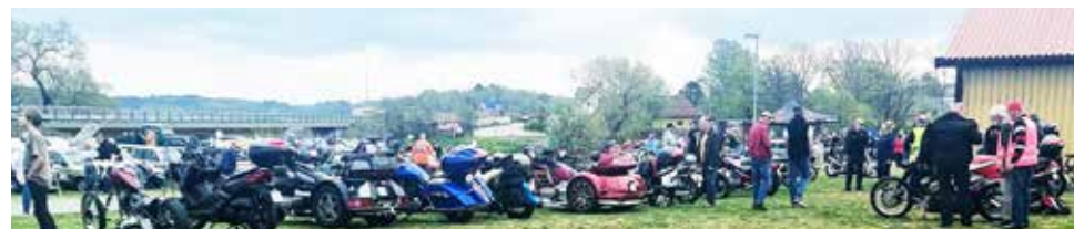
Motorcyklar av alla slag, både 2- och 3-hjuliga, både gamla och nyare