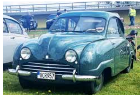
Saab 92 A från 1950. Saaben utan bagagelucka. Renoverad till nyskick