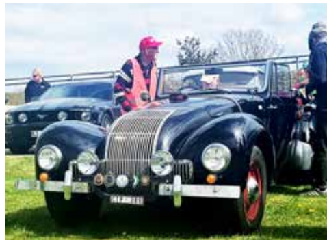
Allard 81 M från 1948. Enda exemplaret i Sverige. Jätteroligt att få se denna raritet.