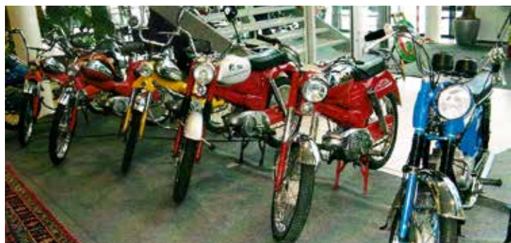
En avdelning med mopeder. Här av märket Puch. Stod i HP-Moppers monter.