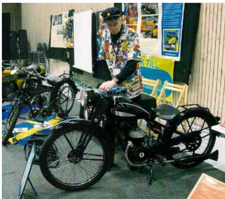
Roland och Husqvarnan från 1949 som varit i familjens ägo sedan 1989 då den också renoverades