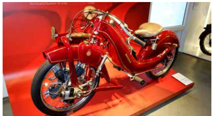
Megola Sport 1922-1925. En udda motorcykel med en väldigt ovanlig motorplacering. Inne i framhjulet sitter en 5-cylindrig 4-taktsmotor på 640 cc och växellåda. Undrar hur den är att köra.