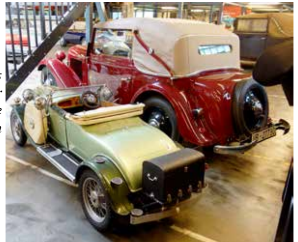
Här finns fina bilar för både stora och små.