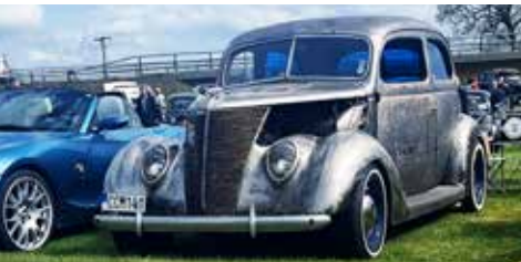
Ford Tudor V8 från 1937