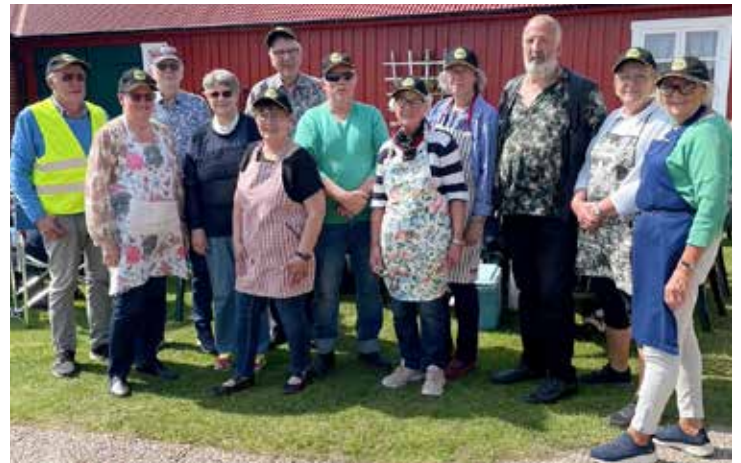
Den fantastiska serveringspersonalen