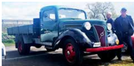
Volvo LV 103 D 1939