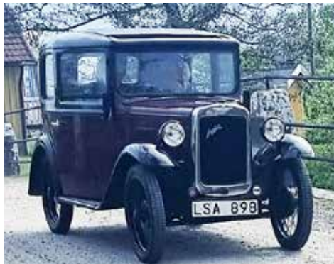
Till Best in Show valdes denna Austin Seven Saloon från 1932 försedd med en bensinmotor på hela 11 hk