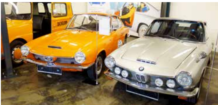
Inte tvillingar, men syskon. Se så lika de är, Glas 1700 GT (vänster) och en BMW 1600 GT (höger).