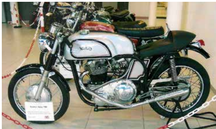
Norton Atlas 750. Nortons -50 och -60-tals roaddracingmaskiner har stått som förebild till denna mycket fina caféracersom fanns i MC-Veteranernas monter