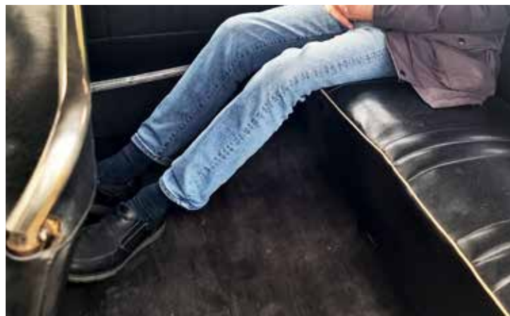
Mycket gott om benutrymme i baksätet!

Den individuella framhjulsupphängningen med torsionsstav var högst avancerad. Bakvagnen var enklare men hade ändå ett Panhard-stag. Hela konstruktionen resulterade i en bil som var betydligt lägre än sina samtida konkurrenter och, enligt de troende, mycket snyggare än de allra flesta av dem. Bertoni hade skapat en kaross, som visserligen hade lösa skärmar och strålkastare – långt ifrån pontonkarossen – men som ändå var ett under av modernitet och elegans. Och ändå! Ställ en Citroën B 11 vid ett funkishus från 1930 eller så, och säg vilket som är ”modernast”, bilen eller huset. Det är ingen tvekan om att la Traction gjorde succé och