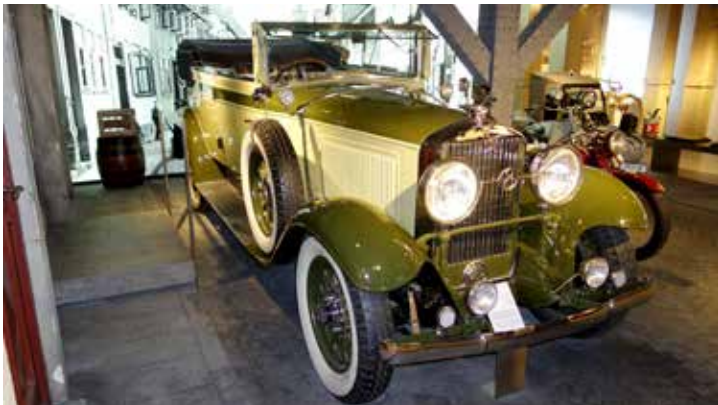
Horch Typ 350 1927-1928 med en rak 8-cylindrig motor på 4 liter. Pampigt värre!