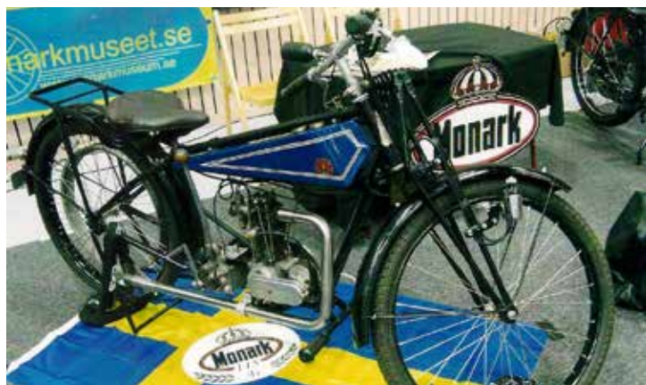
Monark 1927 är den äldsta egentillverkade motorcykeln från fabriken. Den är på 172 cc och den stod i Monarkmuseets monter.