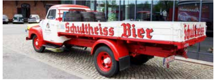
Öltransport fanns naturligtvis på plats. Muséet ligger ju i Tyskland.