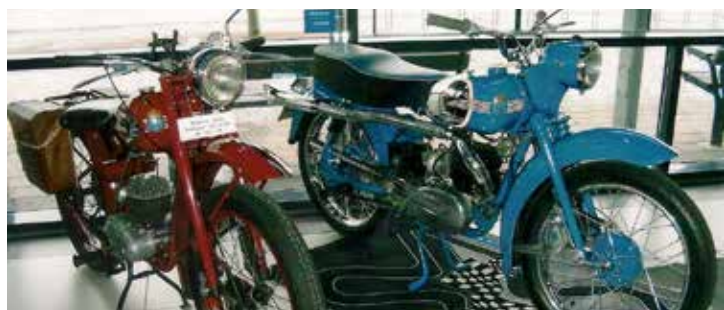
v. Husqvarna M28 118 cc från 1951 och en 281 Sport (dröm-bågen) från 1955 fanns i MC-Veteranernas monter