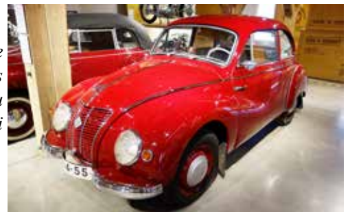
IFA F9 Limousine 1956. Byggdes både i Zwickau och Eisenach i Östtyskland.