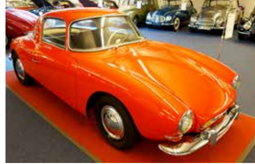
DKW Monza Serie 2 1957. En av många bilar på PS Speicher som jag aldrig har sett tidigare.