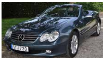
Mercedes-Benz SL 500 2002 2002, 306 hk. UNIK bil. Låga mil. 295 000 kr