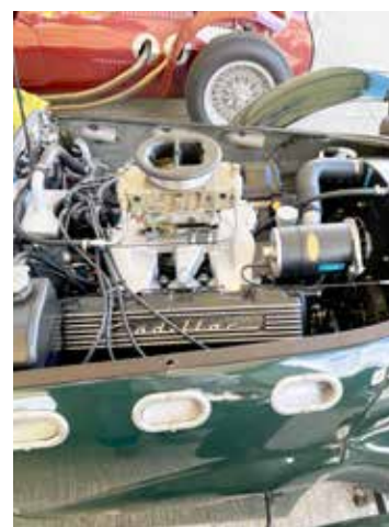
Motorrummet på en Allard, engelsk sportbil med amerikansk maskin, Cadillac 331

Framme vid banan var det bara att ställa sig vid staketet och njuta av tolvcyndriga Ferraris på fullvarv, Ford GT40 och McLaren can am bilar,