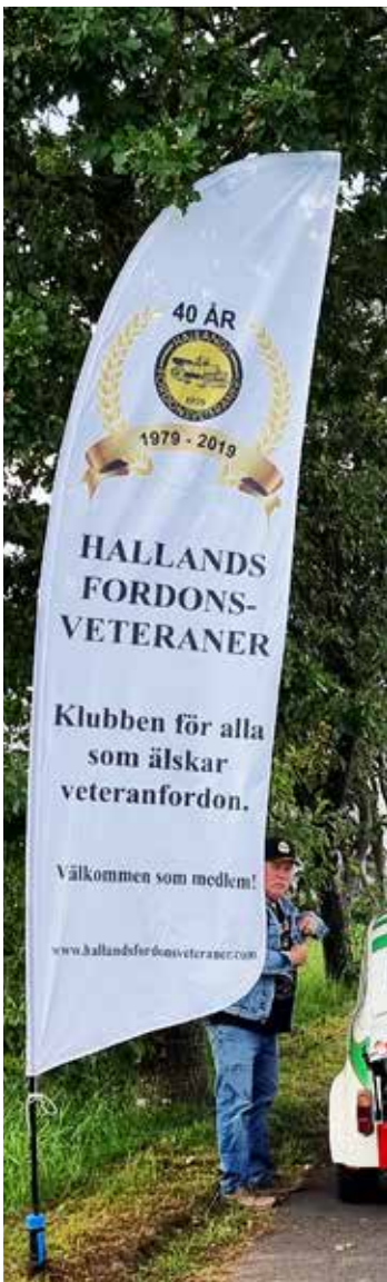
Tomas Ahlberg har satt upp klubbflaggan och står nu och väntar på att få dela ut biljetter till racingintresserade HFV-are