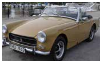
MG Midget 1.3, 1972 65hk. 79 500 kr