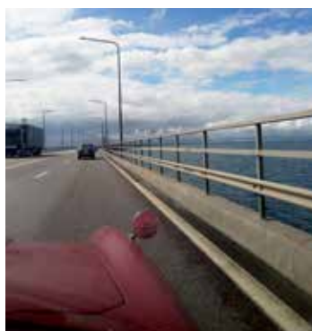
På Ölandsbron inne från bilen

Nu körde vi till Eketorps Borg och tittade på befästningen. Sedan vidare till Långe Jan där vi åt lunch, Lufsa med fläsk. Därefter körde vi till Capellagården och tittade på blommor och kryddor.