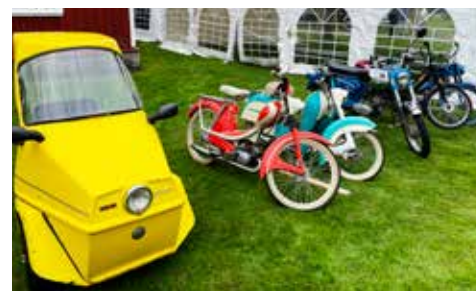
Ett antal mopeder fanns på plats