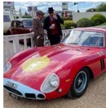
En Ferrari GTO-63 värd ett antal miljoner pund lite slarvigt parkerad i gruset intill banan

Men nu var det det däringa med Goodwood. De första biljetterna köptes för Revival 2020 men det blev inställt p.g.a. covid men jag kom överens med engelsmännen att biljetterna skulle stå kvar till 2021 för då skulle väl covidlandet vara över. Men icke sa nicke! När september började närma sig insåg jag att det inte skulle vara genomförbart att köra bil till England p.g.a. restriktioner och covidtester mm, så då fick man kontakta dessa trevliga engelsmän igen, som till min stora förvåning betalade tillbaka alla pengarna och önskade mig välkommen åter till Revival 2022.