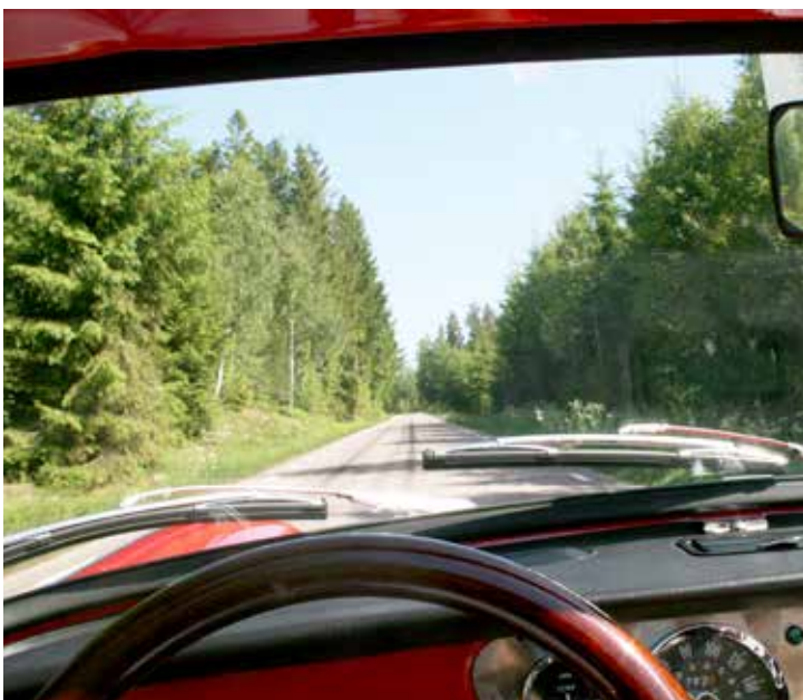
Utsikt över rallyvägen genom vindrutan