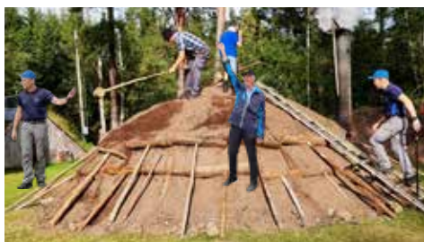
Kolmilan i Knäred sidan 13