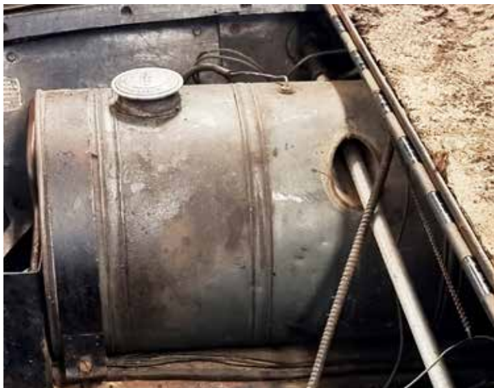
För att få en tillräckligt stor tank valde DKW att låta växelspaken gå igenom tanken. Annorlunda idé!

Det nuvarande objektet som väntar på att bli besiktigat är en guldfärgad Lambretta Scooter från 1950.