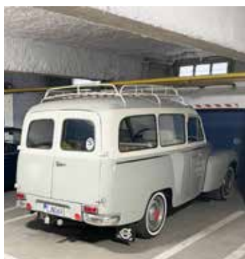
Lågt i garagetaket i Calais.

Nästa dag tog vi färjan över till Puttgarden och drog vidare ner i Tyskland, det var lite jobbigt att samsas med alla lastbilar i högerfilen men man vänjer sig. Vid första tankningen i Tyskland fanns det bensin som hette "super 102" och det måste man ju prova. Det visade sig vara rena dynamiten för en gammal Volvo, så tidigare tendenser till spikning och glödtändning försvann direkt. Tänk om den bensinen ändå gick att få tag på i Sverige.