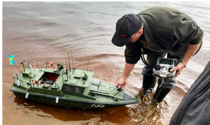
Det blöta vädret passade båtföraren bra som körde uppvisning