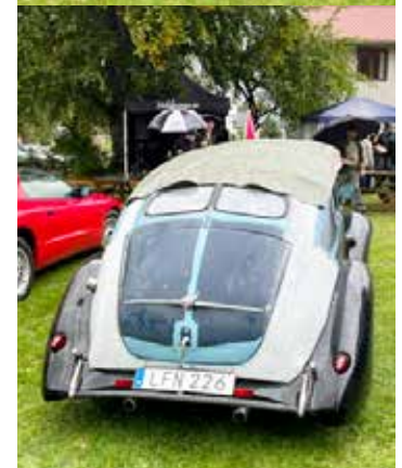
Ford Tudor Special 1938