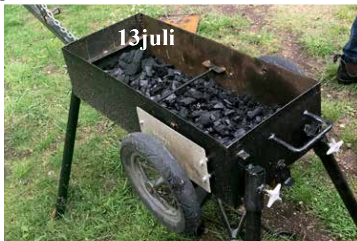
Den mopedmobila grillen klar att tändas

Idag körde vi till Björsjön vid Mästocka naturreservat. Vi skulle testa Nils Gustavssons mobila grill som kopplas efter moppen. Det fungerade alldeles utmärkt med transporten och vi kom alla fram till vad som var höjdpunkten för dagen, se om grillen höll måttet och kunde matcha nästan 20 korvsugna pensionärer. Inga problem, med tändvätska