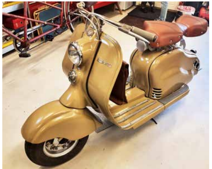
Lambretta Scootern från 1950 klar för besiktning