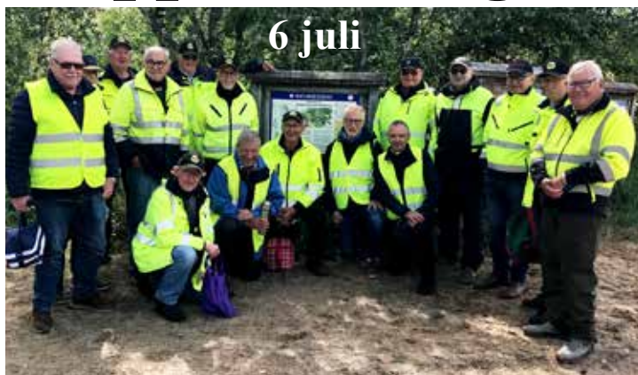
16 "blåsta" mopdister har hittat lite lä bakom buskarna