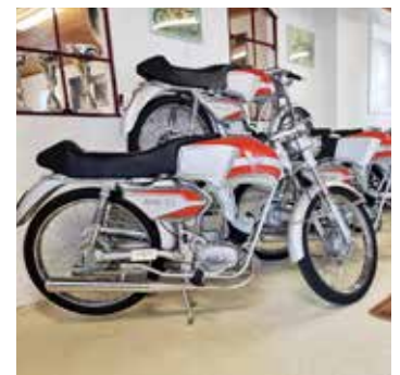
Standard Telstar TT. en italiensk moped med TT-stuk som från 1966 såldes i Sverige av Svenska Cykelfabriken i Lomma. Extremt ovanlig.