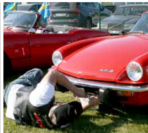
Knepigt få fast skylten “Kultur-på-väg”

Södra Ågatan 20b, 431 35 Mölndal www.autokyl.se • info@autokyl.se