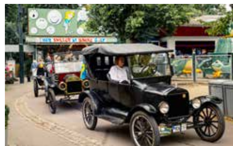
Styrkeprovet på sid 23