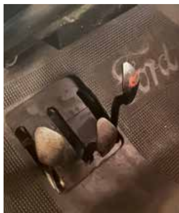
Pedalstället i en Ford T ser inte riktigt bekant ut för en moderna chaufför. Från vänster: växelpedal, backväxel, fotbroms