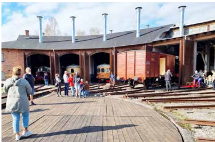
Lokstallarna var öppna och man kunde gå in och titta på både lok, vagnar och verkstäder. Barnen fick cykla dressin.