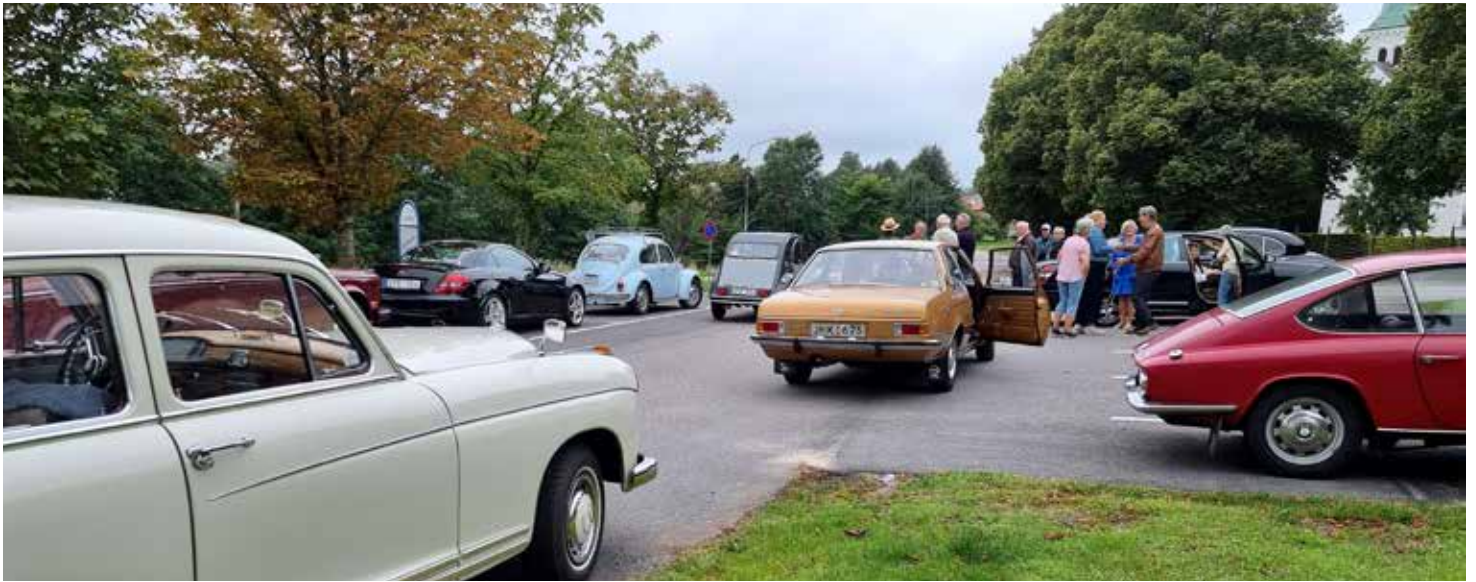
Samling vid Getinge Kyrka för gemensam körning till Stall Hällarp som ligger nära Falkenbergs Motorbana

Till stor förvåning kände sig många lockade av att köra och fika hos Stall Hällarp. Vi som bodde söderöver i Halland träffades vid Getinge Kyrka för gemensam färd dit.