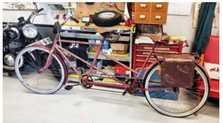
Tandemcykeln som mest står i vägen