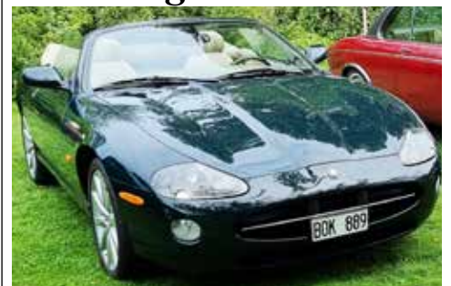
Jaguar XK8 Coupe 4.2, årsmodell 2005. Ägare Kjell Utjord