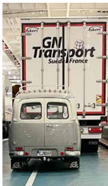
På färjan mot Helsingborg, snart tillbaka i Sverige.

Vädret var fantastiskt, det var soligt och klart mest hela tiden, varmt på dagen men kallt på nätterna. På lördagsnatten var det faktiskt minusgrader. Jag hade bokat en tältplats med eluttag för att