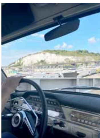
Solen sken på Dovers vita klippor

hela Belgien och resan hade sänat slutat där för helt utan förvarning stod trafiken still i högerfilen och vi missade en lastbil med en hårsman. Tur