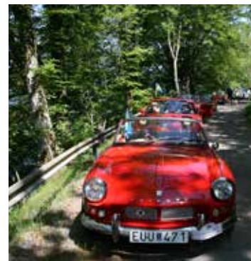
Bilraden vid kontroll 4