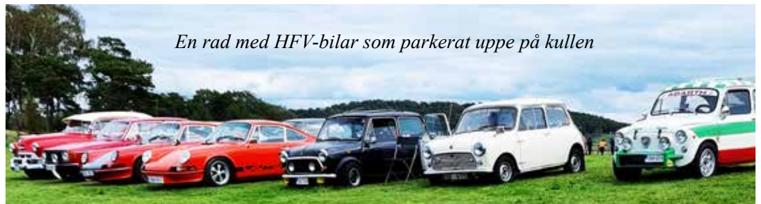
En rad med HFV-bilar som parkerat uppe på kullen