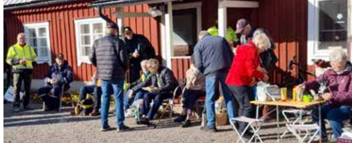
Verstadsängans fasad bjöd på oktobersol och naturligtvis samlades HFV-arna där för att njuta av kaffe och korb