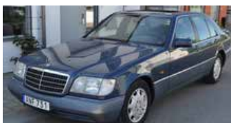
Mercedes-Benz 500 SE Automat 1992, 326 hk Ren. motor. Nybes. 79 000 kr