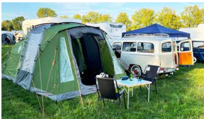
Så här bodde vi

Dagen därpå började med sol, men ju närmre Belgien vi kom desto sämre blev vädret. Det regnade duktigt genom