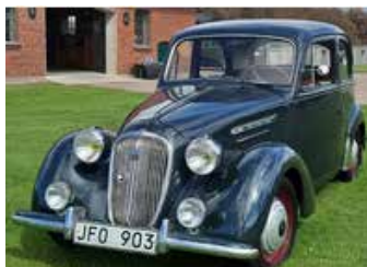
Simca 8 1950, 4-dörrars Sedan, 41hk. 149 500 kr