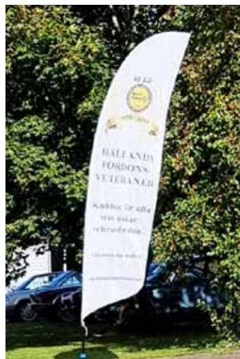
HFVs flagga vajade som vanligt stolt vid vår parkering.

ring för oss HFV-are. Bilarna, motorcykeln och lastbilen är alla ägda av HFV-are. Någon bil stod på allmän parkering då de inte dök upp till kl 10 vilket var avtalat med arrangörerna för tåg dagarna. Det var mycket folk i Landeryd denna söndag och medan vi tittade och drömde oss tillbaka till barndomens tågresa så passade andra besökare på att beundra våra fordon. Det blev en mycket lyckad dag och Peter får gärna göra om den 2024