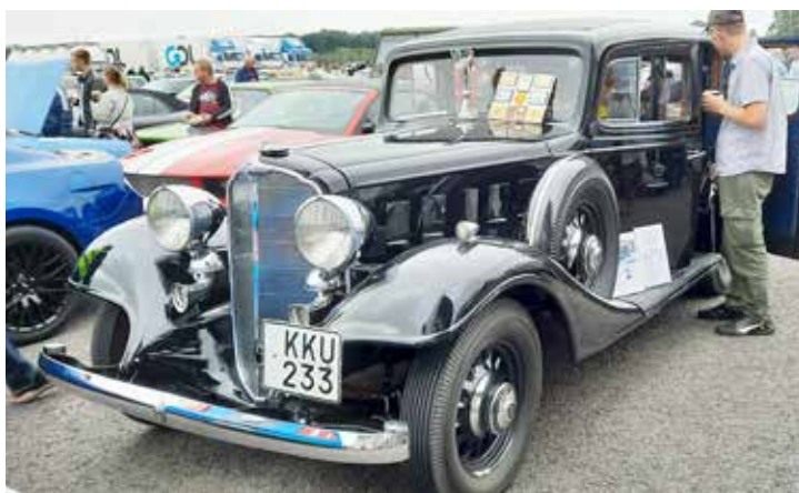
Buick Royal Sedan årsmodell 1933. Imponerande fordon!