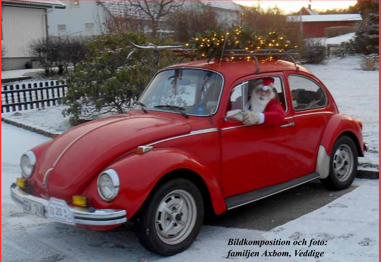
Bildkomposition och foto: familjen Axbom, Veddige