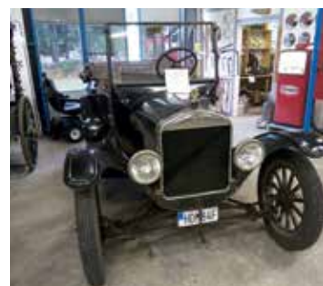
T-Ford från 1924. Är i trafik