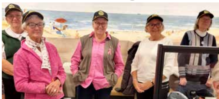
Sven-Olofs 6 damer skötte serveringen och hade bakat kaka.

Vi fick under träffen besök av polisen som informerade på ett mycket underhållande sätt om hur man arbetade i Laholms kommun. Trafikövervakning var ett prioriterat område och till närvarande mopedister framfördes en skämtsam varning "kör inte på bakhjulet!" Många skratt blev det.