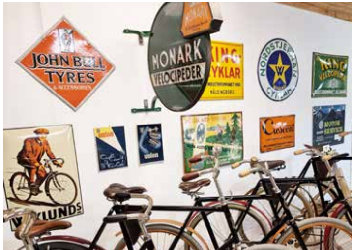
En vägg med gamla reklamskyltar väckte nostalgiska tankar om tider som flytt

En annan mycket ovanlig moped på museet var en 2-växlad Ducati 55. Tillverkades mellan 1955-57 och hade en 4-taktsmotor på 48 cc och 0,8 hk. Ducatin den enda mopeden i Sverige som gick att köra på vanlig bensin utan oljeinblandning