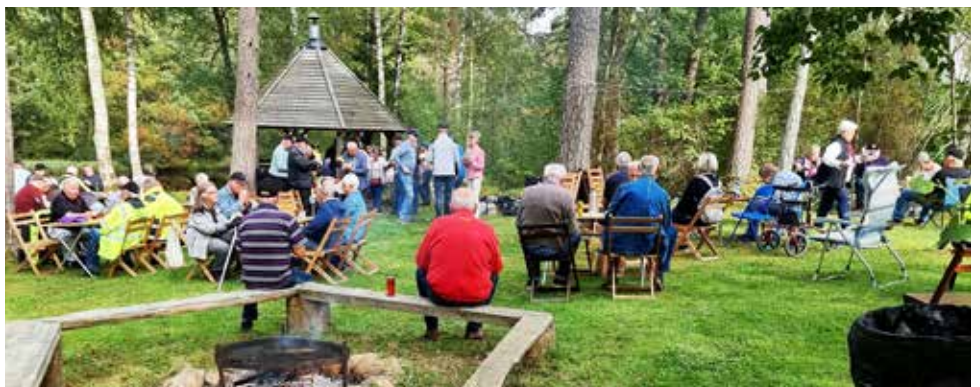
Trivsamt samvaro i "parken". I bakgrunden syns grillkåtan