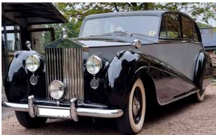
Rolls-Royce Phantom 1950. Hittad under promenad i Oskarström

Adressen är: Ångloksvägen 12-14 Port A13 i Stångby (Lund)