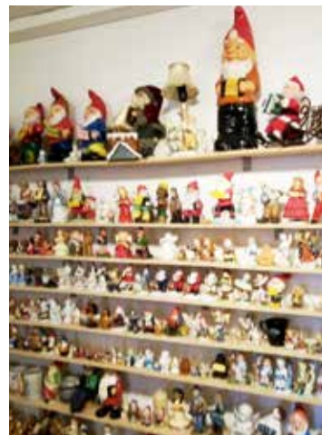
Mängder av tomtar