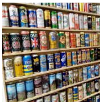
Finns det så många sorters öl?