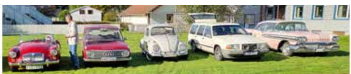
Fr vä MGA 1600 1959, DKW F 102 1965, Volkswagen 1200 LIM 1965, Volvo 745 1990, Oldsmobile Ninety Eight 1958