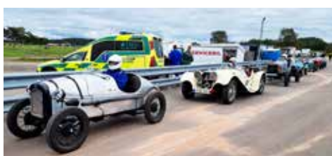
Falkenberg Classic sidan 12