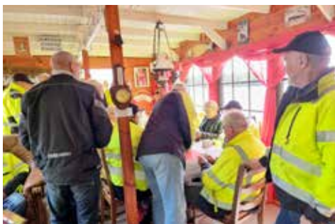
Moppegänget och hjulångaren sidan 4