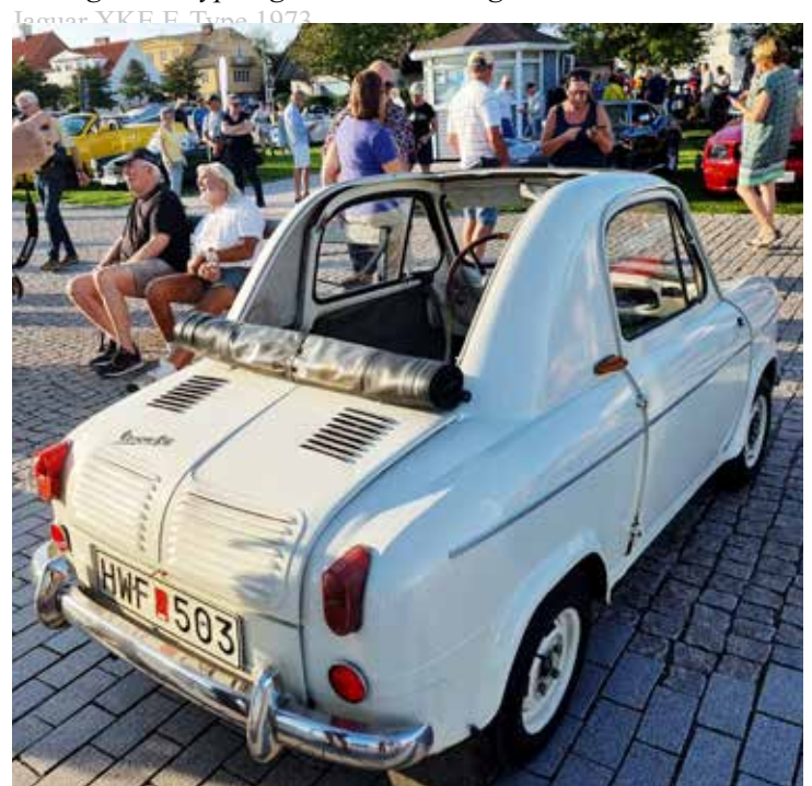
Utsällningens mest udda bil en Vespa 400 från 1958. En italiensk mikrobil som tillverkades i Frankrike 1957-61. Bilen har en tvåcylindrig tvåtaktsmotor på 14 hk, monterad bak. Den har plats för två vuxna och två mindre barn, eller bagage. Soltaket gick ända ned till motorluckan, vilket syns på bilden.