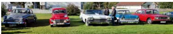
Fr vä Hillman DeLuxe 1947, Volvo PV Sport 1961, Cadillac Coupe Deville1960, Ford Taunus 17M 1959, Volvo 144 1972