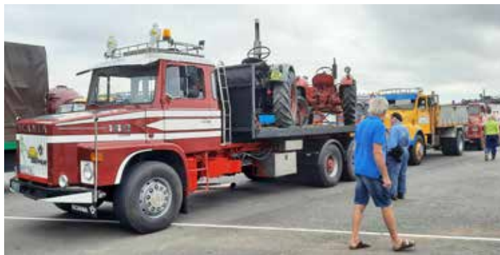
Många lastbilar på startlinjen