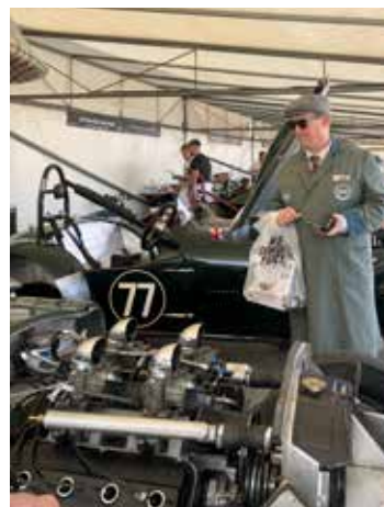
Minns inte fabrikat på bilen men motorn var amerikansk, Chrysler 392 hemi