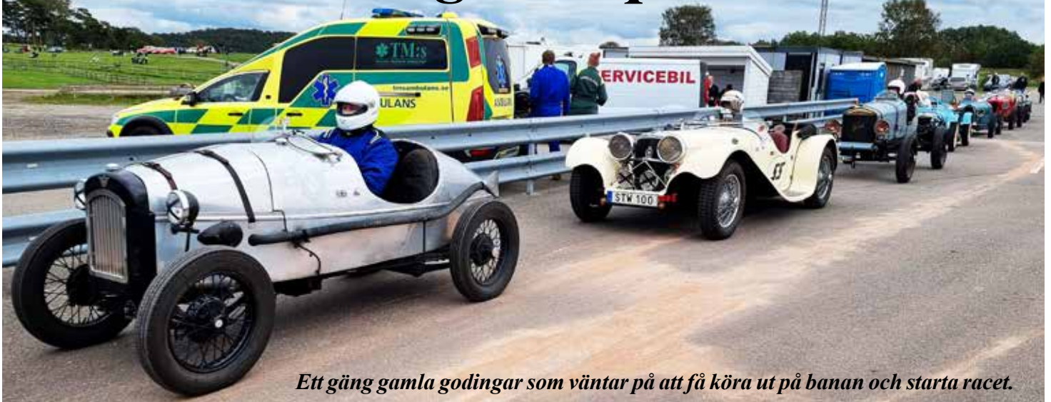
Ett gäng gamla godingar som väntar på att få köra ut på banan och starta racet.