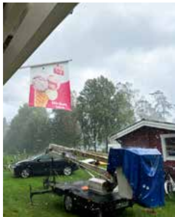
En riktigt blöt tillställning