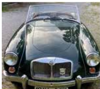
MG A Mark II Roadster 1.6 1961, 90 hk Helrenoverad. Svensksåld. 350 000 kr