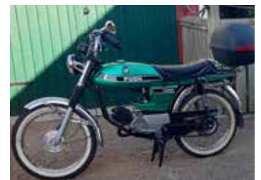
En metalliclackad Puch