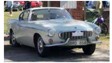
Volvo P1800, 1964