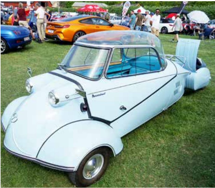
Något större var den här fina Messerschmitt KR-200 DE Luxe med ett litet "släp" efter.