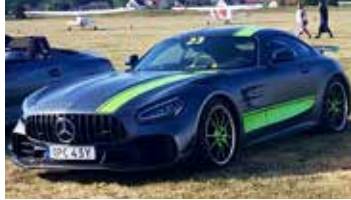
Fanns också moderna bilar. Här en "värsting" Mercedes-Benz GT R 2019 med 585 hkr