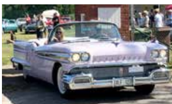
Oldsmobile Ninety Eight, 1958