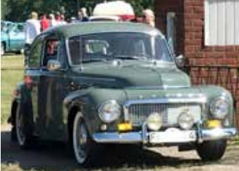
Volvo PV 544 Sport, 1958