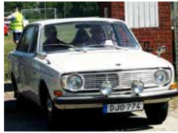
Volvo 144 Sport, 1967