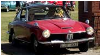
BMW 1600 GT Coupé, 1969