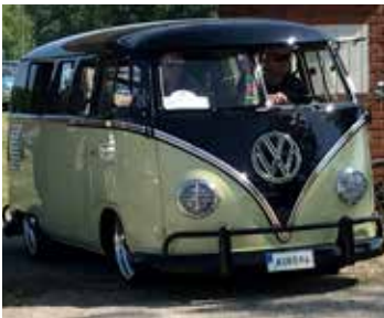
VW Buss, 1958