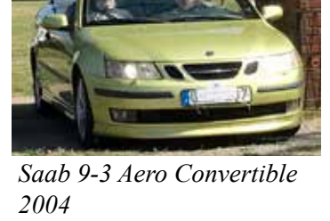
Saab 9-3 Aero Convertible 2004