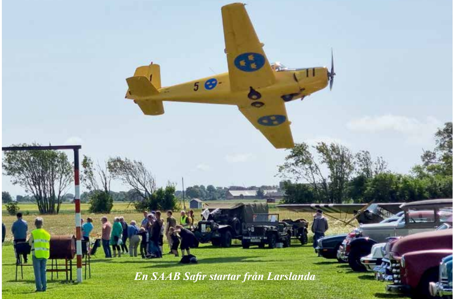
En SAAB Safir startar från Larslanda

20 veteranbilar och 3 militära fordon gästade Larslanda under fredagen för att umgås, grilla korv och träffa Wheel & Wings uppvisningspiloter. Det är fantastiskt trevligt att vi i HFV årligen blir inbjudna till Larslanda och får möjlighet att träffa piloterna.