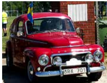
Volvo PV Sport 1965