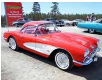
Chevrolet Corvette 1958. En bil som är lika gammal som jag ... men i betydligt bättre skick och framför allt snyggare

ströms Fordonshistoriska Klubb på Vaggeryds travbana som ligger mindre än två timmars körning från Halmstad. Jag var inte den ende HFV-aren som hade hittat dit. Bland annat så kände jag igen en mycket fin Duett från Tvååker som fanns med i Fördelardosan nyligen.