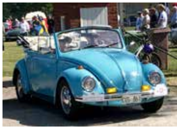
VW 1500 Cabriolet, 1968