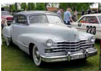
Gråaste bil på utställningen var en Cadillac Sedan 1947