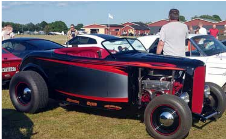
32A Roadster. Årsmodell 2009. Automatväxlad, 185 hk