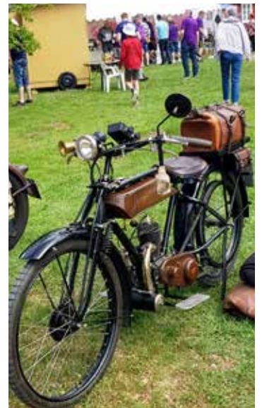
Äldsta MC i Klippan var en Rex 147 R från 1925