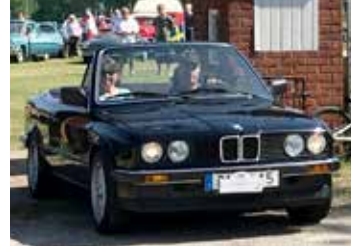
BMW 320 CAB, 1989