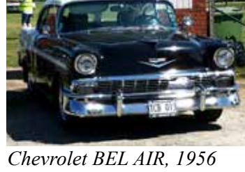
Chevrolet BEL AIR, 1956