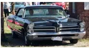
Pontiac Bonneville, 1965