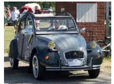
Citroen 2CV, 1988