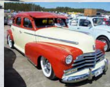
Chevrolet 1503 årsmodell 1947 med en ovanligt lyckad färgkombination