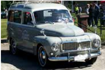
Volvo Duett, 1967