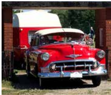
Chevrolet 4-d Sedan, 1953