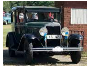
Chevrolet Coach 1929