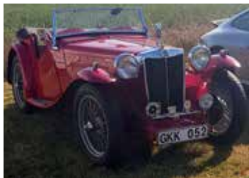
MG TB. Årsmodell 1939