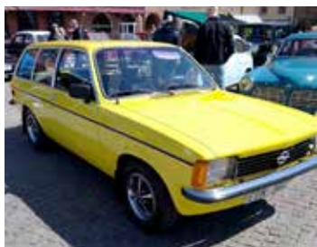
Opel Kadett kombi. En sådan hade vi 1987-98