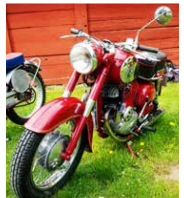
Puch MC 1955 försedd med dubbla förgasare. Unikt?