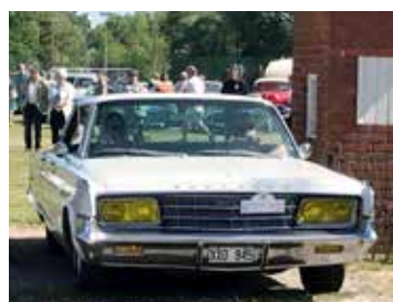
Chrysler NEW Yorker, 1965

Se henne på bild på sid 19