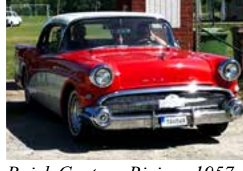
Buick Century Riviera, 1957