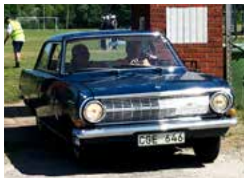
Opel Rekord, 1963