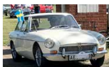
MGB GT, 1969