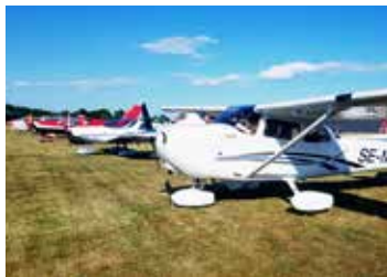
Mycket flygplan på fältet