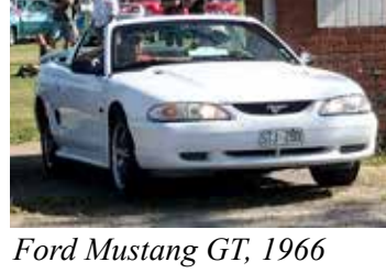
Ford Mustang GT, 1966