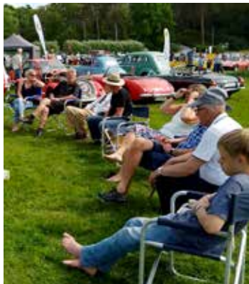
Vad blir det för mat?

För att inte tala om det vackra slottet med trädgård och alla människor som njöt av det fina vädret.