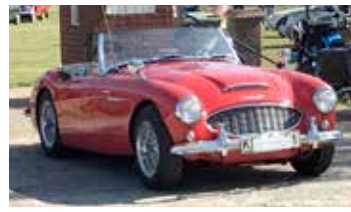
Austin Healy 3000, 1960