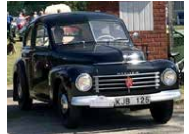
Volvo PV 444A, 1947