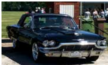
Ford Thunderbird, 1965