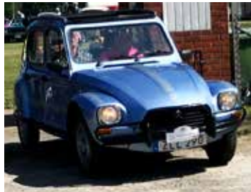
Citroën Dyane 6-B, 1982