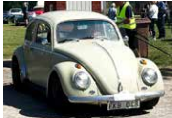
VW 1200, 1964