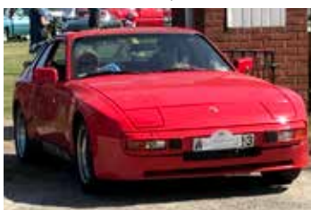
Porsche 944, 1982