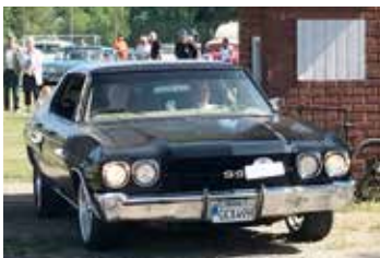
Chevrolet Chevelle, 1971