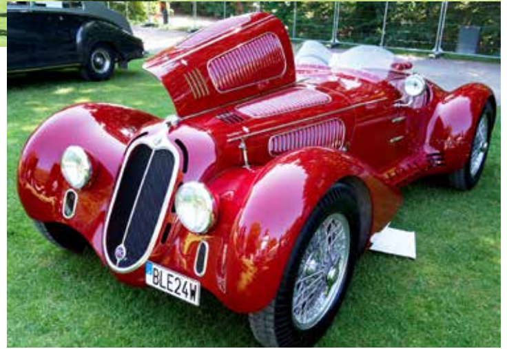
Alfa Romeo 6C 2500 Super Sport 1947 i ett otroligt vackert skick

Sofiero Classic har under alla år tidigare varit relativt välbesökt, både med utställande bilar och besökare. Söndagen, då undertecknad var på plats, var det ganska ödsligt på utställningsområdet. Man hade lätt kunnat ta in 2 eller till och med 3 gånger så många bilar utan problem. Det var med andra ord en ganska stor besvikelse. Visserligen höll bilarna som var på plats relativt hög nivå, men det var alldeles för få utställda bilar. Troligtvis beroende på att evenemanget i år var uppdelat på två dagar. Det finns tydligen inte tillräckligt många bilar i närområdet för att fylla Sofiero två dagar på rad, så jag hoppas att man går tillbaka till att bara hålla Sofiero Classic på en dag framöver.