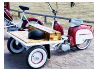
Tänk om man hade fått en så här tuff transportmoppe när man jobbade som mopedbud på 70-talet