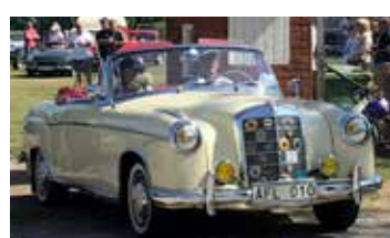
Mercedes-Benz 220 S 1956