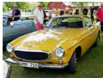
En fint renoverad Volvo P1800 1970 hade många beundrare