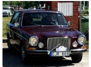
Volvo 164, 1970