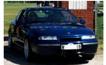
Opel Calibra, 1992