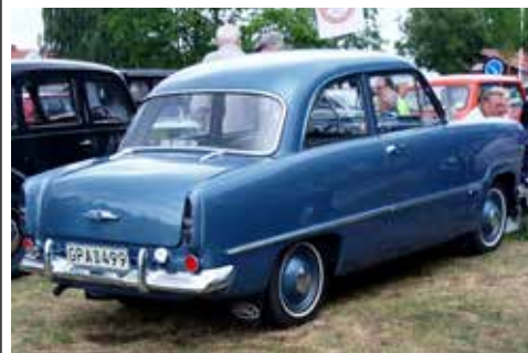
Ford Taunus 12 M 1954

När redaktören passerade Askersund på väg hem från en tur i Häslingland var det veteranfordonsträff utanför Best Westerns hotell. Kameran kom fram och den fängade några numera sällsynta veteraner. Ja några av dem var nog sällsynta även när de var nya. Vilka bilar som intresserade mest ser du här nedan.