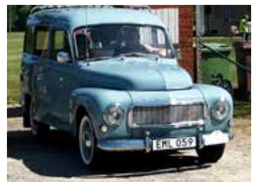
Volvo Duett, 1966