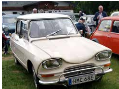
Citroën AMI 6 1969