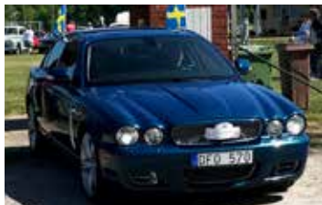
Jaguar XJ 350, 2007