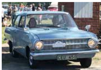
Opel Rekord, 1964