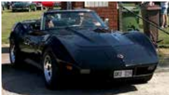
Chevrolet Corvette 1973