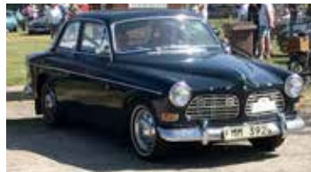
Volvo Amazon, 1967