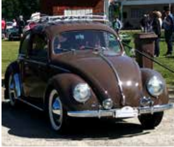
VW 1200, 1950