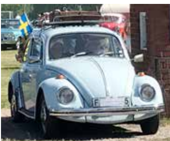
VW Beetle, 2013