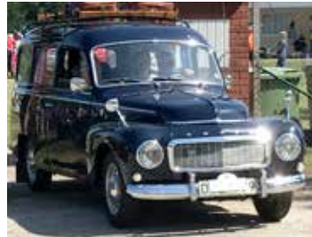
Volvo Duett, 1968