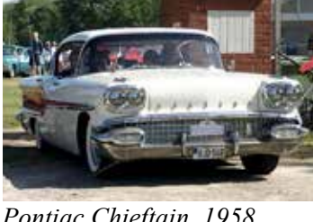
Pontiac Chieftain, 1958