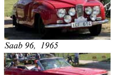
Saab 96, 1965