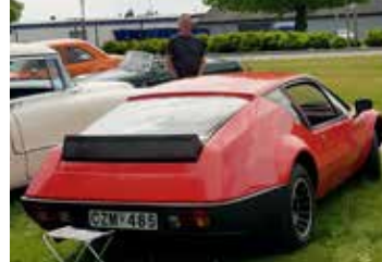
En mycket udda sportbil, en Renault Alpine A 310 1981