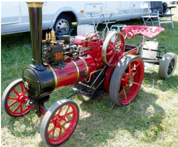
Om man har för mycket fritid så bygger man en fullt fungerande ångdriven traktor i miniformat, helt själv. Det var faktiskt ett riktigt snyggt bygge!