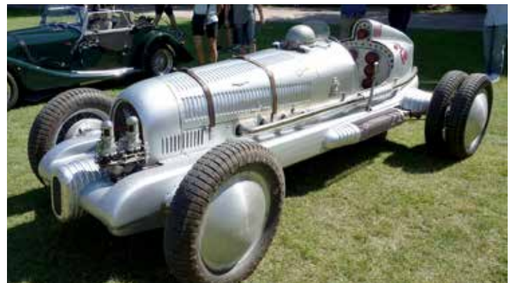
6-hjuligt hemmabyggt med inspiration från Mercedes tävlingsbilar på 30-talet