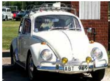
Volkswagen 1300 LIM 1966