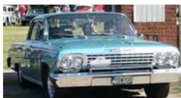
Chevrolet Impala, 1962