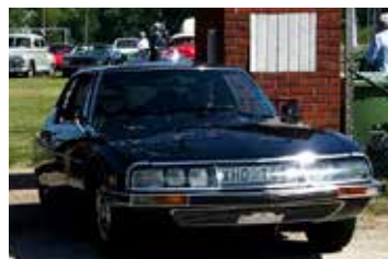
Citroën SM Coupe, 1973