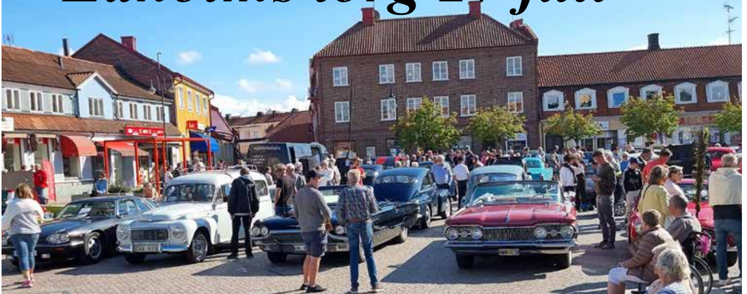
Bilarna packade som "sardiner i plåtburk". Det blev mycket trångt på det lilla torget med 50 bilar av olika storlek.