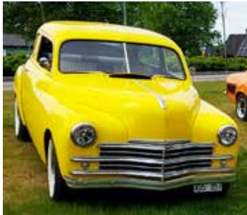
Gulaste bil på utställningen var en Plymouth Coupe 1949

Festligt, folkligt och fullt med bilar av alla möjliga fabrikat. Jätteroligt att också få se så mycket intresserad publik.