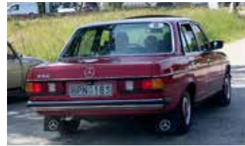
Mercedes-Benz 230, 1979