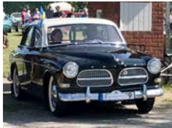
Volvo Amazon, 1959