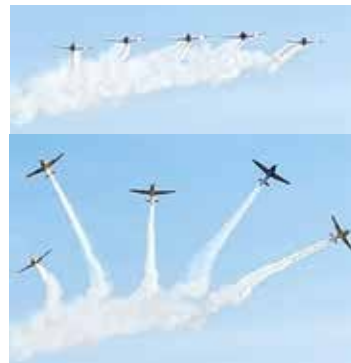
Ovan kommer de flygande mot oss och sedan en split. Vackert!

Larslanda är den flygplats flygarna utgår ifrån när de gör sina uppvisningar över Wheel & Wings utställningsområde. I år var det Team 50 som stod för flygkonsterna. Team 50 består av 5 st SAAB Safir från 1950-talet och flygs av seniora trafikflygare, dvs det är, precis som vi, också veteraner.