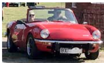
Triumph Spitfire, 1972