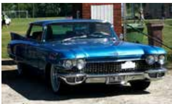
Cadillac Sedan DE Ville, 1960