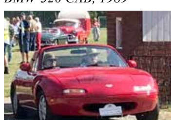
Mazda MX5 1991