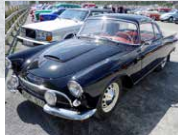
DKW AU 1000 S Coupé 1961. En tidig, snygg och sportig "Audi"