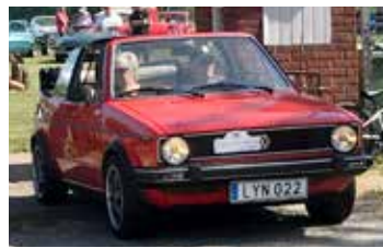
VW Golf GHI Cab, 1983