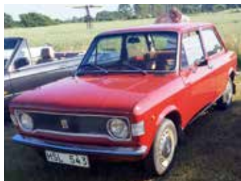
En bil man inte ser så ofta nu för tiden. Fiat 128 Berlina 1975