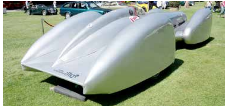
Hemmabyggt modell större! Bilen är över 6 meter lång och över två meter bred och har en rak 16-cylindrig motor!