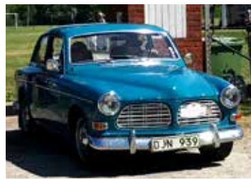
Volvo Amazon, 1970