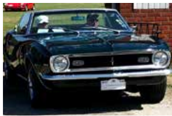
Chevrolet Camaro, 1968