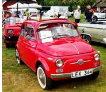
Minsta ekipaget med släpvagn var en från Fiat 500 1958