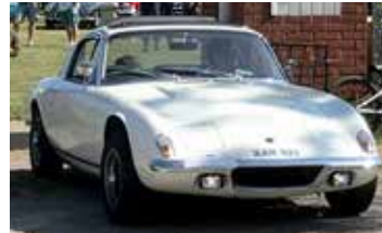
Lotus Elan 2S, 1969