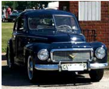
Volvo PV 444, 1957