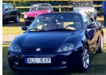
53 års teknikutveckling. Överst en MG TD från 1952 och under en MG TF från 2005