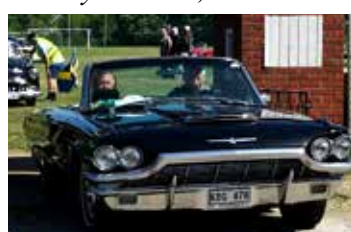
Ford Thunderbird, 1965