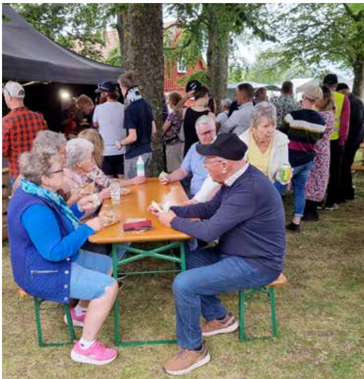
Mycket folk som köade för att fylla magen