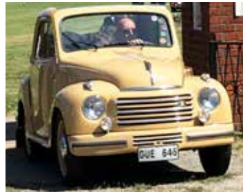
Fiat 500C, 1953