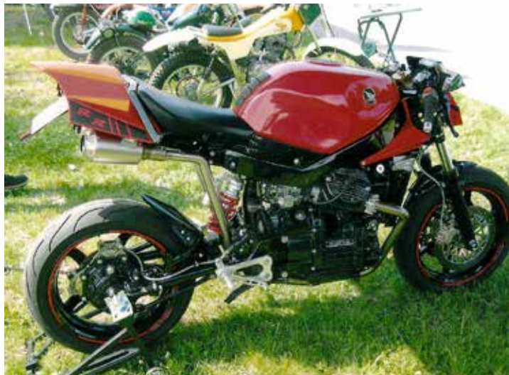
Samma ägare som till Honda Cx 500 cc har från en risig likadan CX byggt upp en riktig specialmaksin med TT-stuk. Fantastiskt bygge in i minsta detalj.