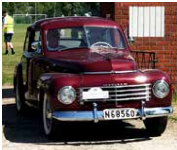
Volvo PV 444A, 1947