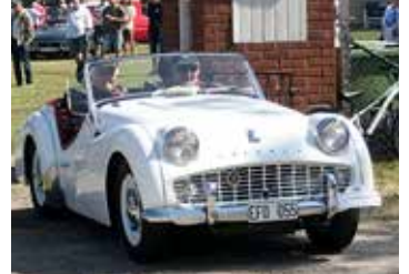
Triumph TR3B, 1962