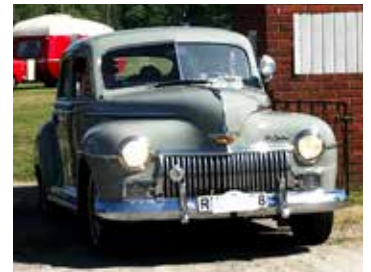
Desoto Diplomat, 1947