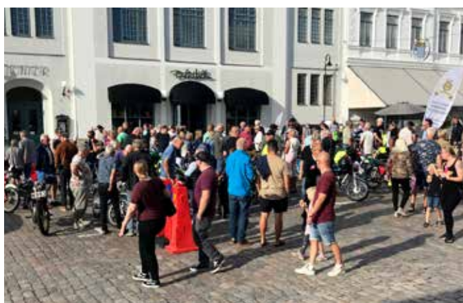
Så många som var nyfikna på våra mopeder!