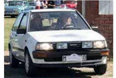
Toyota Starlet S, 1987