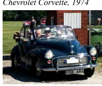
Morris Minor 1000 1967