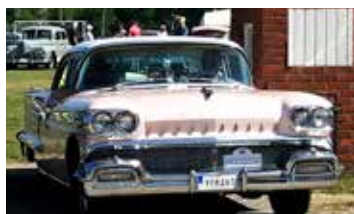
Oldsmobile Ninety Eight, 1958