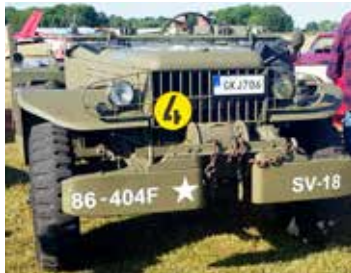
Dodge Commander Jeep, 1942