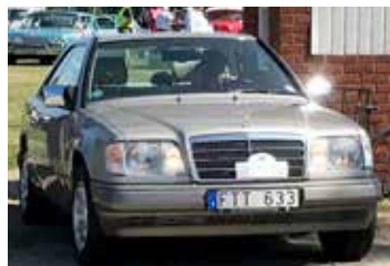
Mercedes E320, 1994