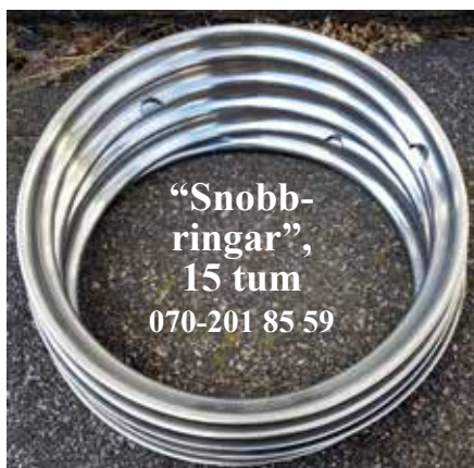
"Snobb-ringar", 15 tum 070-201 85 59