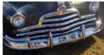
Ett riktigt amerikanskt dollargrin kan man se på denna Pontiac Streamliner från 1947