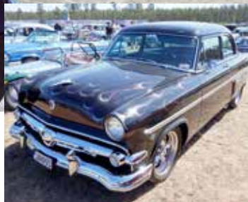
Ford Customline 1954 med väldigt snygga och diskret lackade flammor