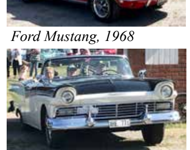
Ford Fairlane Skyliner, 1957