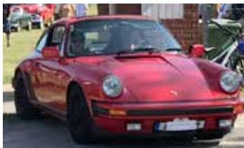
Porsche 911 SC, 1983