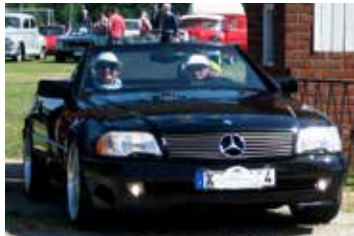
Mercedes-Benz SL 500, 1995