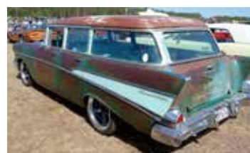
Chevrolet 1957 i ett härligt och välskött patinerat skick