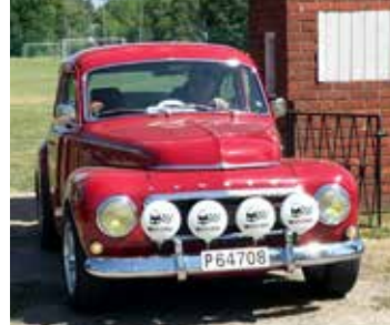
PV Sport, 1962