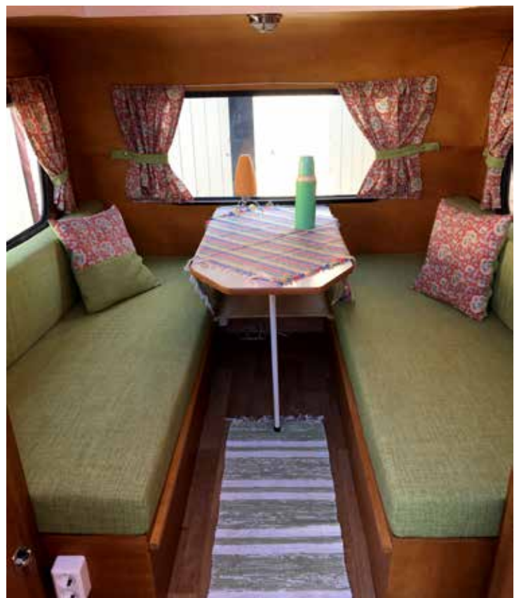
Snyggt och prydligt inne i vagnen med 2 långa bäddar.

ligger på veteranhusvagnar, som finns i alla tänkbara modeller och fabrikat. På 50 - 60-talet fanns i Sverige ett stort antal husvagnstillverkare och på Nostalgifestivalen hittade vi några riktiga rariteter. Om man är ute efter en veteranhusvagn är detta ett utmärkt tillfälle att titta ut en modell som skulle kunna passa. Ofta kan man studera vagnarna både utvändigt och invändigt. Vi hade många besökare som ville titta in i vår vagn. De förundrades över hur rymlig den är trots att den är så liten. Vårt husvagnsintresse tog fart i början på 90-talet då vi införskaffade en SMV 10 från 1962 och gick med i föreningen Campingveteranerna (föreningen fukt och mögel) därefter