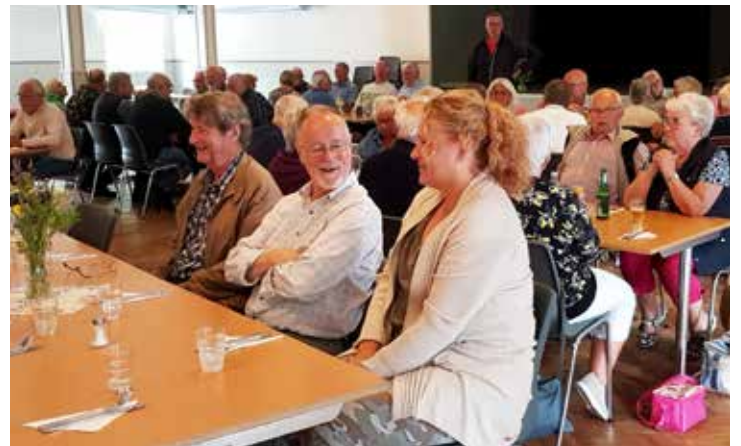
Förväntansfulla HFV-are i väntan på maten