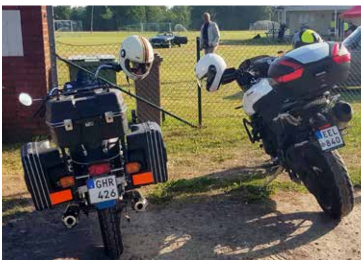
Från vänster BMW R 75/7, 1977. Triumph Tiger Sport, 2013