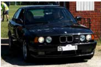
BMW E34 MS, 1991