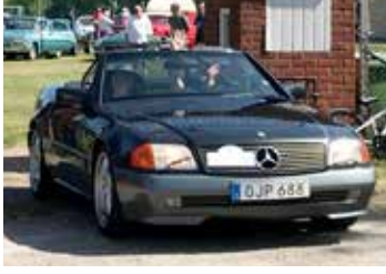
Mercedes-Benz 300 SL, 1990