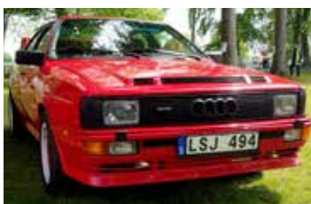
Rödaste bil på utställningen var en Audi Quattro 1983