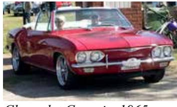
Chevrolet Corvair 1965