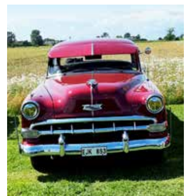
Chevrolet 4 D Sedan 1954