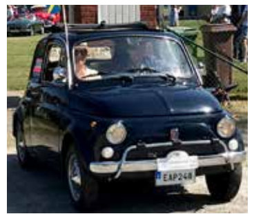
Fiat 500, 1970