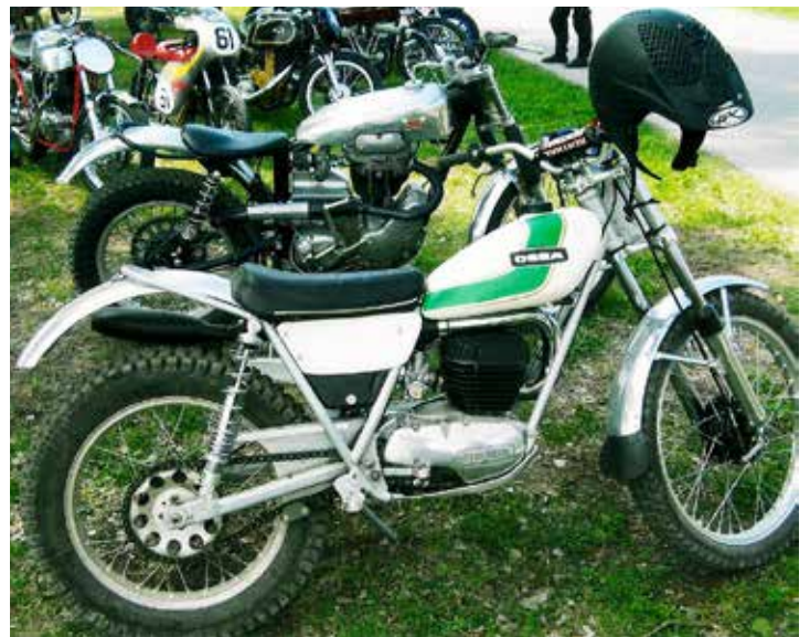
Ossa var en spansk motorcykeltillverkare som gjorde gathojar, motocross- och Enduromotorcyklar. Här en Trialmaskin.