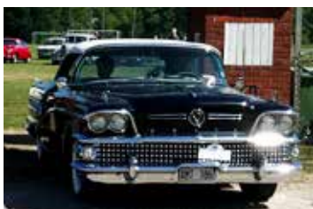
Buick Roadmaster, 1958