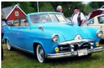
Blåaste bil på utställningen var en Frazer Manhattan Convertible 1951