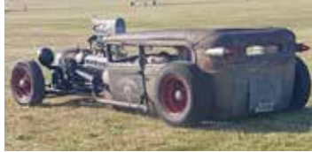
"Fulast", eller i all fall mest udda, en Ford Coupé 1930