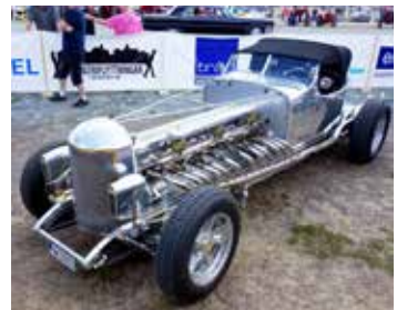
Snacka om hemmabygge. Motorn är en rak 12a! Registrerad som en "BILLRED DECIMO SEGUNDO" årsmodell 2019