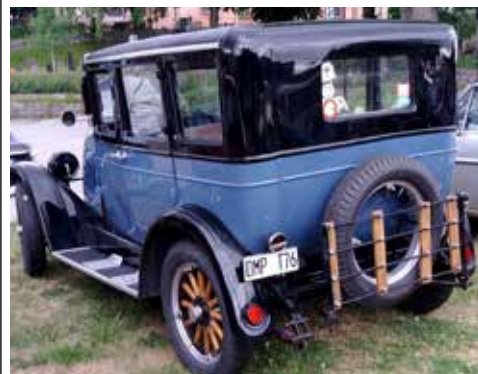
Willys-Overland Whippet 1927