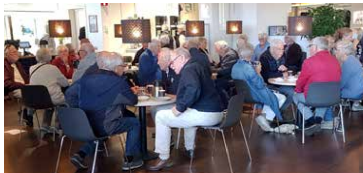
Efter några timmar i bussen smakade det bra med fika