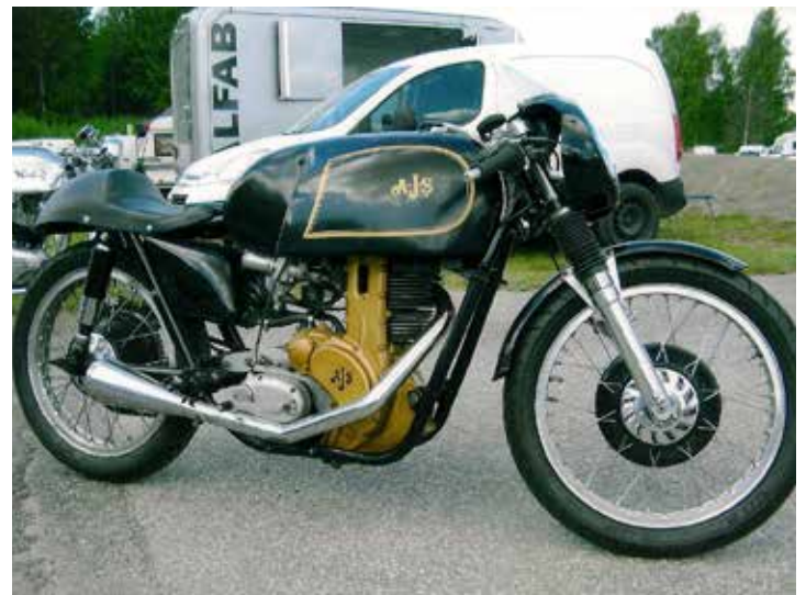
AJS 7R 350 cc, en riktigt klassisk racer från England. Den här är från mitten av 1950-talet. De var framgångsrika på racerbanorna under 1950-60-talet. Körde nu med helt öppen avgasmegafon precis som det var 1953 när jag besökte mitt första Väst kustlopp.