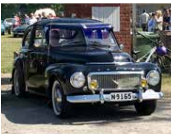
Volvo PV 444, 1957