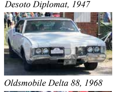
Oldsmobile Delta 88, 1968