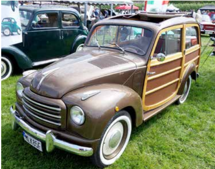
Ännu "större"! Fiat 500 "kombi" med soltak! Den här är från 1951.