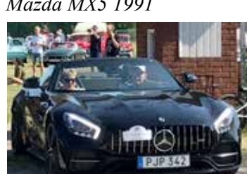
Mercedes-Benz AMG GT C Roadster, 2017