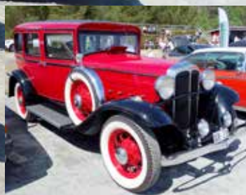
Om man säger Willys tänker de flesta nog på Jeep, men här stod en snygg Willys 880D från 1931