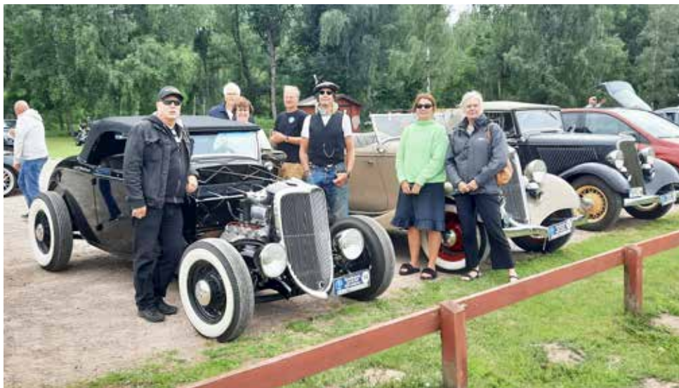
Ett gäng V8-or som gärna ställde upp på bild

Kunde inte låta bli fast jag har semester. Så här är det: