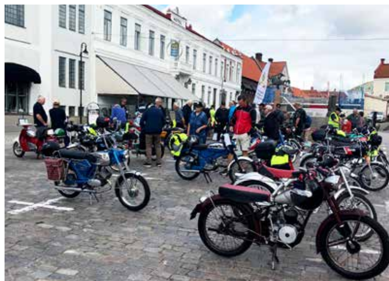
Det var många mopeder att beundra på torget denna dag