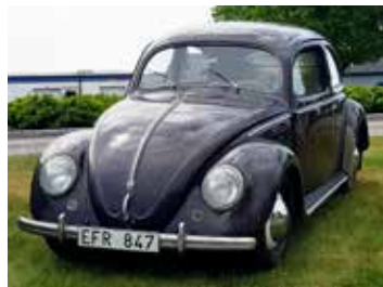
En riktig folkveteran VW 1200 1951