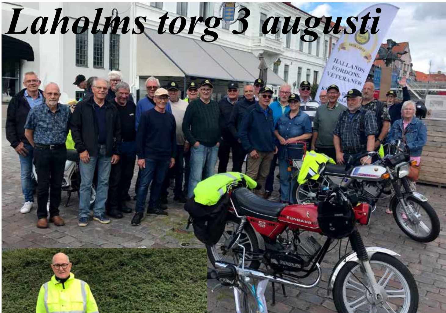
Hela moppegänget samlat under HFV-flaggan på torget i Laholm