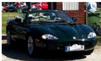
Jaguar XKR Convertible 4.0 1999