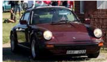
Porsche 911SC, 1983