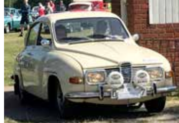
Saab 96, 1969