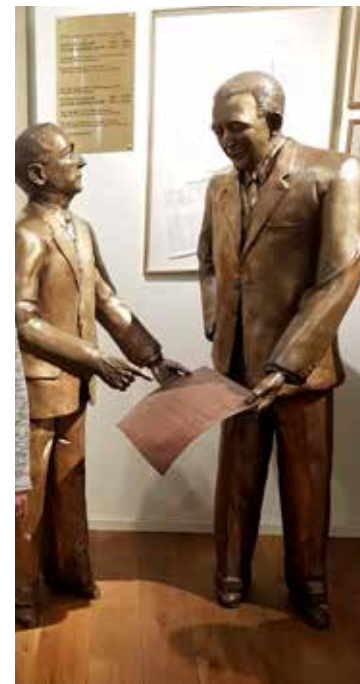
Guiderna berättade historien om Volvo framför statyn över företagets grundare, Gustaf Larsson och Assar Gabrielsson