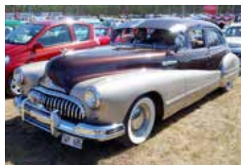
En fantastiskt snyggt lackad Buick Roadmaster från 1947