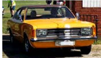
Ford Taunus 1600 XL, 1974