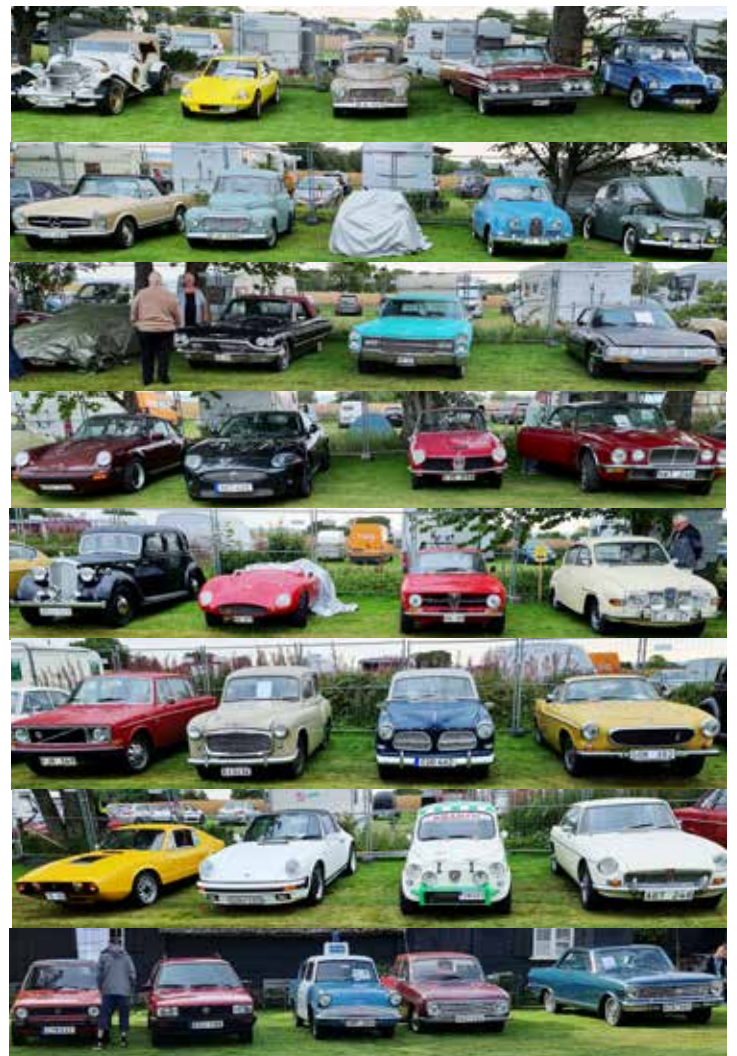
Det blev många bilar att fotografera och här är de flesta. Några bilar har regnrock då det kom en skur då och då