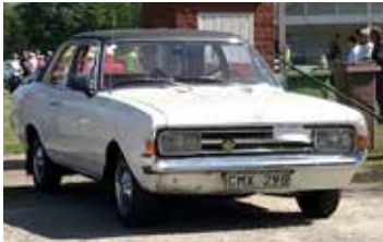
Opel Rekord, 1971