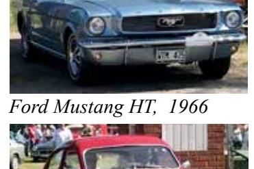
Ford Mustang HT, 1966