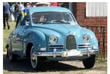
Saab 93B, 1958