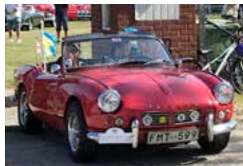
Triumph Spitfire MK1, 1965