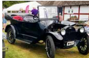
Äldsta utställda bil redaktören hittade en Chevrolet 490, 1919