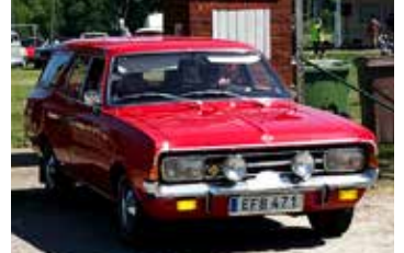
Opel Rekord Caravan, 1971