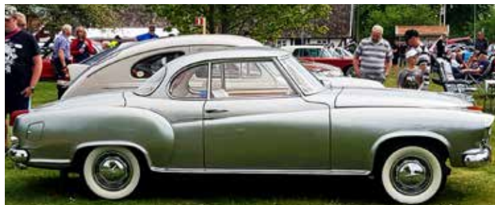
En av de mest sällsynta modellerna, en Borgward Isabella Coupé 1961, sista årsmodellen som tillverkades.