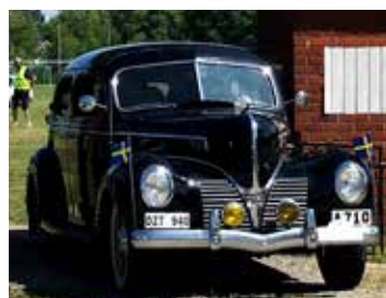
Dodge Senior, 1939