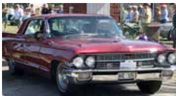
Cadillac Deville, 1962