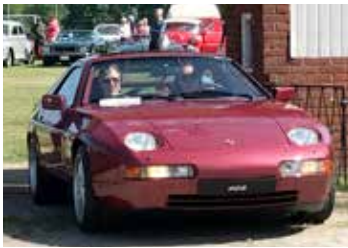
Porsche 928 S4, 1989