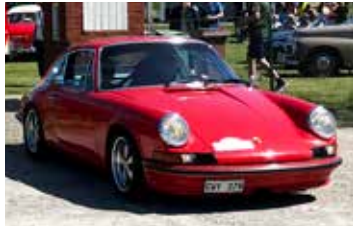
Porsche 911S, 1973