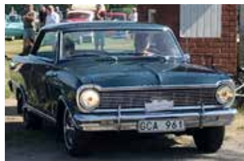
Chevrolet Nova SS, 1965