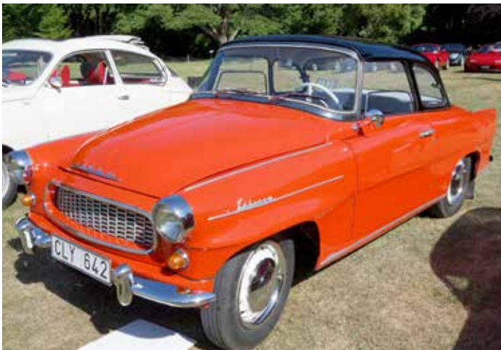
Skoda Felicia 1961 i ett riktigt fint skick