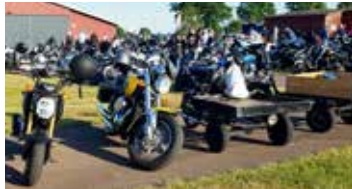
Massor av motorcyklar