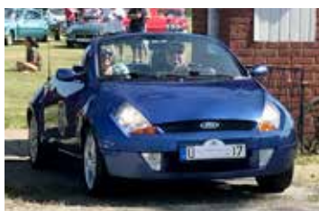
Opel Corsa 1.4 Ecotec, 2019