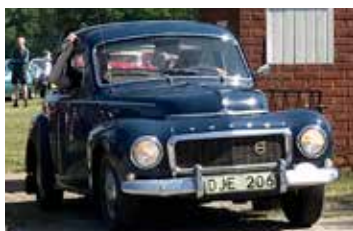
Volvo PV 444, 1953