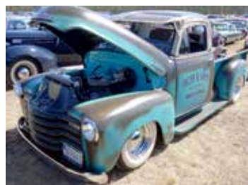
Om man ändå skall skaffa en firmabil så kan man ju se till att den sticker ut i mängden. Chevrolet Stepside 1949