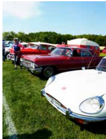
En bråkdel av alla bilar

Ett mycket uppskattat inslag. Köerna ringlade sig så sakteliga. Vid sextiden bestämde vi oss för att försöka ta oss ut. Det gick bra om än i maklig takt med stopp ibland. Ca halv åtta var vi hemma igen.