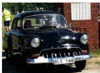
Opel Olympia Rekord 1953