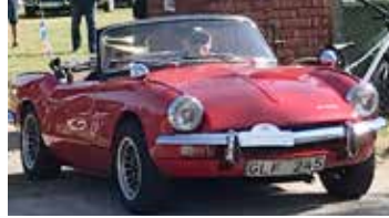
Triumph Spitfire, 1970