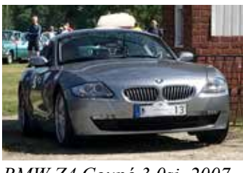
BMW Z4 Coupé 3.0si, 2007