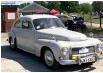
Volvo PV 1962