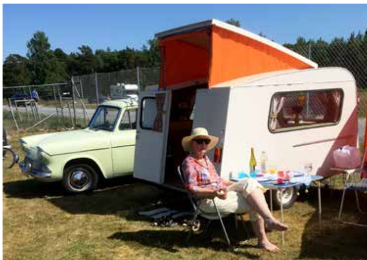
Ingela kopplar av utanför husvagnen

blev det en Thomson Glenn -65 följt av en Sprite 400 också den från -65. Det blev många campingsomrar innan vi bytte till en Knaus Swalbennest -65, Svalboet har vi kvar än i dag. England har en äldre campinghistoria än oss, tyvärr importerades nästan bara enkla och billiga vagnar till Sverige. Vill man ha lite "finare" modeller får man importera. Vår första engelska vagn var en Safari -71. Den var lyxig och väldigt