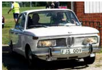
BMW 2000, 1972