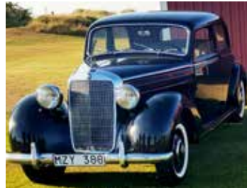
En bil vi inte sett tidigare, en Mercedes-Benz 170 SV, 1954