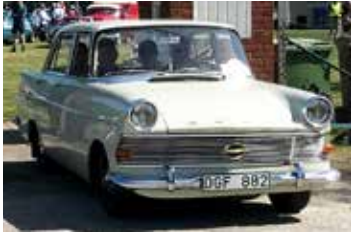
Opel Rekord, 1961