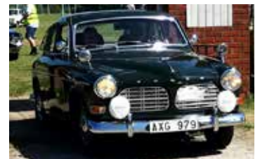
Volvo Amazon, 1967