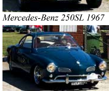
VW Karmann Ghia 1960