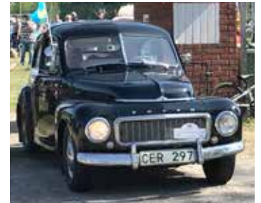
Volvo PV, 1957