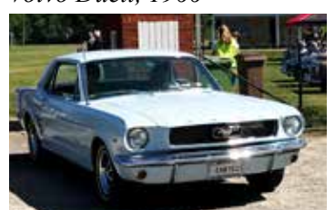
Ford Mustang, 1966