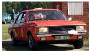
Ford Granada, 1975