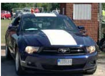
Ford Mustang, 2010