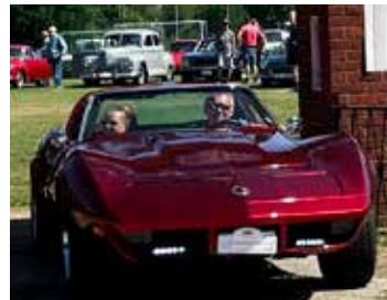
Chevrolet Corvette, 1974