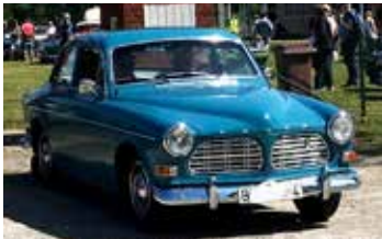
Volvo Amazon, 1969