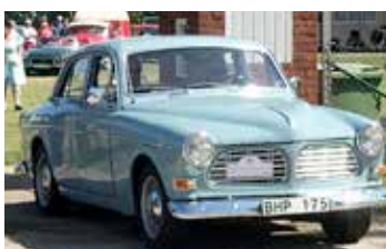
Volvo Amazon, 1965