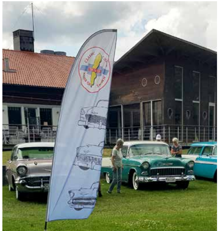
Massor av Chevrolet. Vanligast på träffen var BelAir som detta år hölls på Best Western i Askersund. Hela hotellet bokat.