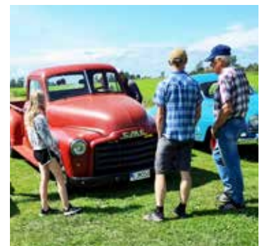
Här står några och tittar och funderar kring en GMC Pick-up från 1953 försedd med hela 197 hk

Grilla fick man göra själv. Grillning brukar vara en manlig sysselsättning men här är det tvärtom