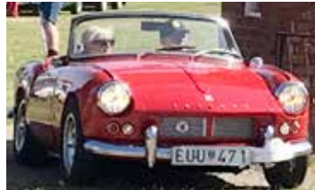
Triumph Spitfire, 1964