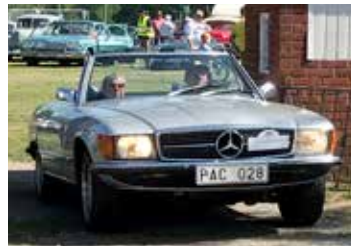
Mercedes-Benz 350 SL, 1972