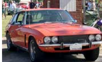
Jensen Interceptor, 1973