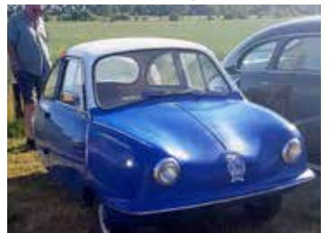
King S7, 1959. Motorcykel