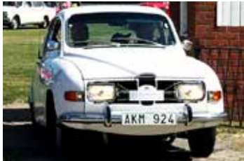
Saab V4, 1971