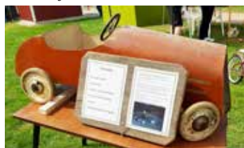
Trampebil från 1948