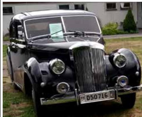
Austin 135 Princess 1952