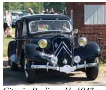
Citroën Berliner 11, 1947