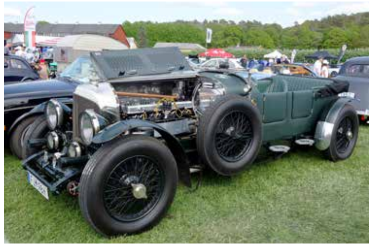
... väldigt fin Bentley Special LE Mans 8 från 1949.

Försedd med Sachsmotor och litet flak. Uppgraderad med blinkers och bromsljus. Enligt uppgift dålig balans vid kurvtagning i hög fart.