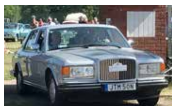
Bentley Turbo R, 1986