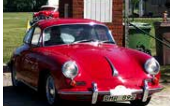
Porsche 356C, 1964