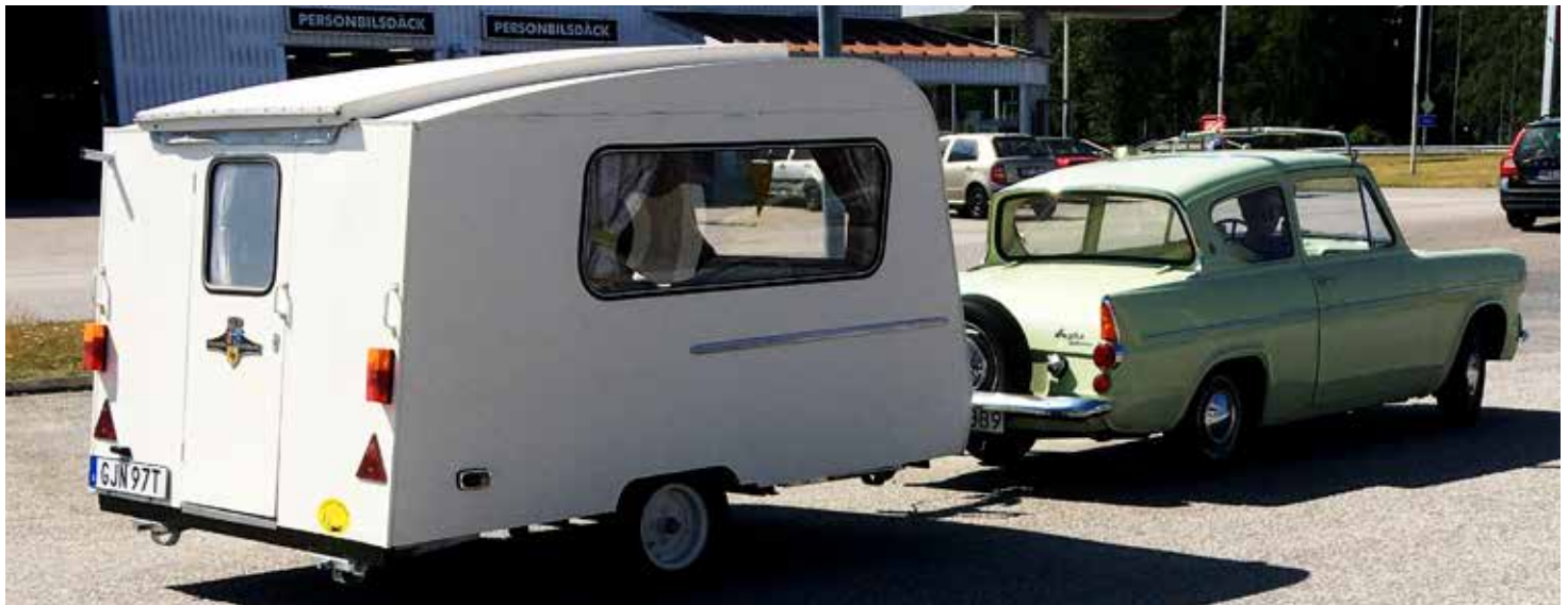
Ford Anglian från 1962 med husvagnen Kip Kuiken från 1965

Varje år anordnas Nostalgifestivaler runt om i Sverige med en härlig blandning av veteranfordon, musik, modevisningar och marknad. Vi brukar åka till Tångahed i Vårgårda med vår Ford Anglia -62. I år tog vi med oss vår nyinköpta husvagn Kip Kuiken -65. Vi importerade den från Holland förra året. Efter registrering och besiktning samt lite fix med inredningen blev den lagom klar till festivalen. Ford Anglia med husvagn är inget för de stora vägarna utan vi fick åka småvägar fram till Vårgårda. Det är väldigt praktiskt att köra med ett veteranequipe på dessa träffar då man kan få campa på utställningsområdet. Vårt största fokus vid dessa träffar