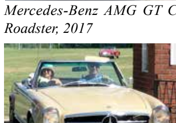
Mercedes-Benz 250SL 1967