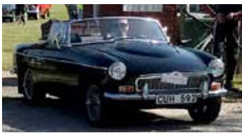
MGB 1800, 1970