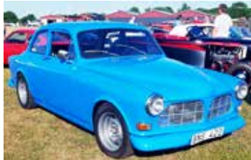
Blåast på träffen var en Volvo Amazon från 1966