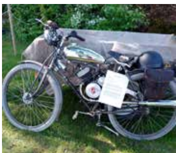
Lättviktare märket Blixt 1939

Massor av bilar, uppvisningsflyg, motorcyklar, traktorer, finbilar m.m som hittat in på området .