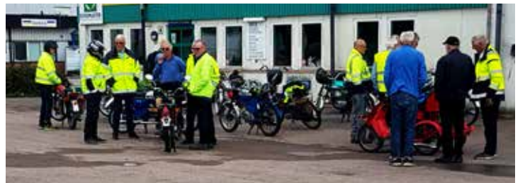
Mopedgänget färdiga för avfärd mot Solbacken i Edenberga