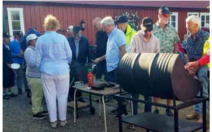
Det var mycket som skulle grillas samtidigt