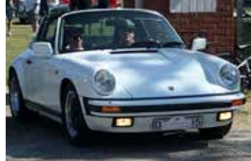
Porsche Carrera, 1989S