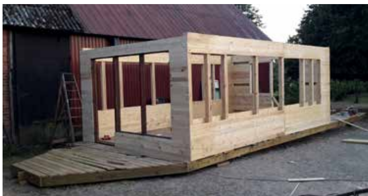
Båten börjar ta form, väggarna resta