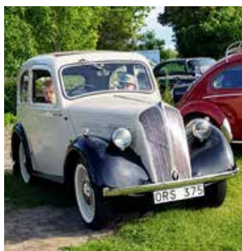
En mycket fint renoverad Standard Flying 9 från 1938