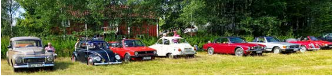
Några av HFV-bilarna på rad på Hembygdsgårdens gräsparkering

Det blev en trevlig dag i goda vänners lag. Vid 10-tiden samlades ett gäng HFV-are för att besöka Unnaryds stora marknad.