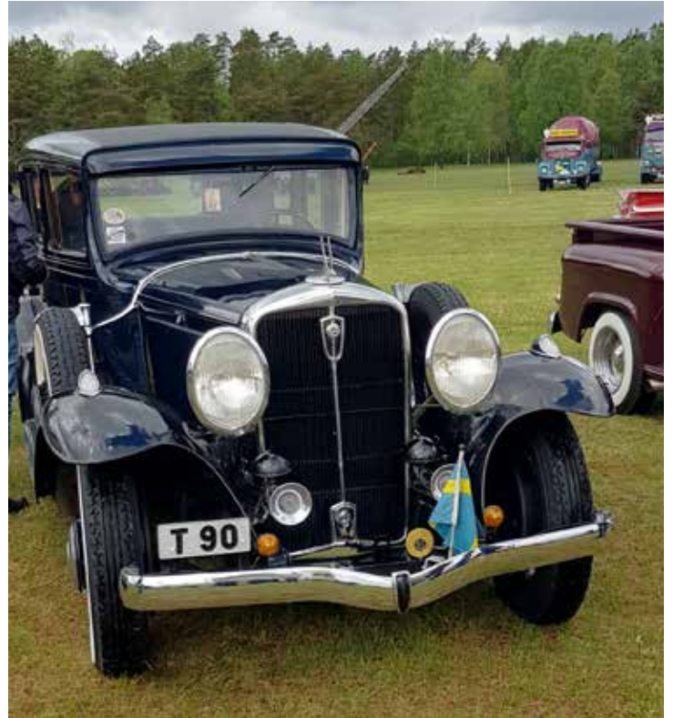
Studebaker Eight President från 1931 i fantastiskt skick