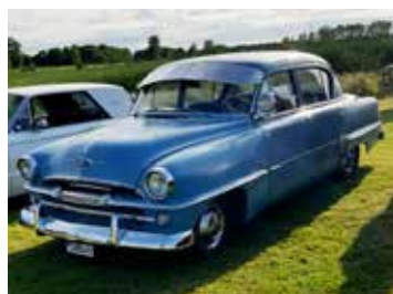
Plymouth P25 Savoy från 1954. En bil som aldrig var så vanlig på de svenska vägarna. Här ett välbevarat exemplar.