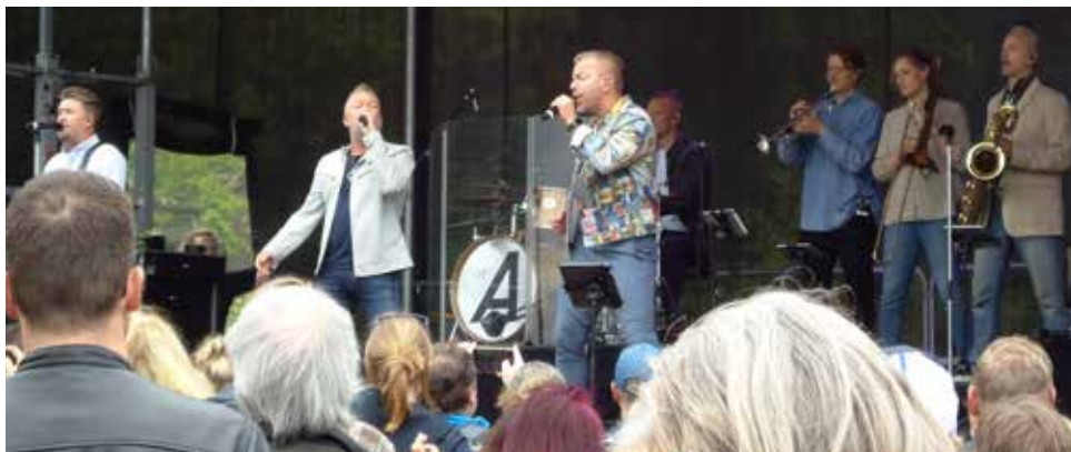
Arvingarna uppträdde vilket uppskattades väldigt av publiken