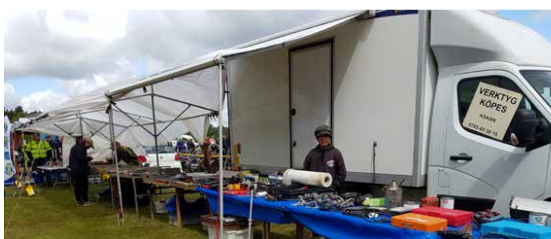
Marknadsknallarna hade det besvärligt med hårda vindar och återkommande regnskurar