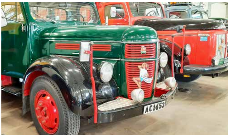
Förutom bilar, motorcyklar, mopeder och annat som låter fanns också en avdelning med tyngre fordon, lastbilar