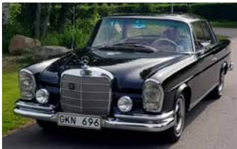
Först på plats var denna Mercedes-Benz 250SE från 1964