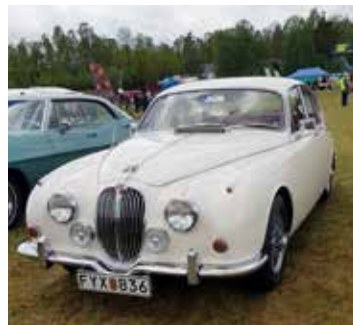
Jaguar MK2, 1968