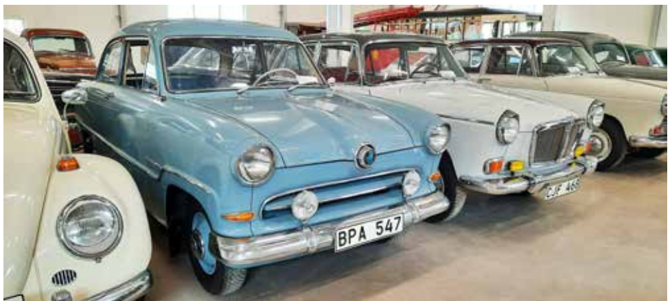
Populära fordon på 1950 och 60-talet. VW, Taunus 15 M, BMC av olika modeller