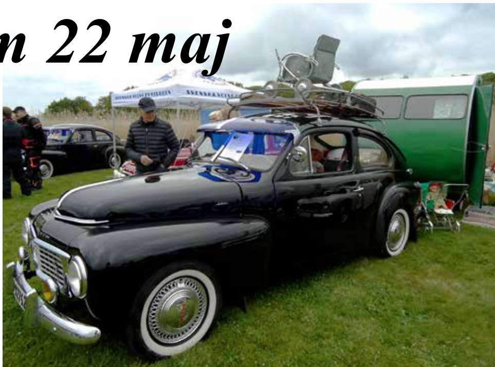
En äldre PV med tidig 50-tals husvagn med tidsenliga tillbehör. Kul att se!