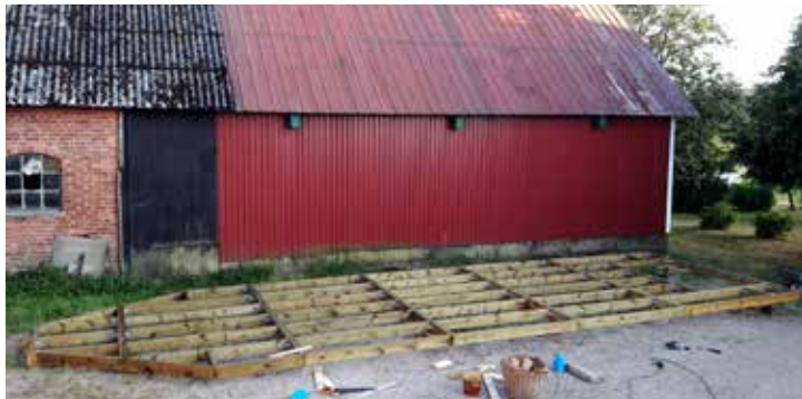
Bottenplattan formerad och uppreglad

Ingemar Birgerssons projekt - hjulångaren är sjösatt och färdig att användas. En mycket imponerande farkost!