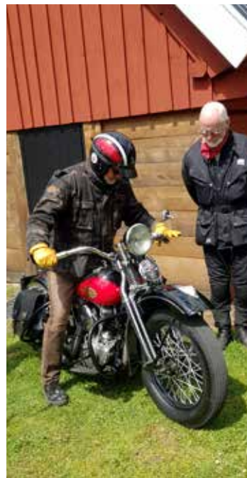
En Harley-Davidson från 1939 startar. Motorn med sitt karaktäristiska ljud fick många i publiken att lyssna lite extra och många kom också för att titta. Motorn har hela 60 hk vilket var väldigt mycket 1939.