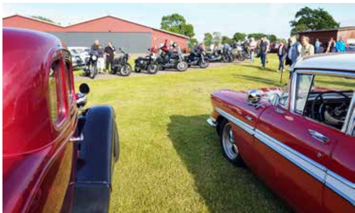
Här fanns inte bara bilar utan även många motorcyklar