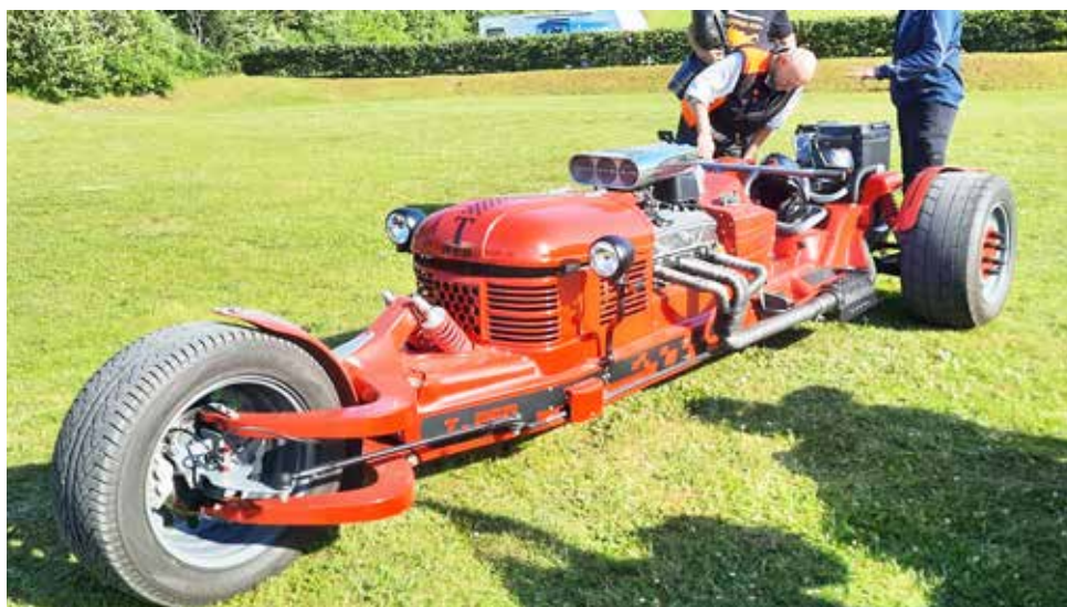
T-Röd från 2020. Tro det eller ej men den är registrerad som motorcykel

DIN KOMPLETTA KYLARVERKSTAD FÖR VETERAN KYLARE med 30 års erfarenhet