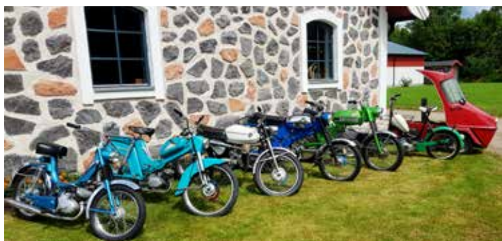
Leifs mopeder, längst fram en Crescent, Husqvarna, Fram King Speed, Puch Dakota, Zündapp Sport, två renoveringsobjekt