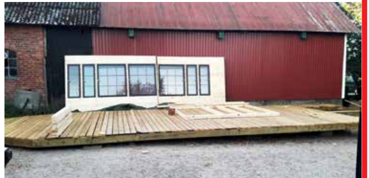
Bottenplattan färdig, fönsterpartier i bakgrunden