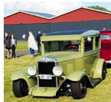
En riktigt "udda bil" som sjönk ner på marken vid parkering. En ombyggd Chevrolet Sedan från 1929