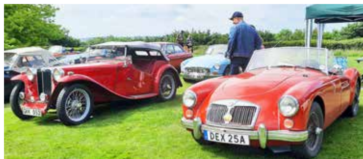
Bernt Aulins MG TB 1939 och Leif Appelbäcks MGA 1961

Speakern påtalade att hastighetsskillnaden mellan bilarna var ganska stor (C.a 250 km/