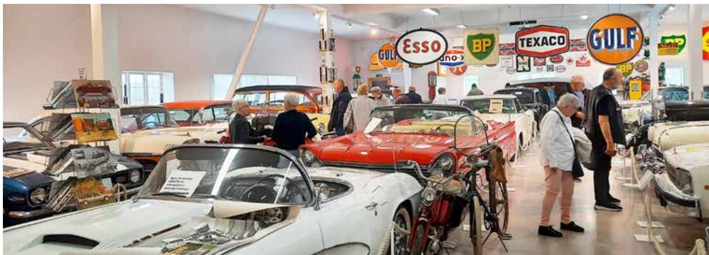
En mycket välstädad hall med mycket att titta på. Alla bilar välputsade och i körbart skick