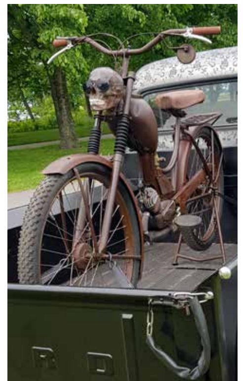
Om det händer något med bilen så kan mopeden användas för att hämta hjälp