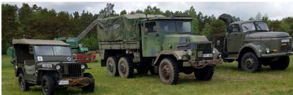
Willys Overland Jeep från 1944, Volvo 3154 (TL31) från 1957, Volvo 854 från 1963 och en militärambulans