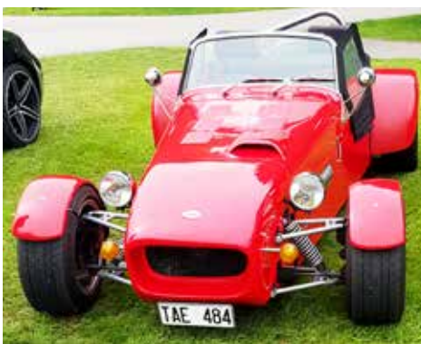
En VM 77 från 2002, eller ska man säga Lotus Super Seven?