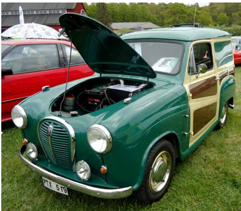
Austin A35 VAN 1957. Idag en extremt ovanlig bil