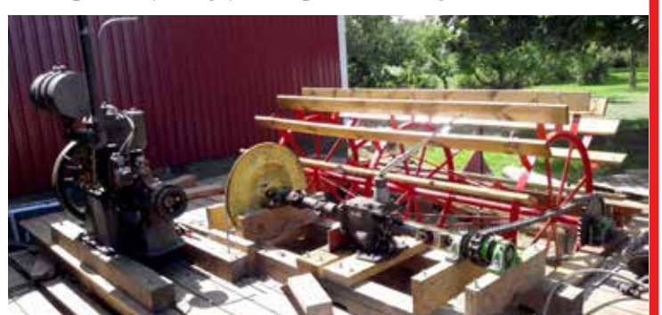
Motorn är en tvåcylindrig fotogenare ,sex hästkrafter av märket solo . Tillverkad i Borlänge av bröderna Skog 1931.