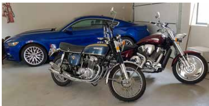
Leifs lite mer muskulösa maskiner, i bakgrunden en blå Ford Mustang Fastback 2.3 från 2017, längst fram en Honda CB 750 från 1971, den vinröda en Honda VTX1800C från 2006