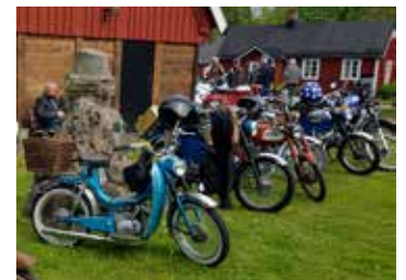
En hel del mopeder, ja ganska många hade hittat till Klippans Hembygdsgrd denna dag. Nostalgiskt och väckte minnen från tonårstiden.