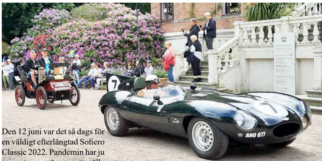
Rundkörning, Jaguar D-type och Autoseums uråldriga bil

Den 12 juni var det så dags för en väldigt efterlängtat Sofiero Classic 2022. Pandemin har ju tvingat arrangörerna att ställa in de tre föregående åren. Nu var det äntligen dags.