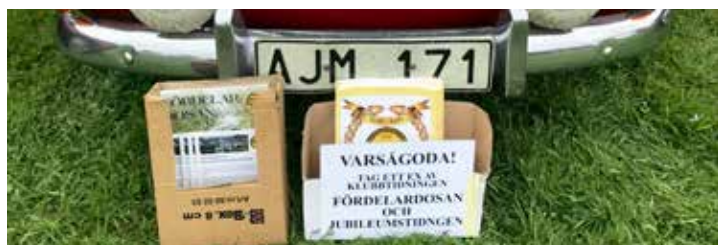
Sven-Erik och Gerd hade ställt fram lådor med Fördelardosan och HFV-broschyrer som snabbt tog slut.