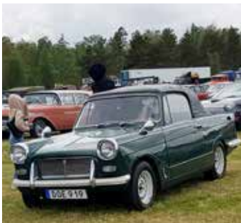
Triumph Herald Cab, 1966