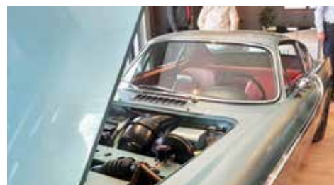
Leifs elmotorförsedda Volvo P1800 väckte stort intresse