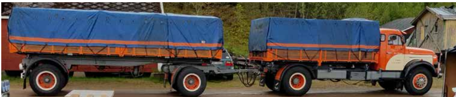
En riktigt lååång låååångtradare