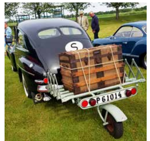
Volvo PV 444A från 1947 försedd med "dragspelssläp" vilket var ganska vanligt i början av 1950-talet