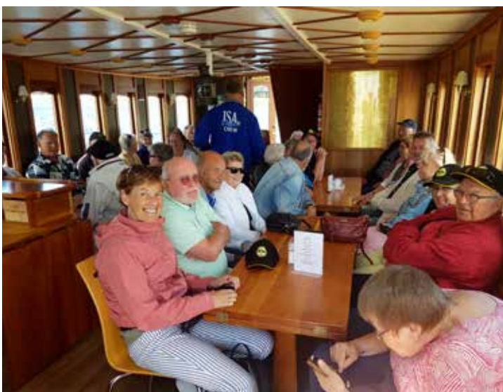
Det blev härligt trångt när 39 personer tog plats i Isa af Lygnerns salong. Det blev så trångt att redaktören fick sitta ute i fören på båten. Bästa utsikten men också blåsigast.

Lunchen intogs kl 13 på Folkes Restaurang i Sätilla och började med bröd och grön röra, mycket gott men svårt att avgöra vad det egentligen var. 18 personer hade valt kummel som huvudrätt och 23 viltfärsbiff med potatismos, lingon och gräddsås. Alla verkade nöjda och belåtna och efter kaffet var det dags att ta plats i bilarna igen för att köra ner till stranden och parkera. Då det blåste var det inte så många badgäster vilket underlättade parkeringen.