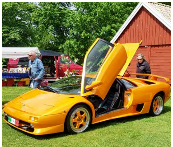
Nyaste och troligen snabbaste bil på utställningen var denna Lamborghini med en 12-cylindrig 5,7 liters motor. Bilen designad av Marcello Gandini.