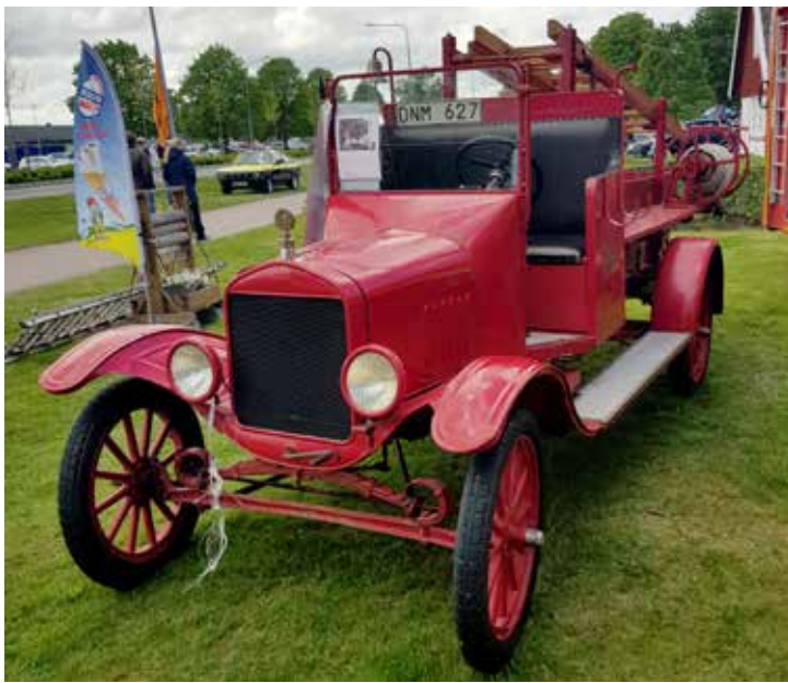
Äldsta bruksfordon var en Ford T från 1925 som Klippans kommun köpte in som brandbil. Den har två växlar och toppar 70 km/tim