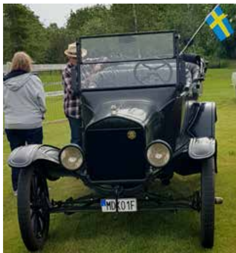
T-Ford från 1923, äldst i startfälet