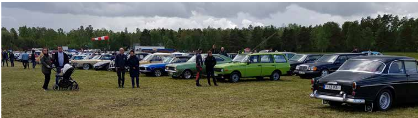
Bilar så långt kameraögat nådde, ja här fanns nästan hur många som helst, av olika årsmodeller och fordonstyper