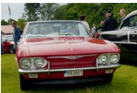
Chevrolet Corvair 1965, en amerikansk bil med motorn bak