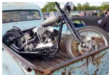
Alltid bra att ha reservfordon med om något skulle hända. På flaket stod en ombyggd Harley Davidsson