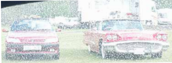
Utsikt genom rutan under en regnskur. T.v. Peugeot 306 Cabriolet från 1994, t.h. Ford Thunderbird 1959S