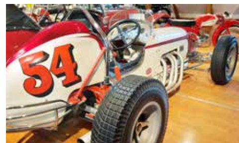
En racerbil modell äldre fanns också att beskåda