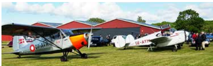
Flygplan, bilar och MC delade på parkeringsplatserna