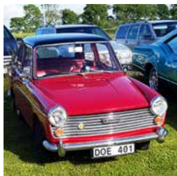
Austin A40 från 1962. En mycket vanlig liten bil på 1960-talet men nu finns det nästan inga kvar. Kul att få se ett så fint exemplar