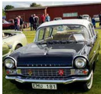
Det är minsann inte var dag man får se en Vauxhall Cresta 4D Sedan från 1968 i ett så här fint skick.