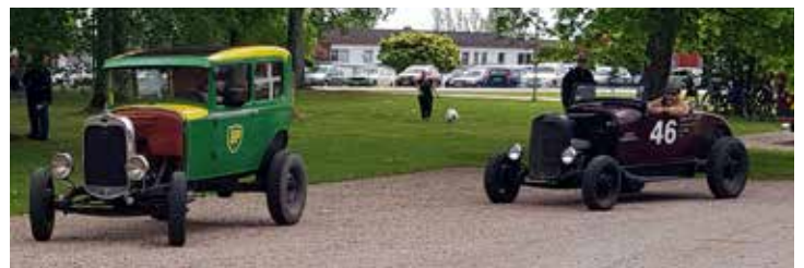
Två riktigt udda ekipage dök upp strax efter lunch. Den gröna är en Ford från 1931 med originalmotor på 27 hk. Nr 48 är en Ford A, 1929, också den försedd med originalmotor på 39 hk