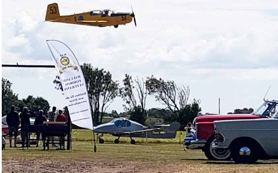
Ett av Safirplanen "fångat" under start. Inte så nära och lågt som fotot ger intryck av

Fredagen den 15 juli var en mycket blåsig dag men som tur var blåste vinden i banans riktning vilket underlättade för de 5 piloterna i sina Saab Safir. För att se när planen startade och landade hade 24 HFV-bilar kommit till Larslanda. Efter starten flög planen till Falkenbergs Motorbana där de hade en uppvisning för Wheel and Wings publik.