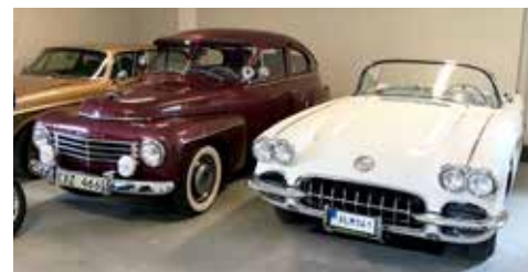
Volvo PV 444 1953 (röd), Chevrolet Corvette 1959 (vit)