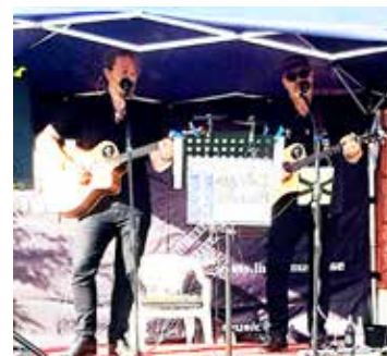
Orkestern Linys, en fantastiskt duktig duo, spelade och visade prov på en mycket varierande repertoar med tyngdpunkt på 1950 och -60 tal. Mycket trevlig orkester som skulle passa bra även vid HFVs rally