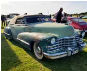
En sliten Cadillac Series 26 Convertible från 1947