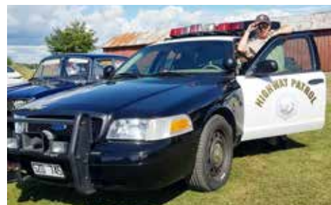
Ford Crown Victoria 2007. Komplet polissbil med ägare i sheriffkläder. Stiligt ekipage. Ägare Mariette Rosander