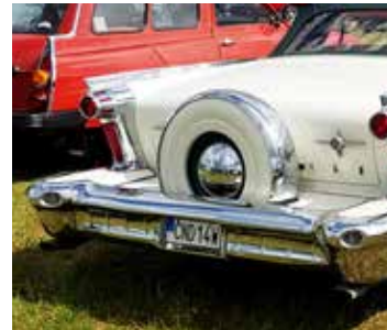
Oldsmobile Super 88 1958 försedd med ordentlig "badbrygga"