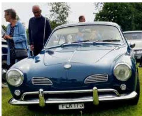
Karmann Ghia 1960