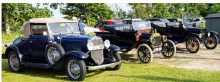
Naturligtvis fanns här också riktigt gamla bilar att titta på och beundra, närmast en Chevrolet Cabriolet Special från 1931, Ford T från 1914 och längst bort en något modernare Ford