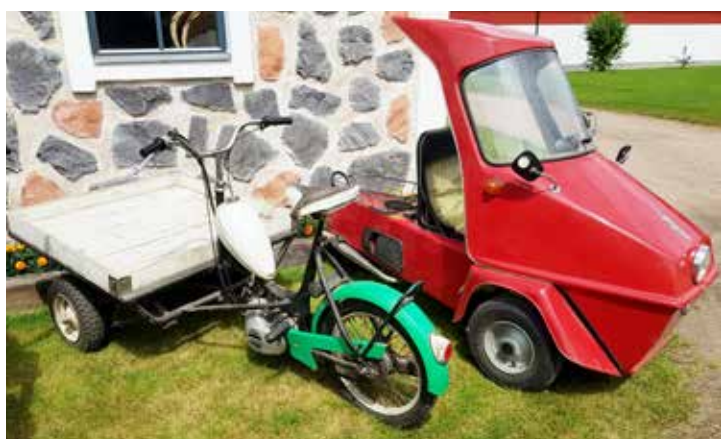
2 lite udda mopeder som står på Leifs renoveringslista