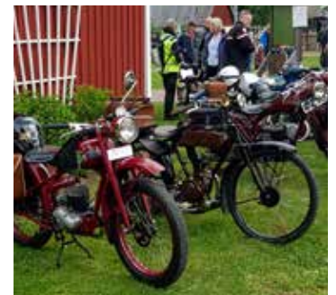
Ett helt gäng MC från 1930-talet upp till 1950-talet hade samlats på en egen liten yta. Närmast en Rödqvarna och sedan syns en Rex.