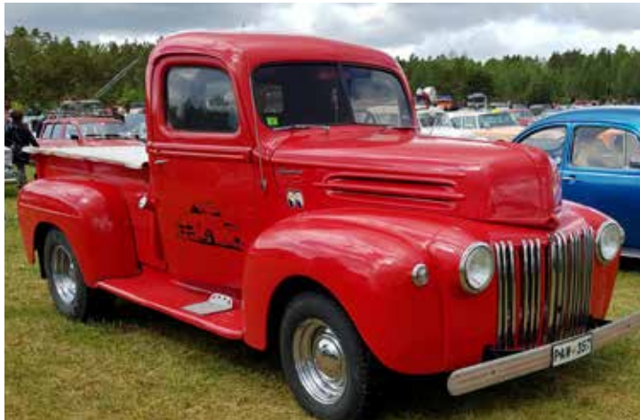
En läcker Ford Pick UP från 1946 i nyskick