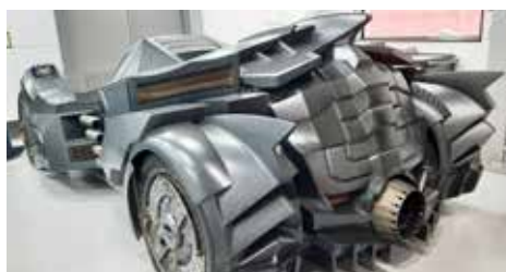
Vilken ”seriefigur” är tänkt att köra denna futuristiska skapelse?

Här fanns mycket att se t.o.m. en gammal fullt fungerande smedja från ”anno dazumal” med fortfarande fungerande maskiner. Men.. man kunde inte ha brått på den tiden. Allt fick ta sin tid.