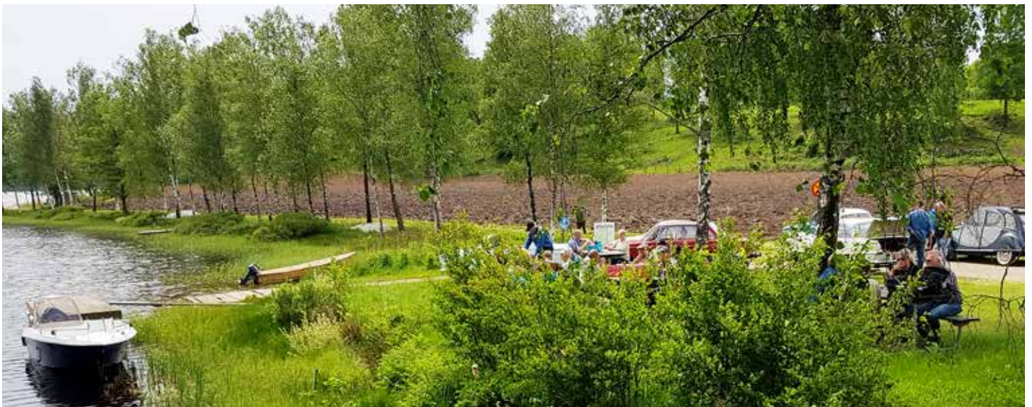
Den populära rastplatsen vid sjön i närheten av Karl Gustavs kyrka där kontroll 3 var placerad