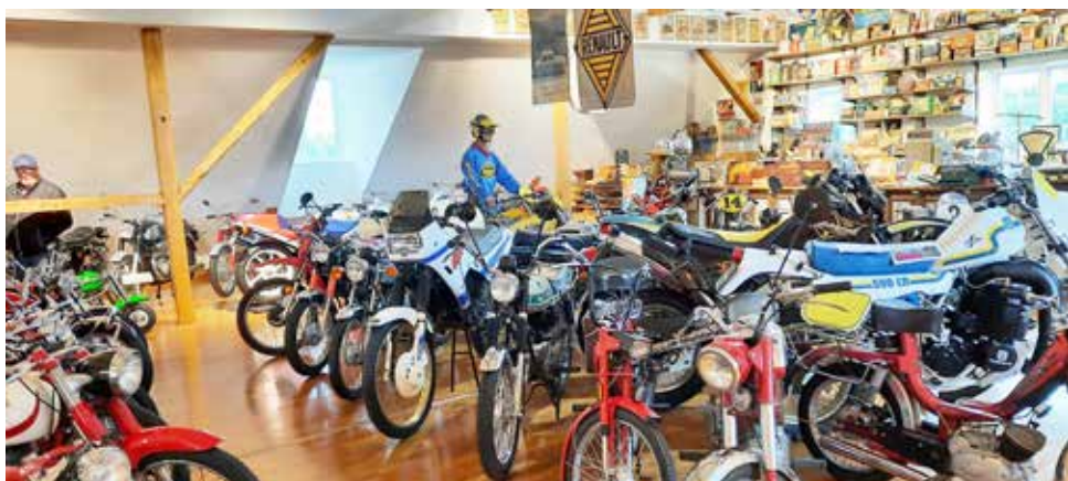
Det var trångt på avdelningen för tvåhjulingar