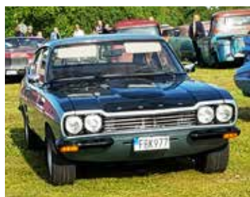
Europas svar på Ford Mustang, Ford Capri GT 2300 1973