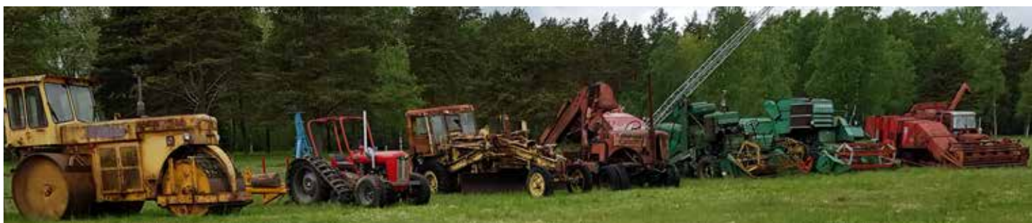
Arbetsmaskiner i långa rader