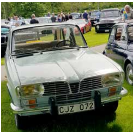
Renault 16 R, 1968. Modellen blev årets bil 1966 och var en av de allra första halvcombibilarna. Mycket vanlig på de svenska vägarna under 1960-80 men då de var lättrosta försann flertalet.