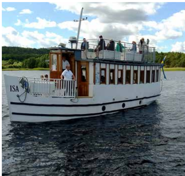
Isa af Lygnern.

Efter angörande av bryggan var utflykten slut och deltagarna körde mätta och belåtna hem fyllda av både kaffe, mat och upplevelser.