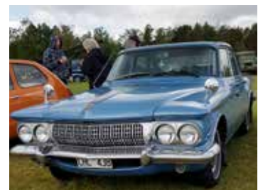
Dodge Lancer 770 Sedan 1962. En raritet numera. Fanns även som polisbil under 1960-talet.