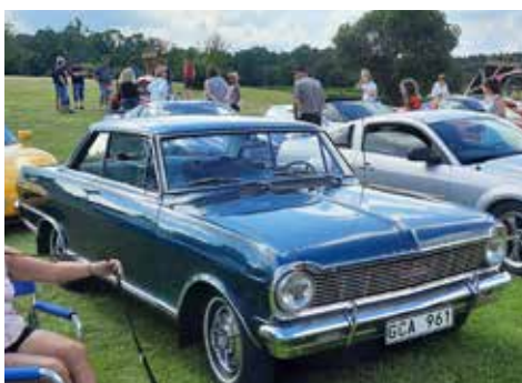
Arnes Chevrolet Nova 1965