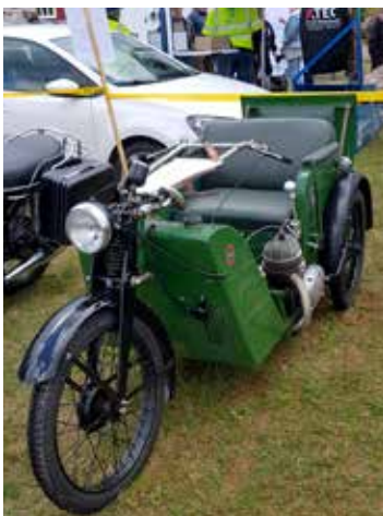
Meyra 48 årsmodell 1951