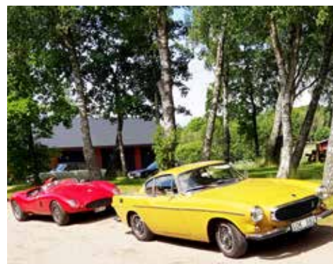
På bilden Hasse Nilssons gula P1800 från 1970 och bakom Göran Lundahls röda replika Ferrari 375 Plus från 1954

PA Bilmäklarna • Gränsvägen 7 • 312 60 Mellbystrand • 070-6241136 Bilar i lager: www.pabilmaklarna.se