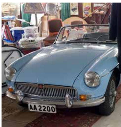
Prinsessan Christina köpte denna MGB den 25 maj 1965 och behöll den i 3 år.