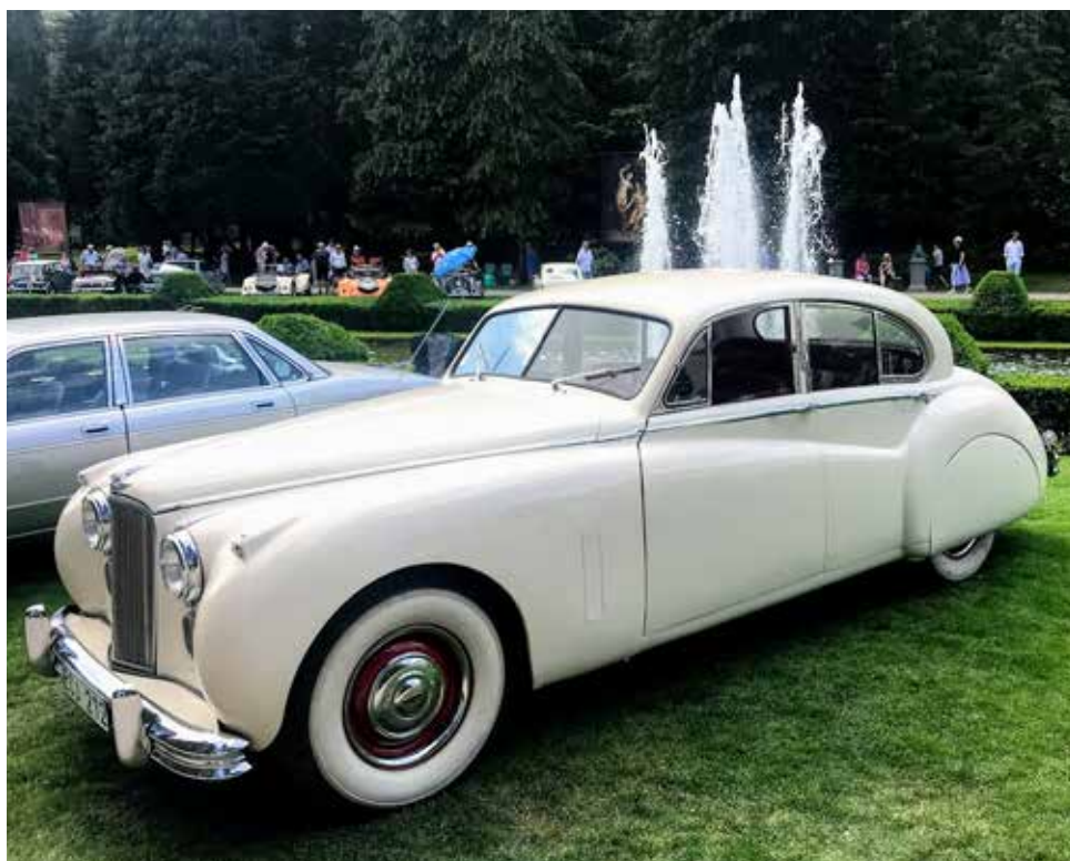
Jaguar MK VII 1954. Manuell växellåda, 160 hk.