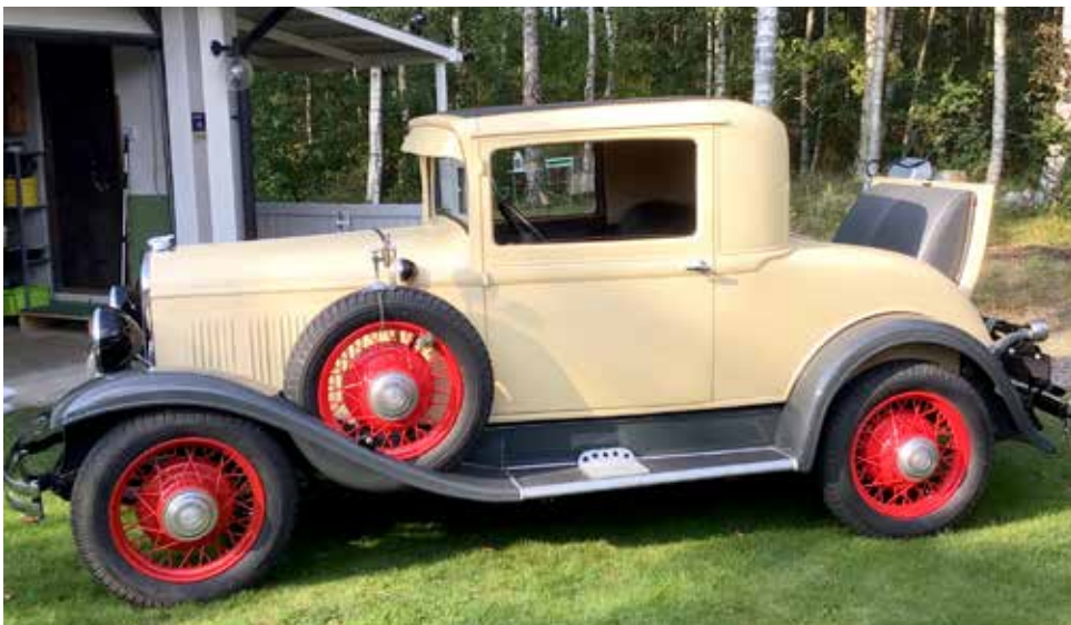
Chrysler cj coupe 1930. 3205 cc och 70 hk.

Vi får ett bidrag tillbaka i år på 19314 kr en vinst på 3990 kr