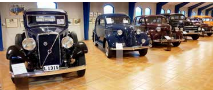
Volvo PV 658, 1935. Tillverkad i 301 ex. 6-cyl, 3670 cc, 80 hk Volvo PV 53, 1939. Tillverkad i 1204 ex. 6 cyl, 3670 cc, 86 hk Volvo PV 60 1946. Tillverkad i 3006 ex. 6 cyl, 3670 cc, 86 hk Volvo PV 831 1954. Tillverkad i 4135 ex. 6 cyl, 3670 cc, 90 hk