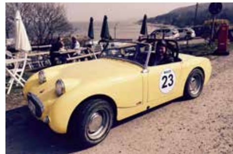
Austin Healey Sprite "Frogeye"