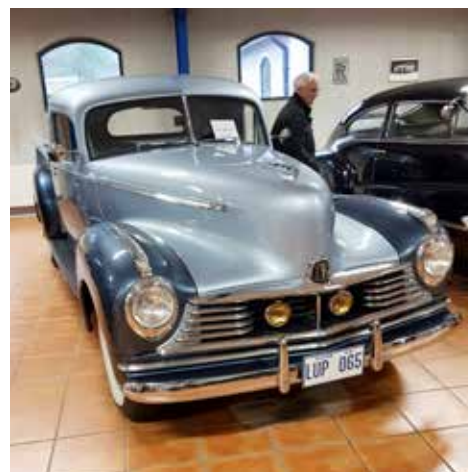
Hudson Super 6 Series 58 från 1946. En lätt lastbil, 102 hk