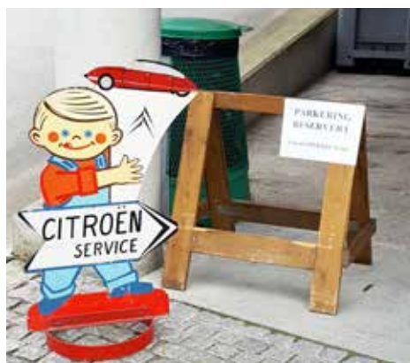
Med tungan rätt i mun

På söndagsmorgonen åkte vi mot Trollstigen vilket betydde ännu fler körningar upp och ner för bergen.