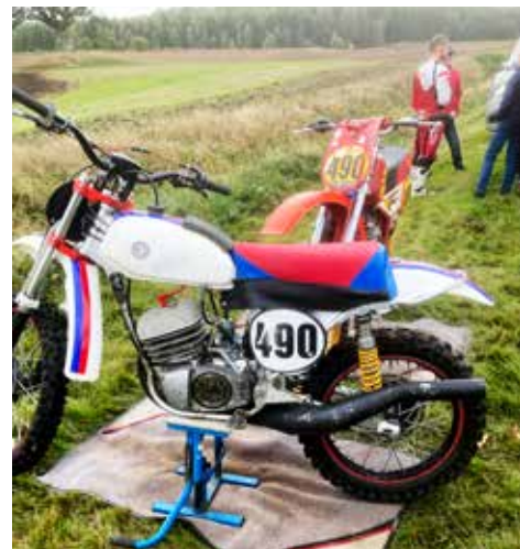
Maico, en tysk 2-takts motocrosscykel som tävlade under 1970- och 80-talet. Fanns med motorer från 250-490 cc