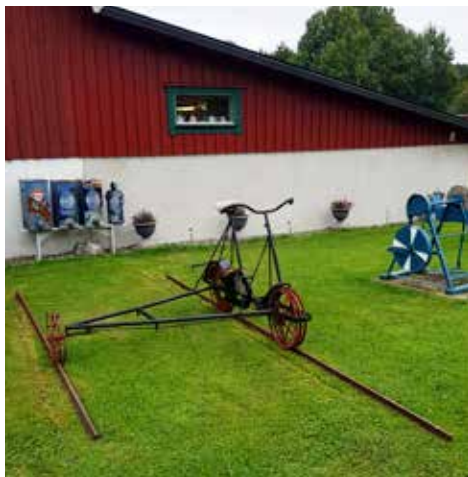
En bredspårig cykeldressin

Det fanns naturligtvis också tändkulemotorer av olika slag. En startades och den gick med exakt 375 varv/minut och drog ca 6 dl diesel per timma. Något för miljöpartiet att titta på?