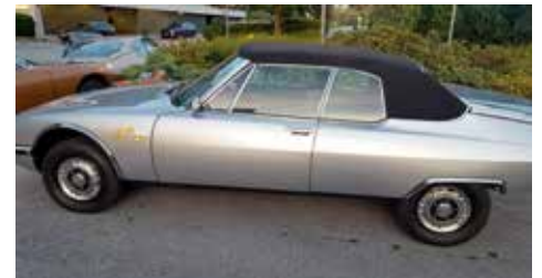
En mycket ovanlig SM Cabriolet framme vid Alexandra hotell i Loean.

Efter trollstigen hade vi en lång resa tillbaka till Lilleström för att övernatta sent söndag kväll.