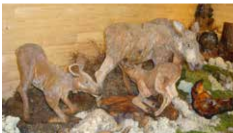
Utställningsalster Unos djur.

över dalen. Här är det nog fint även på vintern med den branta backe som börjar här på toppen.