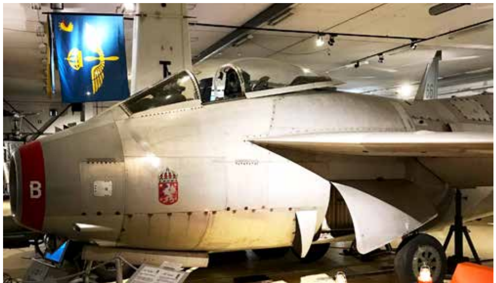
Den som en gång sett J 29-an på nära håll förstår varför den kallades flygande tunnan

Nästa till talarstolen var en fd fältflygare från Östersund som berättade flera flygminnen med Tunnan. Särskilt kom jag ihåg och när en grupp Tunnor skulle flyga till Milano via Marseille över Belgien. En Tunna rapporterade bränsleproblem och blev beordrad att gå ner i Liege med