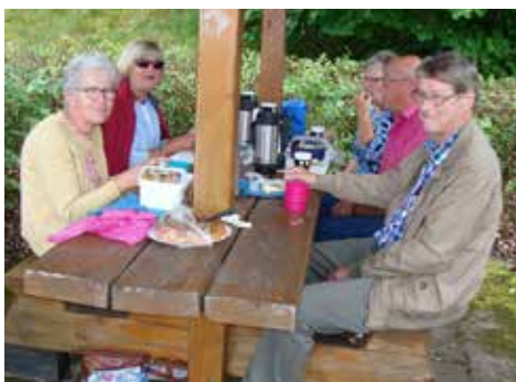
Första fikapausen vid Häggån

Vid Häggåns rastplats stannade vi för en efterlängtd medhavd fika. Vädret var lite höstligt med ett heltäckande molntäcke, men lagom varmt och lite blåst med tanke på att vi alla har SD (självdrag) i våra bilar.