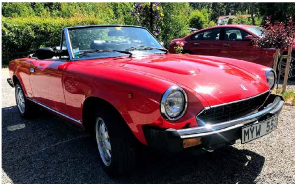
Pininfarina 124 DS 1985. Manuell växellåda, 105 hkr