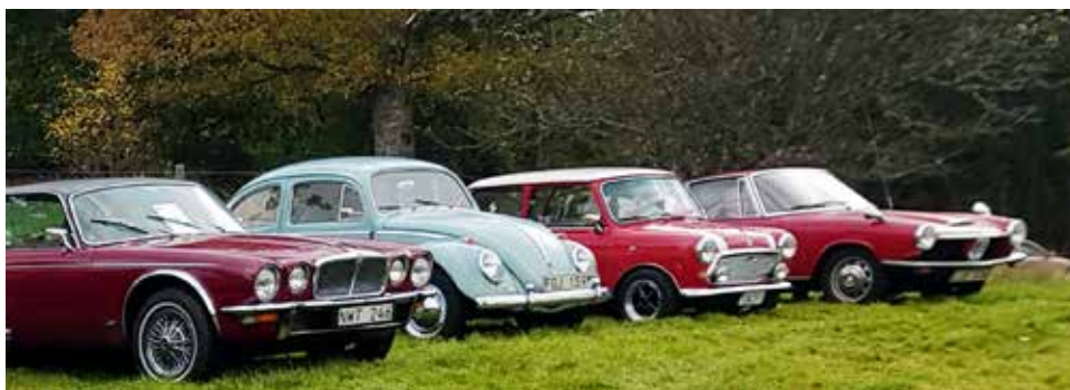
Från vä Jaguar XJ46 Coupé -75, VW-61, Mini 1000-77, BMW 1600 GT Coupé -68

mer om bilen än vad som stod på lappen i vindrutan. Den kanske äldsta moderna bilen på träffen var nog en Volvo PV 444 från 1947 försedd med tidsenligt solskydd.