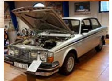
Volvo 242 GT 1978. 4-cyl, 2127 cc, 123 hk