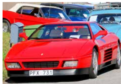
Ferrari 348 TB 1992. Klassisk italiensk sportbil med manuell låda och 286 hk

För er som inte tidigare har haft förmanen att närvara vid någon av dessa