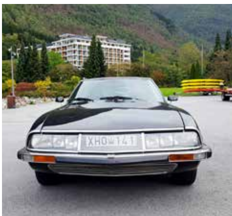
En bild framifrån vid hamnen och med hotellet i bakgrunden

till att skaffa fram en eller två begagnade baklampor.