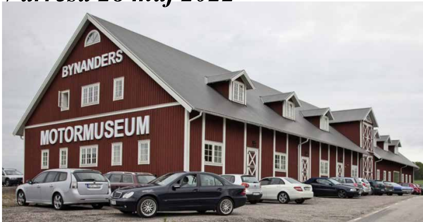
Bynanders Motormuseum i Svenljunga