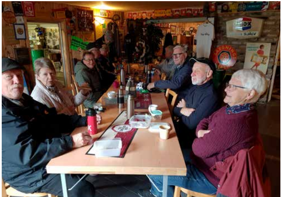
Efter rundturen på "Farmen" smakade det gott med det medhavda fikat