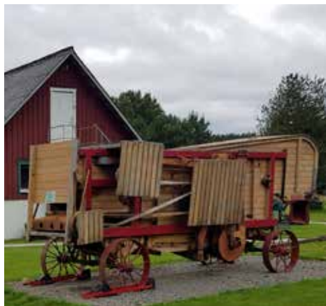
Skördetröska anno dazumal