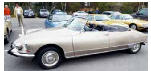
Det kom inte bara SM-bilar, här en riktig skönhet, en cabriolet.