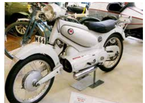
Motom 98, ovanlig motorcykel från 1956. Italienska Motom byggde lätta MC, fick inte väga mer än 75 kg, kunde köras här i Sverige av 16-åringar med körkort för lätt MC. Data, 98 cc 4-taktsmotor med liggande cylinder och överliggande kamaxel, 7 hk. Generalagent Svecia-Motor i Stockholm.