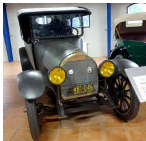
Kissel Kar 6-42 1916. Tillverkad i 21503 i olika modeller mellan 1907-1931. 6 cyl 32 hk