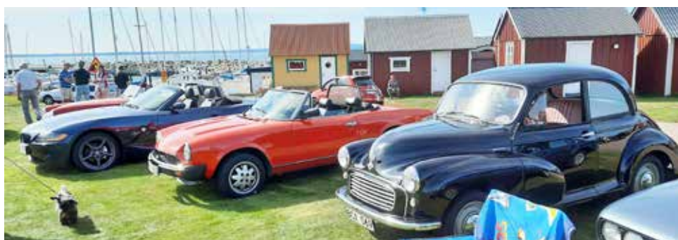
HFV-bilar, Morris Minor 1958 och Pinin Farina 1956