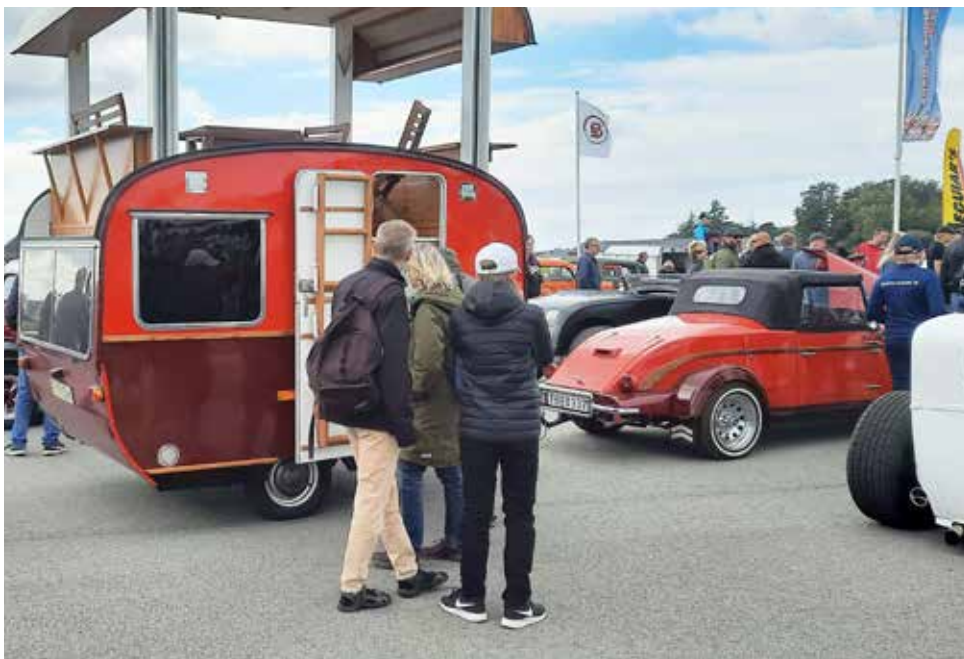
En extrautrustad liten husvagn väckte stort intresse bland åskådarna

DIN KOMPLETTA KYLARVERKSTAD FÖR VETERAN KYLARE med 30 års erfarenhet