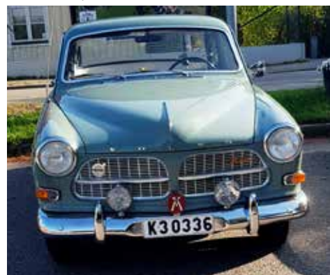
Volvo Amazon 1962