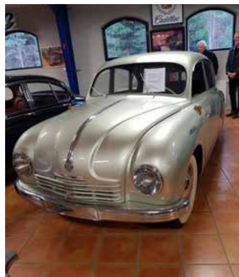
Tatra T 600 Tatravan 1952. Tillverkad i 6342 ex mellan 1949-1952, 4 cyl, 1952 cc