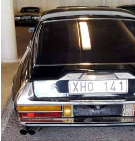
Bilen efter den provisoriska lagningen av baklampan