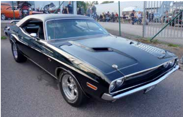
Dodge Challenger 1970. Mums! En av de snyggaste muskelbilarna som byggdes runt 1970.