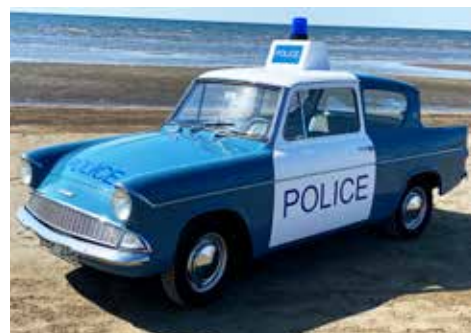
Ford 106 E Anglia 1963. Manuell växellåda och 39 hk