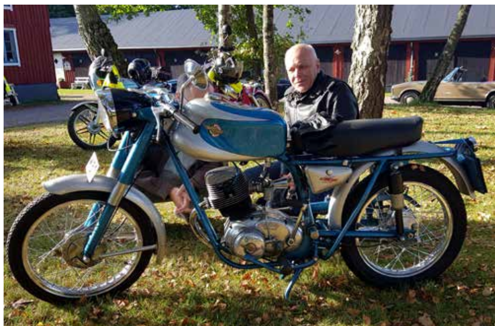
Ducati 85 Sport Special 1960, en riktig raritet på de svenska vägarna