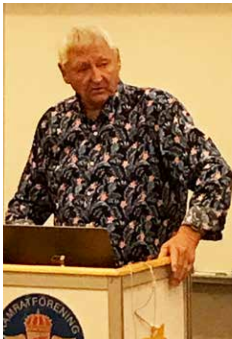
OS-mästaren i pistolskytte och fältflygaren Ragnar Skanåker

ett följeplan. Ett enkelt fel, korrosion i ett relä så det var bara att fortsätta flyga men istället för att flyga i vinkel så flög man rakt mot Milano och följaktligen var man framme före resterande gruppen. "Hur har ni flugit" frågade gruppleadaren och fick till svar att flygningen gick över Schweiz. Så gick det till på den tiden då kunde man överflyga utan tillstånd.