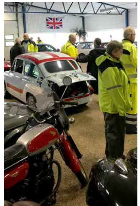
Inne i museet fanns det mycket att titta på

När vi löst entrén så var vi 24 stycken som välkomnades av Ingemar Gustavssons broder. Ingemar dök upp strax före vi skulle lämna. Väl inne i hallen blev jag helt begeistrad av vad som fanns här, nämligen ett sextiotal veteranbilar av diverse slag. Vad som mest föll mig i ögonen var att få återse en Fiat Abart i tävlingsskick med den karakteristiska öppna bakluckan. Det var helt otroligt vad man gjorde med dessa bilar. Enligt generalagenten så var Fiat 500 utrustad med en motor av effekt 15 till 17 hk och