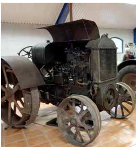
Munktells traktor 2-cyl vertikal tändkulemotor