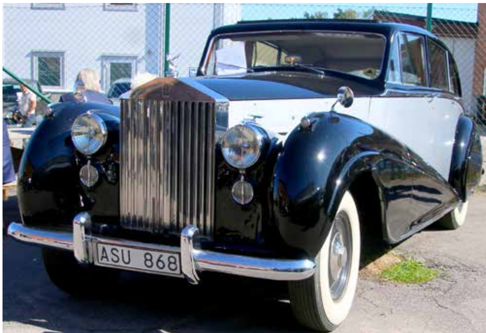
Rolls-Royce 1950. En flerfärgad klassiker

För den som ville kunde man under träffen vara delaktig vid lite pågående arbeten med bilar som lämnats in för ser-