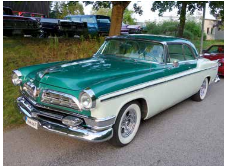
Chrysler New Yorker från 1955 i absolut toppskick! En riktigt snygg bil!