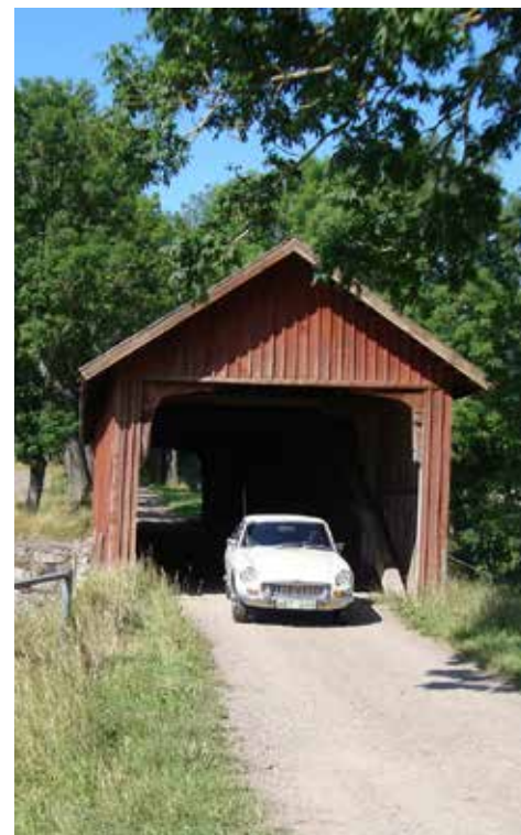
Den numera privatägda träbron i Vaholm

Efter en övernattnig på Hotell Östermalm åkte vi till Kornettgården. Här finns många prylar och inredningar från anno dazumal och som påminner om barndomen.