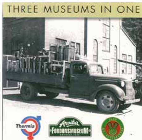
Reklam för museet