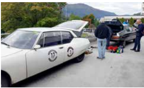
Här får jag hjälp med att montera nytt bakljus så att bilen blir laglig igen.