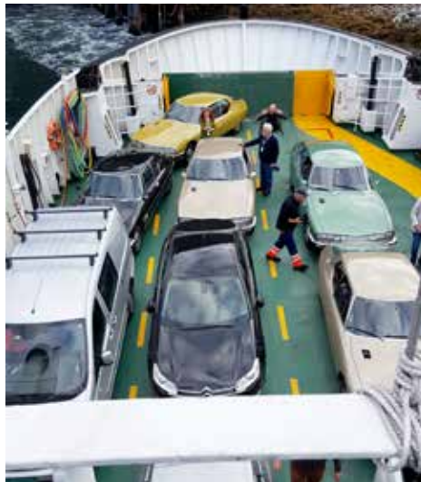
Ombord på färjan

Tillbaka nere på havsnivå var det Citroën-service!