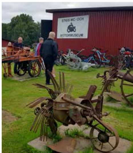
Många gamla jordbruksredskap fanns utställda på gården