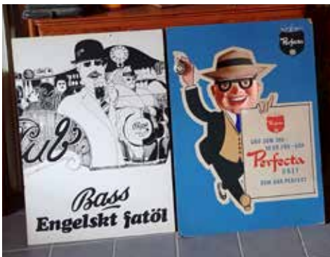
Många roliga skyltar