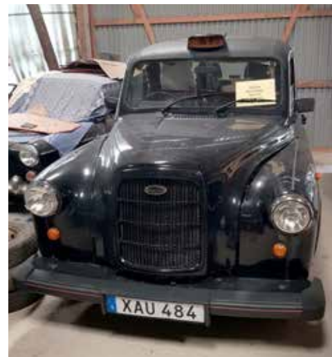
En äkta Londontaxi gömmer sig i den låsta ladan. Det är en Carbodies Fairway från 1997 försedd med en 86 HK dieselmotor