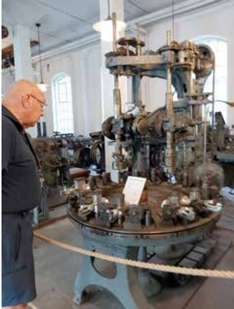
Husqvarnas köttkvarnskarusell