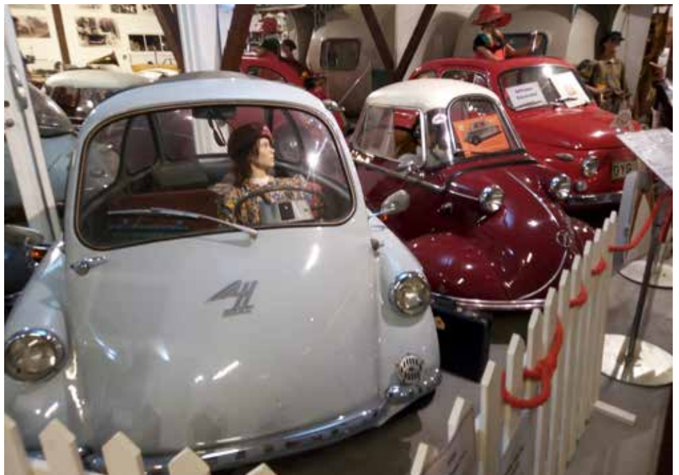
Motala motormuseum.