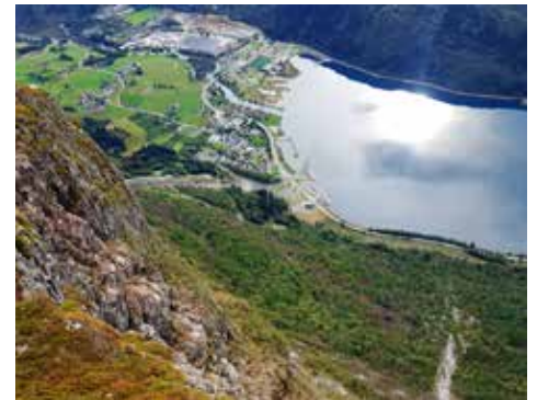
Utsikten från linbanan

Efter Lunchen i Geranger bar det upp i berget och ner till en färja där betalningen gick till så att de tog bilder på regnumret och sen skickar de en räkning (ingen räkning har kommit än 30/9)