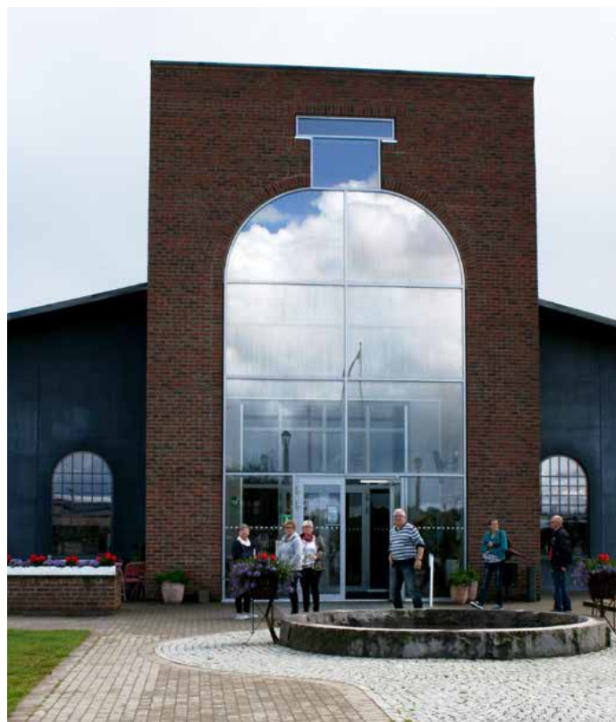
Glasets Hus i Limmared (ser ni flaskan?)

Tillbaka i Mellbystrand mellan kl 18-19.