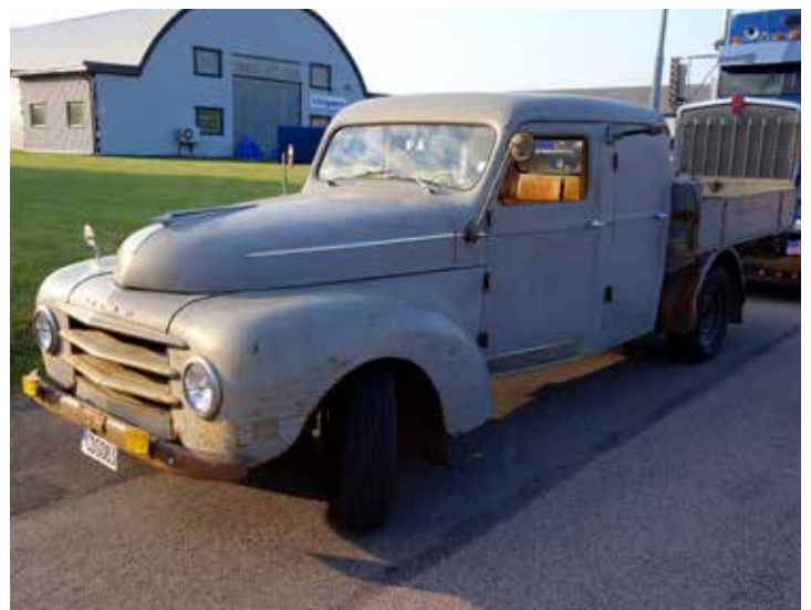
Volvo PV 834 från 1956. Det är kul när det dyker upp bilmodeller som man aldrig har sett förut. Här kom det en i bra bruksskick.