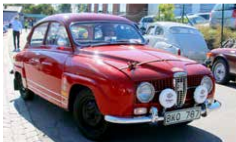
Saab 1966. Sista årsmodellen med 2-taktsmotorn. Denna bil ombyggd till Sport

vice eller renovering. Mycket intressant och lärorikt. Det fanns även möjlighet att få sin egen bil kontrollerad kostnadsfritt vid träffen, men då måste den anmälas till detta i förväg.