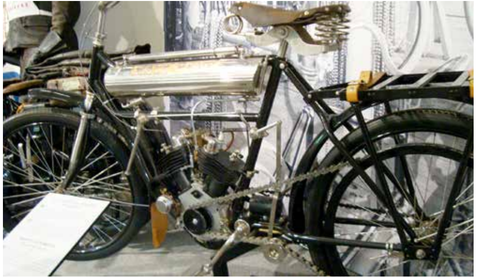
Husqvarnas första motorcykel 1903.