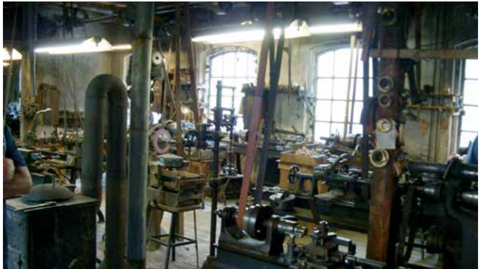
Hylténs industrimuseum.