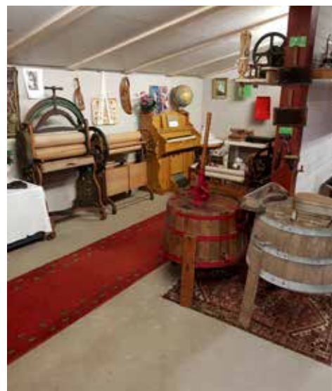
När man ser den här miljön inser man att allt inte var bättre förr

även om det skulle börja regna. Det är god kundservice!! Efter att medtagetet fika intagits så passade många på att beställa våffla med sylt och grädde. I museet fanns det inte bara MC och mopeder att titta på det fanns också en uppbyggd miljö och mängder med vardagssaker. Utomhus hittade man allehanda äldre jordbruksredskap och även lite järnvägsnostalgi, på en bit gräsmatta var räls utlagd för att härbärga en cykeldressin. Nästan allt framkallade nostalgiminnen hos besökarna, som t ex "En sådan moped hade jag, min pappa hade en sådan motorcykel, en sådan här höräfsa har jag använt när jag var ung". Ja, kommentarerna och minnena blev många och gjorde också att vi alla lärde känna varandra lite bättre.