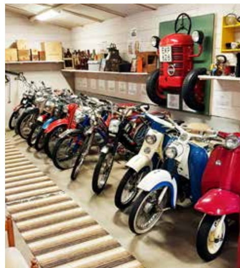
Mopeder och skotrar i långa rader

frågade om det var möjligt att komma på lördagen var svaret, "självkärligt är ni välkomna, har ni eget fika med, inga problem ni får gärna sitta i trädgården". Vad roligt med så positiva människor! Då regn var ett realistiskt hot hade museet t o m satt upp ett tält där de ställt bord och stolar så att vi kunde sitta torrt och fika