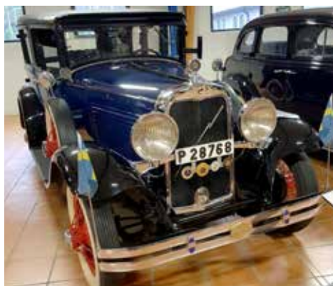
Marmon Roosevelt 1929 8-cyl, 3306 cc, 68 hk