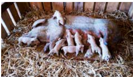
Utställningsalster Unos djur.

Efter ett läskande besök på Herrljunga Cider gick färden till Billinge hus där vi hade vår första övernattnig. Från vårt hotellrum var det en fantastisk utsikt ner