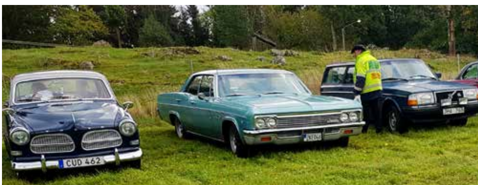
Från vä Volvo Amazon -59, Chevrolet Impala -66, Volvo 245 -82

Då det var lite småkyligt i luften denna oktoberdag (inget regn men blåst) fick kaffekorgarna stanna i bilarna och vi nöjde oss med fiket vi kunde både få och köpa i cafeterian. Vi ses igen i april.