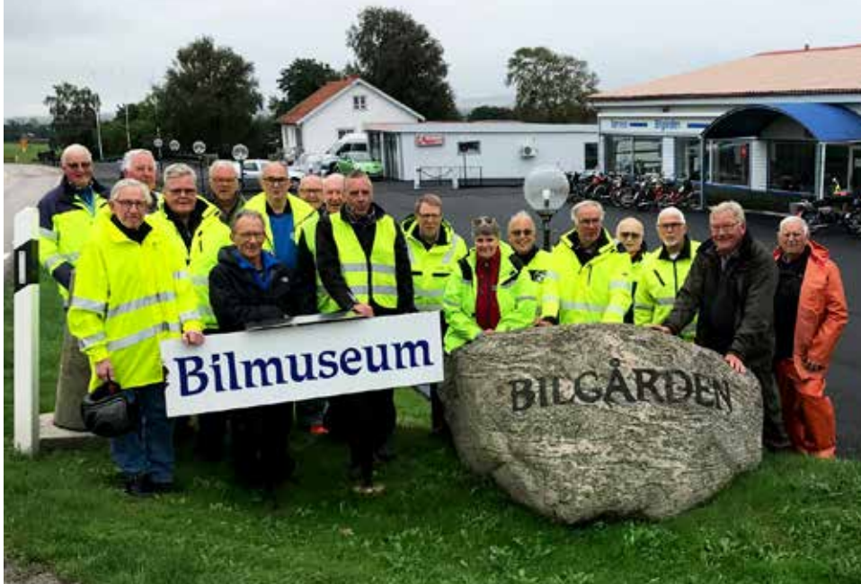
Hela moppegänget samlat framför stenen som fungerar som reklampelare