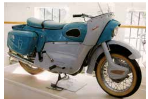
Ariel Leader 250 cc från 1960. 2-cylindrig 2-taktsmotor. Denna var nog ett sista försök att rädda detta märke, men tyvärr lyckades det inte.