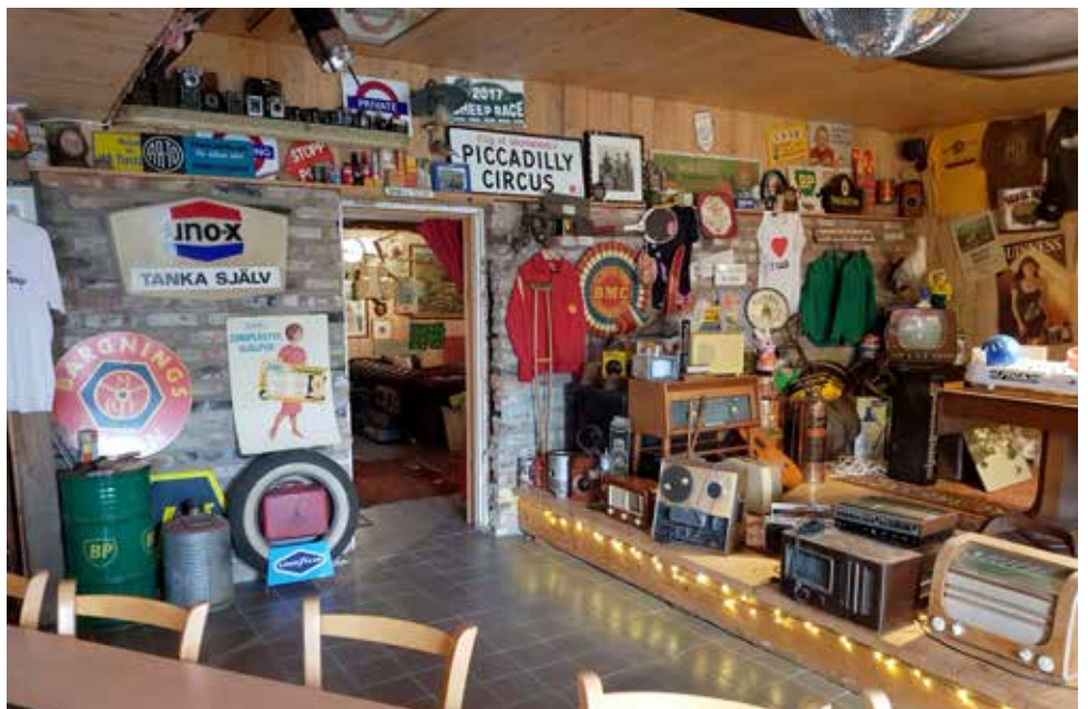
Så mycket att titta på. Janne är en samlare av det mesta och att gå runt väcker många minnen och nostalgiska hägkomster hördes ofta från HFV-arna