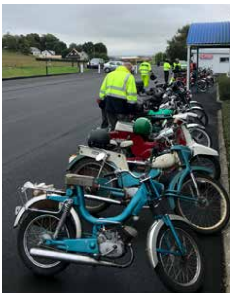
Det blev en lång rad med mopeder