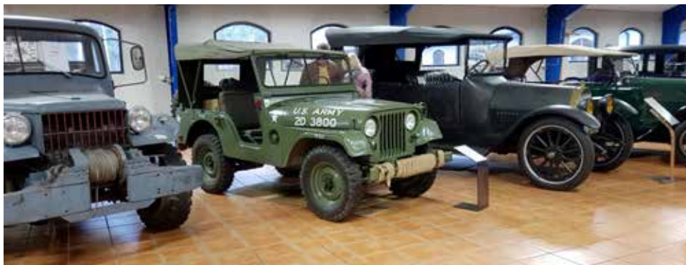
Jeepar av olika fabrikat och årsmodeller