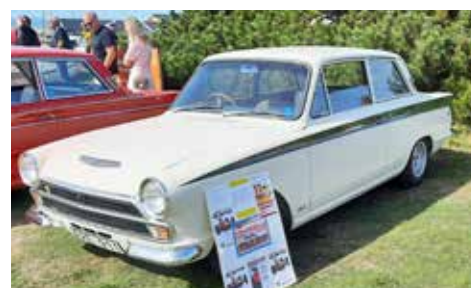
Cortina Lotus 1965

Ett underbart väder att strosa runt bland bilar och Mc, träffa gamla och nya bekantskaper och inte minst smaka på det medhavda kaffet som vissa förutseende hade tagit med sig. Efter några timmar i