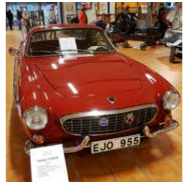
Volvo P1800 1964. 4-cyl, 1778 cc, 108 hk