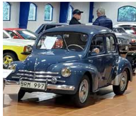
Renault 4 CV R 1062 S 1958