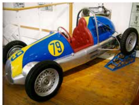
Effyh 500 Midget racer 1952. Formel Midget var en populär tävlingsklass under 1950-talet. Effyh-bilen byggdes av Folke och Yngve Håkansson i Malmö. Den är utrustad med en Jap 500 cc motorcykelmotor; motorerna fick ha max 500 cc. Flera tillverkade motorer, t.ex. Jap, Norton Manx, SRM med flera. Jag såg dessa Midgetbilar under 1950-talets Väst kustlopp.