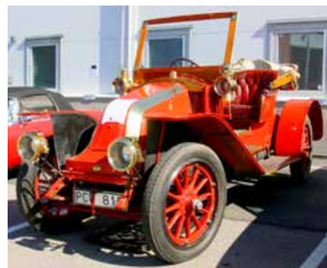
Renault 1908. 2-sitsig cabriolet med 2-cylindrig motor på 1066 cc och 8 KW.