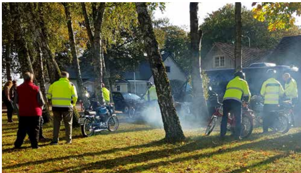
När moppegänget lämnade låg blåroken tät över nejden