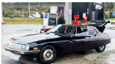
På Nordby tankar vi med eftersom jag hört att bensinen ska vara DYR i Norge.

Vi tar en paus i Nordby shoppingcenter. Det är dit alla normmän åker för att handla i Sverige.