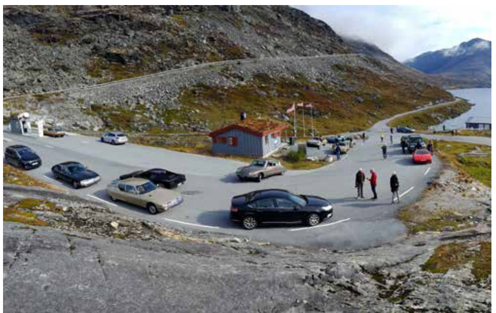
I väntan på att åka upp till Dalsnibba.

På lördagen hade vi fria aktiviteter. Vi valde att åka linbana 1000 meter upp i berget!