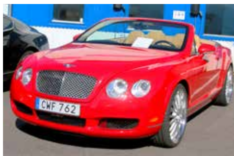
Bentley Continental GTC 2007. En engelsk superbil med automatlåda och 560 hk