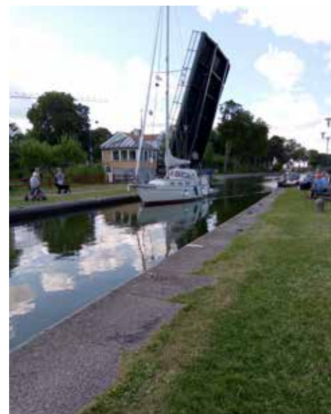
Broöppning Göta Kanal.