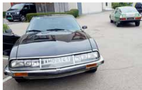
Avfärd från hotellet i Lilleström

Väl inne i Norge slipper vi regn och kommer till Lilleström tidigt på eftermiddagen på torsdagen.