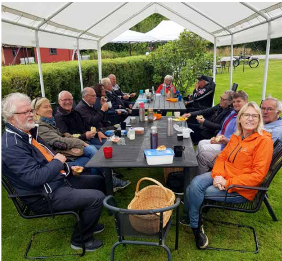
Även om det inte regnade valde HFV-arna att fika under tältduk