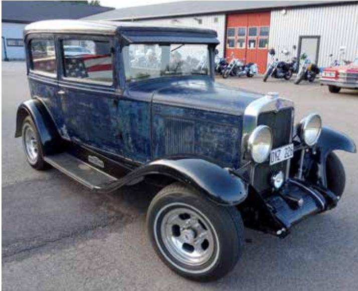
Chevrolet 1930, snyggt patinerad i fint "bruksskick.