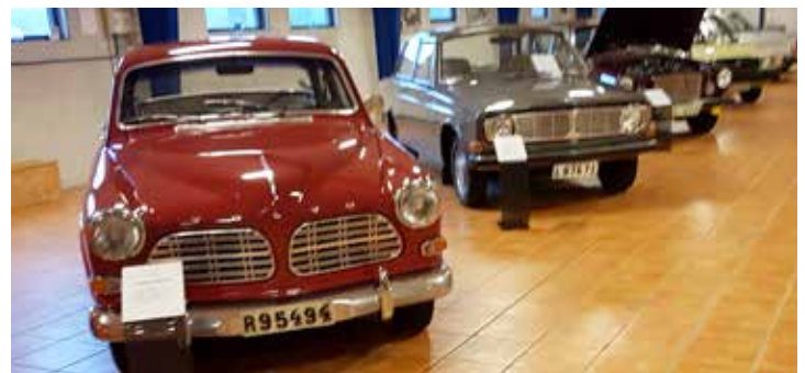
Volvo Amazon 1968. 4-cyl, 1986 cc, 90 hk Volvo 142 1968. 4-cyl, 1800 cc, 75 hk Volvo 1964 1970. 6-cyl, 2978 cc, 145 hk