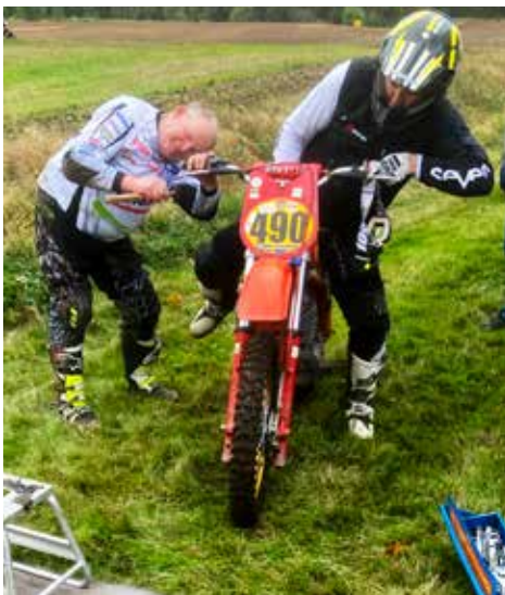
Några små justeringar före start. Här är det gashandtaget som åtgärdas.