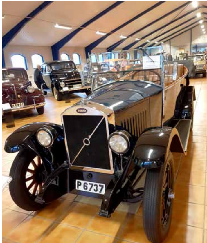
Volvo ÖV 4 1927. 4-cyl, 1944 cc, 28 hk. Tillverkad i 996 ex 1927-1929

När man kommer in i museet ser man Volvo, Volvo och ännu flera Volvomodeller men fortsätter man längre in upptäcker man att museet innehåller mycket mer än Volvobilar. Här finns MC, jeepar, traktorer, europeiska och amerikanska bilar. Alla fordon i hallarna är eller görs körbara. Att kunna gå runt fordonen och se dem ur olika vinklar höjer verkligen upplevelsen på detta fina museum