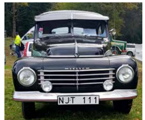
Volvo PV 444 från 1947

mer om bilen än vad som stod på lappen i vindrutan. Den kanske äldsta moderna bilen på träffen var nog en Volvo PV 444 från 1947 försedd med tidsenligt solskydd.