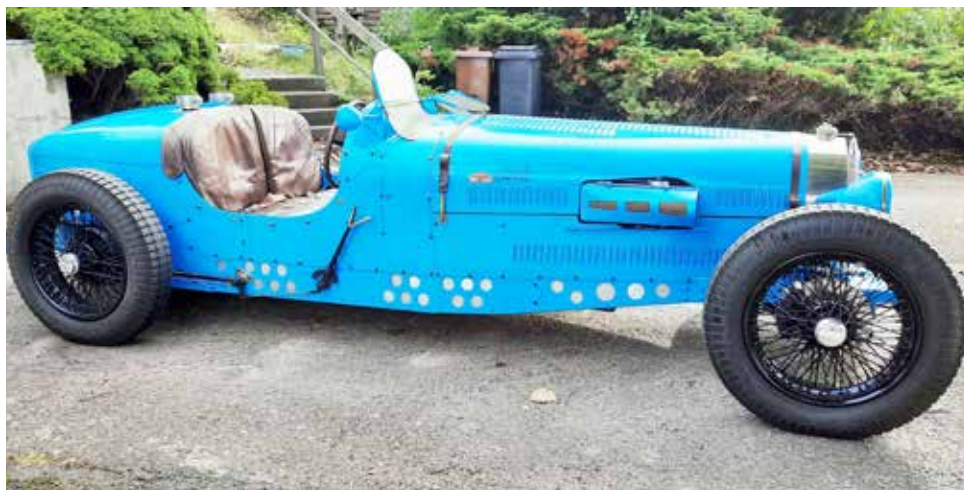
Teal Bugatti Modell 59, replika årsmodell 2017

Efter att ha sett denna ovanliga bil på några bilträffar, och pratat med ägaren kände jag att denna bil och byggare borde presenteras för HFV's medlemmar i Fördelardosan.