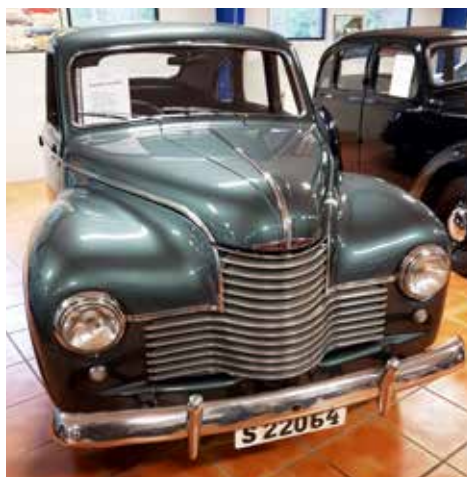
Jowett Javelin 4-cyl — 1953. En ovanlig och avancerad brittisk 50-talare