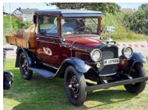
Ford A Pickup 1929

Efter att ha fått positiva vibbar från väderpresentatörerna på fredagskvällen inför prognoserna för söndagen så beslöt vi oss, tre HFV:are, att ta en tripp till Vejbystrand och årets sista veteranbilträff. Sommar månaderna kör man denna träff den första söndagen i varje månad. Detta var alltså den sista för året om man inte lägger till en till eftersom man missade de första för året.