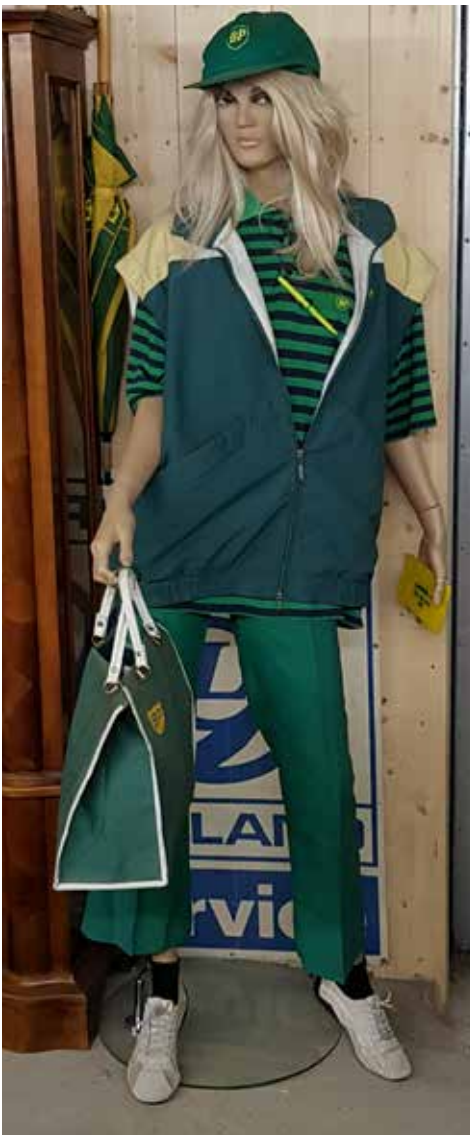
BP (British Petroleum) syns överallt på "Farmen", här en stylad docka