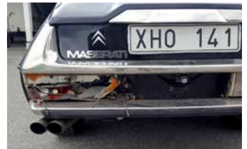
trasig baklampa efter påkörning

Efter en fika skulle vi börja färden mot Loen över en massa berg, men innan jag kommer utanför parkeringen känner jag en rejäl knuff bak i bilen och en annan SM-ägare har kört på min bil bakifrån.