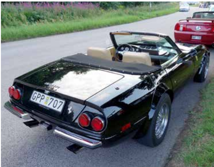
Chevrolet Corvette 1969. Nu tror ni väl att jag har tappat allt vett och sans. Det ser ju vem som helst att det är en Ferrari Daytona. Men så är det faktiskt inte. Det fanns ombyggnadskit att köpa, för att bygga om en Corvette till en av de snyggaste Ferrarimodellerna någonsin, Daytona. Mest känd är den nog för att den användes flitigt i TV-serien Miami Vice på 80-talet. Denna bilen är dessutom ett ovanligt fint exemplar!