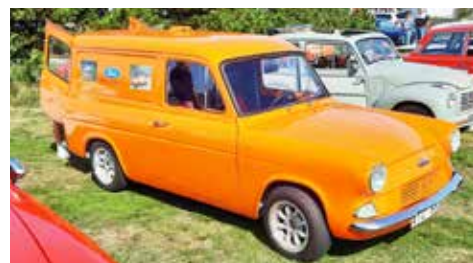
Ford Anglia skåpvagn 1965