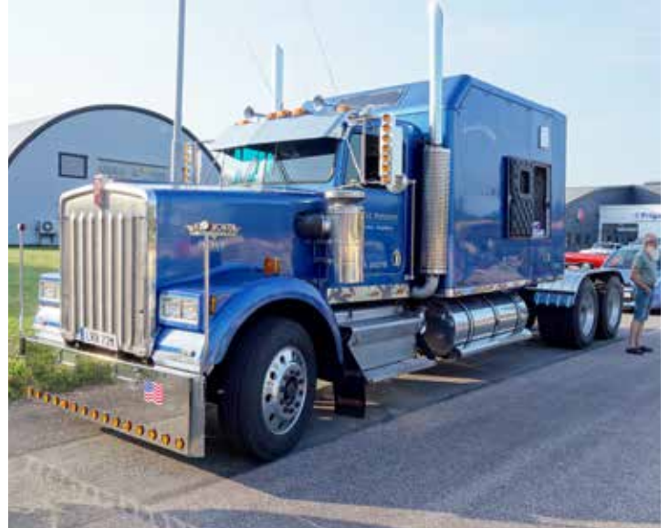
Big toys for big boys. Mycket större leksaker än så här får man leta efter. Kenworth från 1985.