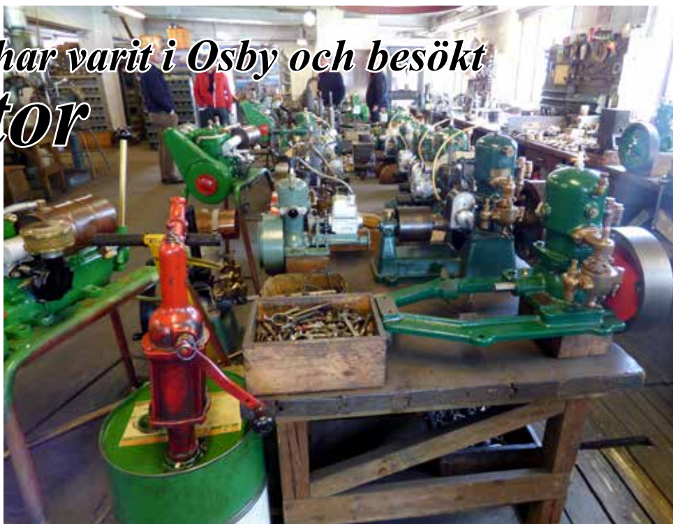
Det är ett imponerande antal båtmotorer som visas i den gamla maskinverkstaden