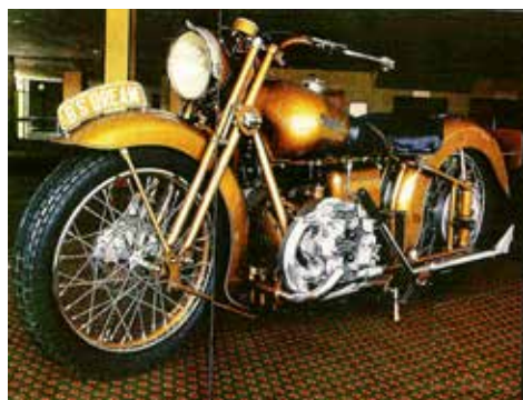
En mäktig Brough Superior 4-cylindrig 1000 cc från 1959