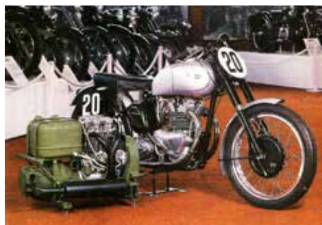
Triumph GP 500 racer från 1948 bredvid ett militärt elverk som var grunden till GP-motorn.