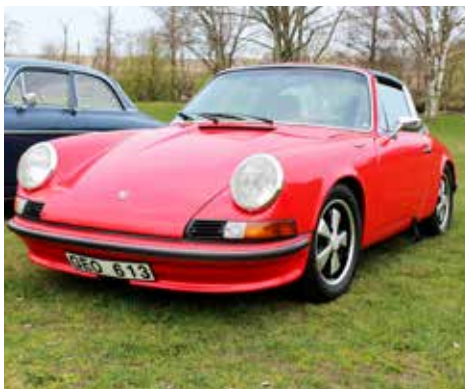
Porsche 911 Targa 1972