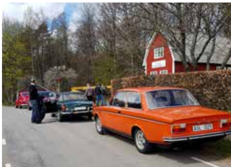
Rallykommittén vid Ästad skola

parkering inne på museets område men bäst är att parkera längs vägen.