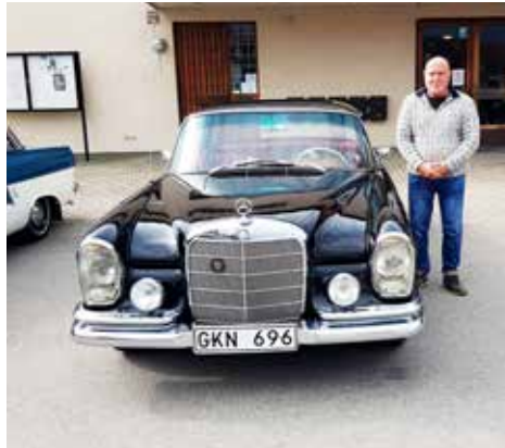
Mercedes-Benz 250 SE 1966. Ägare Jan-Uno Hjelm. Långås