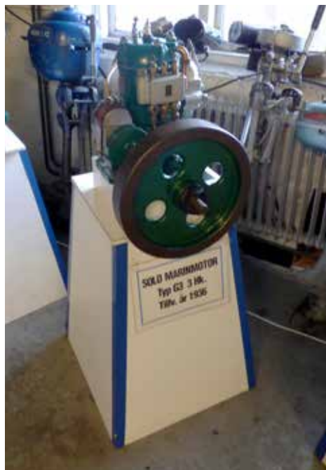
Solo Marinmotor tillverkad 1938