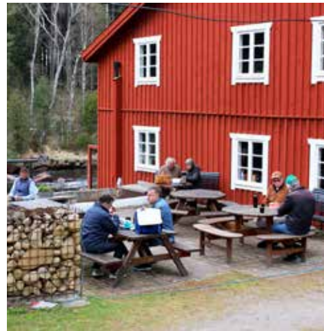
Fika intogs vid kvarnen i Knäred