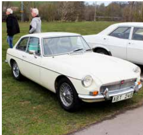
MGB GT 1969