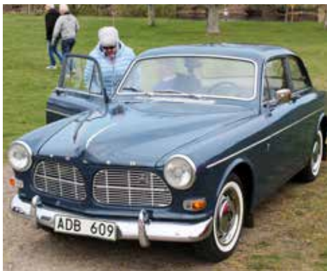
Volvo Amazon 1965