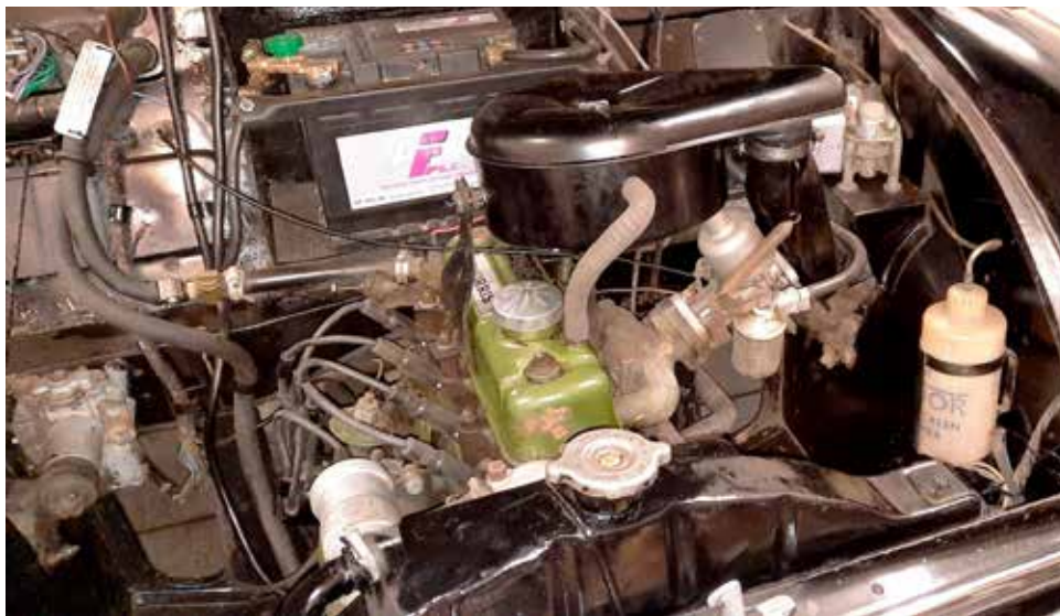
Motorrummet efter tvätt och rengöring