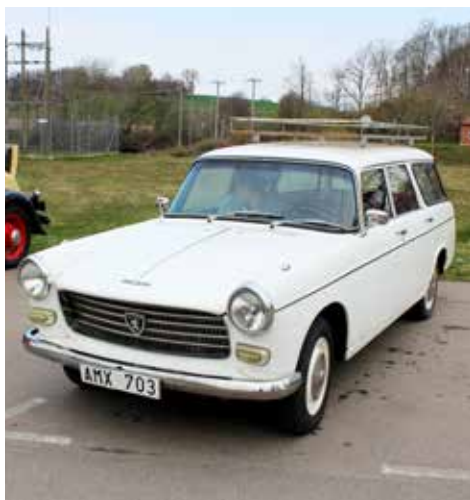
Peugeot 404 LD 1970