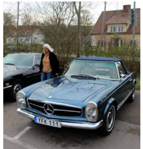
Mercedes-Benz 230 SL 1963