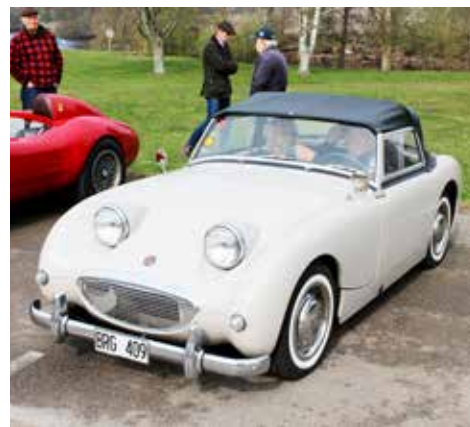
Austin Healey Sprite 1959