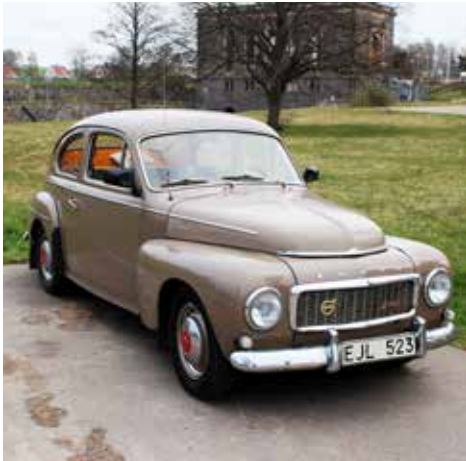
Volvo PV 544 1962