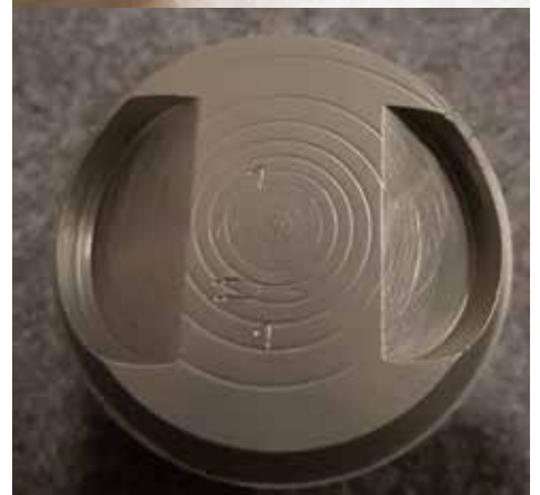
Kolvtopp före och efter blästring

Bilderna är från vattenpolering av motordelar till en motorcykel som stått parkerad under många år och som nu är under renovering. När motorn delades var det ingen vacker syn som mötte mekanikern. Efter vattenpoleringen kommer motordelarna att behandlas med ACF-50 för att behålla finishen. Vattenblästringen gjordes av Markku Roukala på Vattenpolerat.se