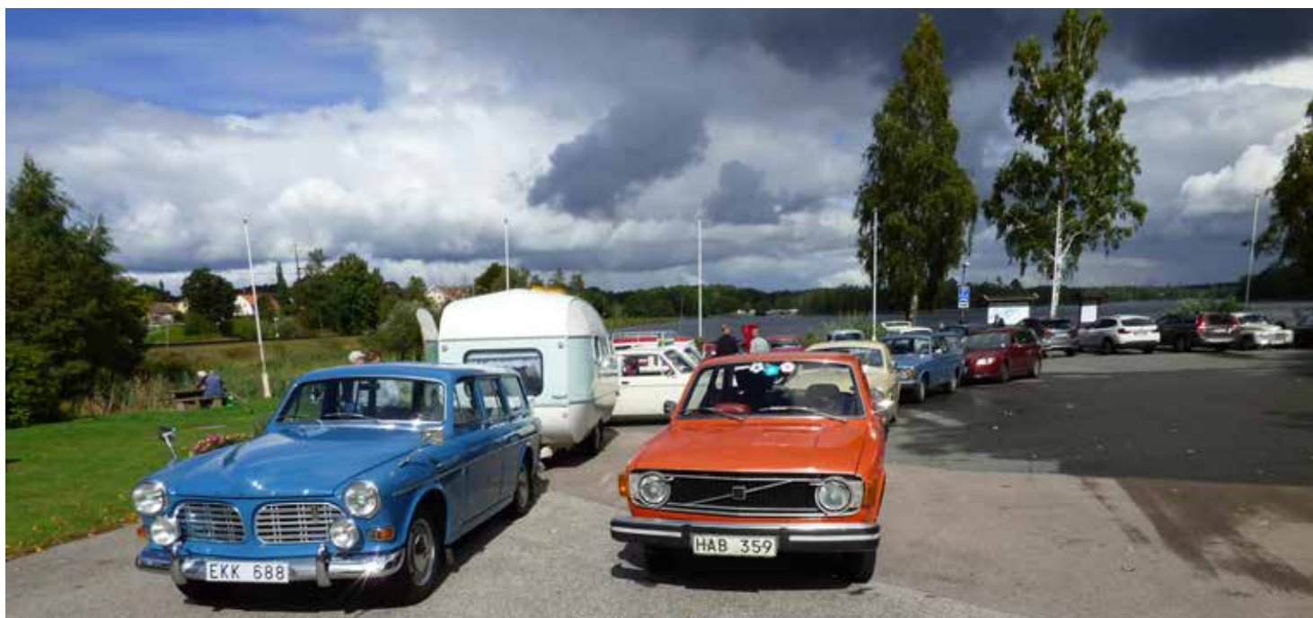
Fikat är avklarad och bilarna formerar sig för fortsatt färd mot Osby