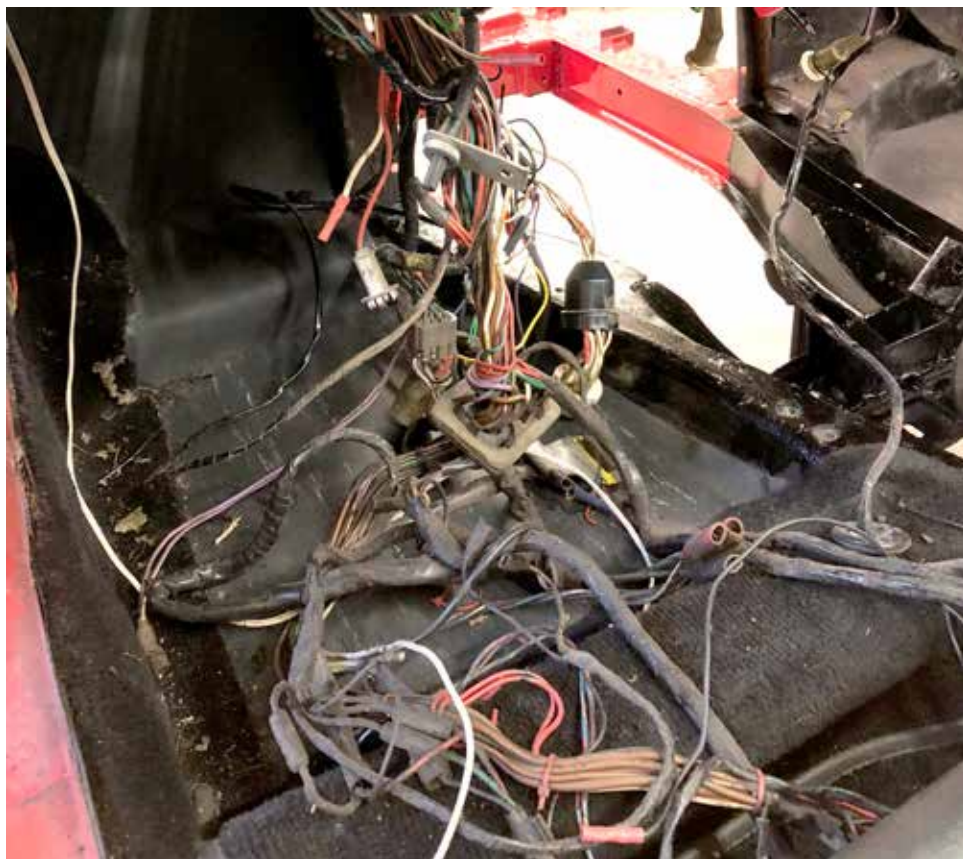
Den gamla kabelhärvan.