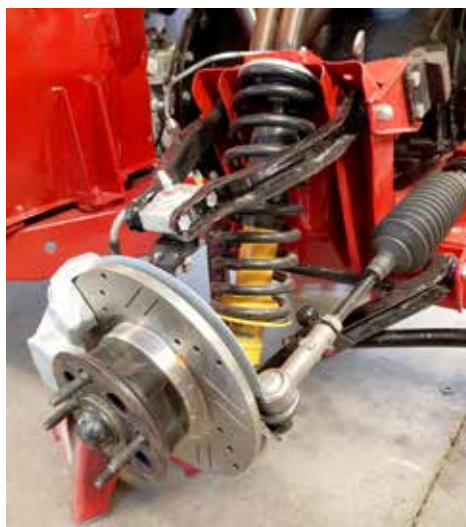
Nya bromsar, justerbar stötdämpare

En ny kabelhärva ska monteras, en gammal 49 årig härva låter man inte sitta kvar i en nyrenoverad bil. Självklart får också