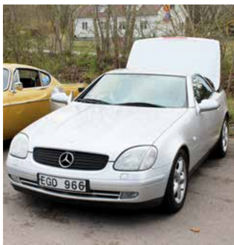
Mercedes-Benz SLK 1997