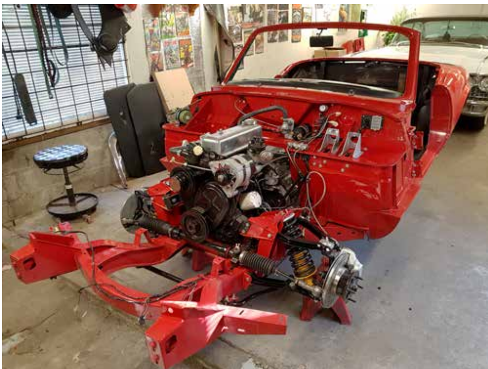
Monteringen har börjat i den vackert röda karossen