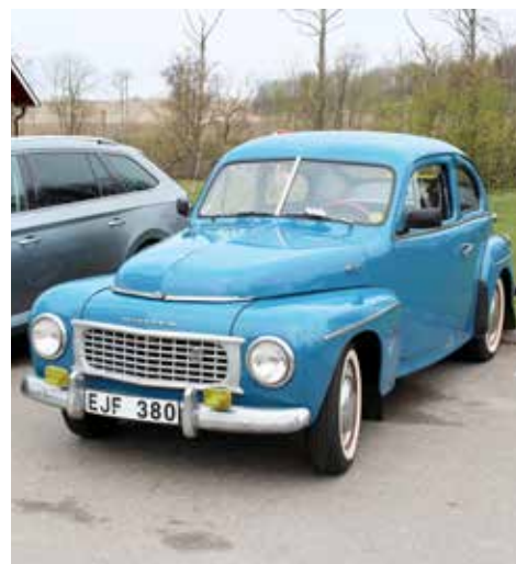
Volvo PV 444K 1956