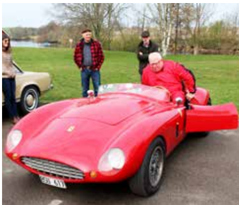
Ferrari Replica 1954