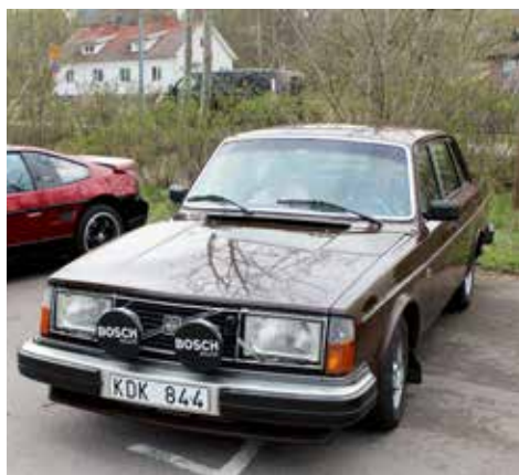
Volvo 244 1979