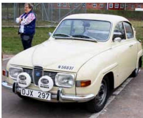
Saab 96 V4 1969