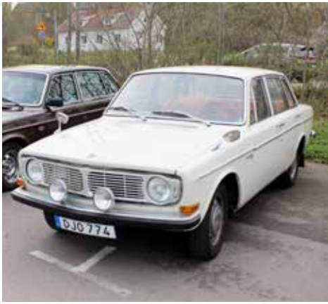
Volvo 144 Sport 1967