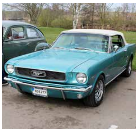
Ford Mustang 1966