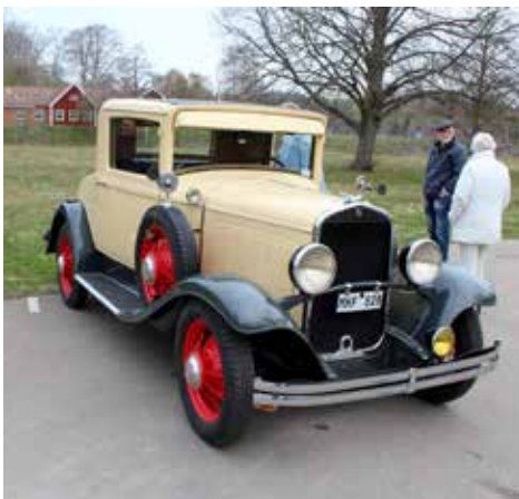
Chrysler Royale CJ6 Coupé 1930