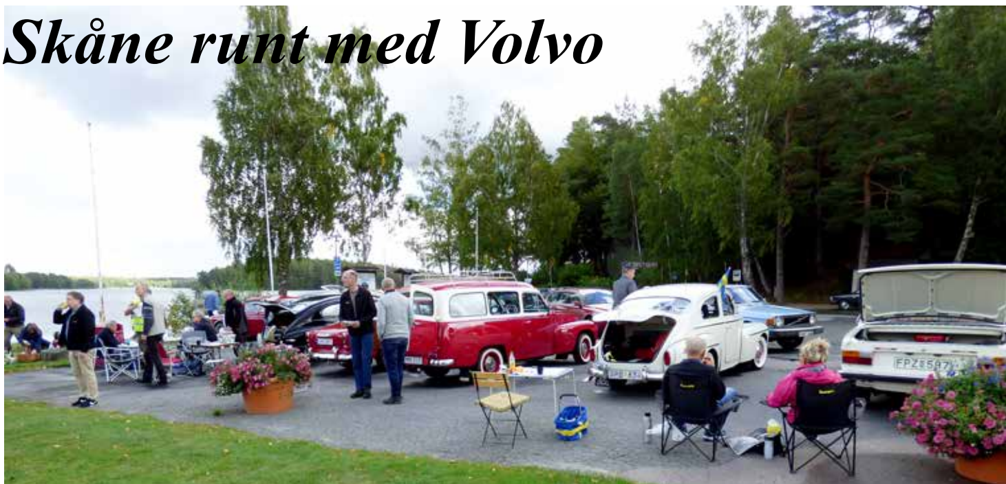
Fikapaus och biluppställning i Vittsjö vid sjön Vittsjön (vitsigt). På bilden syns bl a en synnerligen väl renoverad Duett