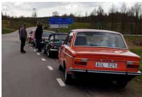
Huvudbry vid Sjönevads marknadsplats

Nästa kontrollplats var mer självklar, Svartrå kyrka. Nummer tre, Okome Bygdegård var heller inga problem då den ligger till höger strax efter Okome. Lite huvudbry blev det när kontroll fyra skulle bestämmas.