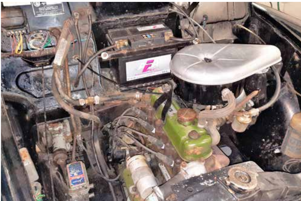
Motorrummet som det såg ut vid köpet