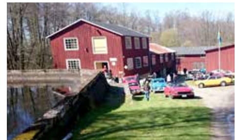
Okome Bydegård är en annan trevlig plats att stanna och fika vid.