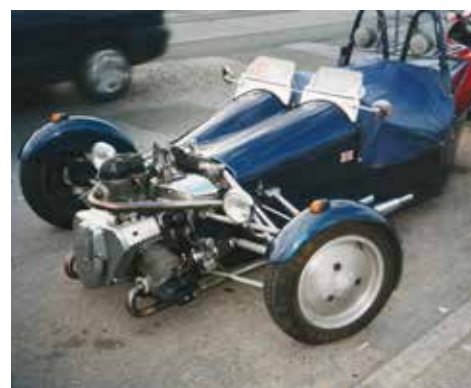
Fann på en parkering detta mycket ovanliga bygge. Utgångsläget var en boxer BMW R100 motorcykelmotor där man lyckats lägga till en cylinder extra.