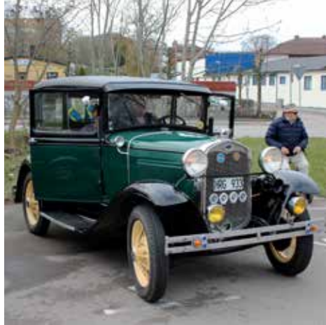
Ford Modell A 1928