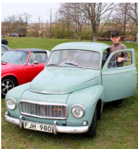
Volvo PV 544 1961