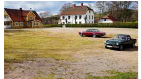
Den jättelika parkeringen bakom Sjönevads Gästis precis vid sjön