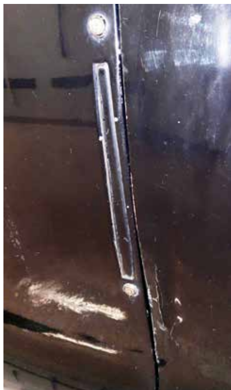
Vänster dörr har lite skador som måste åtgärdas

Så beslutet blev att frigöra plats hemma i garaget (Corvetten blev inte glad) och påbörja vinterns arbete. Första kvällen gick åt till att titta och undersöka för att kunna besluta vad som skall göras och vad jag kan göra själv. Entusiasmen flödade och jag var överallt tills jag besinnade mig och sade: En sak i taget, annars blir det kaos.