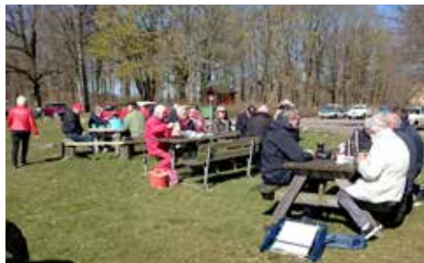
2017 satt vi och fikade vid Ätrafors den 1 maj.