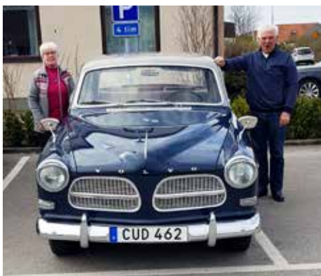
Volvo Amazon 1959. Curth o Maggan Jansson, Falkenberg.