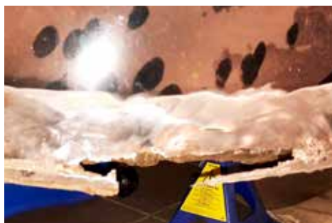
Bakskärm slipad, klar för rostlagning

Hittat lite rost, framförallt nederkant i bakskärmarna som behöver en svets – ekvilibrist. Mina egna gamla kunskaper ligger på gas-svetsstadiet. Det finns nog