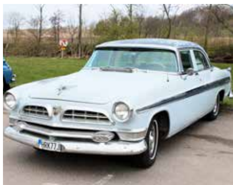
New Holland Yorker Deluxe 1955