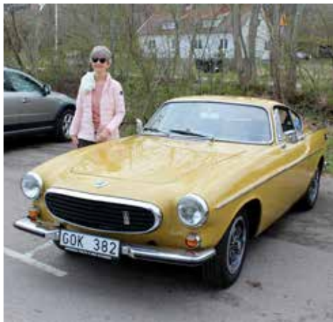
Volvo P1800 1970