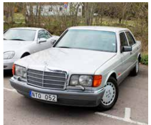
Mercedes-Benz 300 SE 1988