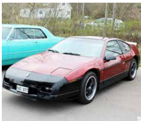
Pontiac Fiero GT 1987