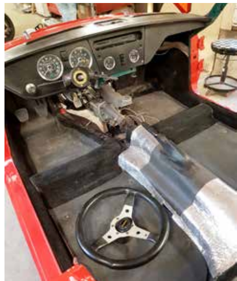
Ljud- och vibrationsdämpning påbörjad 20