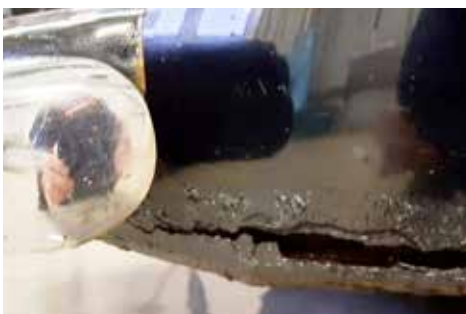
Obehandlad rost i höger bakskärm

Jag började med motorrummet, att rengöra, byta lite packningar, måla lite, städa och rengöra. Nästan klart nu, lite finputs kvarstår. Sedan blev det bromsarnas tur, alla hjulen av, nya backar, nya hjulcylindrar. Nu blir det spännande att se om det bromsar bättre, när den väl kommer ut.