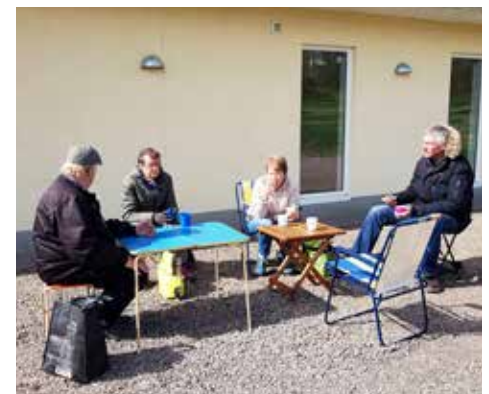
Kylig kaffefika efter rallyrundan

Femte och sista kontrollen var redan den mest självklara, "Gurkbänken" Vessigebro Idrottsplats.