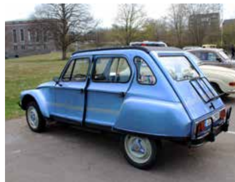
Citroen Dyane 6-B 1982