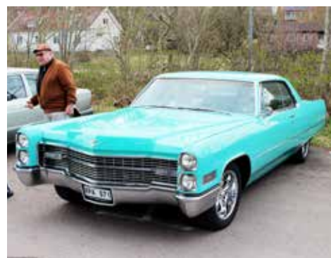
Cadillac Deville 1966