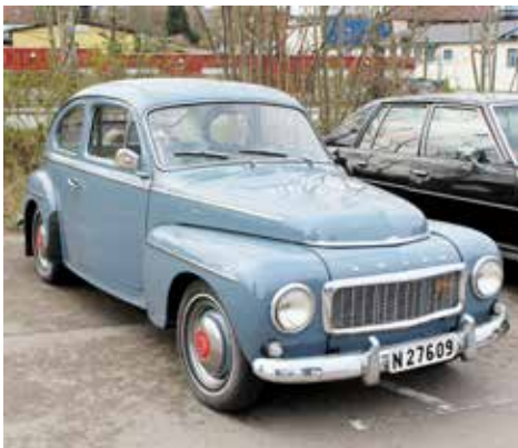
Volvo PV 544 1962