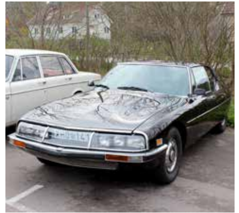
Citroen SM Coupé 1973