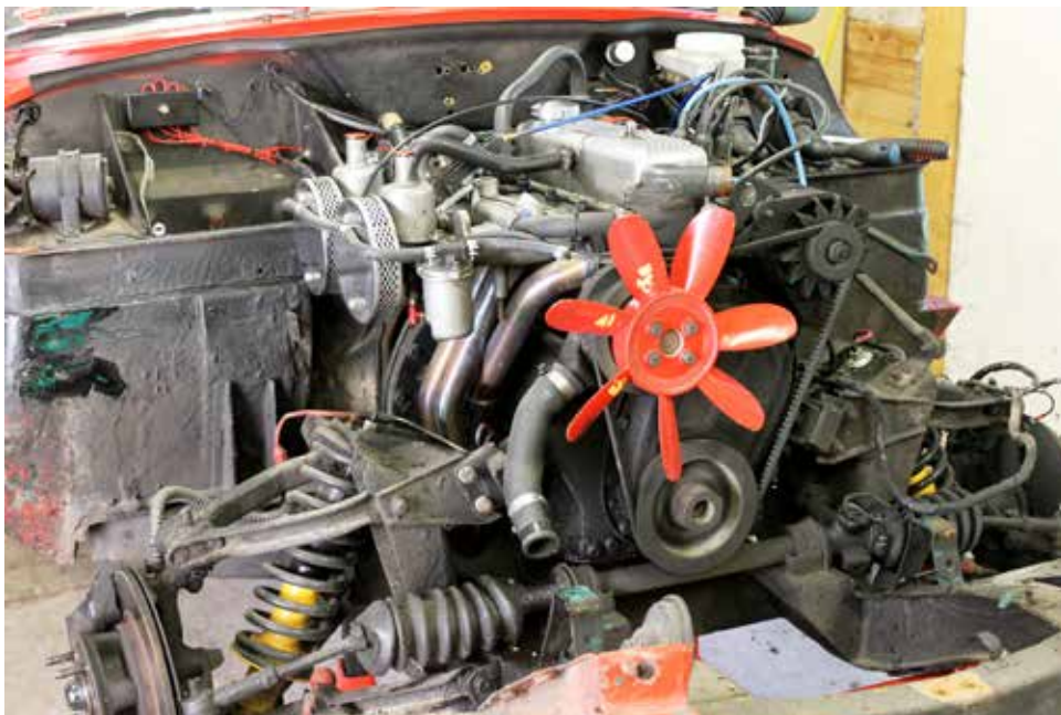
Det svarta motorrummet som Gunne hade att göra plåtrent.