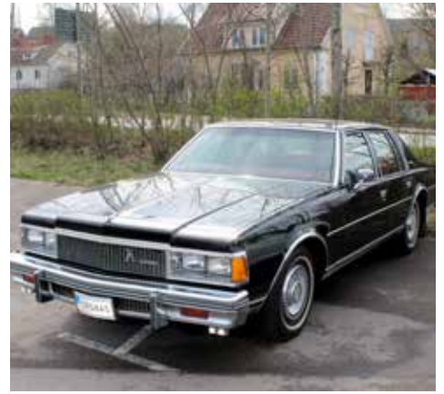
Chevrolet Caprice 1977