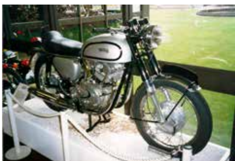
Norton P10, prototyp 1965. Motorn har dubbla överliggande kamaxlar, 800 cc. Tänk om Norton hade låtit den gå i produktion, det hade blivit en superbike då med sin storlek. Ingen av de japanska MC-märkena hade någon så stor maskin.