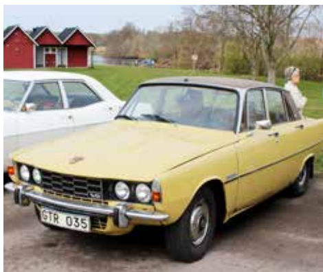
Rover 3500 1974