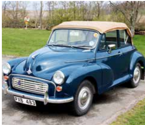
Morris Minor 1000 Cabriolet 1967