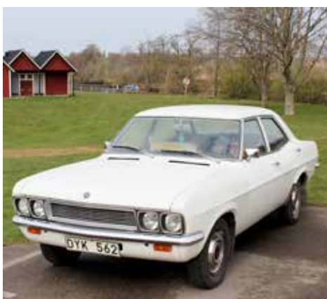
Vauxhall Victor 1969