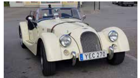
Morgan Roadster 2016