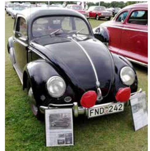
Volkswagen Limousine från 1950