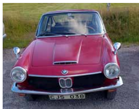
Leif Karlssons BMW 1600 GT Coupé -68