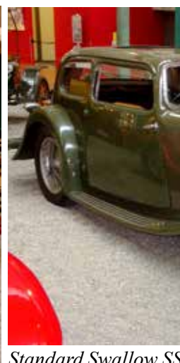
Standard Swallow SS