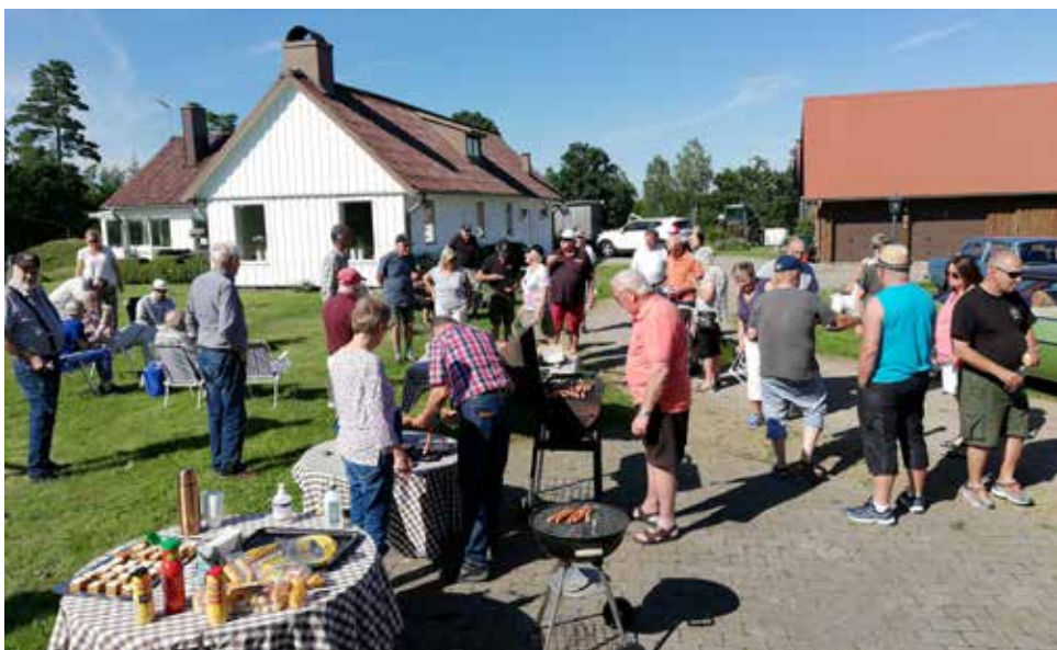
Grillning på gårdsplanen i Lahult.

Väl framme i Odensjö och när alla parkerat så plockades det fram bord, stolar och medhavd kaffekorg. Trots att deltagarna höll rekommenderat avstånd blev det en mycket trivsamt samvaro. Det var roligt att se så många nya ansikten och bilar. Flera av deltagarna hade aldrig tidigare deltagit i några utflykter med andra klubbmedlemmar. Denna utflykt var ju inte en klubbaktivitet utan ett initiativ av en enskild medlem. Något måste ju göras när en pandemi lamslärr alla planerade klubbaktiviteter.