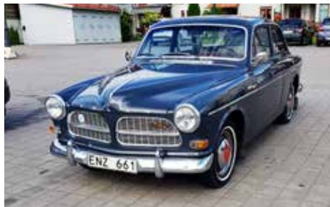
Volvo Amazon 1964