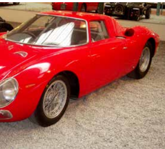
M. En bil med svensk bakgrund! Med bara ett år har denna bil endast gått ca. 200 mil.