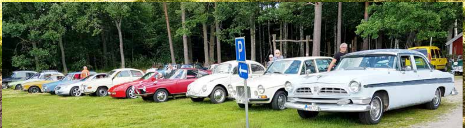
Parkeringen utanför hembygdsparken