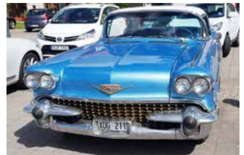
Cadillac Eldorado 1958