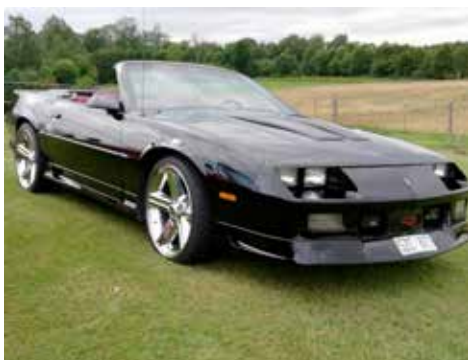
Chevrolet Camaro 1991