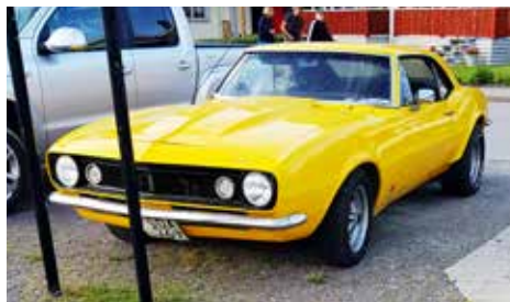
Chevrolet Camaro HT 1967