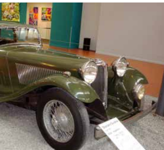
1934, 6 cylindrig motor 2663 ccm 130 km/h