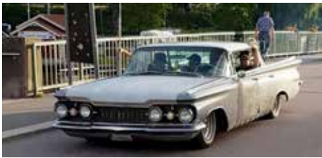
Oldsmobile Series 98 1959