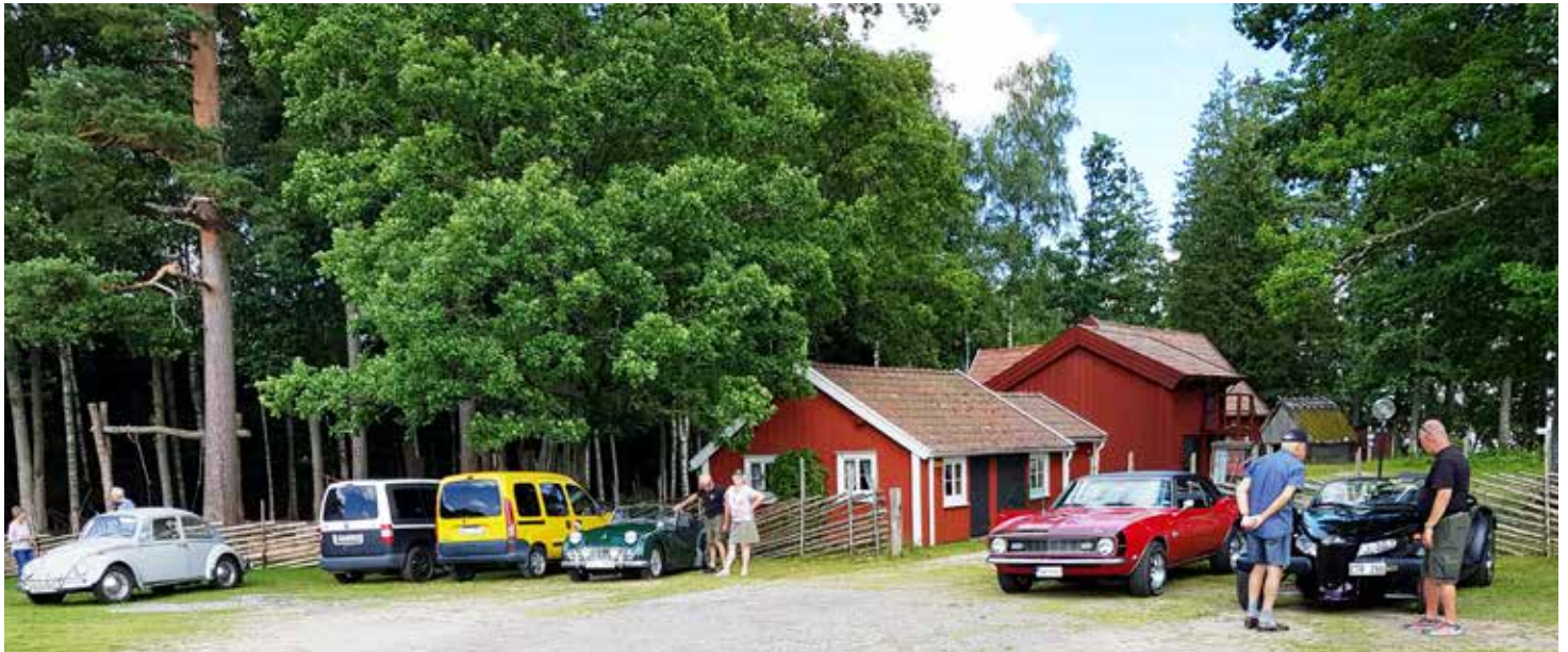
En del av deltagarna på parkeringen utanför Odensjö hembygdspark

När alla fikat färdigt och alla fått prata av sig var det så dags att köra till Lahult och grillningen som skulle börja kl 16. Beräknad körtid var ca 30 minuter men verkligheten blev 50 minuter så grillarna som var klara vid beräknad ankomst började få slut på kol och fick fyllas på. Två korvar med bröd var beräknat och det var också exakt vad som gick åt. Korvarna hade vi fått köpa direkt från Korvpojkmans fabrik i Halmstad, vilket blev billigare än att handla i butik.