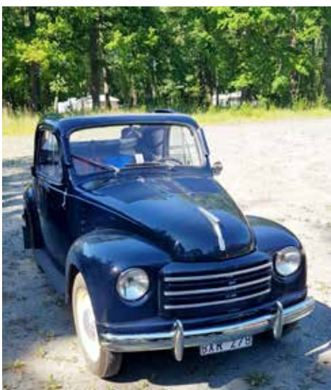
Fiat 500C 1952 som ägs av en man från Varberg