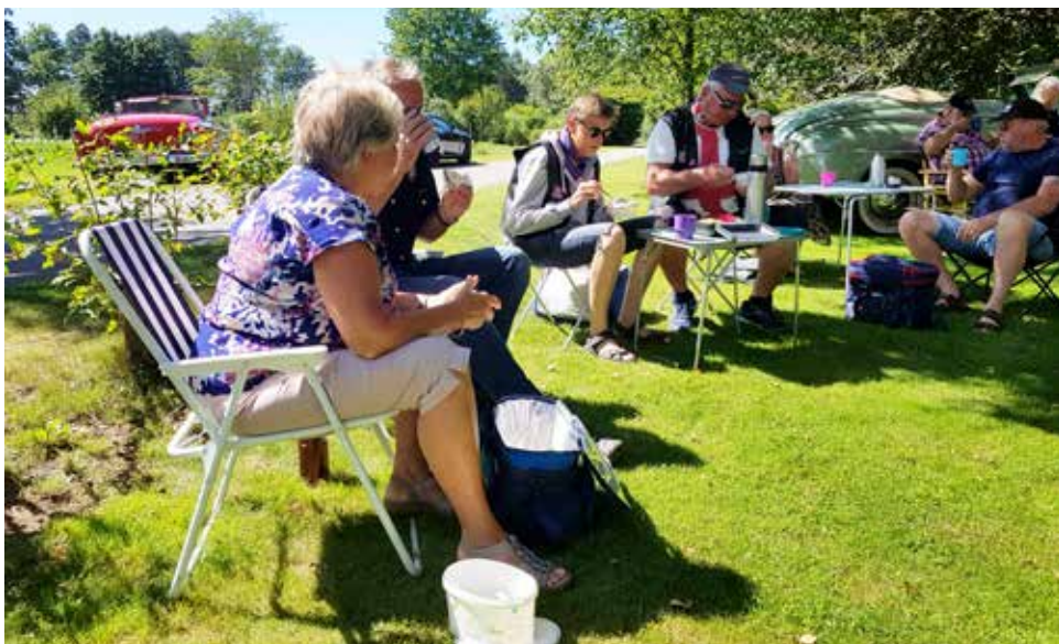
En stunds avkoppling och fika i Munkagårdsgymnasiets trädgård