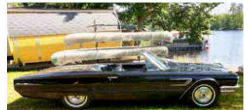
Jag köpte mig en Ford Thunderbird cab, av 1965 års modell. Motorn är en gammal hederlig Gjutjärns V8 på 390 kubik det vill säga att motorn är på 6,4 liter o 300 hk. Vid "snäll" körning på landsväg i ca 70-80 km är bränsleförbrukningen ca 1,7 liter milen. Den gillar bäst 100 oktanic bensin men vi kör på 95 oktanic o blyersättning enligt norm. Bilen är helt original från den dagen då den rullade ut från fabriken i USA. Den "bor" vinter-tid i mitt nya garage väl inlåst, men självklart är jag ute o "pratar" med den under vintern. Fotot är taget vid Vittsjö strand Ägare Charlotte Lundgren, Hishult

DIN KOMPLETTA KYLARVERKSTAD FÖR VETERAN KYLARE med 30 års erfarenhet