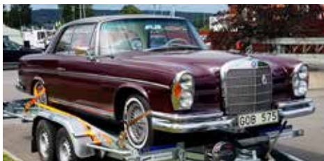
Mercedes-Benz 220 SE B 1964

På en parkering i Karlsborg hittade redaktören denna vackra Mercedes