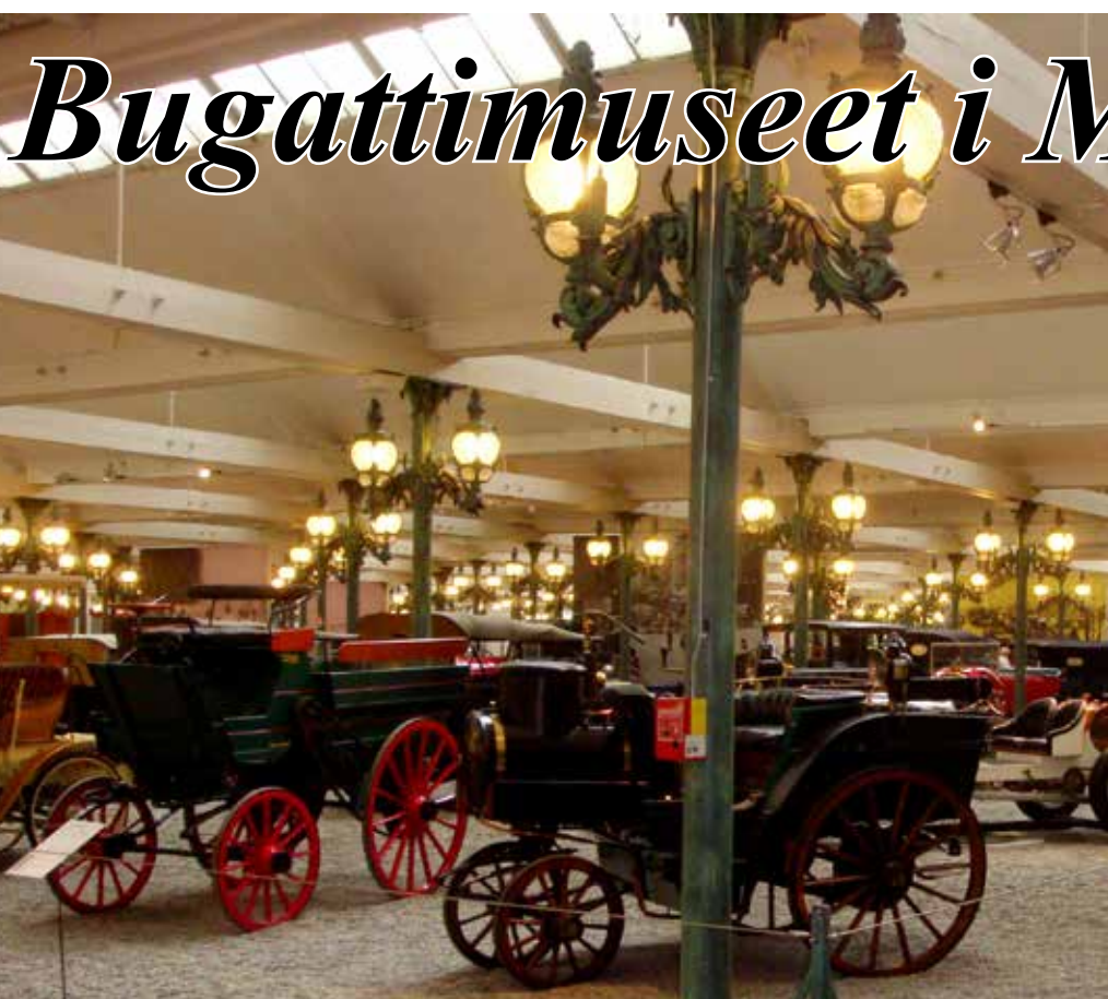
Musée National de l'Automobile. Museet ligger i väldigt tjugiga lokaler, som faktiskt är

Text o foto Horst Grieger (Källa Wikipedia)