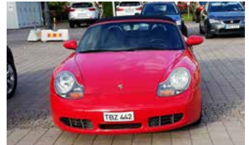
Porsche Boxster S 2002