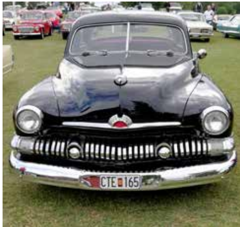
Mercury Sedan 1951