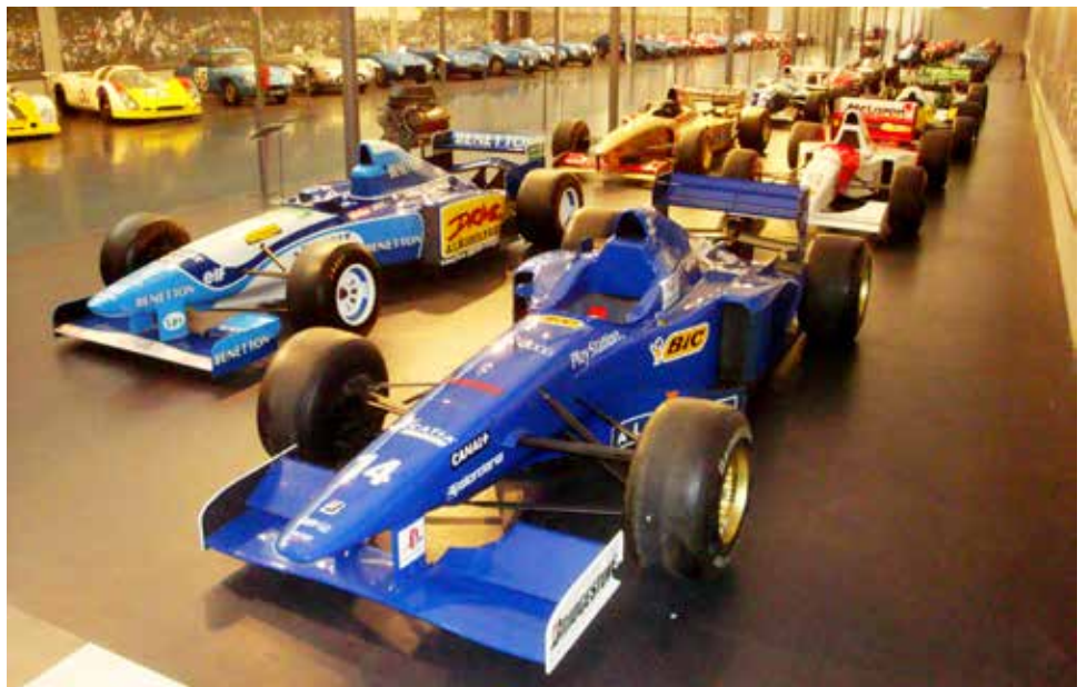
Museet har också en stor samling med både sportvagnar och formel 1 bilar.