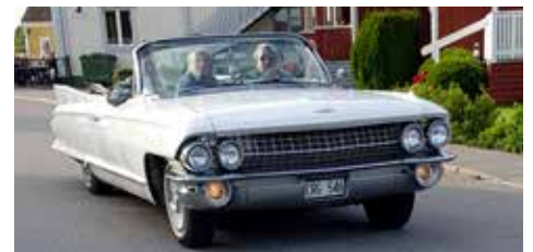
Cadillac Conv Coupe 1961