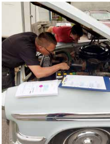
Stämmer motornumret? Och var finns det? Det är inte alltid så lätt att hitta rätt.

Därefter började den ockulära besiktningen av bilen. Rost? Nej, det hittades ingen. Inredningen var sliten, ja den var helt slut. Solbränd lack då bilen kom från de torra och soliga delarna av USA.