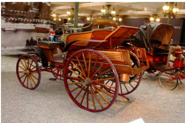
Victoria från 1893, 1 cylinder med 1730 ccm och 18 km/h i toppfart. i toppfart.