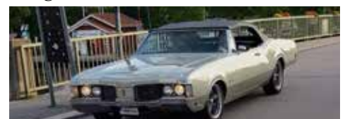
Oldsmobile Delmont 88 1968