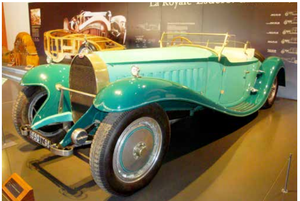
Bugatti Roadster Royale Esders replica. En väldigt stor bil.