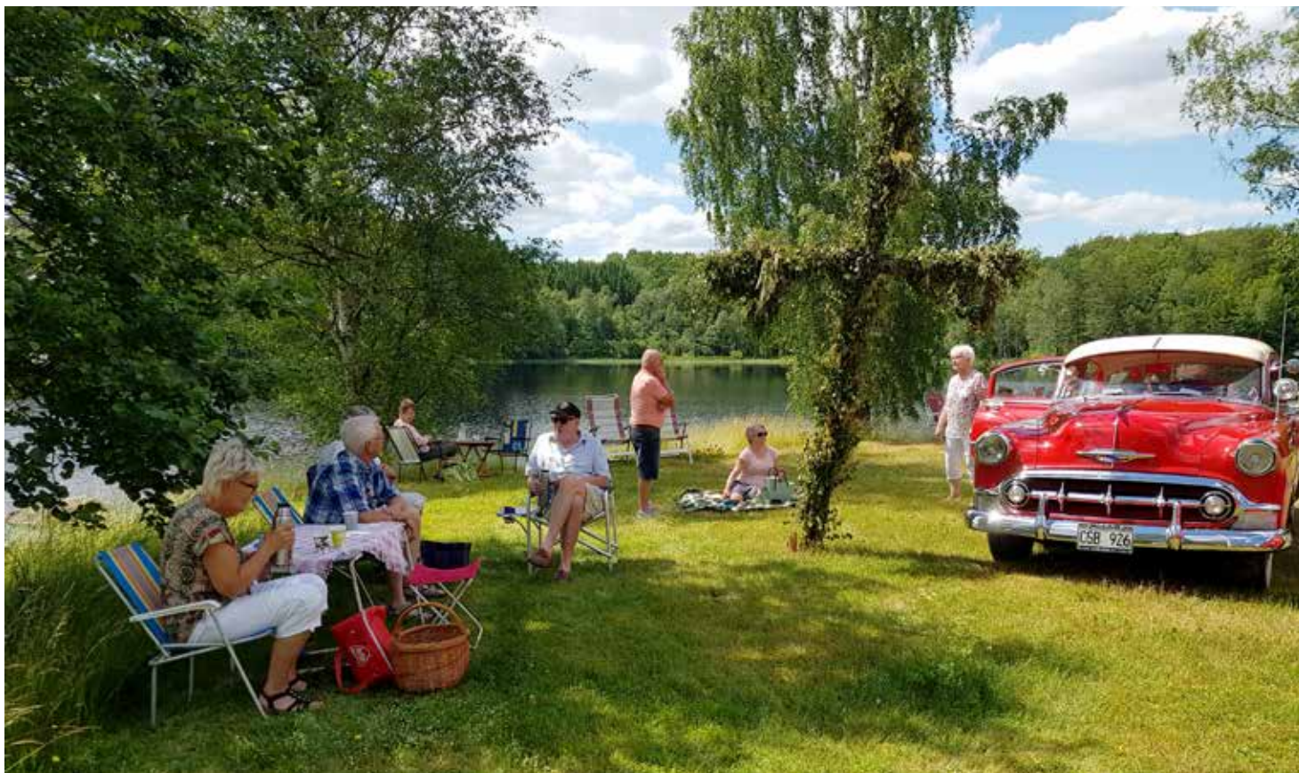
Uppvuxna björkar kantade sjön och alla som ville kunde sitta i skuggan denna heta dag

Redaktören gjorde ett utskick till alla medlemmar som anmält mejladress och berättade om en planerad runda i östra Halland den 24 juni. Startplats var parkeringen mitt emot Hemköp i Oskarström. Då klubben inte har så många medlemmar i Oskarströmsområdet och väderlekstjänsten lovade upp emot 30 grader i skuggan var inte förhoppningar stora på många deltagande i rundan. Starttid var planerad till 13.30 och spänningen hos redaktören var stor när