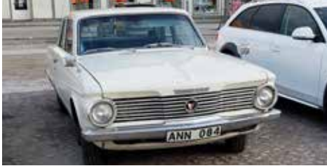
Chrysler Valiant V-100 1964

Under en resa runt Vättern övernattade redaktören i Askersund och på lördagskvällen var där en spontan cruising. Några av alla veteran- och entusiastfordon lyckades jag fotografera. Roligt att se så många bilar. Även en gul väl iordningsställd A-traktor visade upp sig