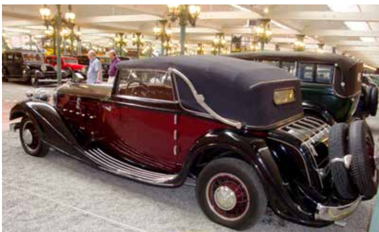
Horch Cabriolet 670 från 1932 med en 12-cylindrig 6-litersmotor med en toppfart på 140 km/h