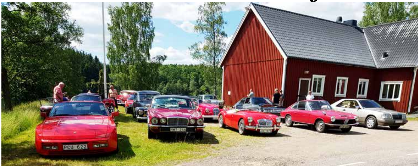
Efter att ha kört i ca 1 timma var vi framme på parkering vid Mjälahults Bygdegård