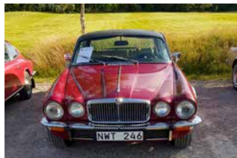
Redaktörens Jaguar XJ6 Coupé -75

bussar, bilar, mopeder, mc, ångmaskiner, radio- och tv-apparater, en liten 50-talsmiljö och mycket mer.