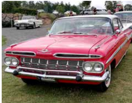
Chevrolet Impala Coupé 1959