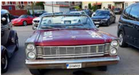
Ford Galaxie 1961