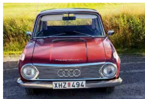
Bo Birgerssons DKW F102 -65