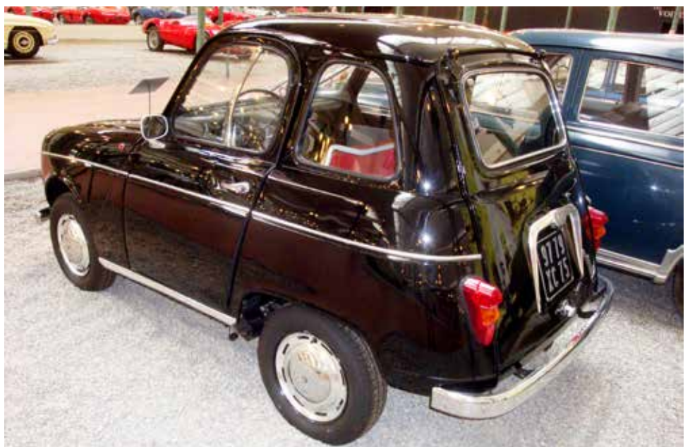
Nej, det här är inget skämt! Detta är en prototyp av en förkortad Renault 4L och den visades upp på Parissalongen 1969.