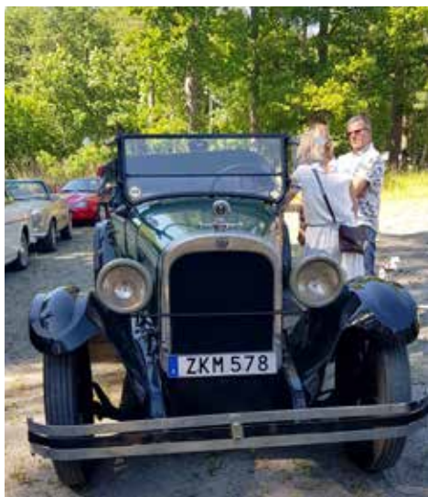
Dodge Cabriolet från 1926.