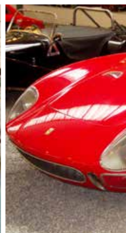
Ferrari Coupé 250 L, ett fåtal race bakom sig