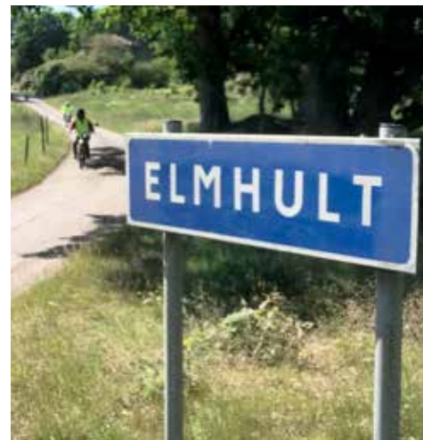
Målet för dagens moppeutflykt