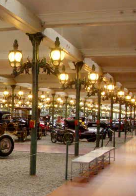
en gammal fabriksbyggnad.