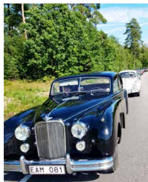
Väntan på "tappade bilar" vid Hallaböke-korset