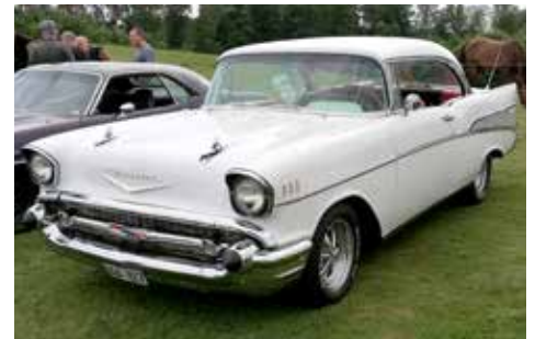
Chevrolet Bel Air 1957