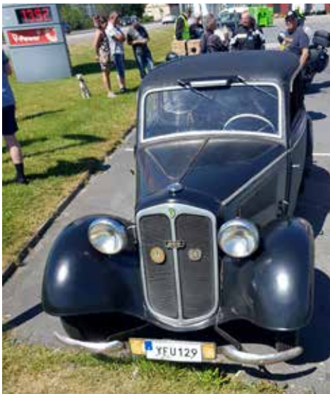
DKW halvkombi från 1938. Ägs av en man från Veddige