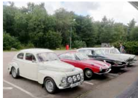
Fikastopp på Hallandsås