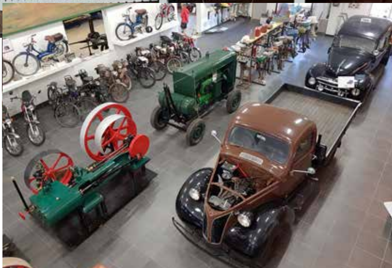
En bild från balkongen över en del av utställningen