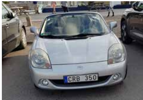
Toyota MR2 2003