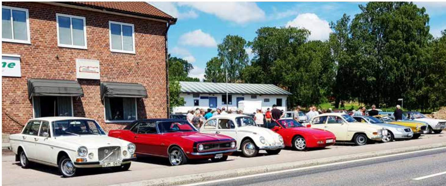
Samlingen vid Deromes kontor i Simlångsdalen

Två dagar senare än vad som egentligen var planerat. Den 15, som var tänkt, var det ett riktigt dåligt väder, men den 17 lovade sol och 22 grader med växlande molnighet. Perfekt väder för veteranbilskörning.