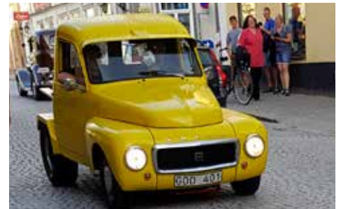
Volvo P 21134 OMB 1960