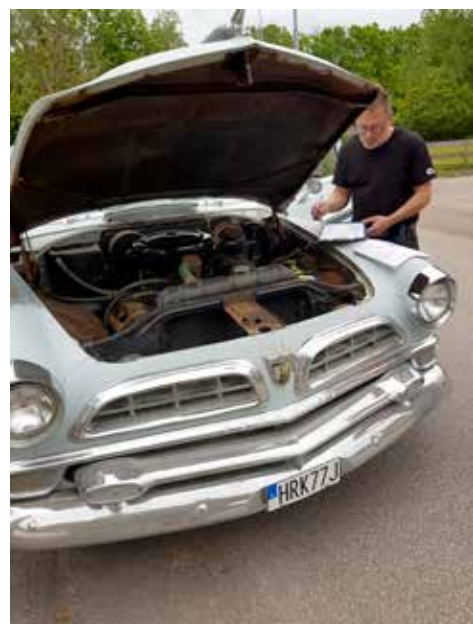
Att göra en besiktning tar ca 20 - 60 minuter beroende på fordonets skick. En stor del av den tiden används till att fylla i det protokoll som ska skickas till MHRF