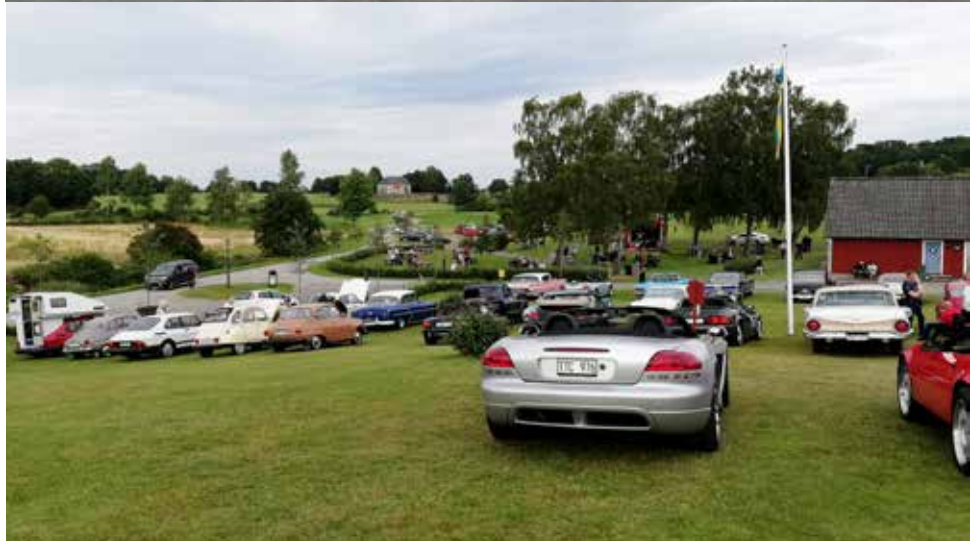
För att vara i Corona-tider var det förvånansvärt fullt på parkeringen