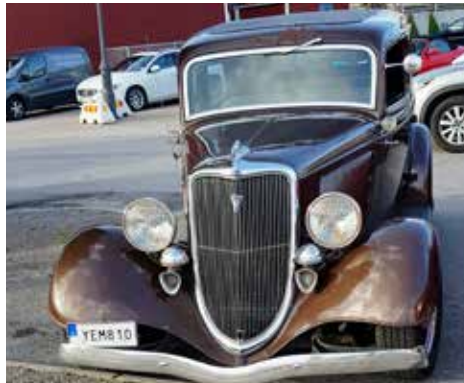
Ford Tudor 1934