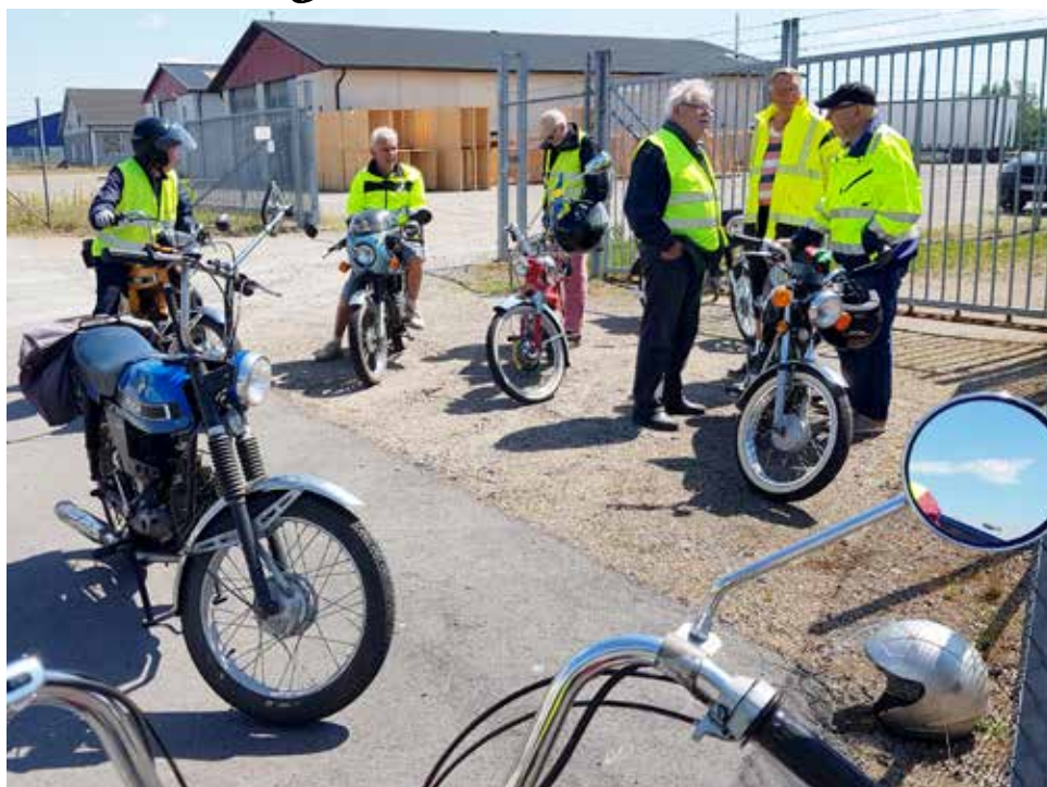
Förutom redaktören samlades 7 st HFV-mopedister vid "Hasses Lada" i Laholm

Fantastisk natur och trevligt sällskap, redaktören njöt och trivdes.