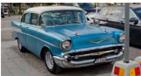
Chevrolet BEL AIR 1957