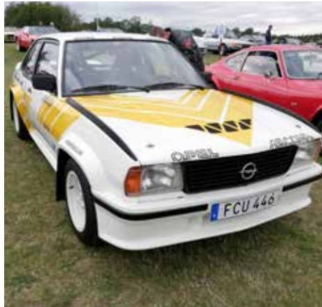
Opel Ascona 1979