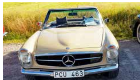
Per Nilssons MB Pagoda 250SL -67