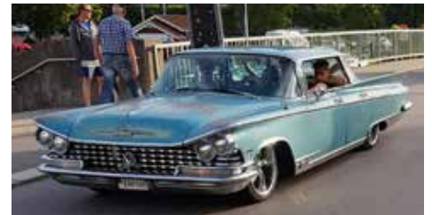
Buick Electra 1959