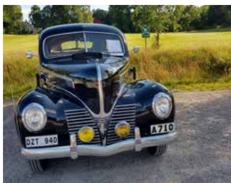
Urban Svensson Dodge Senior -39

Torpa ligger en kort bit från väg 25 (vägen mellan Halmstad och Ljungby) ca 2 mil väster om Ljungby. H. Väl värt ett besök. Alla deltagande HFV-bilar är med på bild på denna sida.