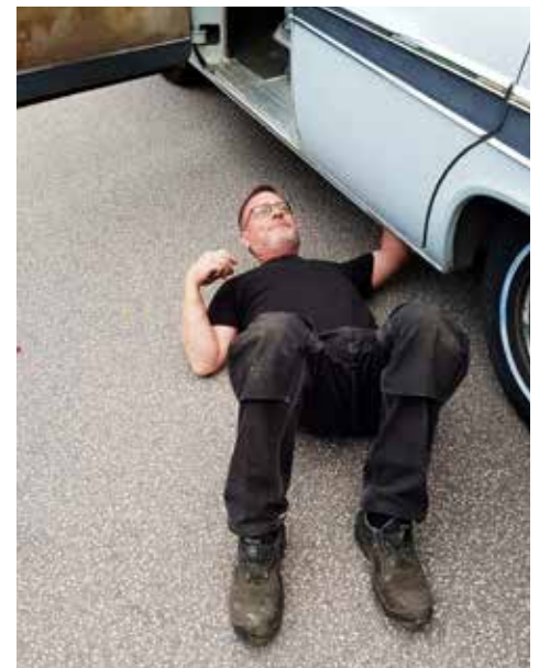
Finns det rost under? Som besiktningsman får man inte vara rädd för att smutsa ner sig. Tur att det var torrt denna gång.