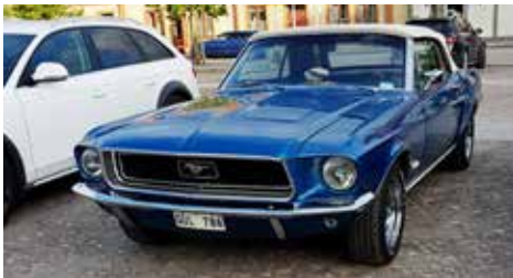
Ford Mustang 1968