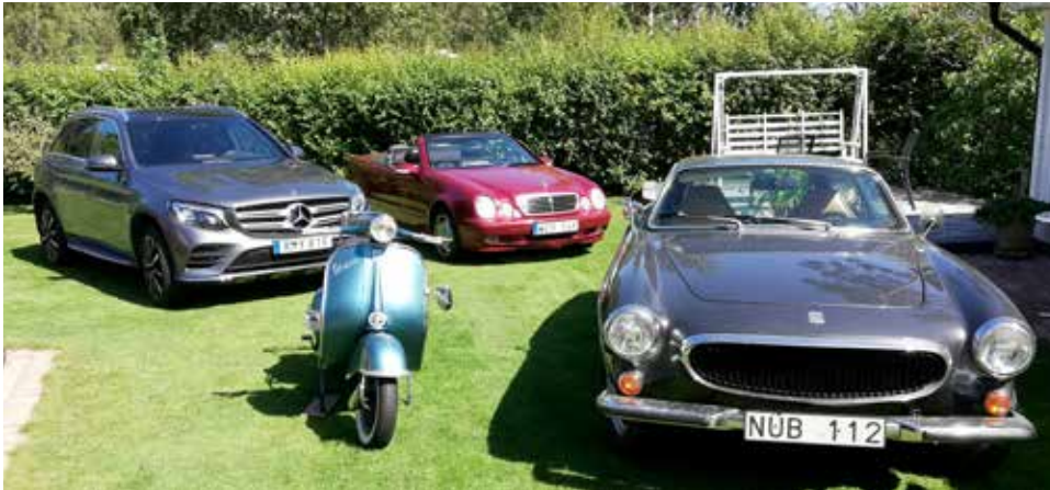
Volvo P1800 samsas vid sommarhuset i Mellbystrand med två Mercedes och en Vespa