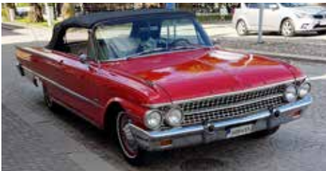
Ford Galaxie 1965