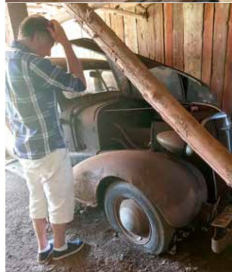
Pensionärsprojektet en Chevrolet Master Deluxe från 1937. Huvudbry?