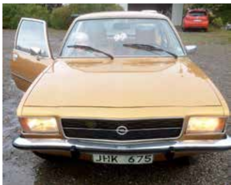
Opel Rekord 1976. Växellådan är automatisk, motorn är på 88 hk