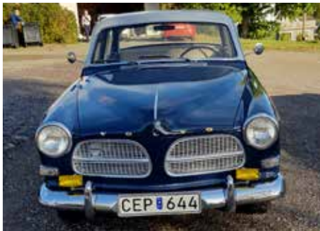
Volvo Amazon 1959. Växellådan är manuell, motorn är på 60 hk