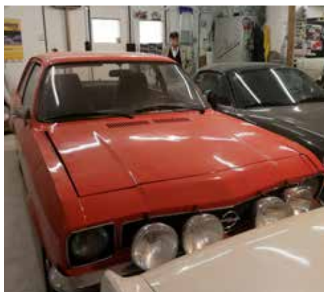
Opel Ascona Rally 1975. Växellådan är manuell och motorn är på 88 hk.