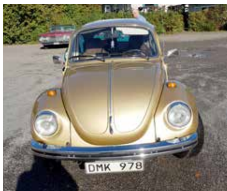
Volkswagen 1303S 1974. Växellådan är manuell, motorn är på 50 hk