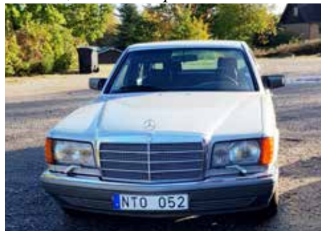
Mercedes-Benz 300 SE 1988. Växellådan är automatisk, motorn är på 179 hk