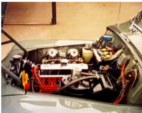
Motorrummet glänsar som "sola i Karlstad"