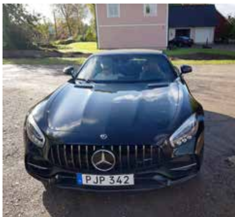
Mercedes-Benz AMG GT C Roadster 2017. Motorn är på 557 hk