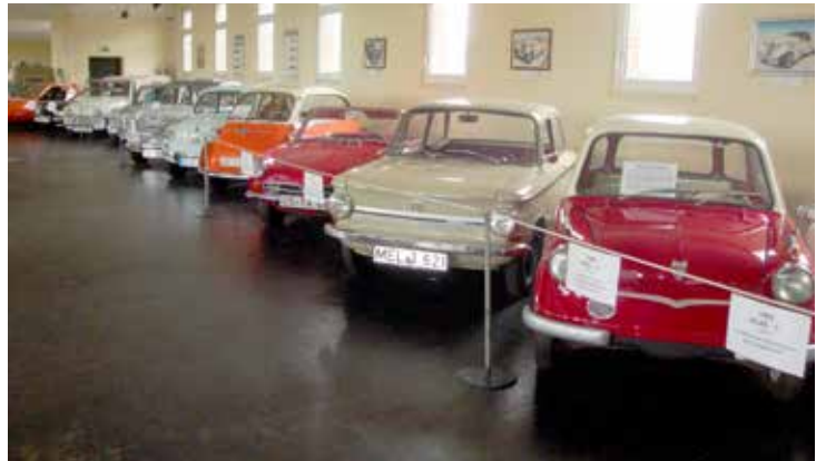
I avdelningen för "småbilar" finns det massor av Glas, NSU, Goggomobil, Messerschmitt och liknande.