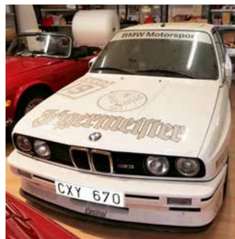
BMW M3 1990. Väckellådan är manuell och motorn är på 215 hk