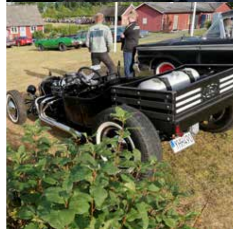
Granathen Roadster från 2017. Växellådan är automatisk och motorn är på 170 hk