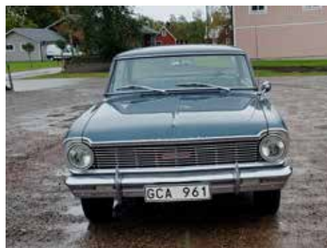
Chevrolet Chevy II 1965. Växellådan är manuell, motorn är på 97 hk