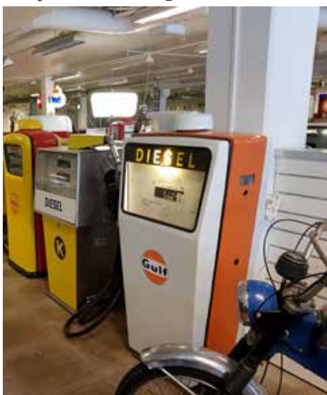
Bensinpumpar från olika bensinbolag