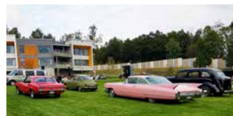
Från vänster Ford Mustang 1967. Saab V4 1973. Cadillac Coup Deville 1960 och längst till höger en Volvo PV 831 (droskan) från 1954.

DIN KOMPLETTA KYLARVERKSTAD FÖR VETERAN KYLARE med 30 års erfarenhet