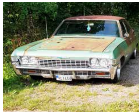
Chevrolet Bel Air 1968 med automatisk växellåda och en motor på 200 hk

När redaktören var ute och promenerade i Oskarström en tidig morgon i mitten av augusti passerade han en solbränd bil och tog ett foto