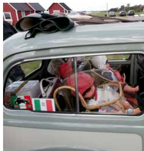
Får plats med tidstypiska barnstolar och väskor. Bra utnyttjat utrymme i en liten bil