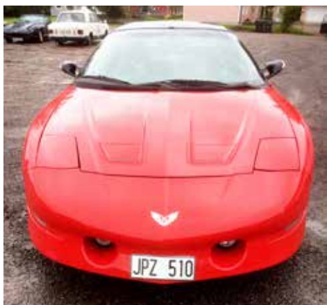
Pontiac Trans AM 1994 Växellådan är automatisk, motorn är på 261 hk