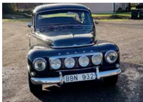
Volvo Sport 1962. Växellådan är manuell, motorn är på 90 hk