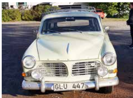
Volvo Amazon herrgårdsvagn 1967 Växellådan är manuell, motorn är på 75 hk