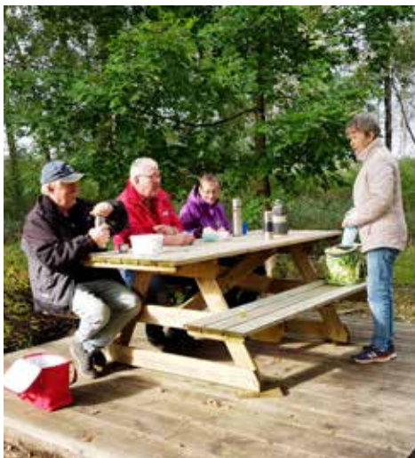
Fikapaus vid Kvarngården