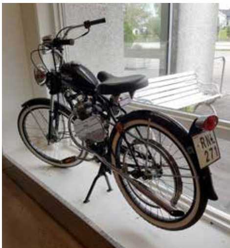
En amerikansk moped, en Whizzer