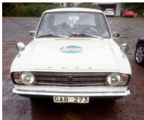
Ford Cortina 1600 1969. Växellådan är manuell, motorn är på 64 hk