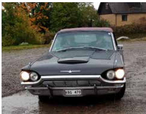
Ford Thunderbird 1965. Växellådan är automatisk, motorn är på 302 hk