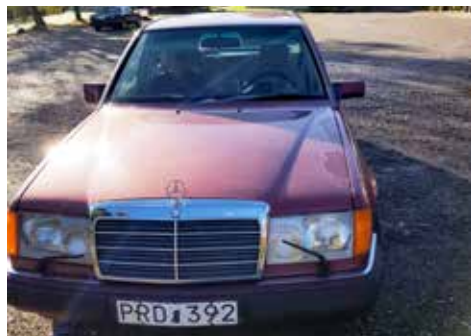
Mercedes-Benz 230 E 1990 Växellådan är manuell, motorn är på 132 hk