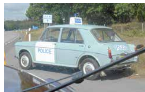
Auktoriserad (?) poliskontroll. Ni som läser Classic Motor känner igen "Pandans".

var rallyt slut. En annorlunda dag, men vi fick se en massa gammelmilar (det var anmält 130 fordon) och även om det inte blev någon samling före eller efter, så var det trevligt. Ett jättebra initiativ av Wexjö motorveteraner m.fl. Det var faktiskt 45:e gången som rallyt kördes, så man förstår att de inte ville bryta sviten. Vädret var också jättelagom fast meteorologerna hade lovat väta.