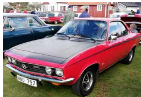
Opel Manta från 1975. Manuell växellåda och motor på 80 hk