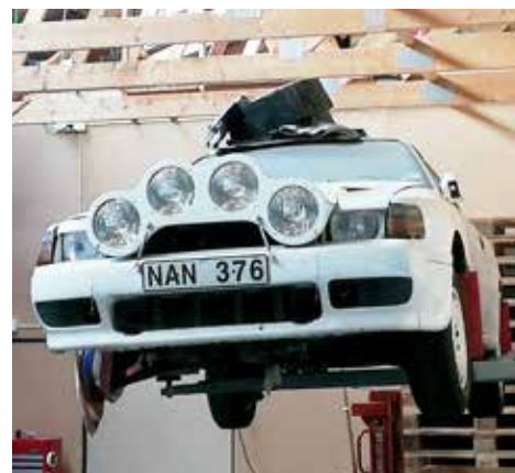
Toyota Celica GT Four 1988. Väckellådan är manuell och motorn är på 185 hk.