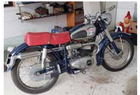
Naturligtvis har Sven också en civil Monark Blue Arrow. Självklart är den också av årsmodell 1954.