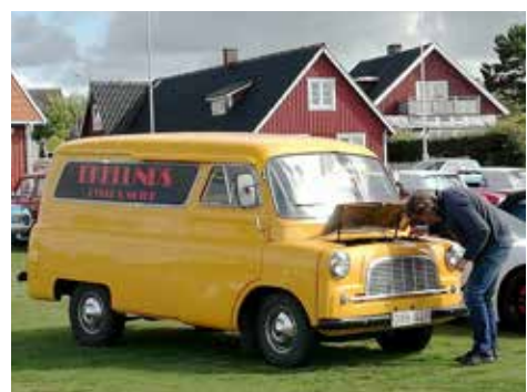
Bedford Gasv 30 från 1966. Manuell växellåda och motor på 63 hk. Letar han efter motorn?