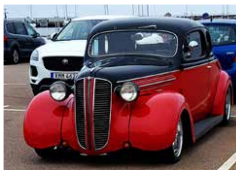
Dodge Super Coupé 1937, 87 hk och manuell 3-växlad låda.

15% rabatt på lackbehandlingar hos Ditec i Laholm Kullsgårdsvägen 39, Laholm Medtag medlemskort Ring Johan på tel 076-176 93 33