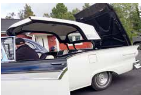
Taket har lyft och är på väg bakåt