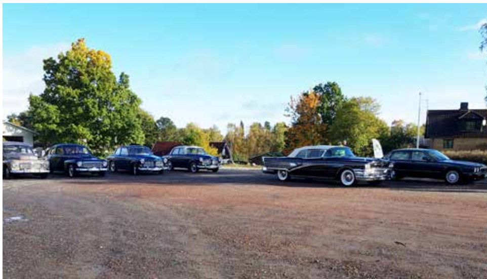
Den fria starten gjorde att det inte blev så många bilar samtidigt vid starten

startplatsen. ”Det var så att torkarna knappt hann med att få bort regnet” sa en av deltagarna som körde en PV Sport. Rallyrundan gick från Våxtorp över Hallandsåsen ner till Hjärnarp, förbi Margretetorp, uppför åsen igen för att på toppen svänga höger mot Brante Källa, Hasslarp och Lugnarohögen innan målgång.