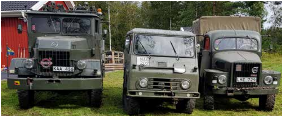
Till vänster en Volvo L3164 (TL31) från 1962 köpt 2002, Volvo 3315 (Valpen) från 1969 köpt 2018, Volvo TL22 från 1955 köpt 1986. Alla bilarna är i trafik och besöker regelbundet träffar med militära fordon.