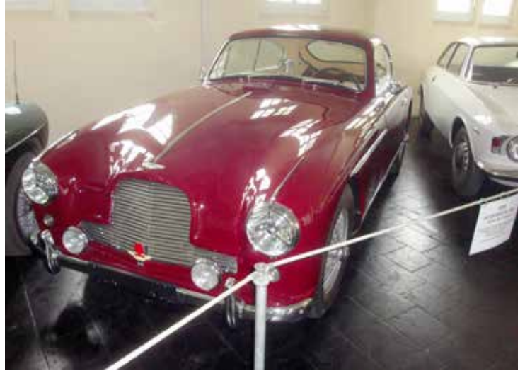
Aston Martin DB2/4 Mk II 1954. Förste ägare var Belgiens kung Baudouin.