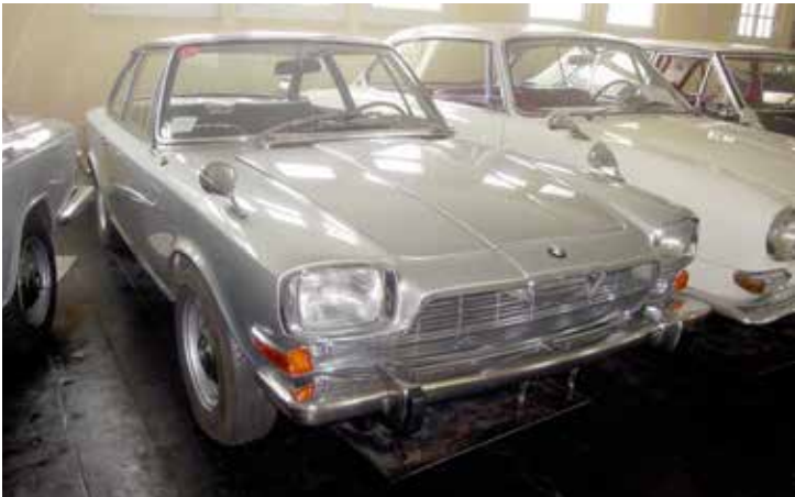
BMW Glas 3000 V8. En ovanlig modell med ungefär bara 400 tillverkade exemplar.