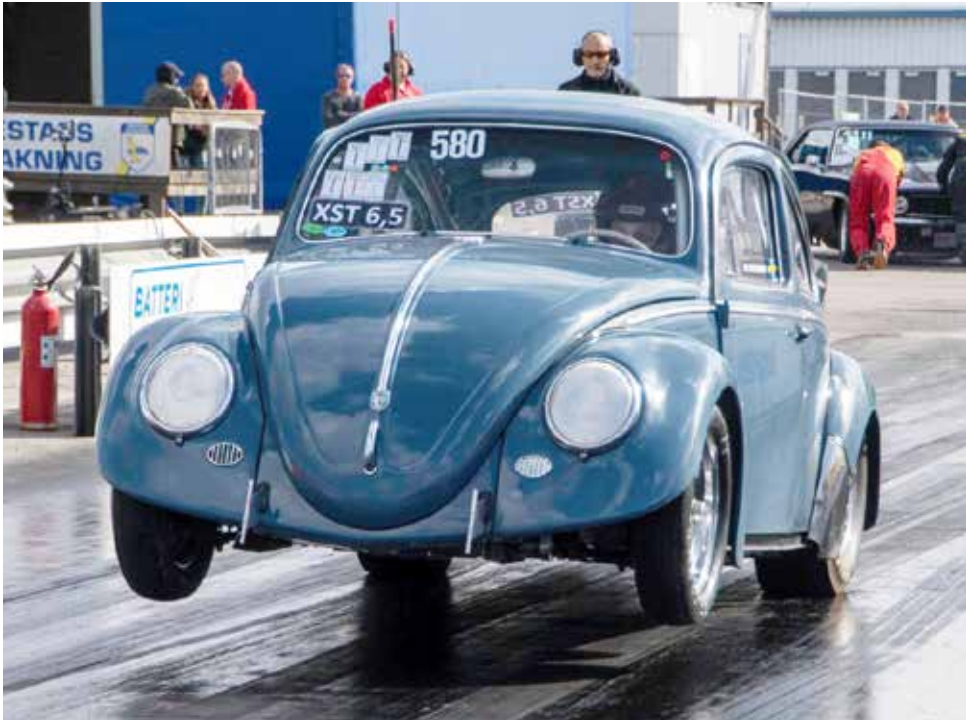
1959 års VW med plåtkaross och 300 hk vid dragracingstart

Motorn som Göran byggde 2008 och sedan inmonterades i en blå VW av års-