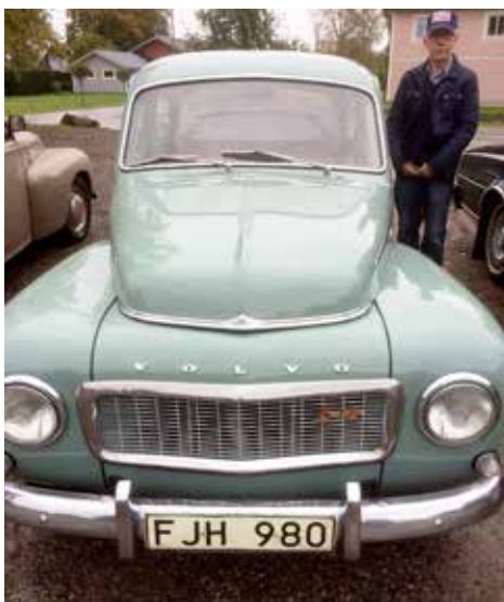
Volvo PV Volvo 544 1961 Växellådan är manuell, motorn är på 75 hk