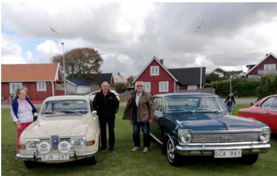
Till vänster Saab 96 V4 från 1969. Manuell växellåda och motor på 65 hk. Till höger Chevrolet Chevy II från 1965. Manuell växellåda och motor på 97 hk.