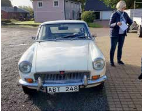
MGB 1800 GT 1969. Växellådan är manuell och motorn är på 92 hk