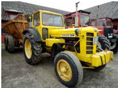
Bolinder-Munktell VO 473 från 1967 försedd med dieselmotor på 79 hk