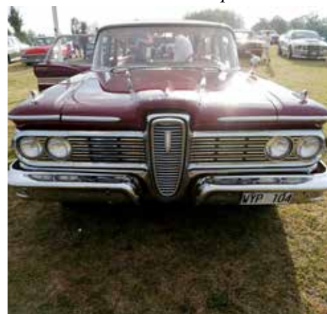
Ford Edsel Villager från 1954. äxellådan är automatisk och motorn är på 224 hk