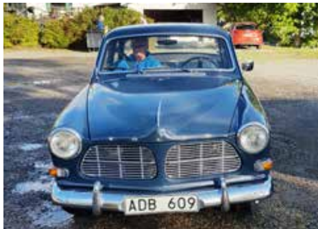
Volvo Amazon 1965. Växellådan är manuell, motorn är på 75 hk