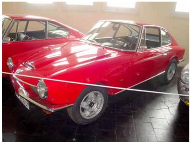
BMW 1600 GT 1969 bredvid en Glas 1300 GT 1965 som i princip är en likadan bil.