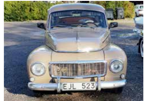
Volvo P 544 1962. Växellådan är manuell, motorn är på 68 hk