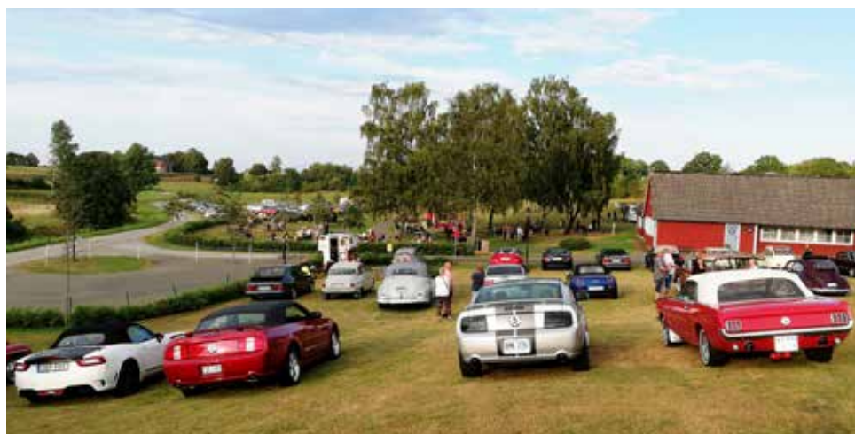
Från vänster ser vi baksidorna av Fiat 124 Spider från 2016, Ford Mustang cabriolet från 2008, Ford Mustang GT från 2005, Ford Mustang 76A convertible från 1966