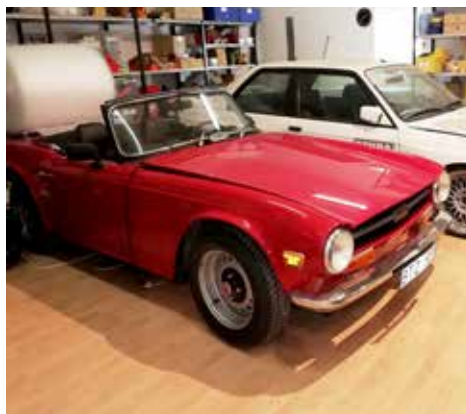
Triumph TR6 1971. Växellådan är manuell och motorn är på 125 hk