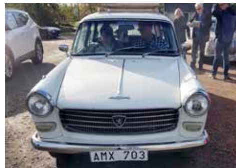
Peugeot 404 LD 1970 Växellådan är manuell, motorn är på 56 hk