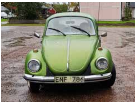
Volkswagen 1303 S 1974. Växellådan är manuell, motorn är på 50 hk