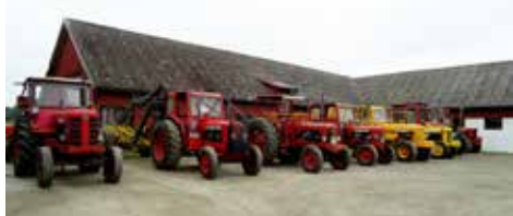
En mängd gamla traktorer av olika fabrikat