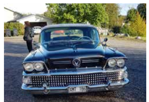
Buick Roadmaster 1958. Växellådan är automatisk, motorn är på 300 hk