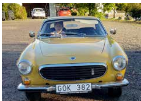
Volvo P1800 1970 Växellådan är manuell, motorn är på 120 hk