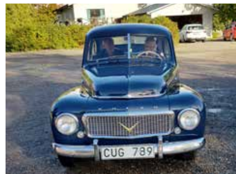
Volvo PV 444 LS 1957. Växellådan är manuell, motorn är på 60 hk