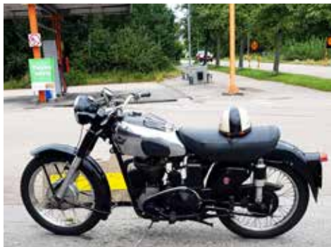
Fotograferad utanför Hemköp i Oskarström