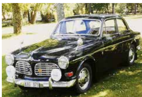
Volvo Amazon 123 GT 1967. Växellådan är manuell och motorn är på 97 hk