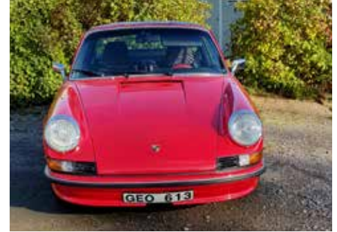
Porsche 911 Targa 1972 Växellådan är manuell, motorn är på 131 hk