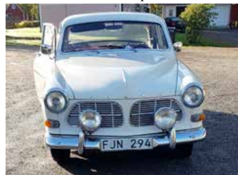
Volvo Amazon 1966. Växellådan är manuell, motorn är på 75 hk