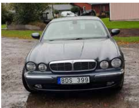
Jaguar XJ6 2.7 D V6 2006. Växellådan är automatisk, motorn är på 207 hk