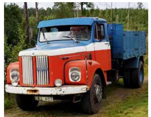
Scania L 110 50 160. Årsmodell 1970