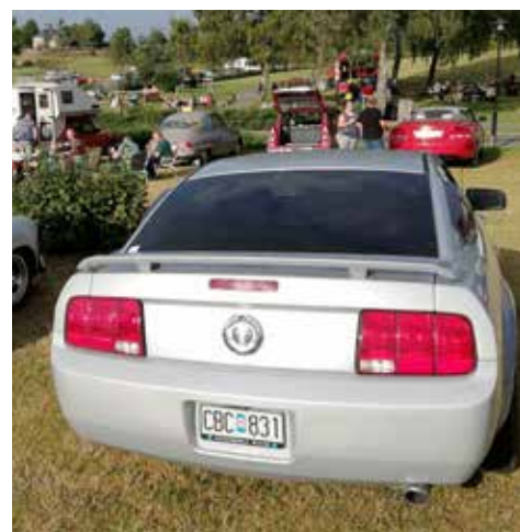
Ford Mustang från 2005. Växellådan är automatisk och motorn är på 211hk