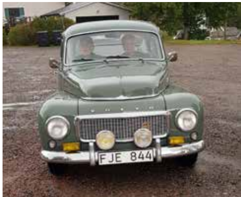
Volvo P 440 1958. Växellådan är manuell, motorn är på 86 hk