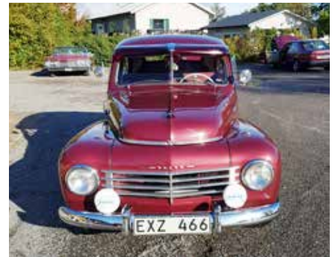
Volvo PV 444 DS 1953 Växellådan är manuell, motorn är på 44 hk