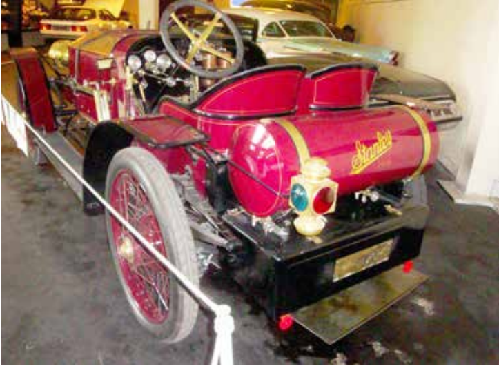
Stanley Vanderbilt Cup Car 1906. Ångdriven racingbil med 450 Nm i vridmoment och en toppfart på 180 km/h!