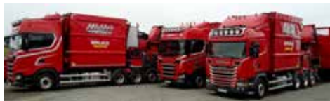
Endast Scania lastbilar