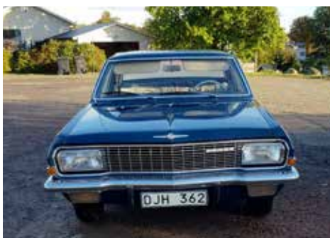
Opel Admiral 1966 Växellådan är automatisk, motorn är på 125 hk