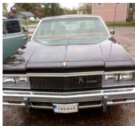
Chevrolet Caprice 1977. Växellådan är automatisk, motorn är på 173 hk