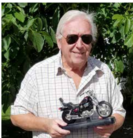
Mats väckarklocka, en Yamaha XVS 750