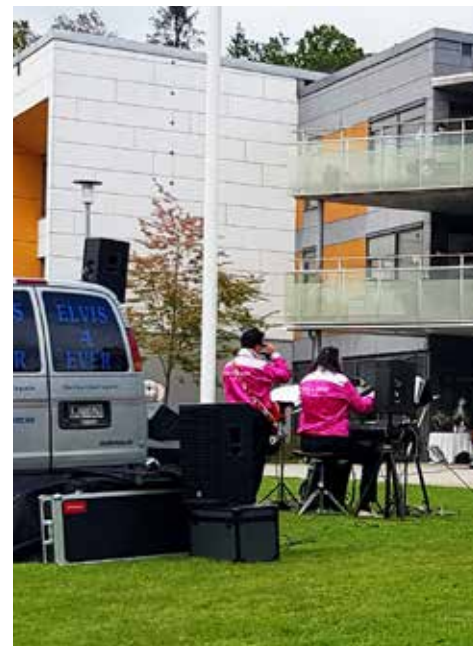
Elvis4Ever spelar utomhus framför äldrebroendet i Oskarström

Den första oktober blev det återigen möjligt att göra besök på våra äldrebroenden. I Oskarström firade man detta med en utomhuskonsert, kamel- och poonyridning för barn samt godisförsäljning. För att ytterligare förhöja dagen hade ett antal veteraner parkerat på gräsmattan framför boendet.