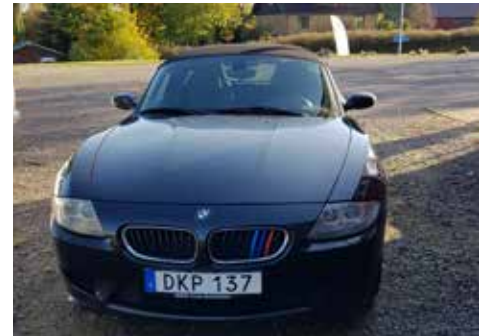
BMW Z4 M Roadster 2006. Växellådan är manuell, motorn är på 343 hk