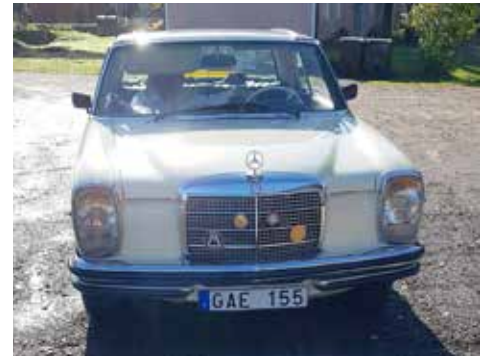
Mercedes-Benz 250 CE/8 E 1970. Växellådan är manuell, motorn är på 150 hk