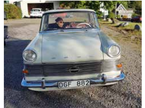
Opel Rekord 1700 1961 Växellådan är manuell, motorn är på 54 hk