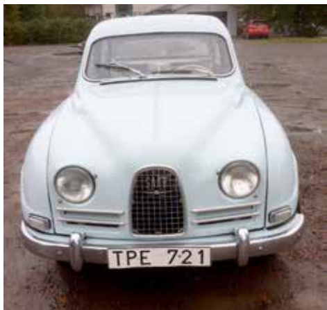
Saab 96 1964. Växellådan är manuell, motorn är på 38 hk