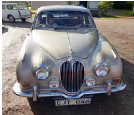
Jaguar MK II 1968 Växellådan är manuell, motorn är på 120 hk