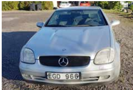
Mercedes-Benz SLK E 1997 Växellådan är automatisk, motorn är på 193 hk