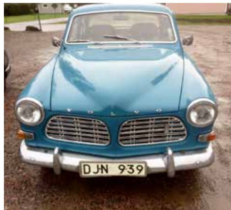
Volvo Amazon 1970. Växellådan är manuell, motorn är på 82 hk