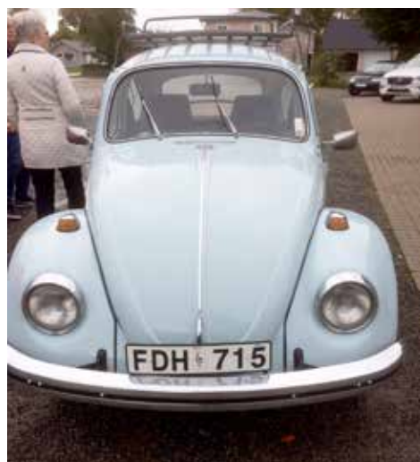
Volkswagen 1300 1969. Växellådan är manuell, motorn är på 39 hk