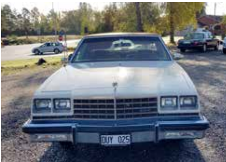
Buick LE Sabre 1980 Växellådan är automatisk, motorn är på 110 hk