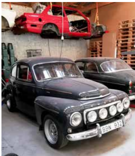
Volvo PV Sport 1962. Växellådan är manuell och motorn är på 90 hk