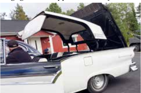
Nu börjar taket sänka sig ner i bagaget