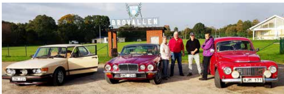
De tre deltagande fordonen med besättning, en Saab 99 från 1984 (yngsta bilen), en Jaguar XJ6 Coupé från 1975 och en Volvo PV Sport från 1961. Bilden tagen vid Brovallen i Vessigebro.