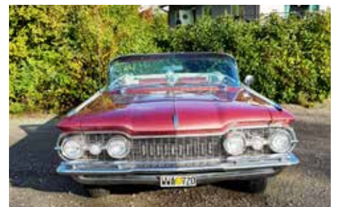
Oldsmobile 88 1959. Växellådan är automatisk, motorn är på 269 hk