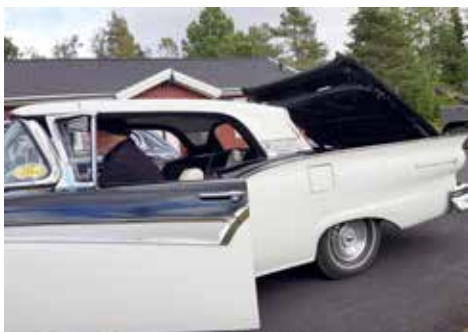
Bagageluckan öppen och klar för taket