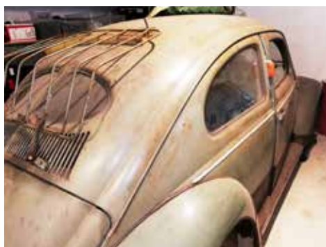
Volkswagen 10/11 C 1951. Växellådan är manuell och motorn är på 24 hk