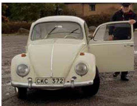
Volkswagen 1200 1965. Växellådan är manuell, motorn är på 34 hk