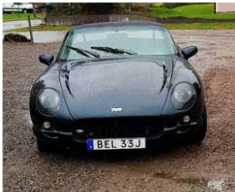
Tvr Chimaera 5.0 1996. Växellådan är manuell, motorn är på 345 hk