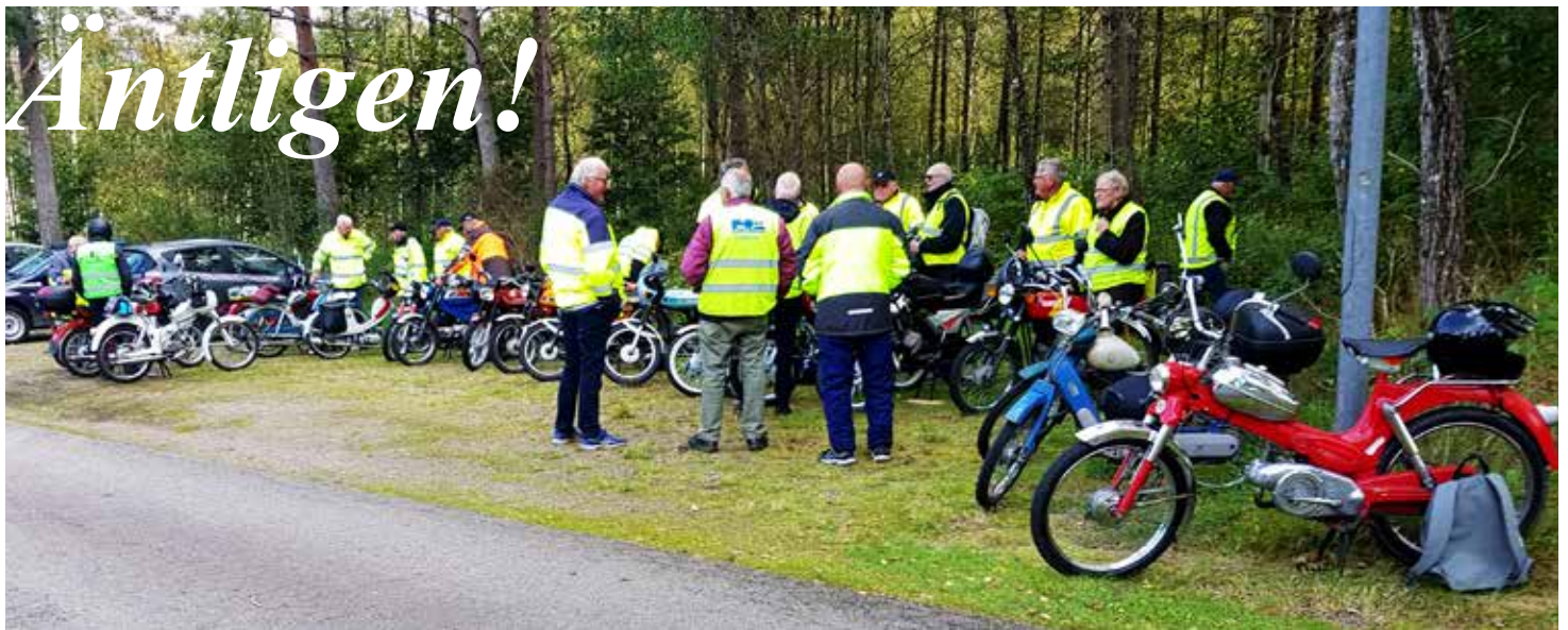
Det blev många mopeder på Friluftsförbundet's parkering torsdagen den 10 september

För första gången denna sommar hade samtliga mopedister i södra Halland bjudits in till en gemensam körning. 23 HFV-are hörsammade utflyktskallelsen Vi samlades, som vanligt, vid Hasses lada i Laholm för att köra till den nyupp-