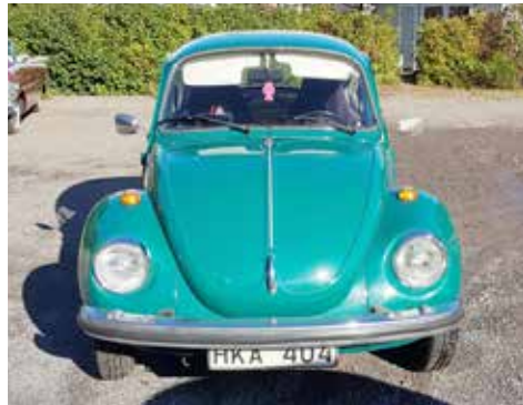
Volkswagen 1303 S 1974. Växellådan är manuell, motorn är på 50 hk

Bilderna på deltagande fordon är tagna av Solveig Johansson och redaktören. Om någon av deltagarna upptäcker att deras fordon inte finns med bland bilderna ber redaktören om överseende med detta.