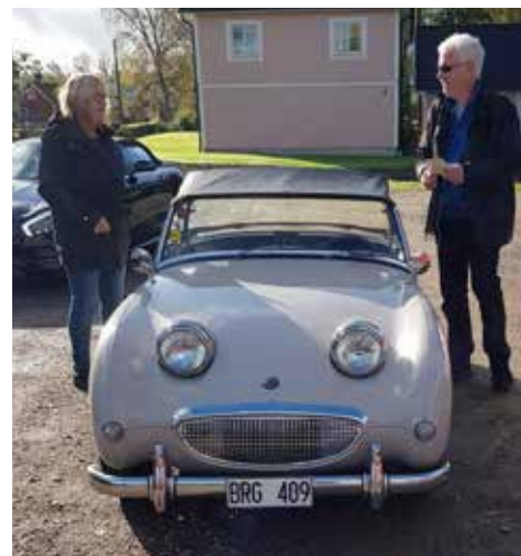
Austin Healey Sprite 1959. Växellådan är manuell, motorn är på 65 hk