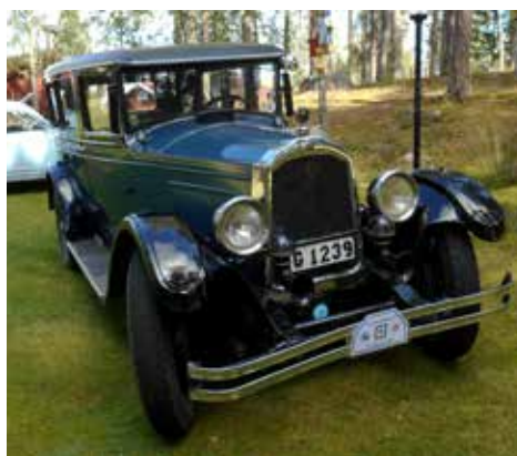
Willys Knight 1927. 6-cylindrig motor på 65 hk, 3-växlad låda

uppgiften var att besöka/visa upp bilen på 6 olika äldreboenden längs vägen runt Helgasjön. Man fick starta vid vilket äldreboende man ville och vi startade vid Evelid, som ligger ganska nära den ordinarie startplatsen vid Evedal. Vi valde att köra moturs (fritt val) och efter c:a 2 mil blev vi invinkade vid en engelsk (!) polis-kontroll och blev tillfrågade om det inte