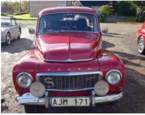
Volvo PV 544- Sport 1961 Växellådan är manuell, motorn är på 90 hk