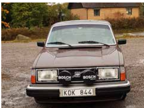
Volvo 244 1979. Växellådan är manuell, motorn är på 101 hk