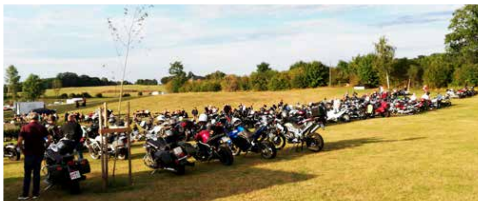
Denna vackra augustikväll var det mängder av motorcyklister som besökte Tykarp