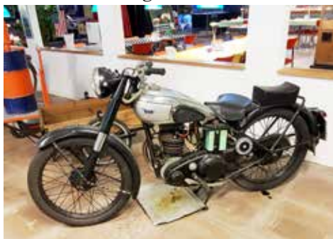
En BSA C11 från 1948