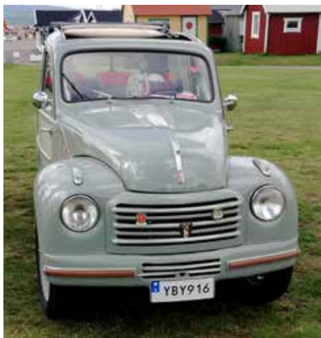
Fiat 500 C Belvedere från 1954. Manuell växellåda och motor på 16 hk