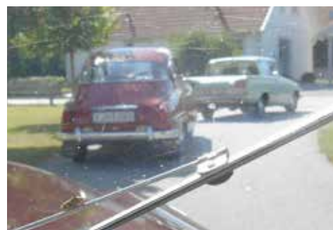
Starten går. Saab 96 1962/63 och Ford Corsair 315 årsmodell 1962 ligger före.

Allt gick bra och lördagen den 29 september rullade vi mot Växjö. Vi hade stakat ut en rutt på småvägar, och valde också att ta oss över mot Småland via den charmiga Bolmsöfärjan. Växjötrafiken var stökig och det är alltid litet oroligt att