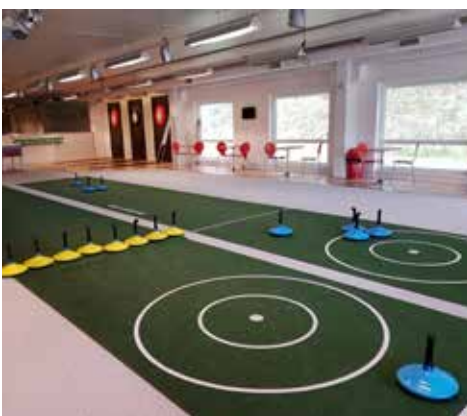
Curlingbanorna med darttavlor i bakgrunden