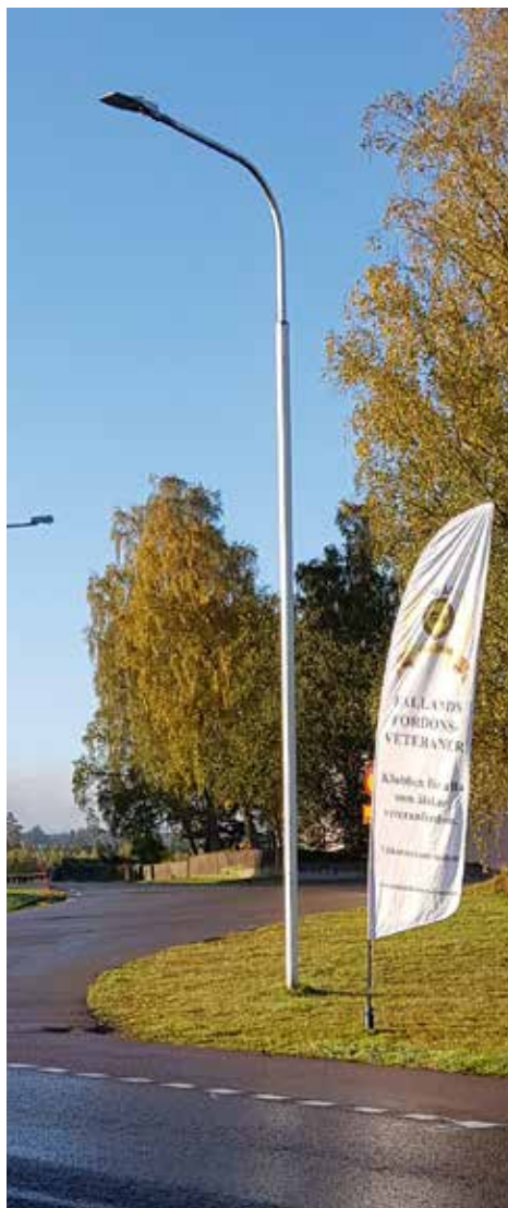
Flaggan visade var man skulle svänga av för att komma till startplatsen

Om det beslutet skall gälla så är det i Varbergs kommun rallyt ska arrangeras 2021 och 2022. Sedan flyttas det till Falkenbergs kommun och Halmstads kommun innan det år 2027 återigen arrangeras i Laholms kommun.