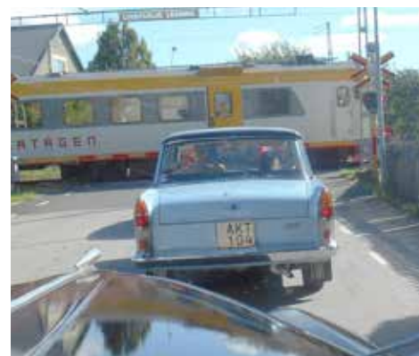
Vi får vänta på ett klassiskt tåg i Alvesta. Fiat 2100 årsmodell 1960 framför.

På måndagen rullade vi hemåt och Opel gick som en klocka hela helgen. Det blev nog en 60-70 mil totalt och "nya" motorn tog inte en droppe olja :-).