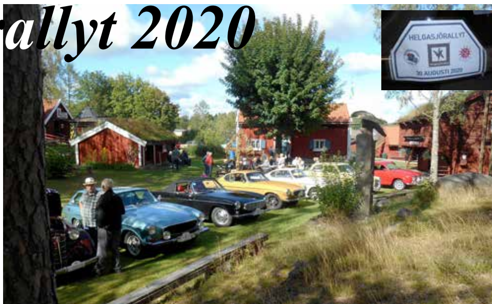
Halvvägsfika i hembygdsparken i Moheda. Olympian längst ner till vänster. Motorhuven är alltid öppen, vid stopp, för att undvika ånglås, och detta medför att alla samlas för att kolla.

Rallyt startade kl. 13 på söndagen och 16