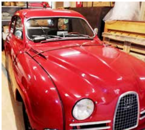
Saab 96 Sport T 1963. Växellådan är manuell och 2-taktsmotorn är på 71 hk