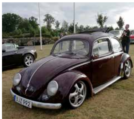
Volkswagen från 1956. Manuell växellåda och motor på 30 hk