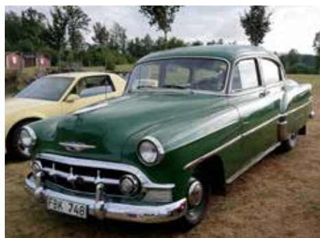
Chevrolet 2103 från 1953. Växellådan är automatisk och motorn är på 107 hk