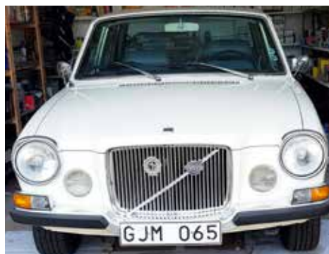
Volvo 164 1970. Växellådan är automatisk, motorn är på 131 hk