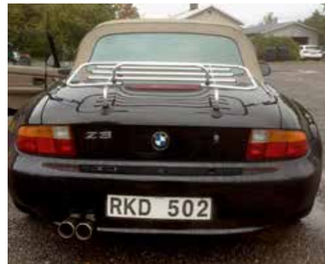
BMW Z3 Roadster 2.8 1997. Växellådan är manuell, motorn är på 192 hk