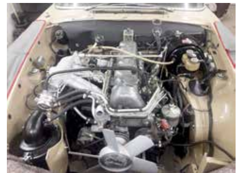
Motorn på plats. Allt blänker.

Sen började det dryga, men roliga. Att montera ihop allt igen. En stor låda från SLS i Tyskland med nya gummi, packningar, torpedmatta och dylikt var inhandlat sen tidigare.