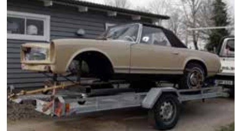
På väg till lackboxen

Sen var det dags för lackering. Jag byggde en provisorisk framvagn så att bilen gick att flytta till trailer och in i lackboxen. Lacka, maska av, Hel%/&# färgen var felbruten. Fick maskera en gång till, slipa och på med ny färg. Denna gång var det rätt.