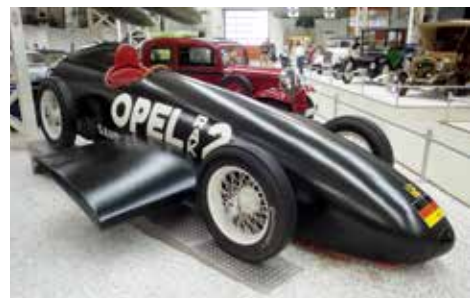
Opel RAK 2 en raketdriven bil från 1928. Toppfart 230 km/h.

Detta museum har faktiskt allt mellan ubåtar och rymdfärjor. Den rymdfärjan som står här, är en av de som byggdes av Sovjetunionen och användes som