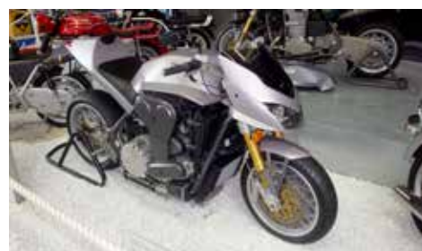
Münch Mammuth 2000. Tysktillverkad MC med en 4-cylindrig turboladdad motor på 256 hkr. Nypris 86000 Euro! Lägg på en nolla så har du det svenska priset.