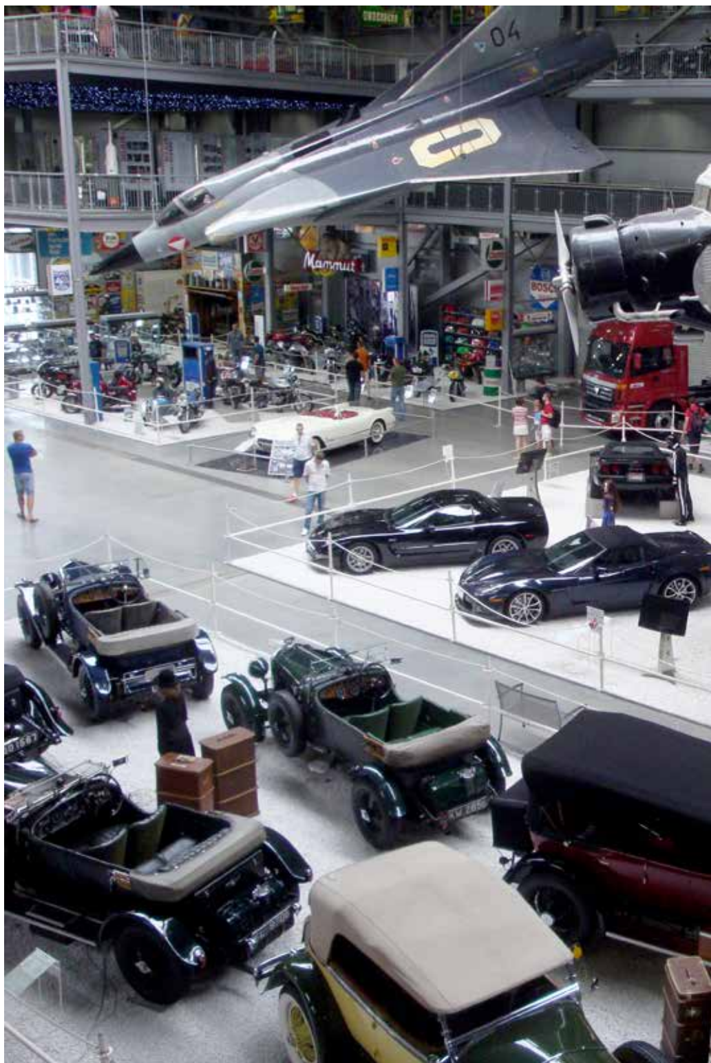
Junkers Ju-52 och ett Drakenplan i en av utställningshallarna tillsammans med en mas-

testfärjor för att senare kunna användas i samma utsträckning som de amerikanska. Dock kollapsade Sovjetunionen innan projektet kunde slutföras och några "riktiga" rymdfärder genomfördes aldrig eftersom pengarna saknades.