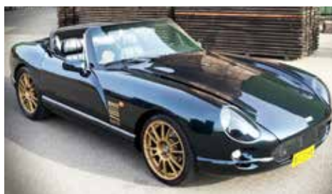
TVR Chimaera 500 årsmodell 1996

När Per ville köpa en bil med V8 var amerikanska bilar uteslutna. En engelsk vänsterstyrd TVR Chimaera 500 med V8-motor på 340 hkr stod på önskelistan och 2019 hittade han, efter mycket letande, en TVR av årsmodell 1996 i Nederländerna. Detta är en väldigt snabb bil 0-100 går på 4 sekunder. Bilen har 340 hkr och väger 1060 kg. Undrar hur engelsmannen trivs bland alla tyskar i Pers garage?