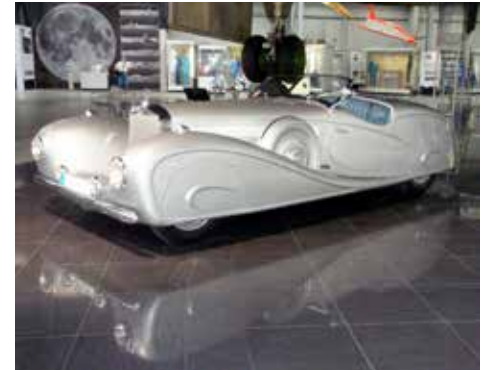
Mercedes Benz 500K 1936 med en rak 8-cylindrig Roots kompressormatad 5-liters motor på 160 hkr. Denna bil har en kaross byggd av Erdmann & Rossi för kungen av Irak.