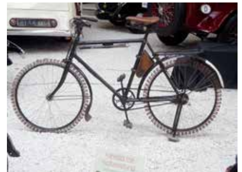
Cykel med "punkteringssäkra" hjul. Troligtvis också en av de första cyklarna med "fjädring".