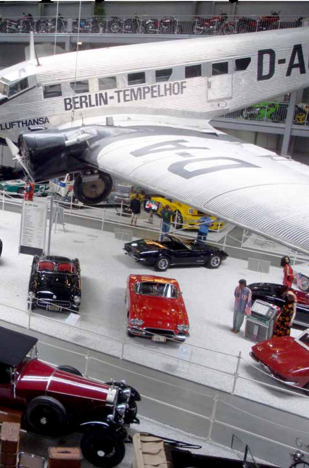
sa sportvagnar och äldre bilar.

cyklar och jättestora mekaniska självspelande instrument.