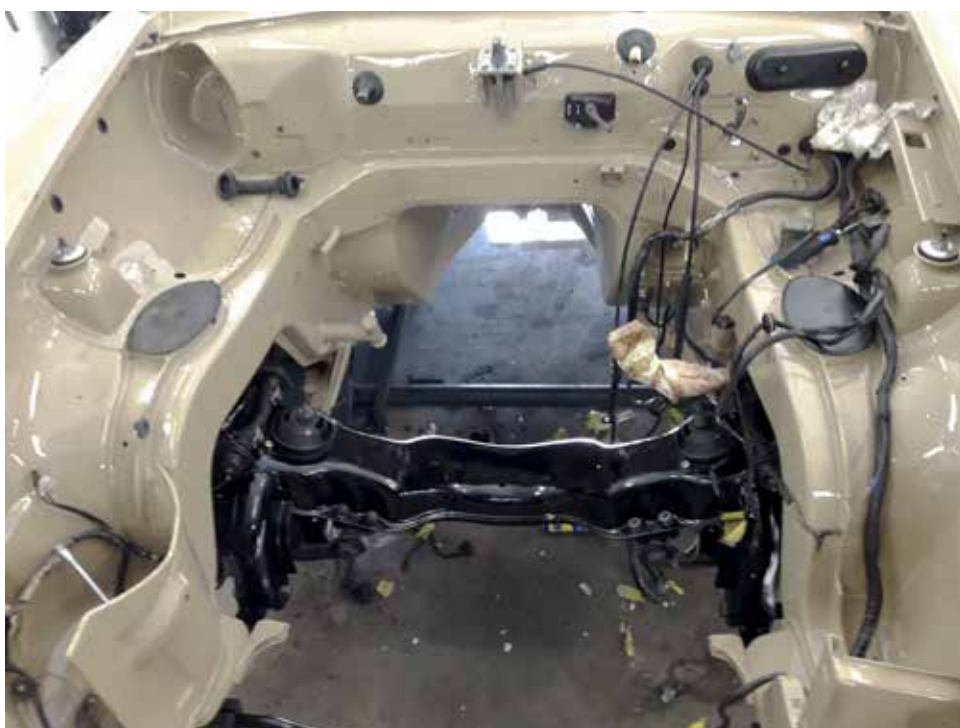
Så här ser mototrummet ut efter den andra lackeringen (med rätt kulör)