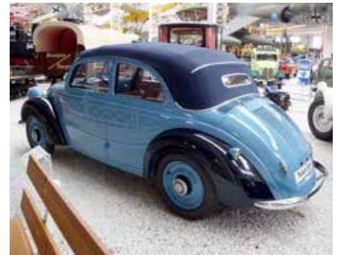
Mercedes-Benz 170H från 1938 med 1,7 liter och 38 hkr motor monterad bak!