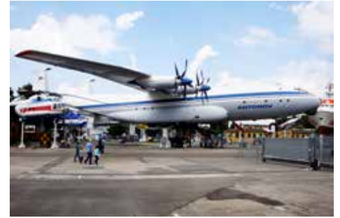
Antonov An-22. En riktig bjässe med 64 meters vingspann och ett lastutrymme som är 33 meter långt och 4,4 meter brett och lika högt!