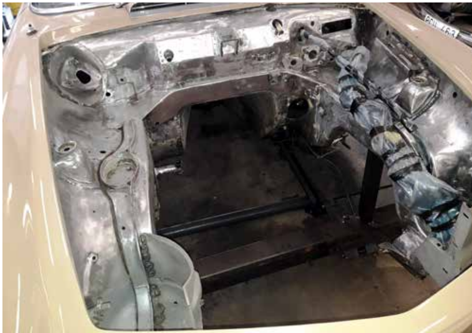
Se så det blänker. ES2 är tydligen det som ska användas vid lackborttagning