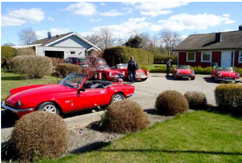
Alla samlades inför avfärd på Gerds och Sven-Eriks garageuppfart i Tvååker

Finns mycket mer att berätta men tillbaka till nutid. Efter fikan fortsatte vi över Skärshult ut till väg 154 Vänster mot Ulared och i Fridhemsberg körde vi in mot Hjärtared, ut på väg 153 mot Varberg.