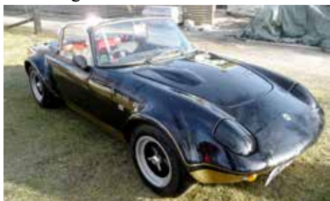
Richards Lotus Elan cabriolet 1969

När väl körkortet var bärgat köpte han bil, och inte vilket bil som helst utan det blev en BMW 1602 från 1972. Den bilen var bland det häftigaste en ung man kunde köra på den tiden. Hyggligt stor varvvillig motor i en lätt kaross borgade för härliga bilturer.