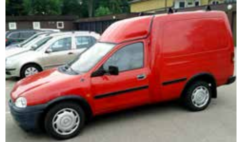
Opel Combo Diesel 1,7 årsmodell 2000

En entusiastbil behöver inte vara en dyr exklusiv bil, det kan bara vara en älskad bil som används sparsamt och inte körs i daglig trafik.