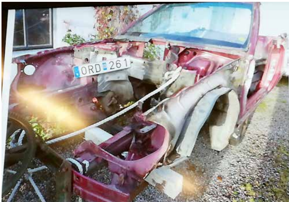
Den isärplockade och plundrade donatorbilen