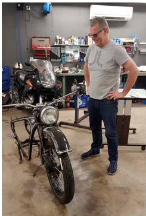
Renoveringsobjektet, en BMW 350 cc från 1948. I bakgrunden syns Pers BMW 1200 RS

Samma år införskaffades också en Plymouth -58 som äldre kamrater naturligtvis fick köra. Vid 24 års ålder köpte han en riktigt "grym bil", en Ford Mustang Mach 1 av 1971 års modell.