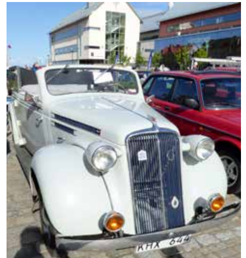
Volvo PV 51C cabriolet 1937. Manuell växellåda och hela 86 hästkrafter