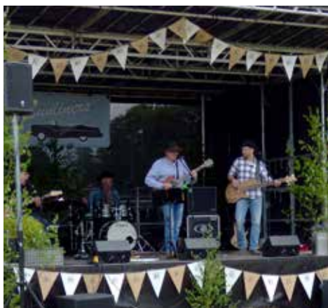
Alltid "levande musik" vid samlingen

DIN KOMPLETTA KYLARVERKSTAD FÖR VETERAN KYLARE med 30 års erfarenhet