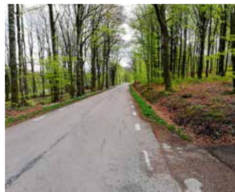
Bokens skira grönska förhöjde dagen

Vet att någon budat till en spontanträff med utgångspunkt Gröningen på den "vanliga" dagen för majrundan den 1 maj. Men... vi tyckte vädret var för dåligt, kallt och blåsigt och efter en titt