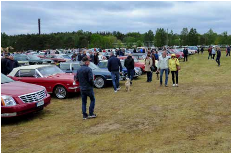
Riksettan-rallyt samlar mängder med bilar för nostalgikörning på riksväg 1