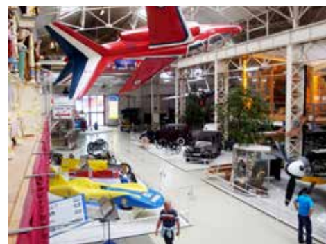
En av alla stora utställningshallar med flygplan, lastbilar, motorcyklar, alla former av bilar och mycket mycket mer.