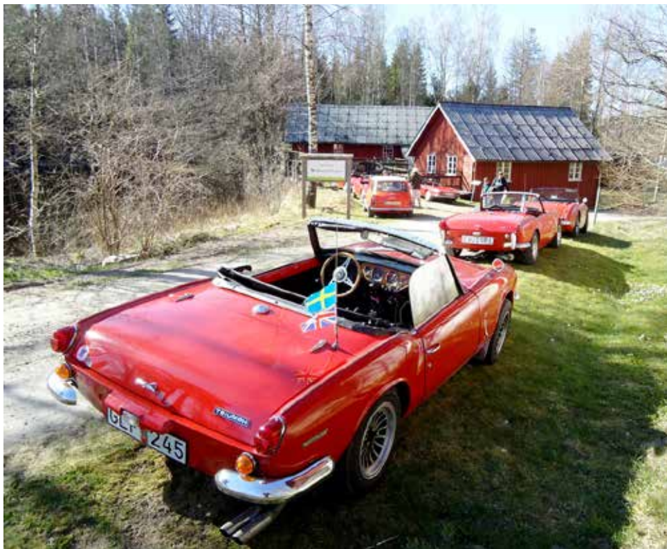
Många röda bilar, 3 Triumph Spitfire, en Austin Healey 3000 och en Hundkoja

Söndagen den 19/4 gjorde vi den första gemensamma utflykten år 2020. Virusnet gör att vi träffas ute, håller avstånd och samåker inte.