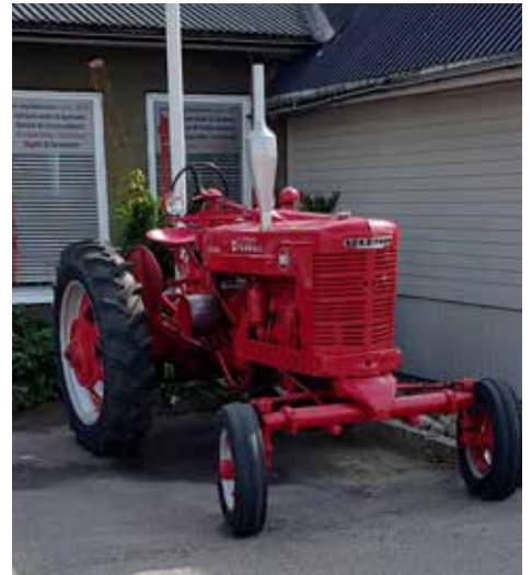
En McCormick Farmall, amerikansk veterantraktor. Stod utanför en butik i Järvsö.

Vad mycket det finns att titta på (och som är värt att fotografera) när man är ute och reser. Redaktören vill dela med sig av ett par fynd, en traktor och en "pelarbil".