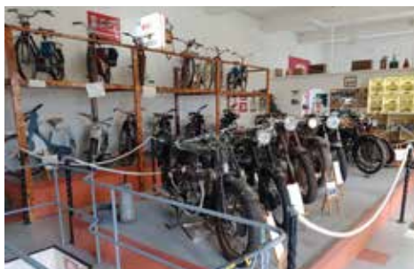
En mängd motorcyklar