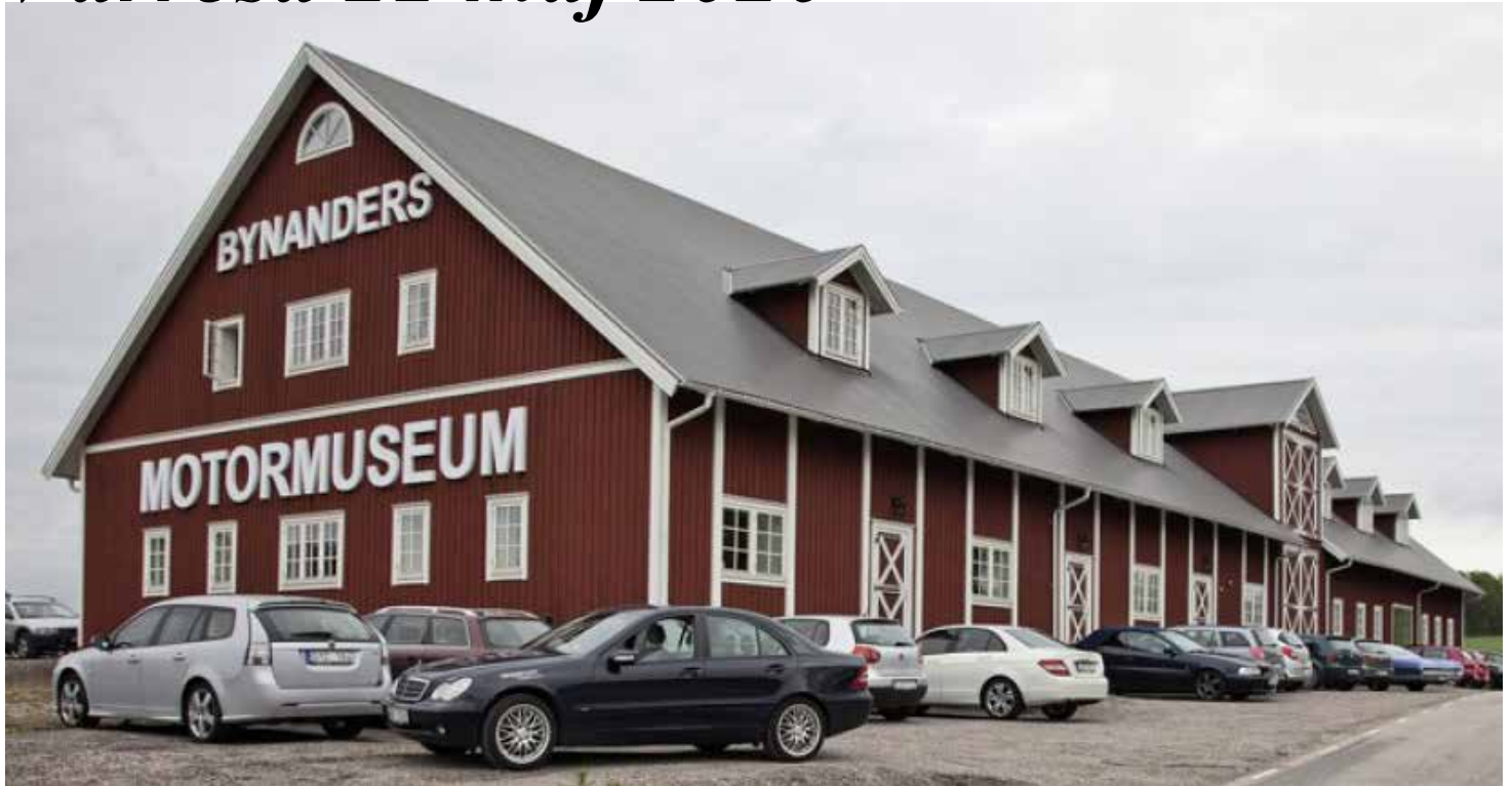
Bynanders Motormuseum i Svenljunga