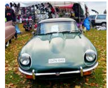
Jaguar E-Type 4,2 Cab 1970 Ägare Tord Ahlberg, Haverdal