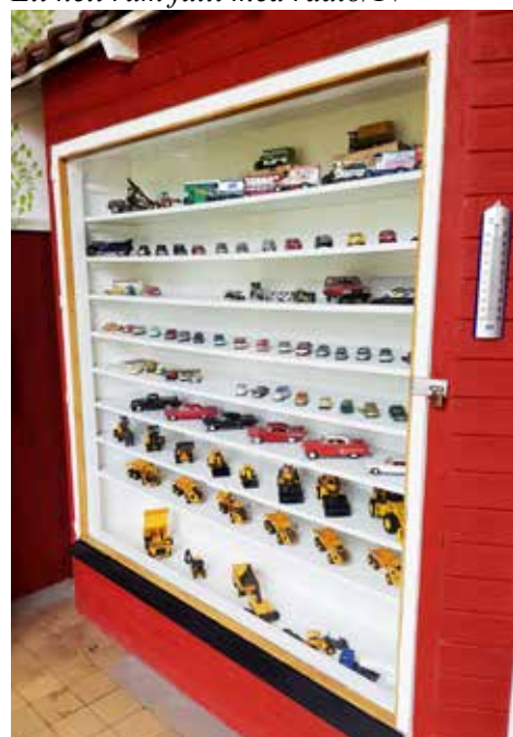
Modellbilar i flera skåp