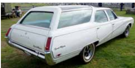
På finbilsparkeringen hittar man ofta udda bilar. Här en Buick Sportwagon 1969 med ovanligt påkostad design. Lägg märke till rutorna uppe på sidorna i bagagerummets tak.

bilarna började säljas 1989 och hux flux så har det gått 30 år och nu är denna lilla bil veteran. Inte nog med det, den är relativt billig, tillförlitlig, och man kan ha den till mer än man tror.