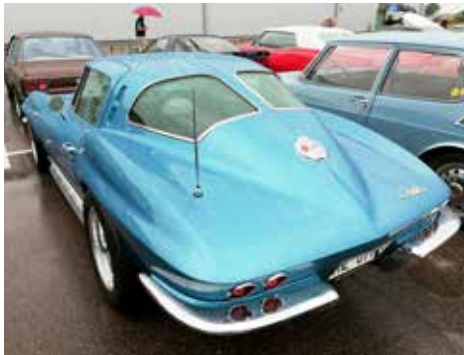
Corvette 1963 en raritet, som vågade sig ut i regnet. Vård runt en miljon kronor