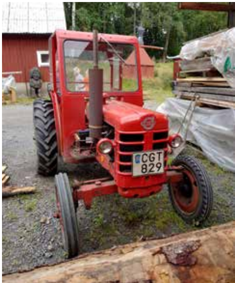
En Volvo 15 från 1956

Här finns det mycket intressant att se. T ex en nästan luktfri toalett från 1700-talet. Här finns också konsthantverk, uppbyggda nostalgimiljöer, ångmaskiner, vattenbruk osv. Denna pärla i norra delen av Halland är väl värd ett besök.