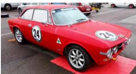
Är detta månde Alfas snyggaste bil genom tiderna? Jag tycker det!