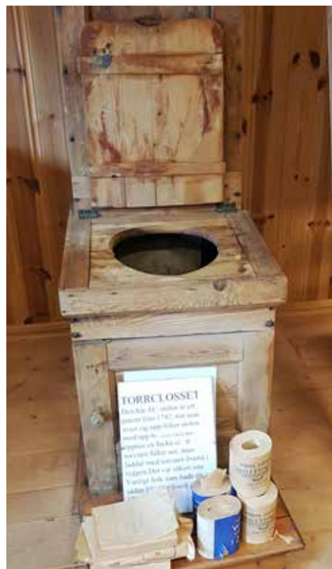
Torrklosett, ett patent från 1742. När man reser sig upp följer sitsen med 6 cm och det öppnas en lucka så att torvströ faller ner på avföringen.