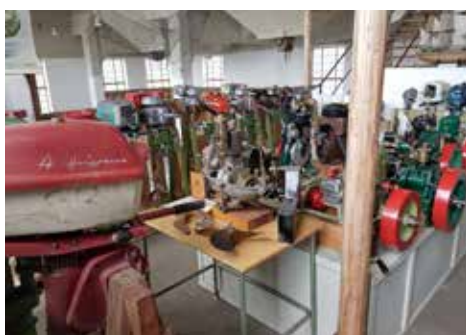
Båtmotorer så långt ögat räckte