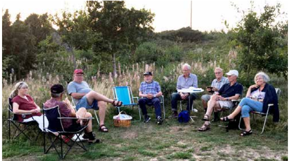
En trevlig onsdagskväll i Laxvik.