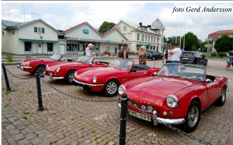
Triumph-gänget från Tvååker parkerade på Svenljunga torg för att köpa glass