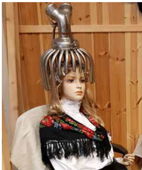
Skulle dagens moderna kvinnor våga sätta sig i en sådan här tork?