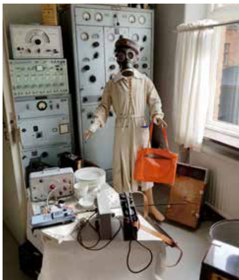
Om kriget kommer