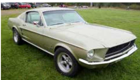
En av de finaste Mustanger som fanns på motorbanan denna dag.