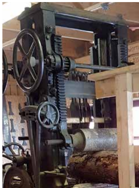
Planksågning med hjälp av en ångmaskin på 100 hk