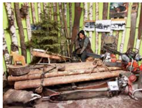
Arbete i skogen