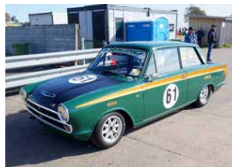
Ford Cortina, en av de snyggaste bilarna på 60-talet. Snabba var de också!

som "fikabil" och finbil i samband med Falkenberg Classic. Som sagt, det är bara att välja vad man vill göra, Miatan kan nästan allt.