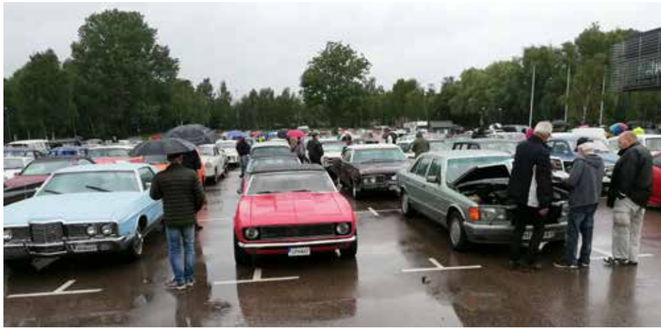
Det var, som synes ovan, riktigt blött denna augustidag.

Trots det usla och blöta vädret kom drygt 350 fordon till start vid Catena Arena. Inte många medlemsbilar men lite godis ändå. Lergökarallyt hade målgång på Vallåkra-träffen, Enoch Thulins flygplats, vilket fororsakade viss förvirring då det inte fanns någon avsatt plats för Lergökarallyts deltagare utan de fick sprida ut sig för att hitta parkeringsplats. Innan målgång hade deltagarna kört över Söderåsen med stopp i Östra Ljungby, vid bilbesiktningen Besikta i Klippan och vid Ekeby möbelaffär där det var frågesport för deltagarna. Inga framskjutna placeringar för HFV-are har rapporterats.