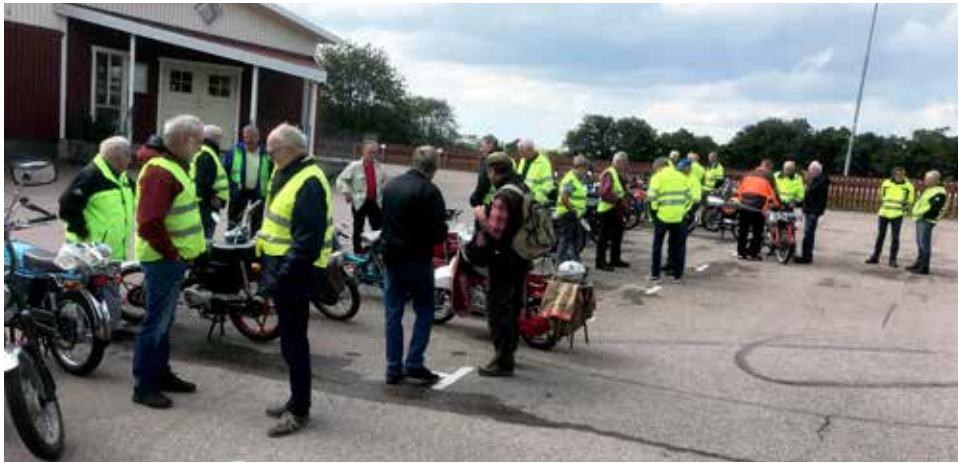
Samlingen vid Lagagården i Laholm

Idag torsdag den femtonde augusti samlades ett gäng moppeåkare vid Lagagården för färd mot Tönnersjö GK. Vi körde upp mot Ahls för att sedan vika