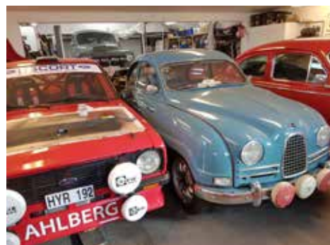
Ford Escort, 1975 tillsammans med En SAAB 93 GT Replika