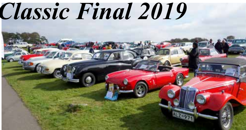
HFV:s parkering på Falkenberg Classic med redaktörens pampiga Jaguar MK VII 1954 i mitten.

Något som gör MX-5:an extra intressant nu, oavsett om man gillar veteranbilar, sportbilar eller bara vill ha en liten trevlig bil att glida omkring med, så är det på det viset att från och med 2019 så börjar Mazda MX-5 bli en veteranbil. De första