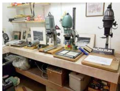
Kameror och fotoutrustning