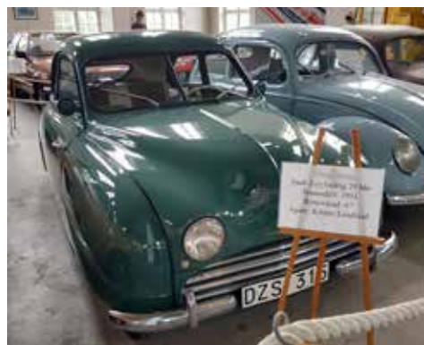
Saab årsmodell -51 med 29 hk

När man är ute och kör bil i Sverige passerar man mycket sevärt. Redaktören passerade t ex Grängesbergs Motor & Nostalgimuseum i somras och naturligtvis blev det ett besök. Ett mer varierat nostalgimuseum tror jag är svårt att hitta. Här fanns massor med avdelningar och en oändlig mängd prylar och miljöer. Bilderna är bara ett axplock men ger kanske ändå en bild av vad museet har att erbjuda.