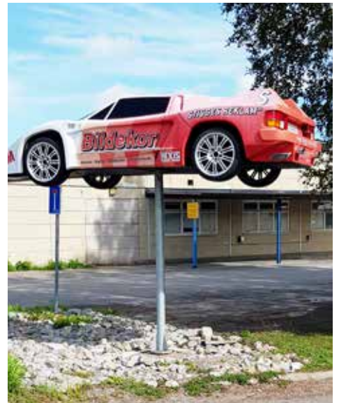
Reklampelare i dess sanna bemärkelse. Stigges Reklam i Järvsö gör reklam för sin bildekorverksamhet