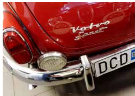
Det ska vara Volvo PV Sport