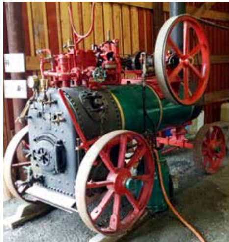
Lokomobil 1908, tillverkad av Munktells Mekaniska Verkstads AB i Eskilstuna Ångpannan är tillverkad av Nydqvist och Holm AB i Trollhättan och är på 8 hk