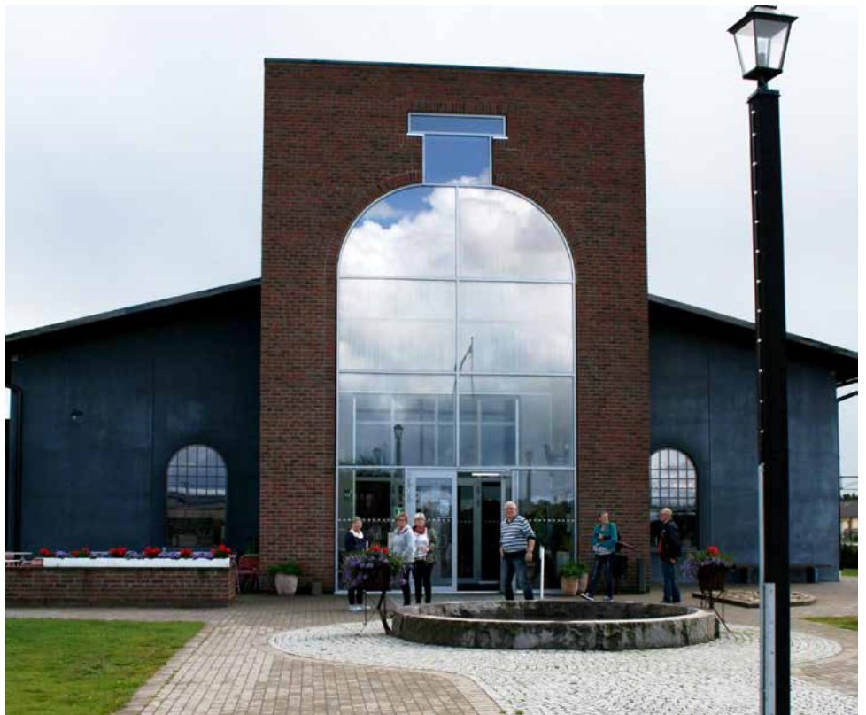
Glasets Hus i Limmared (ser ni flaskan?)

Vi startar i Mellbystrand vid 8 tiden med stopp i Halmstad och Falkenberg, hemma igen mellan kl 18-19.