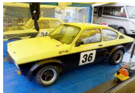
Opel Kadett GT/E! En klassiker i rallsammanhang och även snabb på bana!