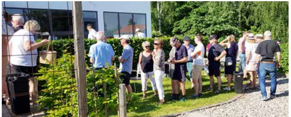
Det blev lite kö in till frukosten på Thai Corner när många blev kaffesugna samtidigt