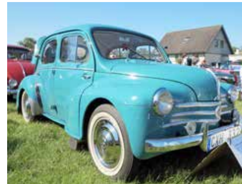
Renault CV4 från 1960 i mycket bra skick. Ägare Bernt Axell, Skummeslövsstrand.