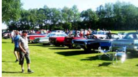
Stora parkeringsytor - många fordon

En strålande fin sommarkväll beslutade vi oss att besöka den omtalade bilträffen i Billesholm. Efter lite konkurrens i fjol med de traditionella träffarna i Folkets park så har de båda konkurrenterna nu enats om att lägga sina träffar på olika datum.