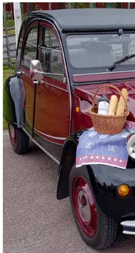
Rött franskt vin, ost och painriche. Alla i bilen var också iklädda basker och randiga tröjor. Riktigt franskt!

Att ha rally över två dagar var en mycket trevlig variant. Att som Dalarnas Automobilklubb köra många rallyn med begränsat antal deltagare är också en bra