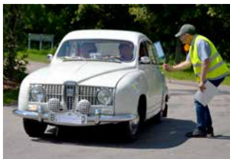
Redaktören visade rallydeltagarna rätt vid kontrollstationen i Tönnersjö.