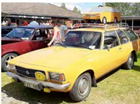
Opel med reservbil på taket