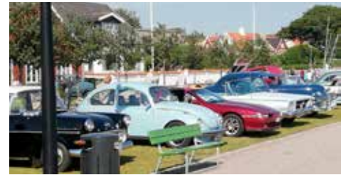
Alltid mycket fordon i Viken