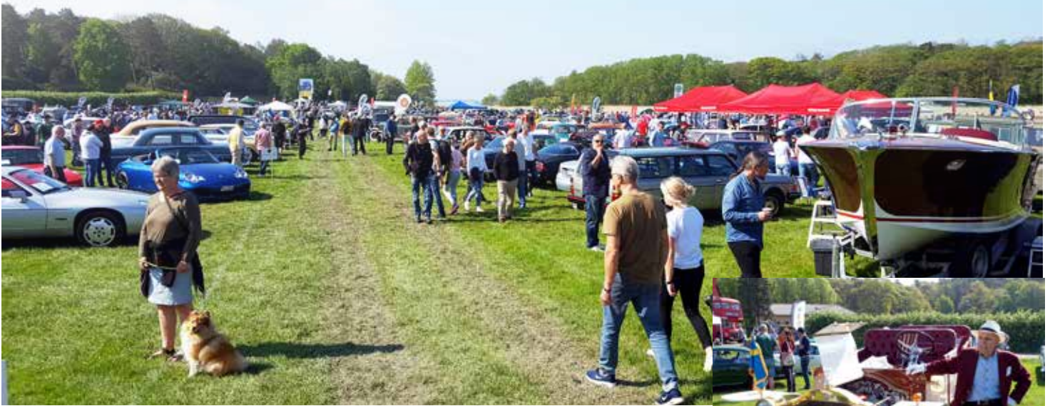
Strålande väder, massor av fordon av alla slag samt mängder med publik