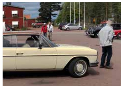
Mats på väg till rallystarten men måste först vänta på att en äldre gentleman behagade flytta på sig.

idé, speciellt när klubben spänner över ett så stort geografiskt område. Nu kan alla medlemmar vara med och köra rally utan att ha alltför långt till start och mål.