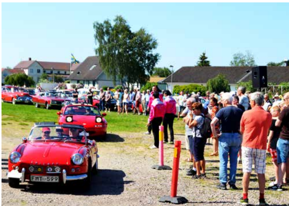
Att lägga start- och målplatsen centralt i Mellbystrand gjorde att Västkustrallyt start kantades av mängder med nyfikna besökare som beundrade alla de vackra fordonen.