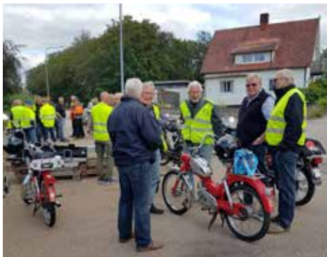
26 mopedister samlades vid Ysby gamla smedja för att gemensamt köra till Edenberga Nya Kvarn

per år vilket motsvarar behovet för 2-3 eluppvärmda villor.