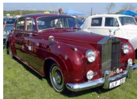
Rolls Royce Silver Cloud från 1961, förlängd och med mellanruta