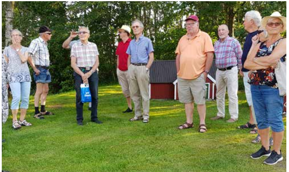
Några HFV-are som ville vara med på bild