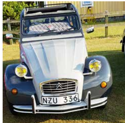
Citroen 2CV6 årsmodell 1988. Ägare Rolf Arrborn, Halmstad

27 bilar på gårdsplanen och ca 60 personer besökte Mellbystrand denna kväll. Här ser ni några av alla de bilar som var på plats.