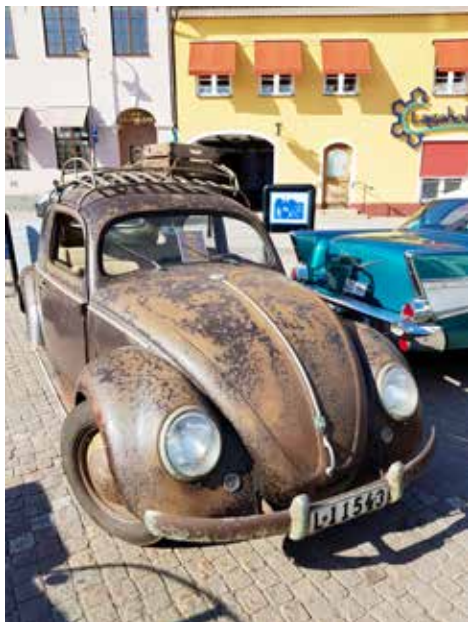
En väl patinerad VW från tidigt 1950-tal väckte stort intresse

gjorde att torget fylldes med både bilar, mc och traktorer, men kanske framförallt med nyfikna och veteranfordonsintresserade människor. Kanske några av dem är blivande medlemmar. Solveig Johansson hade lagt ut Fördelardosan och