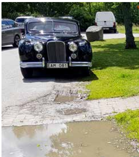
Resan upp till Dalarna blev blöt

Nu var det lite långt att köra på en dag så övernattningsplanering var planerad på Best Western i Askersund, nästan precis halvvägs. Det blev en blöt resa upp. Det regnade till och från hela vägen upp till Askersund. På fredagen fortsatte resan mot Leksand och nu i betydligt bättre väder även om det regnade den sista milen. Väl framme sken dock solen.