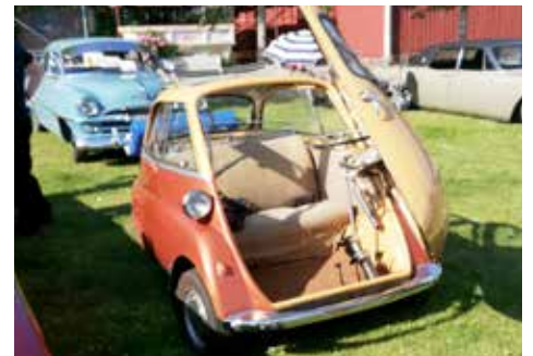
En Henkel Cabin luftar sig i värmen

Det finns annat att titta på också. Varför inte ta en promenad i marinan och njuta av alla vackra båtar