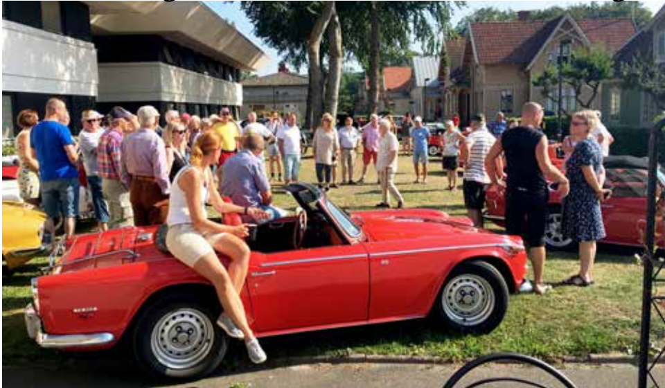
Massor av folk, mängder med bilar. Soligt och varmt, vad kan man mer begära?

54 bilar anmälda från Sverige, Finland, Tyskland, Danmark och Norge. Den som kört längst kom från Pajala.