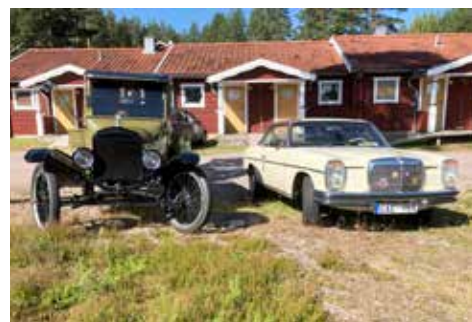
Mats bil (Mercedesen) parkerad framför vårt stugboende i Moskogen. Som parkeringskamrat en T-Ford.