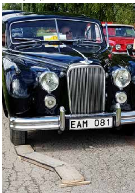
Brädkörning, svårt med "muskelservo"

Mats klarade detta galant! Redaktören fick 0 poäng.