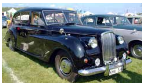
Austin Princess Limousine Vanden Plas från 1961