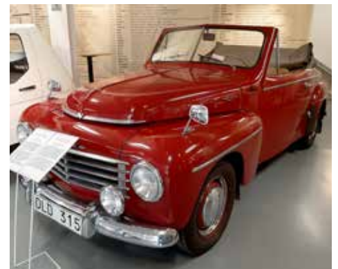
Volvo PV -53.