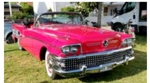
Buick Century 1958. En underbart vacker cabriolet

DIN KOMPLETTA KYLARVERKSTAD FÖR VETERAN KYLARE med 30 års erfarenhet