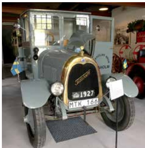
Tidaholmaren från 1927