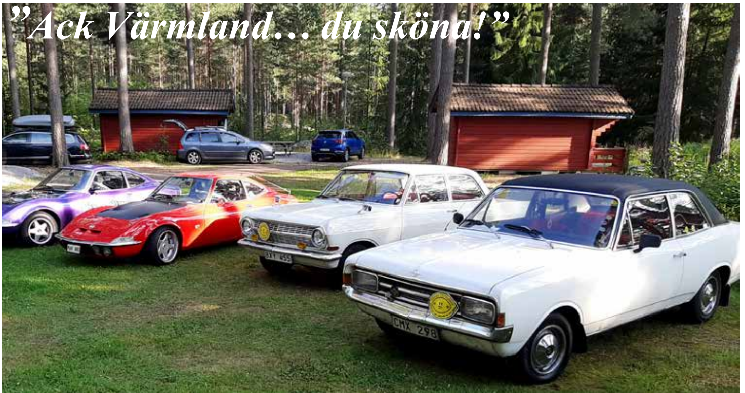
Oplar på rad utanför stugorna vid Glafs fjorden, strax utanför Arvika i Värmland

Javisst är det så! Och kanske just därför blev Arvika den ort som Svenska Opelklubben valde att lägga sin stora årliga sammankomst vid – vid sjön Glafs fjorden och Ingestrands Camping. Staden som var en ort som utvecklades långsamt fram till 1837 då bygget av Säffle kanal öppnade upp en farled till Vänern. När också Nordvästra stambanan stod klar 1871 började en expansion som skulle stå sig i ett sekel. Idag finns små och medelstora företag, därtill en del större exportföretag som exempelvis Arvika-verken som är världens största tillverkare av hjullastare.