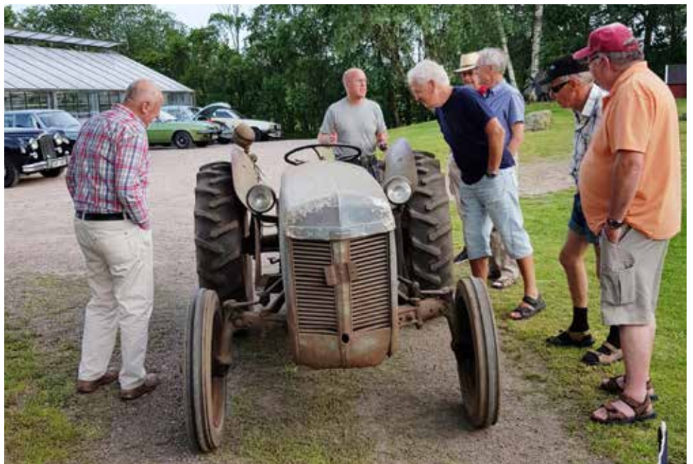
Den gamla traktorn väckte stor nyfikenhet hos några av deltagarna