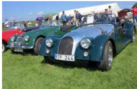
Morgan Roadster Brookland Edition från 2014