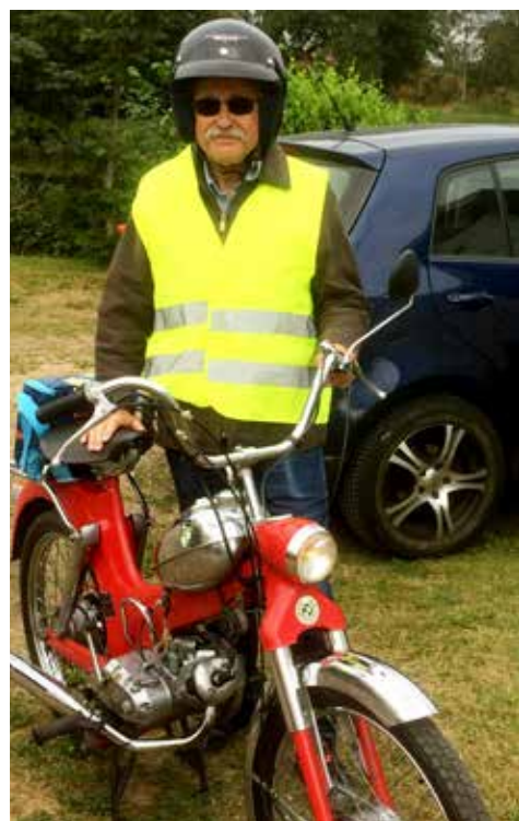
Redaktören vid mopeden iförd hjälm, solglasögon och reflexväst.

Edenberga Nya Kvarn. Det blev ganska mycket grusvägar innan vi nådde dagens utflyktsmål.