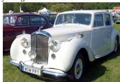
Bentley från 1947