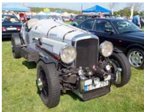
Bentley Special nr 12. Chassit är en B23GD, 1959, byggd för att efterlikna racerbilarna få 20-30-talet