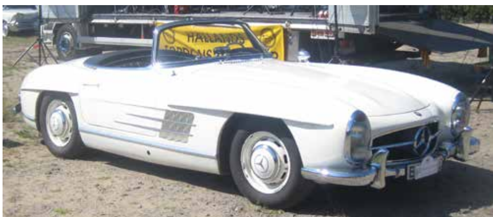
Rallyts vackraste bil blev en Mercedes 300 SL från 1961.