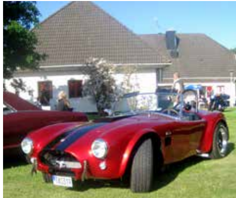
Kron Cobra Hybrid årsmodell 2018