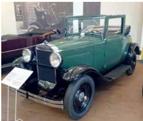
Opel P6 -36.

Javisst är det så! Och kanske just därför blev Arvika den ort som Svenska Opelklubben valde att lägga sin stora årliga sammankomst vid – vid sjön Glafs fjorden och Ingestrands Camping. Staden som var en ort som utvecklades långsamt fram till 1837 då bygget av Säffle kanal öppnade upp en farled till Vänern. När också Nordvästra stambanan stod klar 1871 började en expansion som skulle stå sig i ett sekel. Idag finns små och medelstora företag, därtill en del större exportföretag som exempelvis Arvika-verken som är världens största tillverkare av hjullastare.