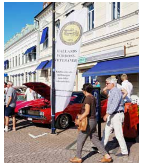
HFV hade flaggan i topp denna kväll