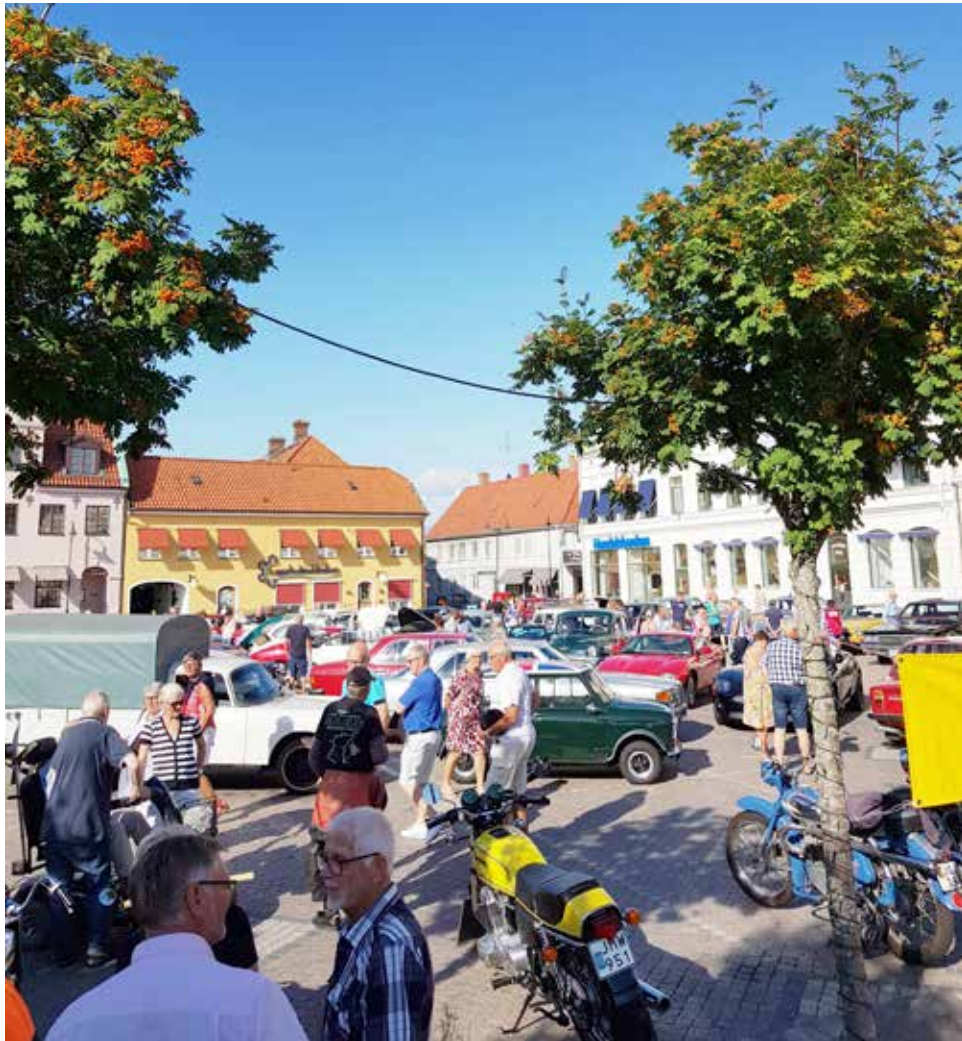
Trångt, folkligt, festligt - en bra sammanfattning för denna trevliga kväll

Så var det åter dags för Laholms Köpmän att bjuda in Hallands Fordonsveteraner till Torget i Laholm. För vilket år i ordningen är det nog ingen som vet - bara att vi varit där många gånger. I år hade vi också tur med vädret vilket