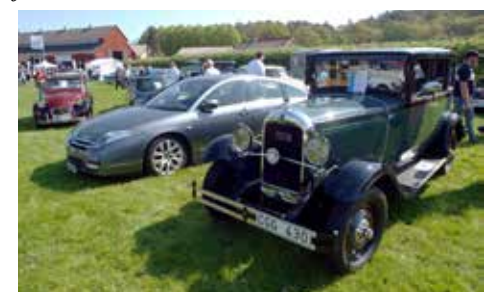
Citroënsamling. Noterbart är att det står två C6 bredvid varandran. Det skiljer 83 år mellan dem. Den äldre är från 1929 och den nyare från 2012