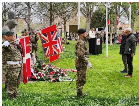
5 maj mindehøjtidelighed