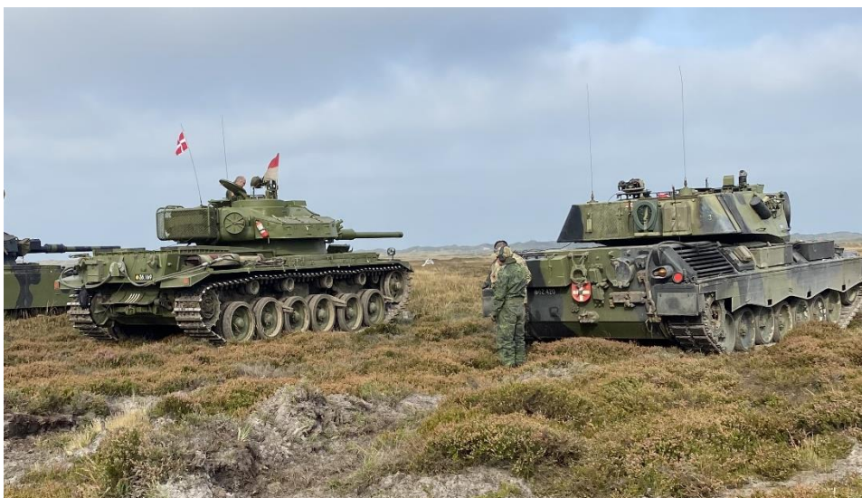
Reg. nr. 26.169 Centurion klar til skarp skydning første gang siden 1997, standpladsflaget er hejst.

forlænget og forhøjet, har moderne motor og transmission og ikke mindst er den monteret med gummi-bælter, som gør det væsentlig mere støjsvag under kørsel. AKVPK's version er opbygget som ambulance (deraf forkortelsen AMB) køretøj, og foreningen har, siden modtagelse af køretøjet i 2022, fremskaffet udstyr, så den i dag står fuldt monteret indvendig og udvendig som da den var i drift ved Trænregimentet. Køretøjet har været indsat i internationale operationer såvel som i nationalt sneberedskab i vinterperioder.