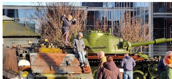
Fyns Militærhistoriske Museum fejrer 40 års jubilæum med åbent hus

Vores vision med udstillingen er at tiltrække skoleklasser, soldaterforeninger, historisk interesserede og den almindelige borger uden speciel militærhistorisk viden. Vi vil tilrettelægge formidlingen så forskellige kategorier af besøgende alle får en god oplevelse og perspektiveret betydningen af forsvaret på Fyn og de mange sidehistorier, der knytter sig hertil.