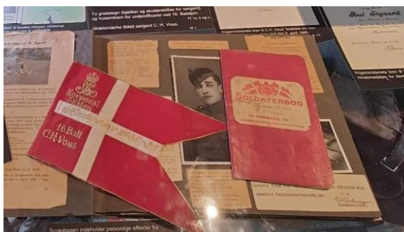
9 april 1940 udstillingen

Det er med glæde, at vi gennem året har kunne tage imod mange besøgende fra foreninger, skoler og mange andre interesserede. Samtidig har vi kunnet sige velkommen til flere frivillige på museet i løbet af efteråret. Skulle der være flere, der kunne tænke jer at give en hånd med som frivillig, er I meget velkomne til at komme forbi og besøge os i museets åbningstid, til en samtale og en kop kaffe. Vi har i løbet af sensommeren og efteråret 2023 haft en øget tilgang til vores medlemsforening, hvor man med sit kontingent støtter museet. Skulle du endnu ikke være medlem kan du blive det her https://milmus.dk/om-os/medlemskab-og-kontingent , det koster kun 200 kr om året.