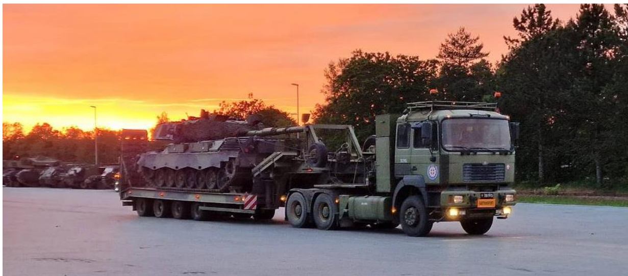
AKVPK blokvognstog og Leopard 1 klar til transport.

AKVPK MAN 35.464 og VM-45 blokvognstog var, som sædvanligt fristes man til at sige, efterspurgt til transport af kampvogne og bæltekøretøjer. Blokvognstoget har udover kørsel i forbindelse med Åben Hede, også fragtet historiske køretøjer til en del andre arrangementer i løbet af året. Udover at mekanikken har godt af at blive motioneret, så bidrager brugen af AKVPK blokvognstog fortsat til historien omkring transport kapacitet på Aalborg kaserner.