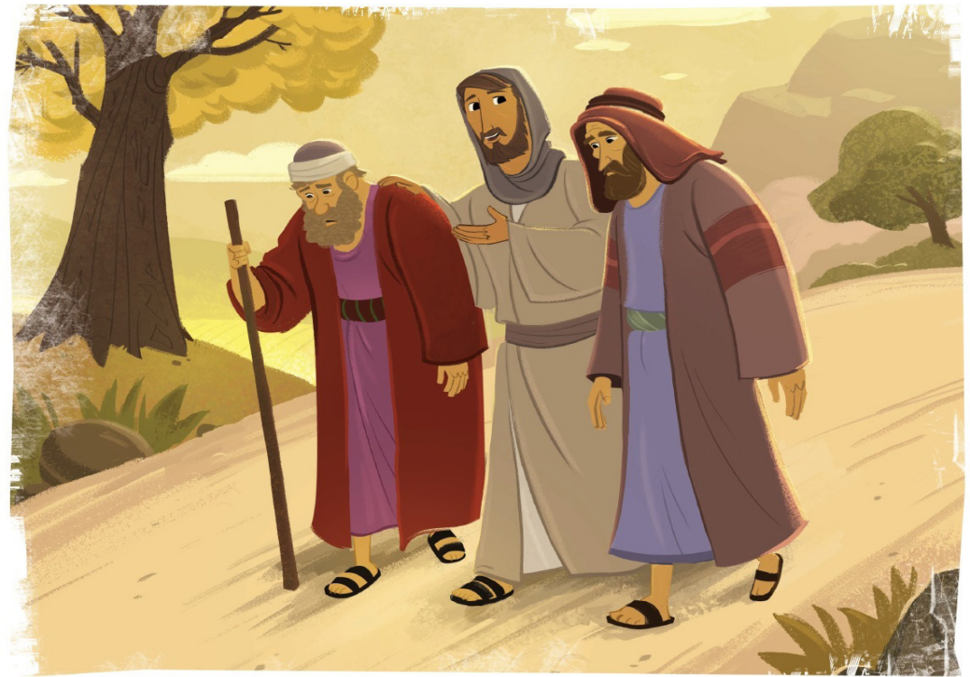
BUSCA LAS 7 DIFERENCIAS