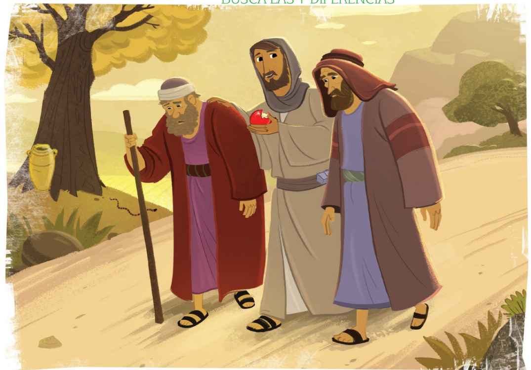
Delegaciones de Catequesis de Galicia

Empezando por la letra "M", salta siempre una letra y sabrás qué les dijo Jesús a los apóstoles para que supieran que era Él y no un espíritu lo que estaban viendo.