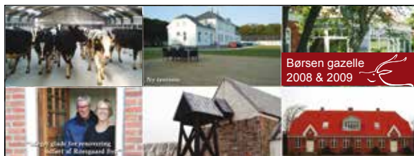
Børsen gazelle 2008 & 2009