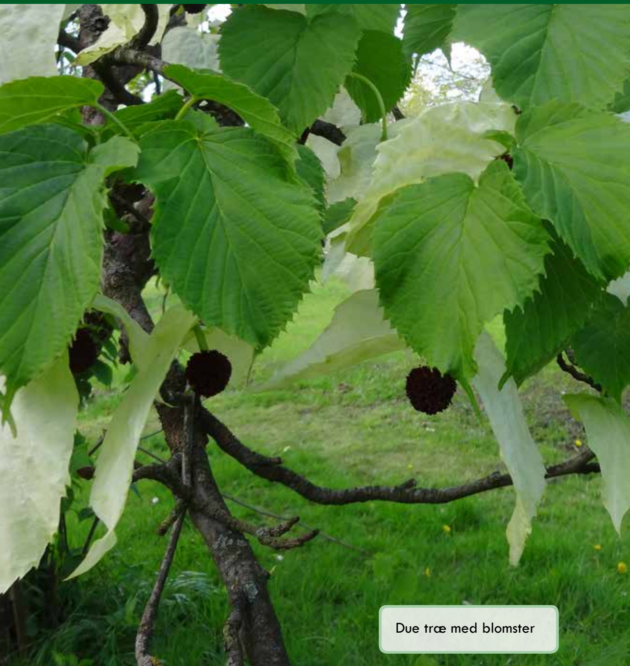
Due træe med blomster