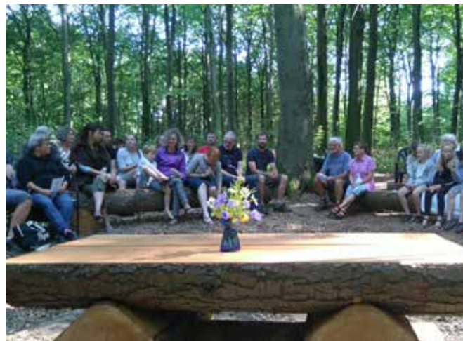
▲ Adslev Skovkirke.

Niels Weinreich, medlem af Ugerløse Kirkes menighedsråd og Ugerløse Lokalforum