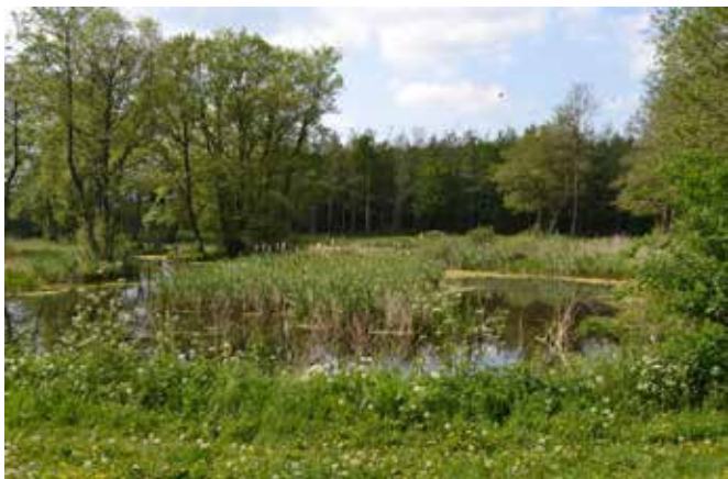
▲ Værslev Præsteskov.

ved blandt andet at dyrke 15-16 forskellige æblesorter. Graveren, som har været med til at anlægge frugthaven, kunne også godt tænke sig, at de forskellige æblesorter bruges som inspiration i gudstjenesten. Den alternative dyrkning giver ligeledes mulighed for at blive selvforsynende med gravbuketter. Den vilde kirkegård er en idé for kirker med få ressourcer.