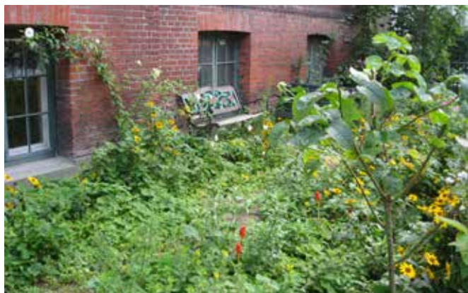
▲ Byhaven ved Sankt Matthæus Kirke, Vesterbro.

seniornetværk tilknyttet haven og at udbygge samarbejdet til børnehuset – i et tempo, hvor alle kan følge med.