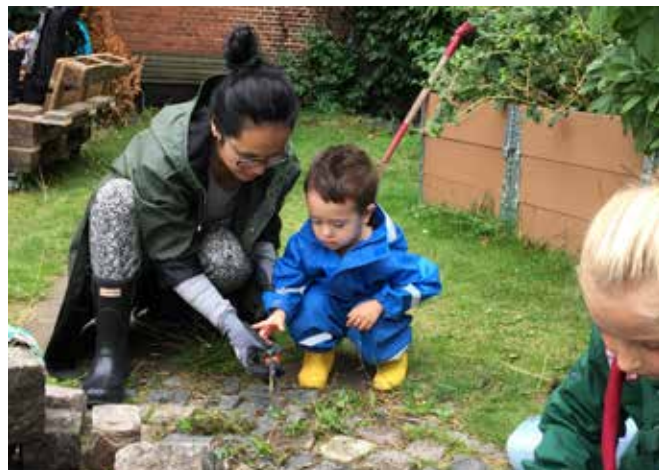
▲ Havedyrkning i Vesterbros Nabopark.

og hvad det kræver. Havedyrkning kan også betyde, at de får kontakt til kirkens ansatte eller frivillige.