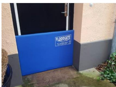
FLOODGATE - Sempel dørskot