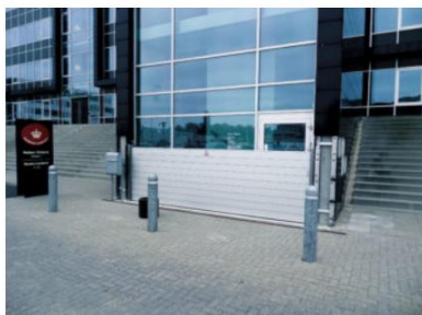
BLOBEL HDS / HAP - Bjælkebarriere