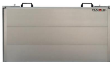
Rapid - Italiensk Kvalitet