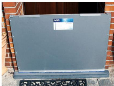
WHS - Magnetskot