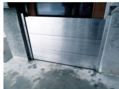
CARO WATERDOOR - Bjælkebarriere