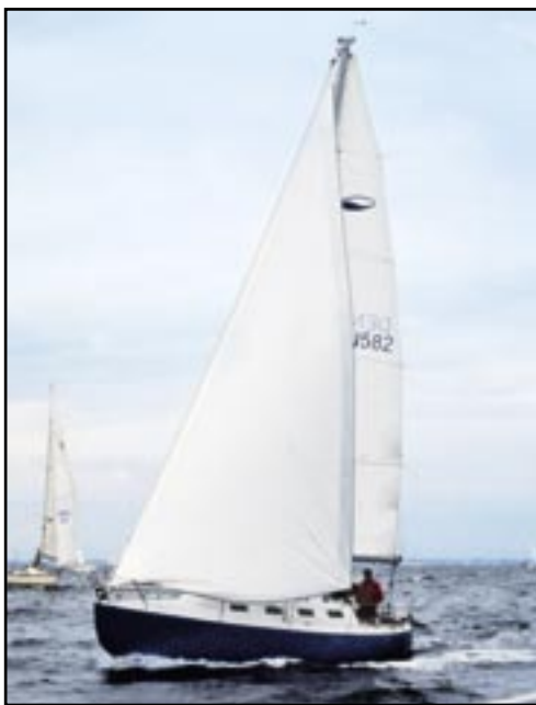
Den nyeste Grinde er delvis selvbygget i 2006. Den har gennemgående sejlpinde i standardrig, men båden var tæt på at få en højere mast som eksperiment.

BRUGTBÅDSPORTRÆT GRINDEN TEKST OG FOTO ANDERS HØEGH POST