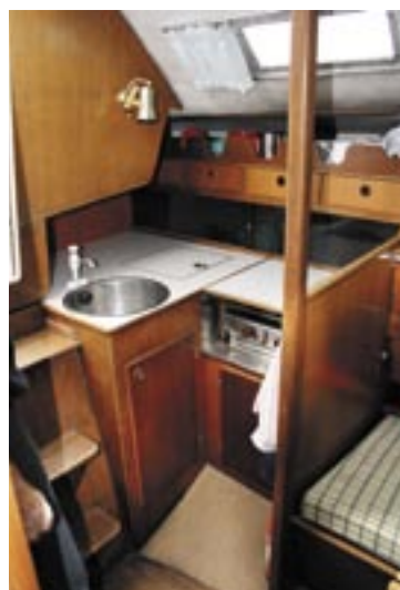
Pantry om bagbord med fødderne "op ad bakke" ved gasblussene. Gode stuverum, skuffer, kølerum og hylder.