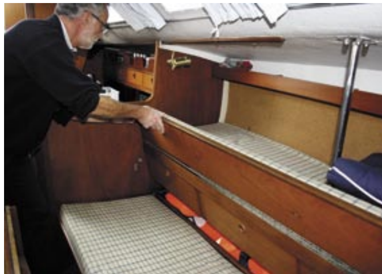
Med opslået ryglæn ses stuverum under overkøjen. Der er også stuverum under hovedkøjerne.