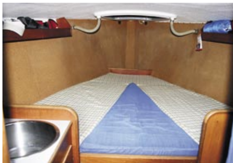
Forkahyttens skrogsider er som i kahytten beklædt med isolerende kork.