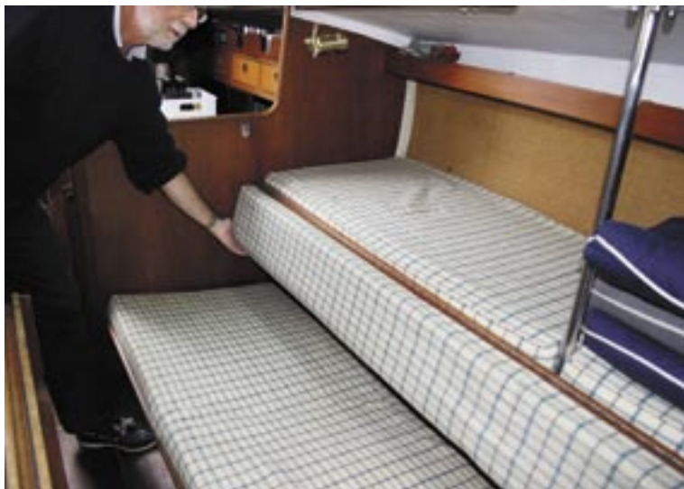
Underkøjlens ryglæn kan vippes op, så overkøjen får en behagelig sikring mod at falde ud.