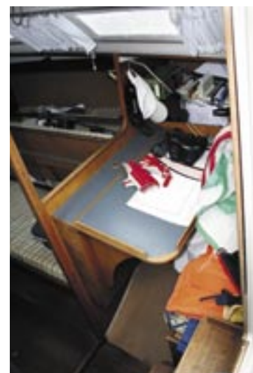
Kortbordet i styrbord. Bag det er sædet og en hundekøje fyldt med en spiller til aftenkapsejladsen.

Skrogets store bredde ligger i dækshøjde. Jeg har budt Grinden på meget hårde spilerskæringer, uden at den skar op."