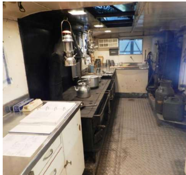
10 ton kokvagn med originalrecept på försvarets ärtsoppa uppsatt i köket.