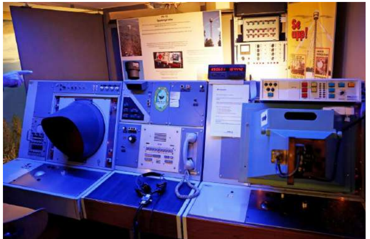
Lägeskartan från Gotlands Luftförsvarsundercentral och delar till PS-15.