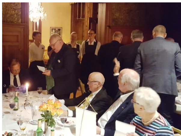
Kaffe med avec