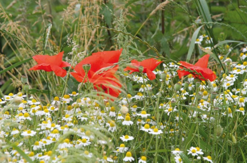
Bloemenpracht in het voorjaar