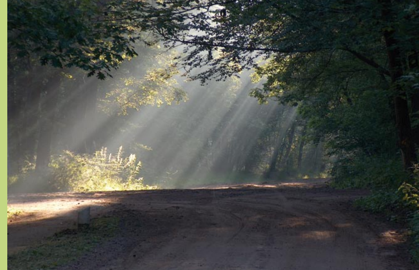
Zomerochtend bij Appel