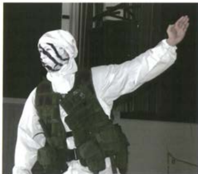
Spexet innehöll många färgstarka figurer