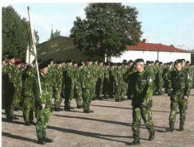
Regementschefen visiterar förbandet

Även 3. Komp har skickat ett antal soldater ur Teknisk pluton på centraliserad utbildning, dels till Försvarets Tekniska Skola (FMTS) i Halmstad och dels till Mekskolan på P 4. Dessa är åter vid T 2 först i mars månad.