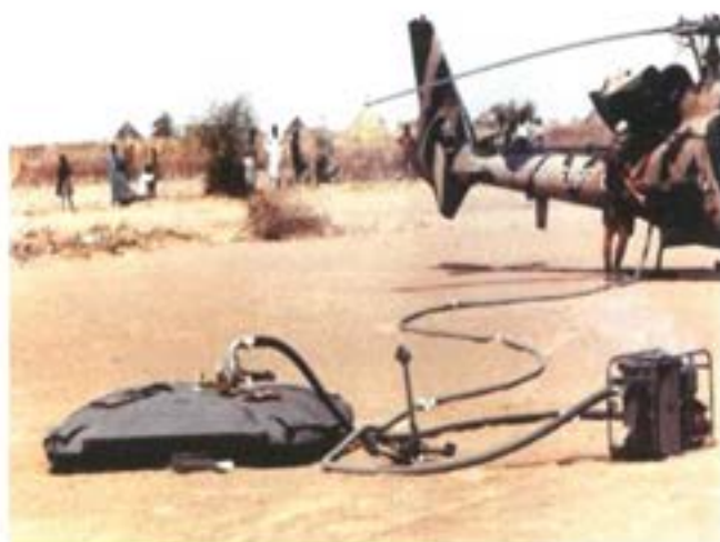
Överföring av bränsle från markbunden cistern

Vi arbetar nu med att utveckla LogBat/ny. Grundkonceptet är att den skall bestå av ett ledningskompani och tre logistikgrupper. Ledningskompaniet och två logistikgrupper utbildas tillsammans. Den 3:e logistikgruppen skall utbildas i samma utbildningsalternativ som marinen och flygvapnet. Utbildning av den 3:e logistikgruppen kan vi påbörja tidigast 2009, eftersom alla försvarsgrenar ligger i samma utbildningsrytm under 2008. Möjligheter att genomföra centraliserad utbildning bedömer vi dröjer till 2009.