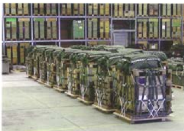
Färdigpackade pallar för fällning av last