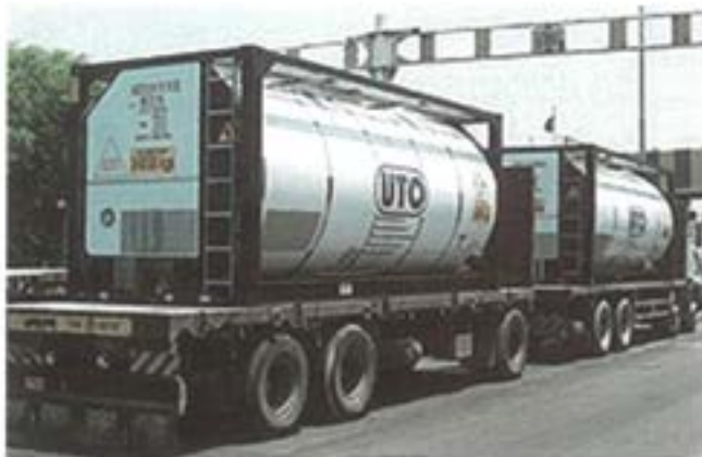
Civil förråds- och transportcontainer för drivmedel

Att vara en del av Nordic Battlegroup och de förbandsenheter som regementet ansvarar för ställer ett antal höga krav men samtidigt ges det utrymme för en motsvarande grad av utmaningar. Det är i detta sammanhang viktigt att påpeka att de uppgifter som förbanden skall utbildas, tränas, samövas och förberedas inför, innebär att ha en förmåga/kompetens att kunna möta ett varierande spektra av uppgifter. Uppgifter ska kunna genomföras i olika situationer, med tidspress och i miljöer som vi normalt inte är vana vid att agera inom. Detta är i sig en stor utmaning. Jag vill i sammanhanget särskilt poängtera de krav som kommer påverka alla befattningshavare i förbanden, både på den enskilda befattningshavaren som person (både fysiskt/psykiskt) och hans/hennes förmåga att hantera svåra situationer/omständigheter. Uppgifterna kan vara många och olikartade men det är allas uppgift att lösa dem, oavsett omfattning, komplexitet och tidsförhållanden.