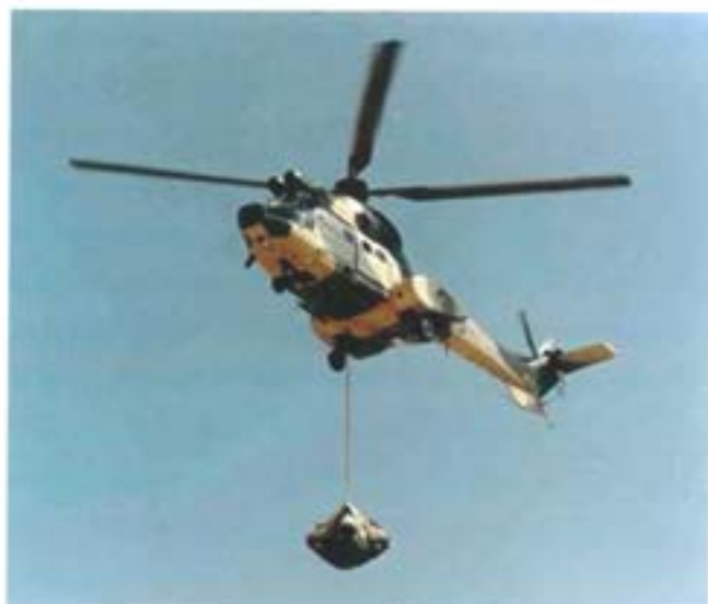
Transport av drivmedel

Arbetet med "Logbat NY" kommer att ta fart under 2007. Som uppdraget är formulerat nu så kommer vi att utveckla tre operativa/taktiska logistikbataljoner. Bataljonerna kommer på sikt att ersätta våra operativa underhållsförband och våra brigadunderhållsbataljoner. Bataljonerna kommer att fungera som "ramförband" för teknisk tjänst och hälso/sjukvårdsförmågor.