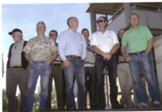
Studiebesök vid gamla T 2

1973 var det dags för krig igen. Inför den judiska storhelgen Yom-Kippur hade delar av den israeliska armén i Sinai fått permis och då gick egyptierna till anfall. Anfallet samordnades med syrierna som försökte ta tillbaka Golanhöjderna, vilket dock inte lyckades. Efter det vapenstillestånd som skrevs under efter ett par veckor delades Sinai-öknen mellan parterna. Egypten fick ett par mil, så de kunde öppna Suez-kanalen igen, och Israel resten. Parterna skulle skiljas av en buffertzona som bevakades av en FN-styrka och eftersom den skulle placeras mellan samma parter som förut blev namnet återigen UNEF, men för att markera skillnaden kallades den nya styrkan UNEF 2. FN-styrkan upplöstes efter fredsavtalet mellan Israel och Egypten 1979.