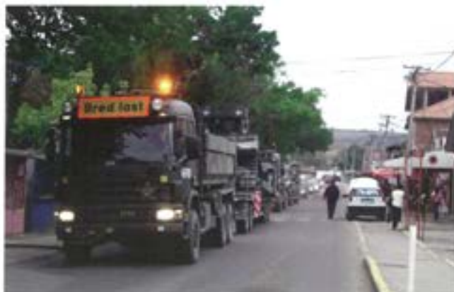
Konvoj på Pristinas gator

De dagar vi inte har så mycket att göra passar vi på att besöka olika delar av Kosovo. Vi har även besökt Skopje i Makedonien. För att höja stridsvärdet på förbandet har fältartisterna besökt oss under en vecka.