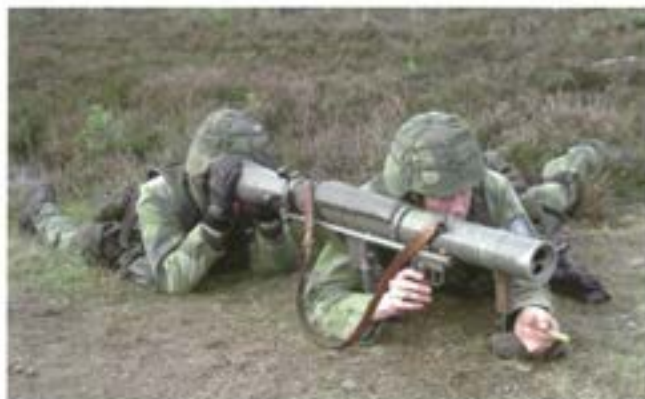
Skottställning av granatgeväret

Eskortplutonens huvudtjänst är strid. Under två veckor i höstas övade plutonen med granatgevär (Grg) och kulspruta (Ksp).