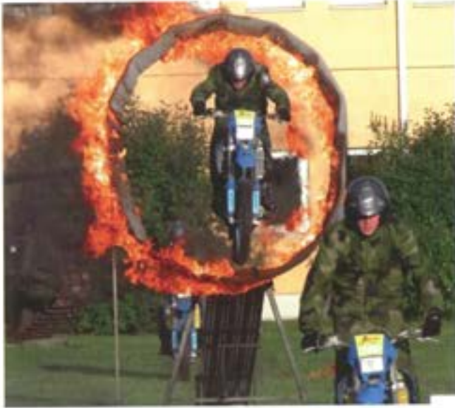
Arméns Lejon visar upp sig