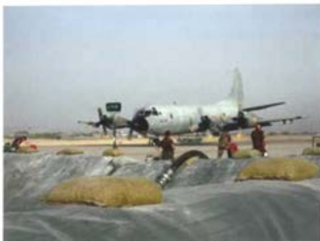
Överföring av drivmedel från Herkules till markbunden cistern

Inom förplägnadsområdet är utvecklingen att vi äter mer hållbara livsmedel än tidigare. Inom NBG förbereds soldaten att i minst 30 dagar leva på hållbara livsmedel som därefter kan förstärkas med andra livsmedel. Inom detta område har vi funnit att vi till del saknar förplägnadsmateriel som är "lättare" än vårt containerburna förplägnadssystem. Ett lättare system skulle