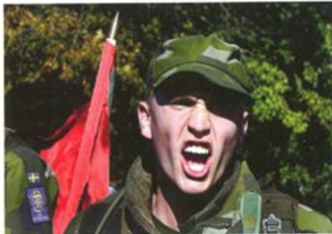
Segervrål efter vinst i värnpliktskampen