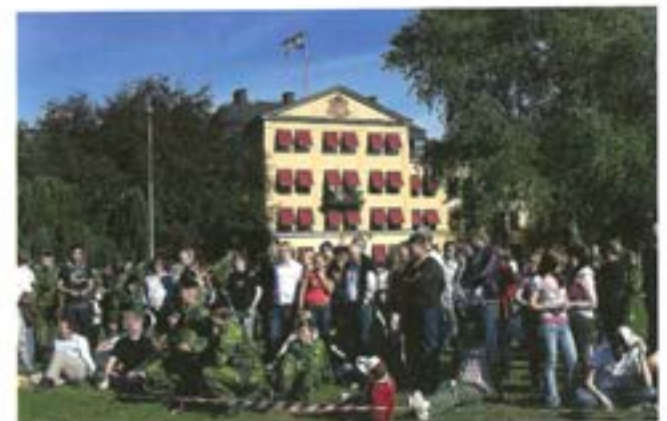
Storpublik på Heden, framför regementet