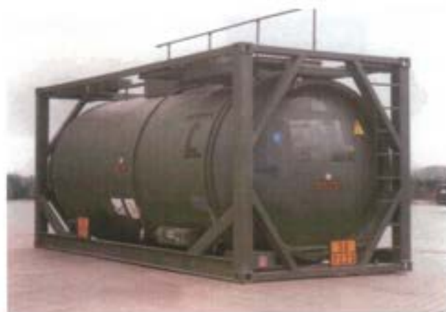
Förräds- och transportcontainer för drivmedel

innebära att vi skulle kunna flygtransportera det samma och att vi skulle kunna övergå till den "förplägnadsnivå" som befinner sig mellan frystorkat och färsklivsmedel. Detta skulle kunna bidra med högre näringsvärde och omväxling av kosten vid kortare insatser. Den nivån skulle kunna bli konserv, som vi tidigare haft, vilken innebär längre hållbarhet och bättre förutsättningar att hantera en god hygien och mindre behov av vatten och el m m.