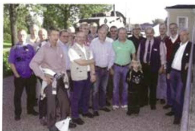
30-årsjubilerande 7.komp tillsammans med Transportpluton från FN-bataljon 64M, samlade utanför museet.

Dagen efter blev det resa in till stan för frukost på en lokal hamburgerbar för att sedan styra kosan hemåt igen. Återträffen blev väldigt uppskattad och jag vill ta detta tillfälle i akt att tacka alla som gjorde den möjlig. Framför allt T 2 och de befäl som jag där hade kontakt med, våra gamla befäl som kom till träffen och framförallt min bror utan vars hjälp det hela knappast gått att genomföra. Jag hoppas att det inte går 30 år igen innan vi ses.