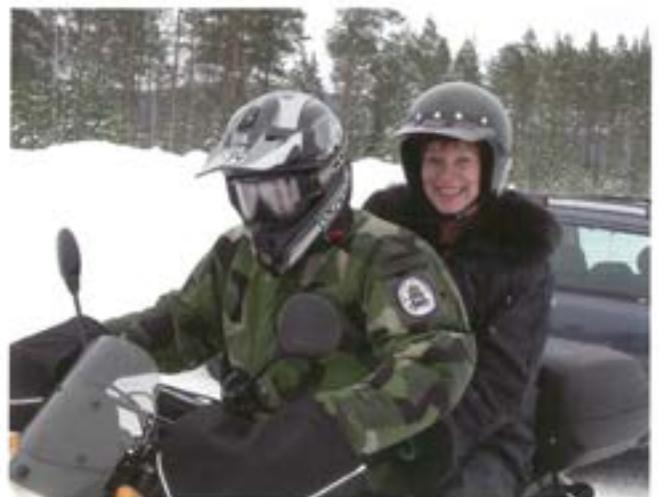
Fd Försvarsminister Leni Björklund på "bönpallen"

Skolan befinner sig nu i slutfasen av planeringen för 07/08, som innebär att kurser ska genomföras utifrån reviderade kursbeskrivningar och i en ny kursstruktur. Under 2007 inleds utbildning i ny kursstruktur för motorinstruktörer. 2008 fortsätter med ny militär trafiklärar- och inspektörutbildning och 2009 med nyskapad utbildning för trafiksäkerhetschefer. Det är en positiv utmaning för skolan att utveckla funktionen motortjänst in i framtiden, där viktiga inslag är harmonisering till FM ominriktning och förändrat utbildningssystem för officerare. Vi ser även stora möjligheter till samarbete i de internationella kontakter som skapades med flera andra motorskolor i Europa under ECRAF-mötet. Jag finner stor anledning att framföra ett stort TACK till all personal vid Motorskolan och alla ni andra som gjort det möjligt.