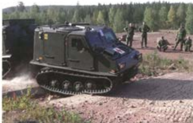
Instruktörskurs Bandvagn