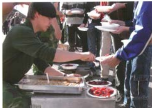
Alla bjöds på ärtsoppa och pannkakor