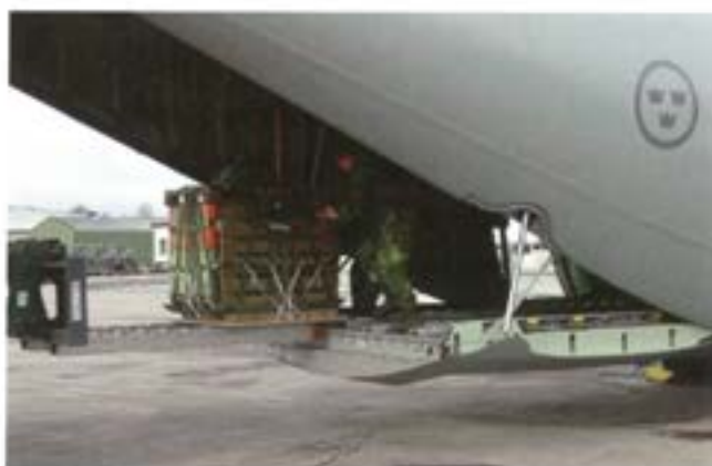
Lastning av pallar som ska fällas med skärm

Under 2007 kommer en förstudie att starta inom området flygburen försörjning/transport, vilken T 2 kommer att leda. Studien kommer att behandla hela området vad gäller transport av materiel i luften med bl a TP 84 och HKP. Arbetet kommer att inledas med en resa till USA för att studera området kring tung materielfällning med fallskärm. Inom materielfällningsområdet har vi startat ett bra samarbete med våra specialförband och Flygvapnet som sedan tidigare har god kompetens inom vissa områden. I det kortsiktiga perspektivet kommer vi inom ramen för våra slutövningar att genomföra fällning av förnödenheter för luftburen bataljon.