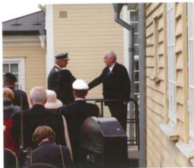
Kungaparet anländer till museet