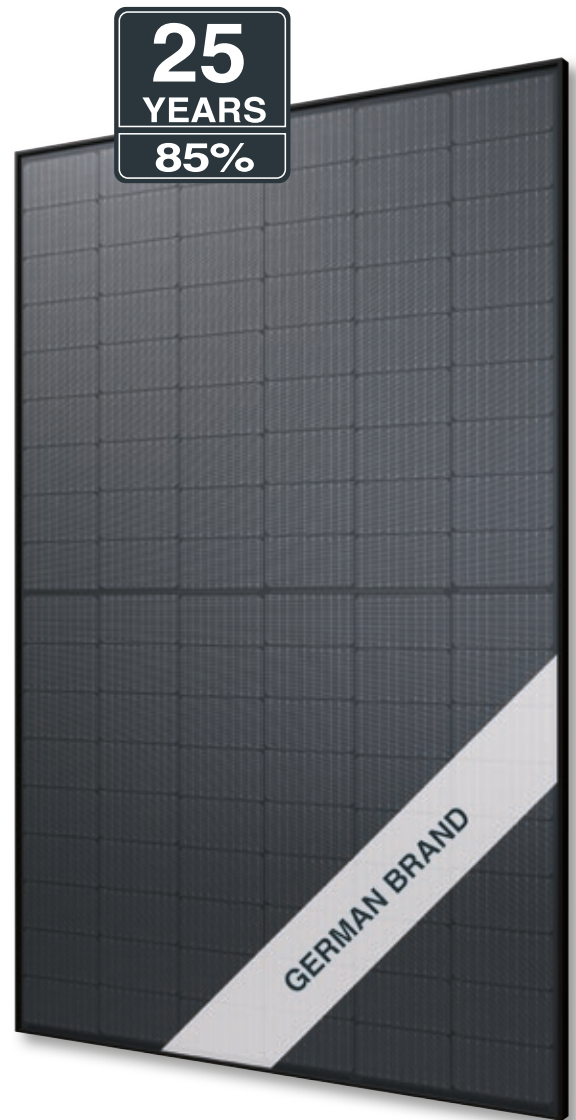
Abb. ähnlich 108MHDE220801A