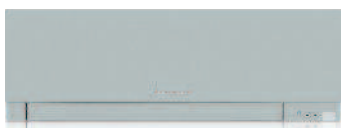
MSZ-EF VES - Silver