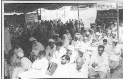
مریشاں اپنی باری کا انتظار کر رہے ہیں