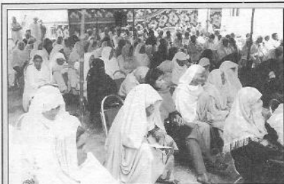
مریشاں اپنی باری کے انتظام میں بیٹھے ہیں