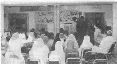
تقریب میں شرکاء