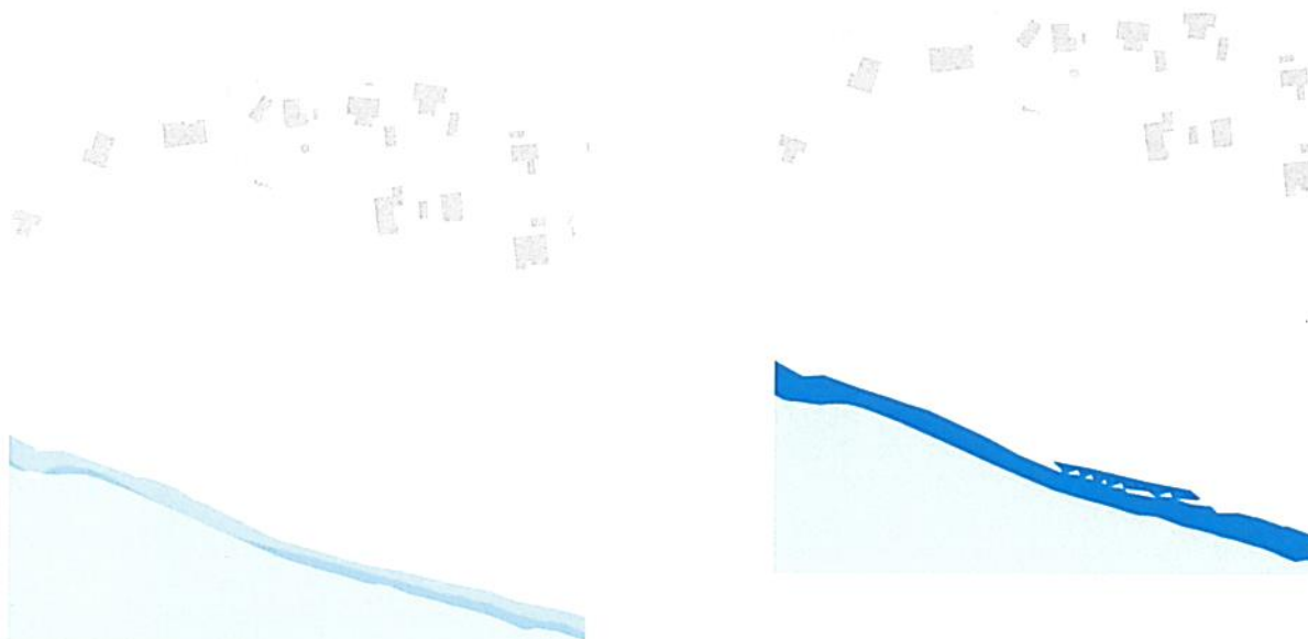
Vandstand efter en 20 års hændelse ved vandstandshøjde i 2013

Kommunen og Niras (vores rådgiver) anser det for sandsynligt, at kommunen vil imødekomme en ansøgning om ralfodring af det nedbrudte stykke af diget ved bådophalet.