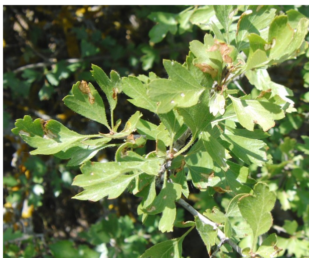
Frutos, porte del árbol y detalle de las hojas de el majuelo.

Hábitat: forma parte de espinares y bordes de bosques generalmente caducifolios, tanto de tipo centroeuropeo como mediterráneos (por ejemplo robledales de quejigo), aunque también puede aparecer en encinares húmedos.