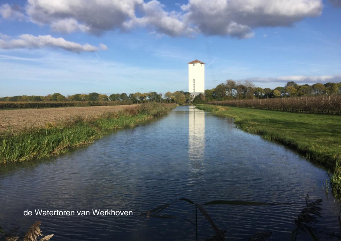
de Watertoren van Werkhoven