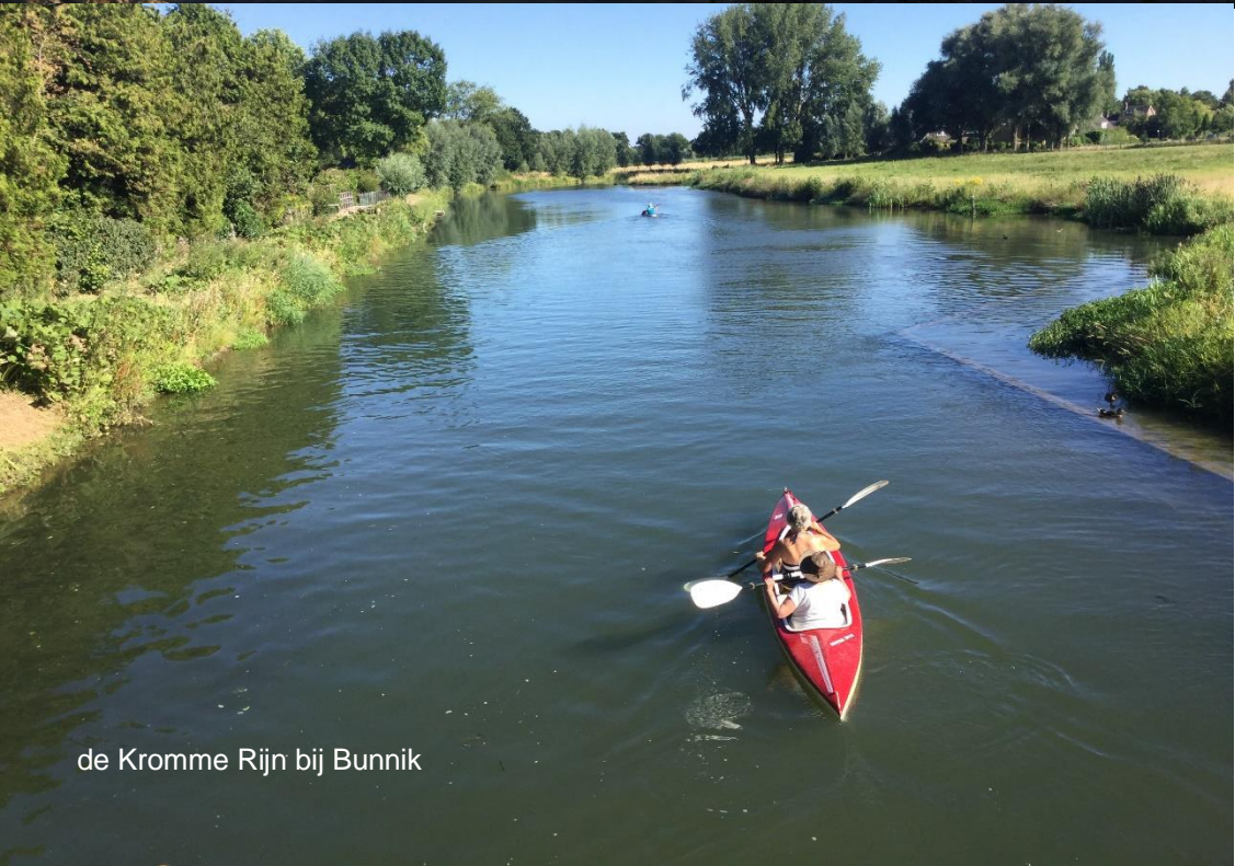
de Kromme Rijn bij Bunnik