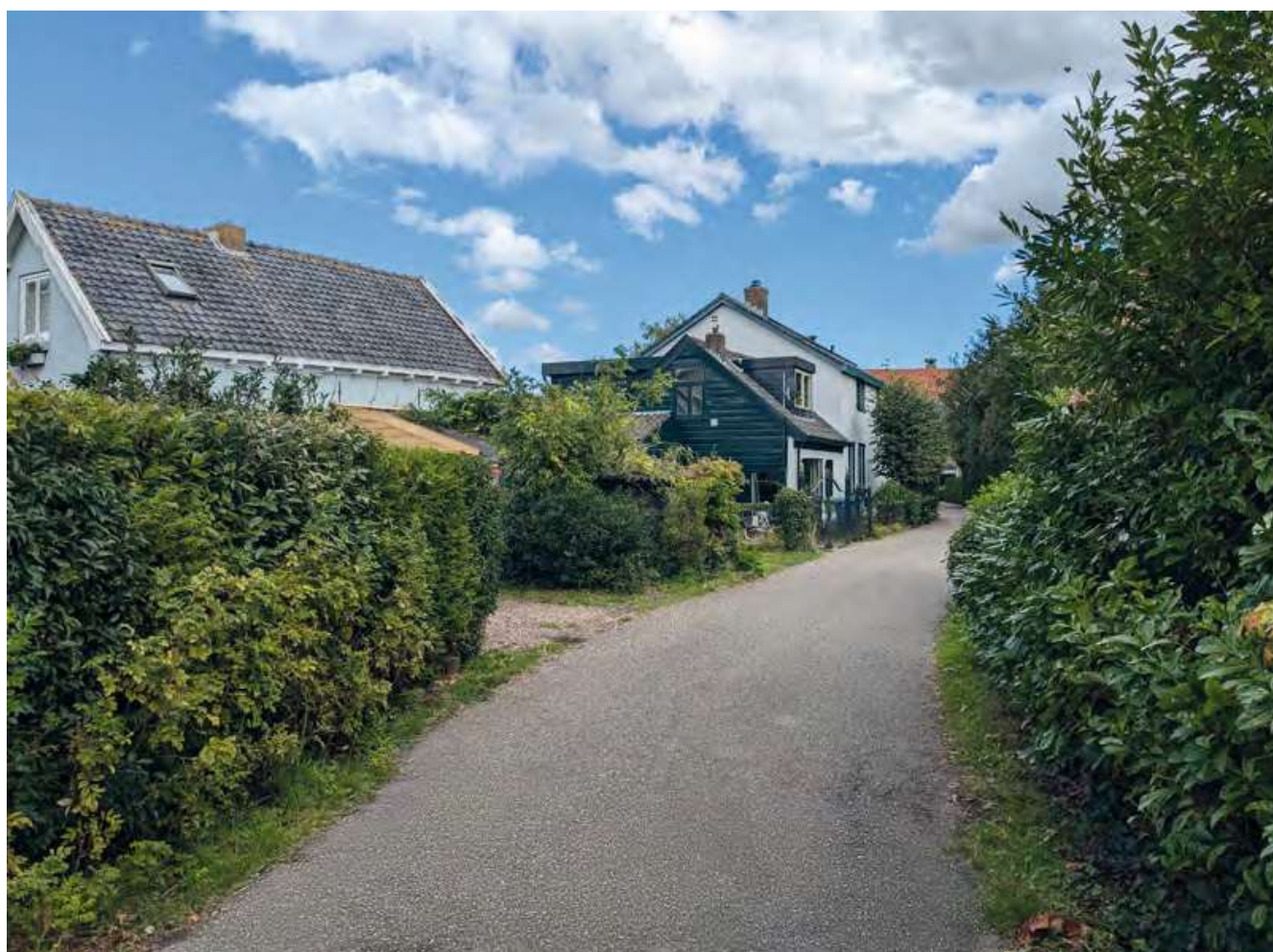
Hinderdam, historische bebouwing.

Naast de waterkering en tolheffing was Hinderdam ook een infrastructureel en militair knooppunt. Bij Hinderdam werd een tolbrug