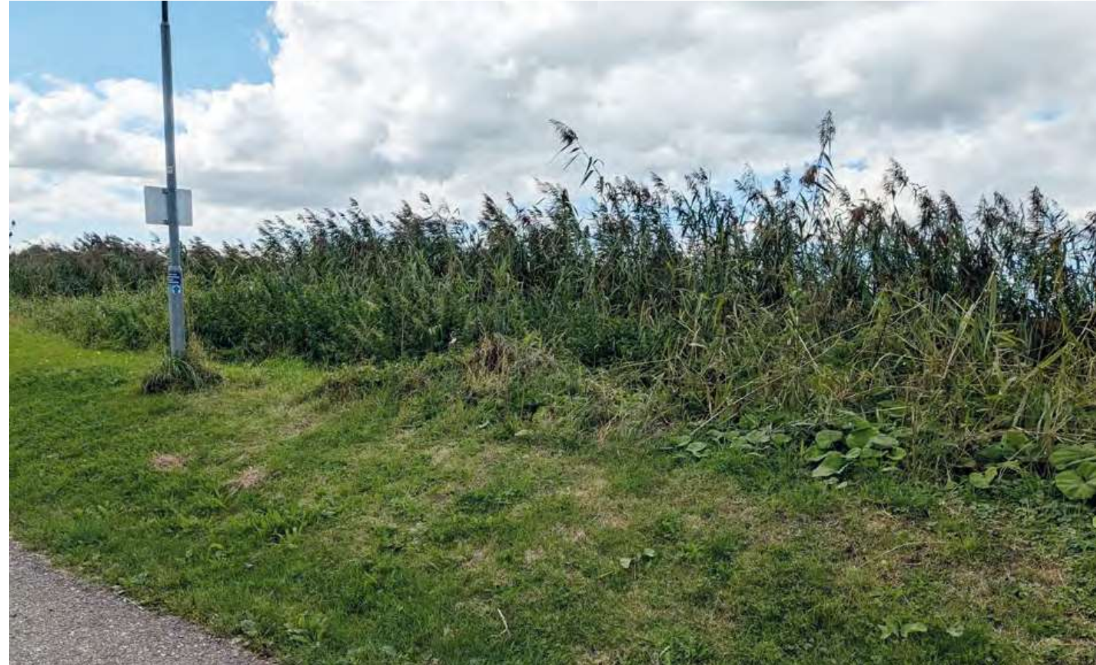
Restant oude schans aan de oever van de Vecht.