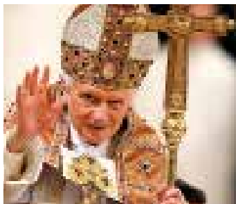
Både paven, Hitler og FN har været udnævnt til Antikrist.

og 23-24. Antikrist kunne også hedde Erstatningskrist. Det er en eller flere personer, kræfter eller strømninger, der fører sig frem som frelseren, men ikke er det.