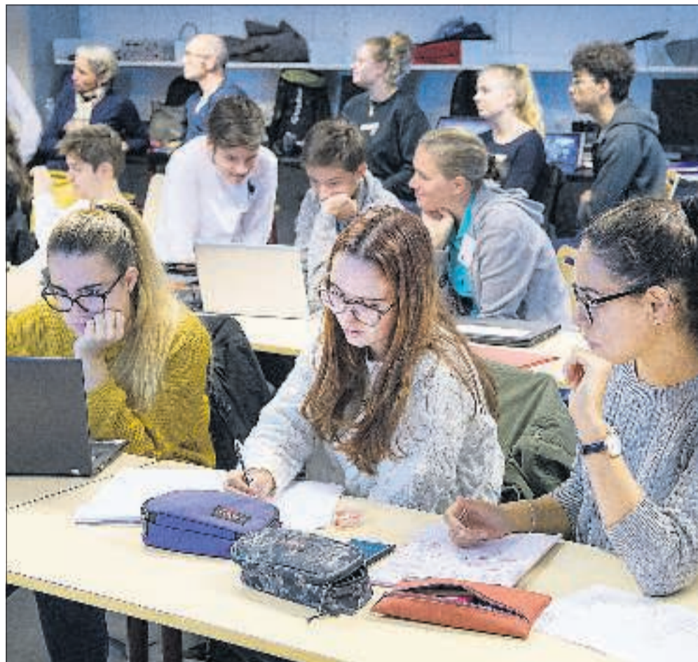
Der er stor forskel på, hvordan eleverne er vant til at modtage undervisning i deres hjemlande.