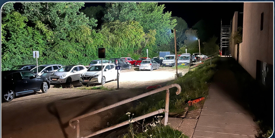
Stadion belysning på P-plads ved indkørsel A hele døgnet