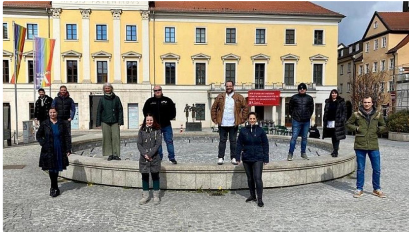
Ein teil des Teams von "Gastfreundschaft hilft Regensburg".

Erste Lockerungen der Ausgangsbeschränkungen sind seit Montag, 20. April, in Kraft. Weitere Lockerungen sind bereits in Sicht – eine Branche aber kann noch nicht abschätzen, wann es weiter geht: Die Gastronomie wartet immer noch auf ein positives Signal.