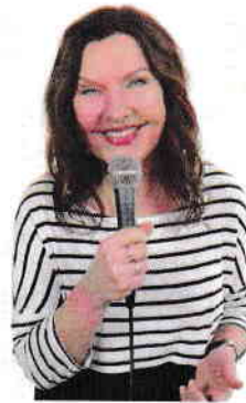
Anna-Lena Brundin Underhållare "Kvinnligt, manligt, mänskligt"