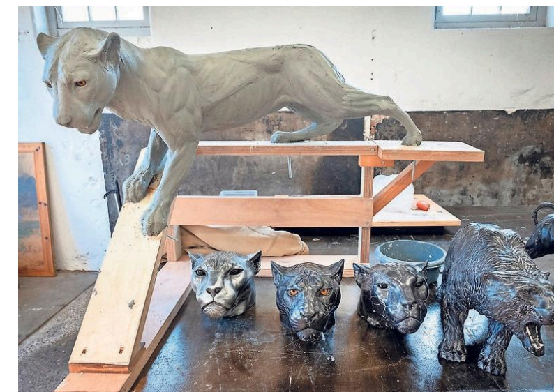
Beeld van een panter, particuliere opdracht.