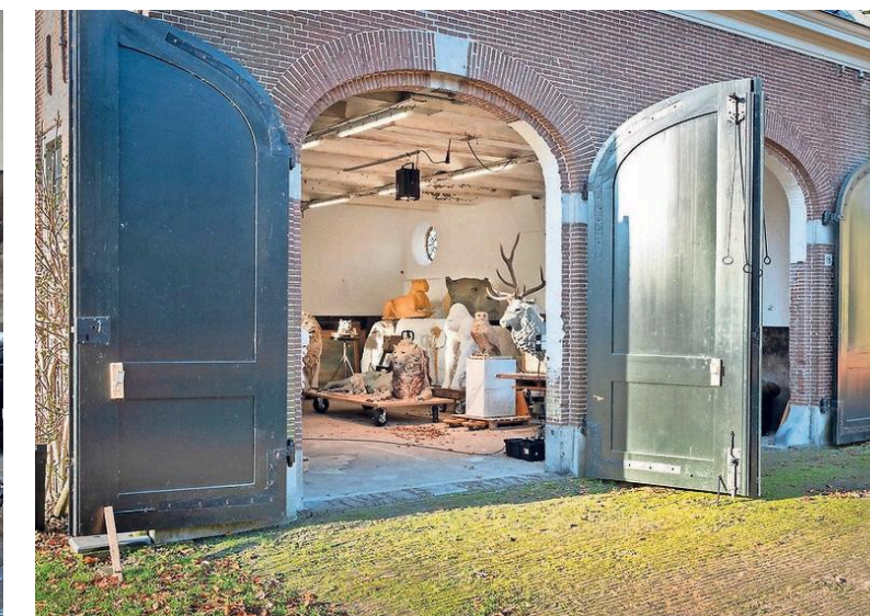
De deuren van het koetshuis staan uitnodigend open.