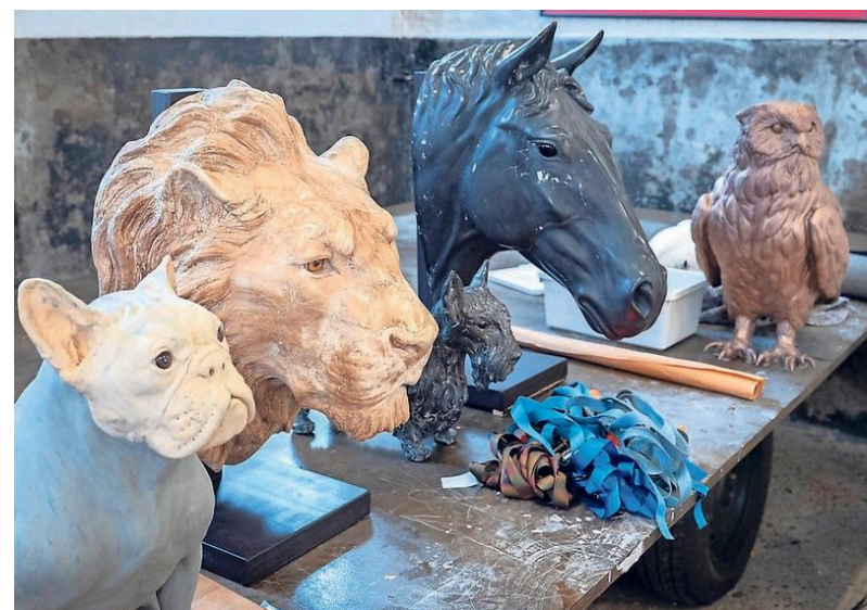
De bulldog van de buurman van Paul McCartney op de voorgrond.