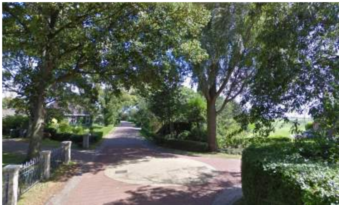
Figuur 6 - slecht zicht op verkeer van rechts (situatie Boerestreek-Sielandsreed)

Een aantal punten in Gaast worden als onveilig gezien. Dit heeft te maken met overzichtelijkheid van de wegen. Het gaat hierbij met name om de kruising Buren-Zeedijk en de kruising Boerestreek-Sielandsreed en Boerestreek-Zandlaan