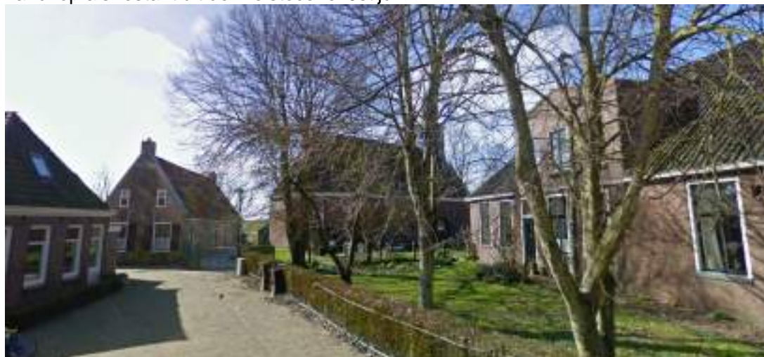
Figuur 13 - De Buren, oudste deel en kern van Gaast

Dit deel van Gaast ligt ook net iets hoger dan de rest van Gaast met als hoogste punt de Hervormde Kerk en kenmerkt zich door een zandige ondergrond. Waarschijnlijk een oude zandkop als restant uit de Pleistocene IJstijd.