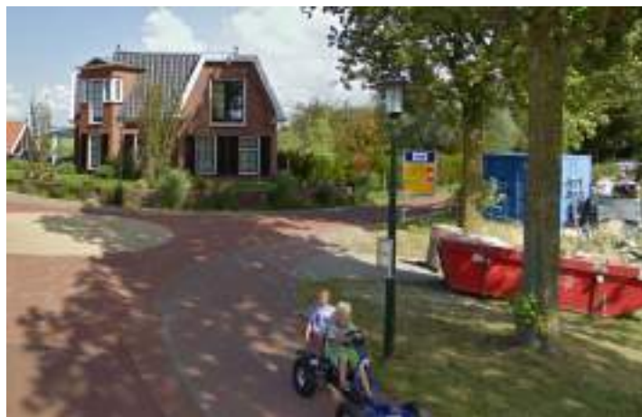
Figuur 7 - de bushalte van Gaast

Belangrijk is om dit voor de komende jaren te borgen