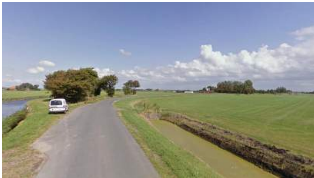
Figuur 5 - Enige passeerstrook op Boerestreek, een mogelijke oplossing

Algemeen zou gesteld kunnen worden dat het hoofdprobleem ligt in het niet aanwezig zijn van voldoende mogelijkheden elkaar te passeren. Indien dit zou worden opgelost is verbreding van de wegen niet noodzakelijk. Deze passeerhavens zouden dan wel op redelijke afstand van elkaar moeten liggen en het moet duidelijk zijn dat deze voorzieningen hiervoor zijn aangelegd zodat tegenliggers elkaar de gelegenheid kunnen bieden elkaar ook daadwerkelijk goed te laten passeren.