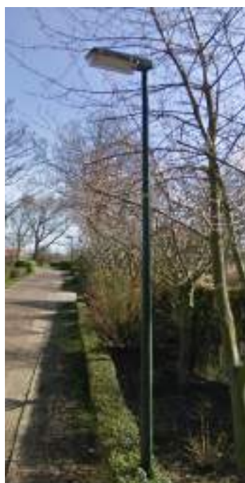
Figuur 19 - ongewenst type

Gekeken zou kunnen worden of de huidige lichtbronnen (zowel lampen als deeld armaturen) bij vervanging een sfeervollere variant zouden kunnen krijgen. Deze vorm zou beter bij de sfeer van het dorp passen. Uiteraard mag de veiligheid hierbij niet in het geding komen.