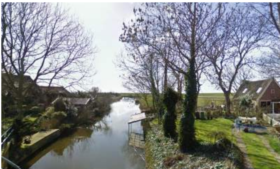
Figuur 18 - belangrijk landschapselement water