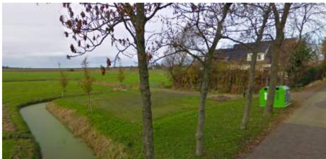
Figuur 3 - Voorbeeld parkeerplaats Idzegahuizum

Als voorbeeld hoe het zou kunnen wordt vaak genoemd de parkeerplaats in Idzegahuizum.