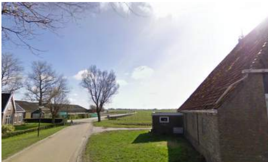
Figuur 17 - waarde uitzicht op landschap behouden (vanaf Sielandsreed richting Ferwoude)