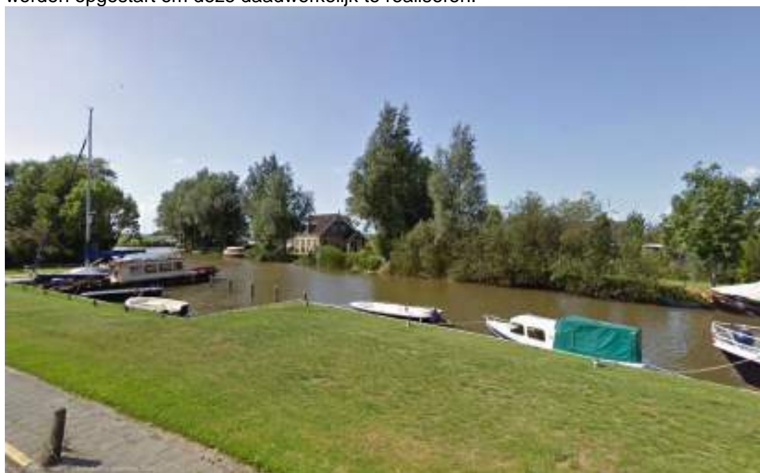
Figuur 10 - Voorbeeld aanlegsteiger (Tjerkwerd)

Dorpsbelang zou een onderzoek kunnen starten waarin wordt gekeken naar de mogelijkheden van een dergelijke aanlegsteiger en de locatie hiervan. Hieruit zou een concreet project kunnen worden opgestart om deze daadwerkelijk te realiseren.