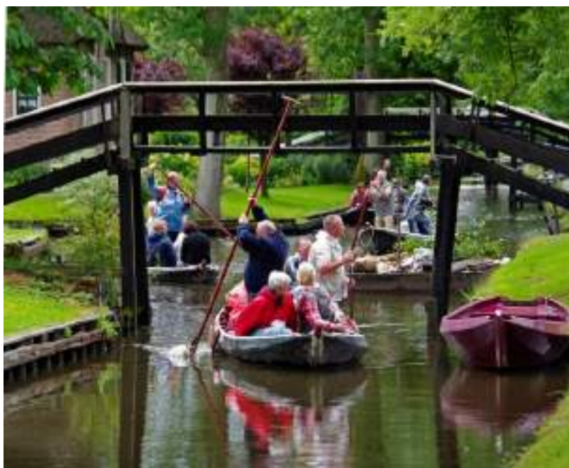
Figuur 11 - mogelijke brug Buren-Greiden

Op korte termijn dient gekeken te worden of het mogelijk is een dergelijke brug te realiseren.