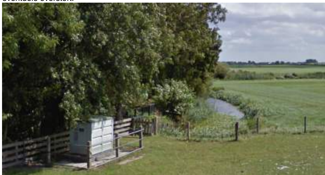
Figuur 15 - gemaal met sloot waarin wordt overgestort naast Ned. Hervormde kerk

Een oplossing moet gevonden worden in of het herlokaliseren van de overstort of het verbeteren van de doorstroom van de sloot. Doel is in beide gevallen gelijk....het voorkomen van overlast bij eventuele overstort.