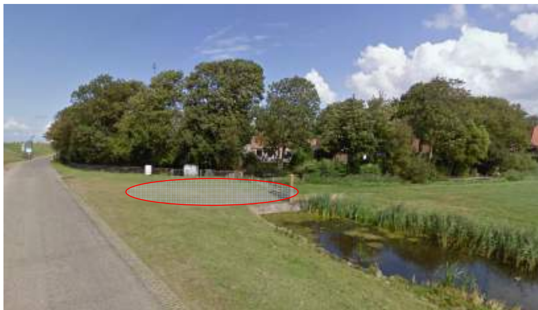
Figuur 2 - Mogelijke parkeervoorziening

Als voorbeeld hoe het zou kunnen wordt vaak genoemd de parkeerplaats in Idzegahuizum.