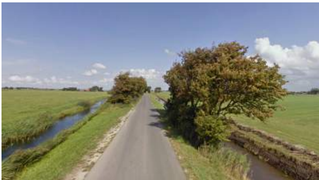
Figuur 16 - Kenmerkende meidoorns langs de Boerestreek

Een werkgroep zou een inventarisatie kunnen maken van een aantal kenmerkende elementen en hieraan beleid kunnen koppelen om deze elementen te behouden.