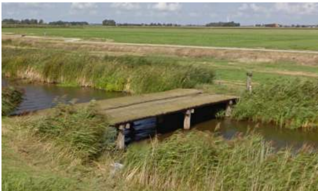
Figuur 9 - de brug van het Fryske Gea

De reden is dat deze brug, welke bestaat uit enkele bielzen om vee over te laten lopen, te laag is om onderdoor te varen of te schaatsen. Dit maakt het een enorme belemmering in de route naar Ferwoude-Workum.