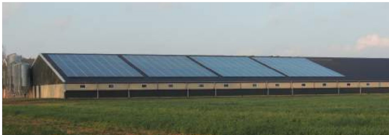
Figuur 8 - optie: gezamenlijke zonnepanelen op schuur

Eén van de te onderzoeken mogelijkheden zou bijvoorbeeld kunnen bestaan uit het gezamenlijk bedekken van een boerenschuur (groot oppervlak) met zonnecollectoren.