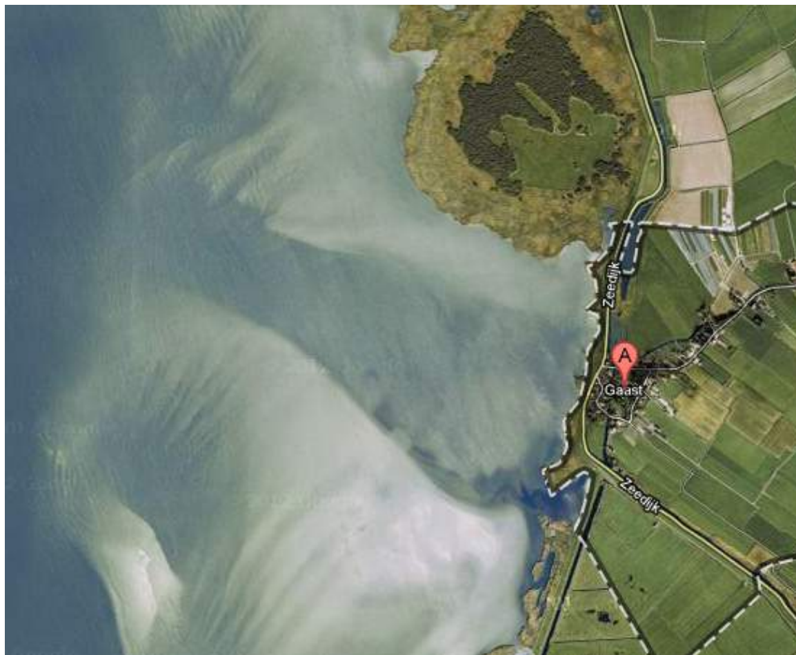
Figuur 12 - Waterkaart Gaast

Gekeken kan worden in hoeverre het IJsselmeer deels kan worden uitgediept zodat boten weer naar de kust van Gaast kunnen varen. Daarnaast moet geborgd worden dat de vaargeul behouden blijft.