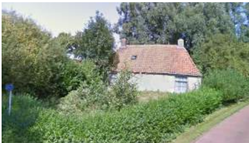
Figuur 14 - verpaupering hoek Zandlaan-Boerestreek

Een bijkomend effect is de negatieve uitstraling om de belenende percelen en omgeving. Immers, het zal de verkoop van direct aangelegen panden bemoeilijken.