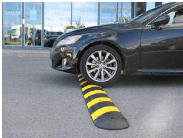
Figuur 4 - Verkeersremmende maatregelen

Echter, de opties dienen samen met een verkeerskundige te worden onderzocht op mogelijkheden.