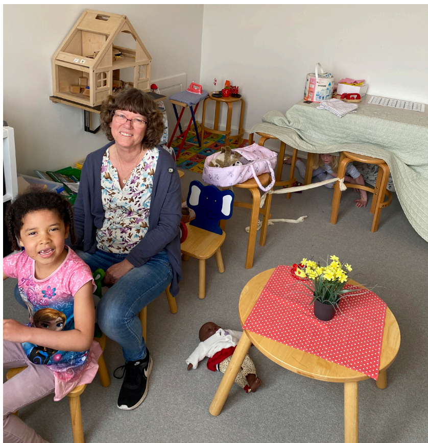
På tur i snakkeskolens bus.