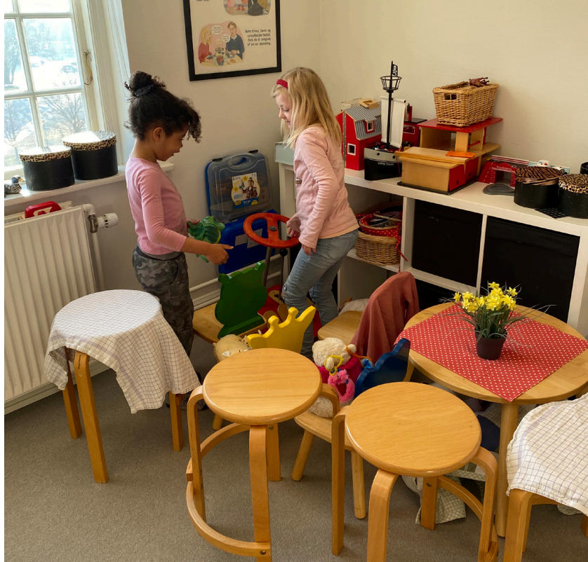
Pigerne er gået i gang med en busleg på egen hånd, uden mig.

Efter nogen tid begynder jeg at arbejde på at kæde børnene sammen, så de får øje for hinanden og kan bruge hinanden til noget, få lyst og redskaber til at være i fællesskabet. Jeg prøver altid at gøre børnene opmærksomme på hinanden ved at sætte tydeligt ord på dem og bruge deres navne. Jeg bliver nødt til at være den igangsættende, som kæder deres leg sammen. Her har jeg et kanonredskab - et rat - det bliver ofte til en bus, en ambulance mv. Når vi leger bus, er der altid nogle børn, der gerne vil være chauffør, og nogle ved, hvor vi skal køre hen, fx til svømmehallen. Når et barn giver udtryk for det, prøver jeg altid at lave det til en fælles tur, så kan vi alle tage i svømmehallen, og bagefter måske tage hen til den restaurant, hvor