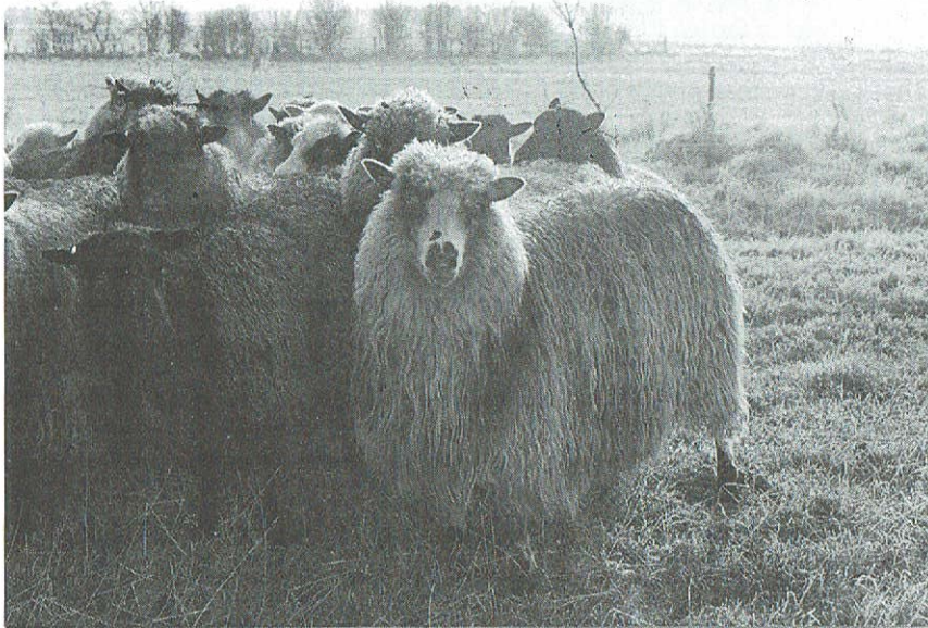
Spælsau og en enkelt gotlænder

Af kropsbygning er spælsau rummelig med stor vomkapacitet og med lette ben. Den er noget kort i kroppen. Kødfylden er ikke speciel god. For at rette på dette, blev der efter 1. verdenskrig indført en del væddere fra Færøerne og Island. Dette førte til en vis forøgelse i størrelsen, men hvorvidt det hjalp noget væsentligt på kødsætningen, er vanskeligt at sige. I begyndelsen af 70'erne blev der foretaget en ny ondkrydsning med sæd fra islandske væddere. Hensigten med dette varogså denne gang at forbedre slagtekvaliteten. Men samtidig fik man anlæg for farvede hår i hvide uldpelse ind. Dette er en fejl, som man har gjort meget for at få bort. Det samme gælder dyr som har uld med højt margindhold, og ligeså dyr som har anlæg