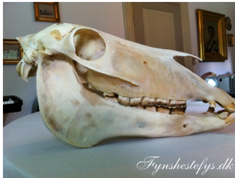
Krybbebider med voldsomme tandkroge og trappebid.